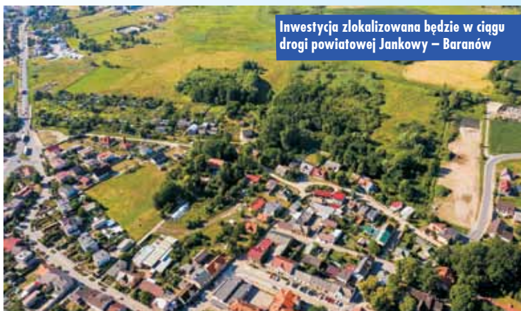
Inwestycja zlokalizowana będzie w ciągu drogi powiatowej Jankowy – Baranów

nią o szerokości 6 m oraz dwustronnej drogi rowerowej o szerokości 2,5 m