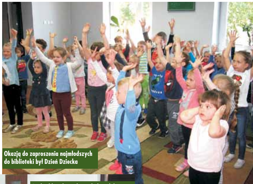
Okazją do zaproszenia najmłodszych do biblioteki był Dzień Dziecka

Przedszkolaki, które licznie stawiły się w bibliotece, obejrzały adaptację znanej bajki opowiadającej o pajacu wystruganym z drewna, który ciągle wpada w kłopoty, kłamie i przysparza swemu ojcu wielu zmartwień. Koniec końców udaje mu się poprawić i zmienić swoje zachowa-