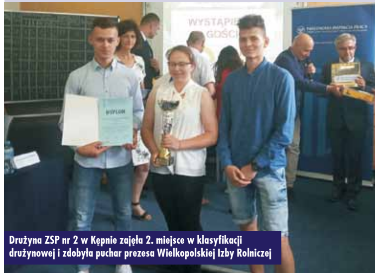
Drużyna ZSP nr 2 w Kępnie zajęła 2. miejsce w klasyfikacji drużynowej i zdobyła puchar prezesa Wielkopolskiej Izby Rolniczej

widowości i usterki odnoszące się do znajdującego się tam sprzętu rolniczego: przyczepy rolniczej, ciągnika rolniczego i zagregowanego z nim rozrzutnika obornika, kosiarzki rotacyjnej oraz ciągnika rolniczego opryskiwacza zawieszanego. Na kolejnych czterech stanowiskach w pracowniach Zespołu Szkół Przyrodniczo-Biznesowych w Tarcach należało wykonać zadania dotyczące m.in.: przygotowania drabiny rozstawnej do pracy, postępowania po rozlaniu środków ochrony roślin przed ich zastosowaniem w praktyce oraz przygo-