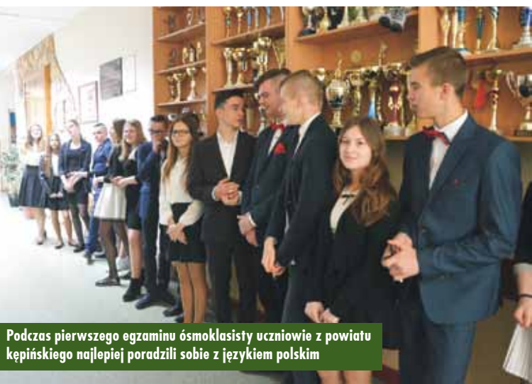
Podczas pierwszego egzaminu ósmoklasisty uczniowie z powiatu kępińskiego najlepiej poradzili sobie z językiem polskim

Wielkim Buczku (73,50%), która przekroczyła średnie nie tylko powiatu kępińskiego, ale też okręgu, województwa i kraju. Z kolei najniższy średni wynik odnotowano w gminie Baranów (58,70%). Co ciekawe, tylko tam wynik szkoły stanowi zarazem wynik gminy, ponieważ wszyscy uczniowie z innych szkół podstawowych kończą edukację w jednej placówce – Szkole Podstawowej w Mroczeniu. Na drugim miejscu wśród przedmiotów, z którymi najlepiej poradzili sobie ósmoklasiści, uplasował się język obcy nowożytny, z którym uczniowie w powiecie poradzili sobie bardzo dobrze. Test z języka angielskiego napisali, osiągając średnią 50,80%. Choć uczniom z naszego powiatu nie udało się prześcignąć średniej okręgu (56,68%), województwa (56,28%) i kraju (59%), osiągnęli oni jednak wynik wyższy niż uczniowie