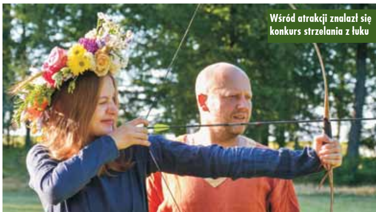
Wśród atrakcji znalazł się konkurs strzelania z łuku

ści. Jednocześnie wiele jest świąt pogańskich, które pojawiają się także w kulturach innych krajów. Przykładem jest noc świętojańska, inaczej zwana nocą kupały. Według tradycji słowiańskiej było to święto wody, ognia i miłości. Wzrost popularności ludowych przekazów, folkloru i tradycji powoduje, że dawne obrzędy wracają do łask. Coraz częściej w polskich miastach pojawiają się obchody nawiązujące do tradycyjnych rytuałów, jak chociażby wskrzeszona przez gminę Baranów przed rokiem „Donaborowska noc świętojańska”. I tym