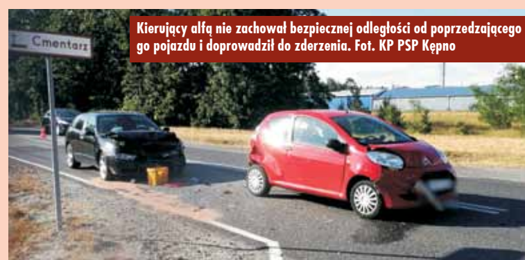
Kierujący alfą nie zachował bezpiecznej odległości od poprzedzającego go pojazdu i doprowadził do zderzenia.

Wszyscy uczestnicy zdarzenia byli trzeźwi. Sprawcę ukarano mandatem karnym. Oprac. KR