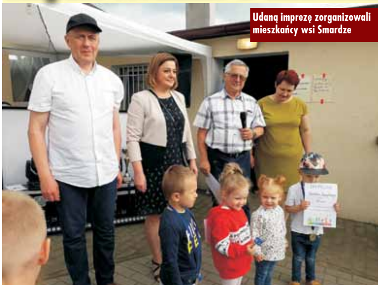
Udaną imprezę zorganizowali mieszkańcy wsi Smardze

Zorganizowana w Smardzach impreza dla całych rodzin połączona została z grami i zabawami sprawnościowymi.