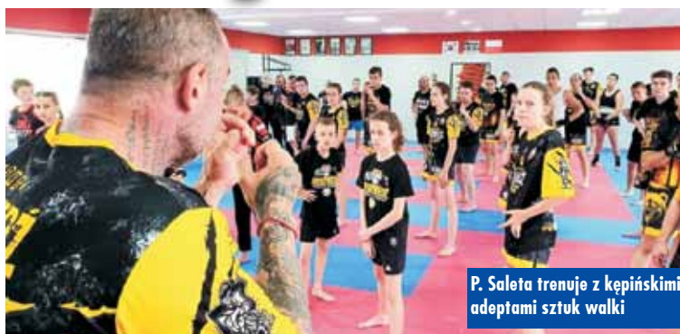
P. Saleta trenuje z kępińskimi adeptami sztuk walki