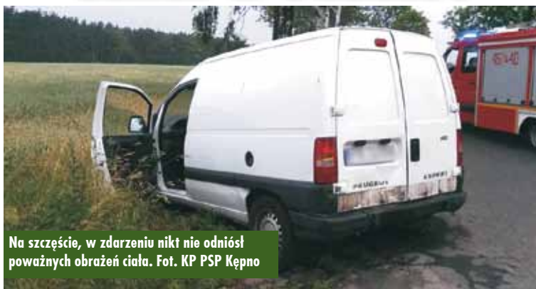
Na szczęście, w zdarzeniu nikt nie odniósł poważnych obrażeń ciała.

16 czerwca br., około godziny 5.04, do Stanowiska Kierowania Komendanta Powiatowego Państwowej Straży Pożarnej w Kępnie wpłynęło zgłoszenie o kolizji dwóch samochodów osobowych w Szklarcie Mielęckiej. Do zdarzenia zadysponowano zastępy z Jednostki Ratowniczo-Gaśniczej w Kępnie. - Działania strażaków polegały na zabezpieczeniu miejsca zdarzenia, kierowaniu ru-