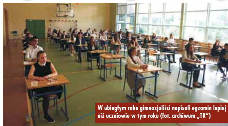
W ubiegłym roku gimnazjaliści napisali egzamin lepiej niż uczniowie w tym roku

Na egzaminie z historii i wiedzy o społeczeństwie średni wynik uzyskany przez uczniów to 59 procent punktów, w naszym województwie średnia ta jest o 1 procent niższa, w powiecie kępińskim 56,68. Za zadania z przedmiotów przyrodniczych uczniowie otrzymali średnio 49 proc. punktów, a w powiecie – 49,54.