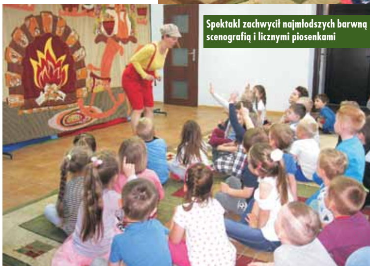
Spektakl zachwylił najmłodszych barwną scenografią i licznymi piosenkami

nie, za co dobra wróżka nagradza go i zmienia w prawdziwego chłopca.