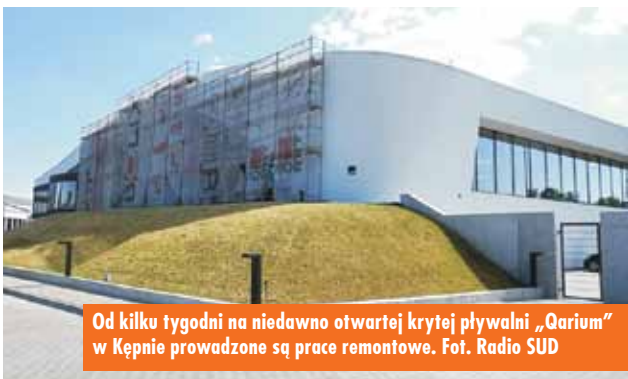
Od kilku tygodni na niedawno otwartej krytej pływalni „Quarium” w Kępnie prowadzone są prace remontowe.

są wyższe niż dotychczas. – Ceny pójda w górę. Wszystko się zmienia, życie nam drożeje, koszty energii idą w górę (...). Musimy skądś czerpać przychody. Nie możemy sobie pozwolić na status quo – zaznaczył P. Psikus. Basen będzie czynny w godzinach od 10.00 do 18.00 od poniedziałku do niedzieli. Za bilet normalny trzeba będzie zapłacić 10 zł od osoby za dzień, za ulgowy – 7 zł, a