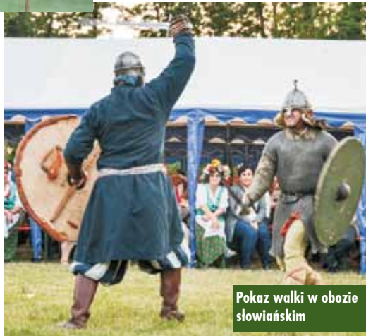
Pokaz walki w obozie słowiańskim

i zabawnie. Niestety, nie dopisała donaborowska publiczność. Na palcach obu rąk można było policzyć tych, których zainteresowała muzyka (aż dziewięć zespołów: „Ale Babki” z Bralin, „Doruchowanie”, „Echo” z Łęki Opatowskiej, „Słupianie”, „Harmonia” z Grabowa, „Laskowanie”, „Perzowanie”, „Do-