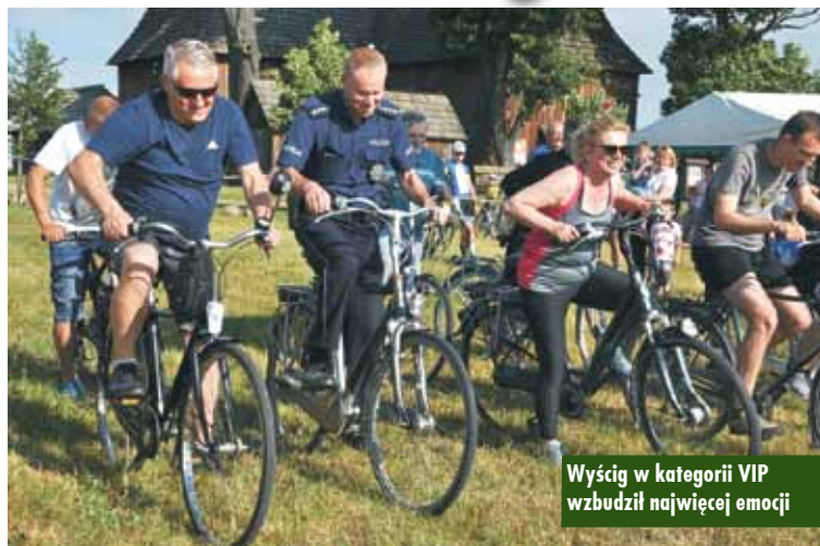
Wyścig w kategorii VIP wzbudził najwięcej emocji

IX edycja Bralińskiego Crossu Rowerowego im. Jana Lisowskiego