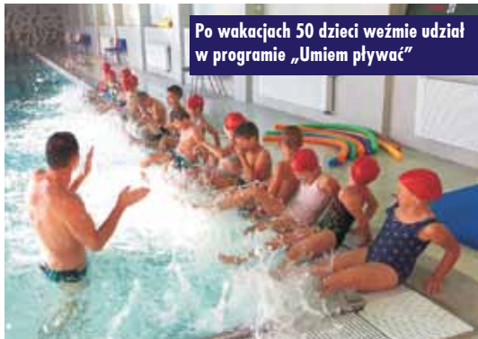
Po wakacjach 50 dzieci weźmie udział w programie „Umiem pływać”

przystąpi do udziału w powszechnej nauce pływania „Umiem pływać”.