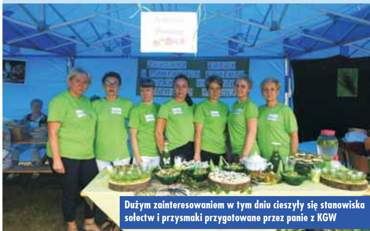
Dużym zainteresowaniem w tym dniu cieszyły się stanowiska sołectw i przysmaki przygotowane przez panie z KGW

Ostatnim punktem wieczoru był występ zespołu „Enjoy” oraz zabawa taneczna pod chmurką. Oprac. bem