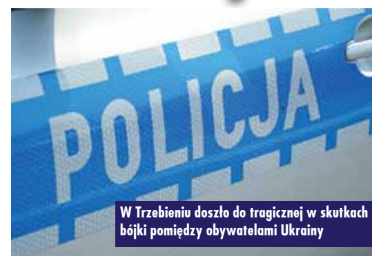
W Trzebieńcu doszło do tragicznej w skutkach bójki pomiędzy obywatelami Ukrainy

Zdarzenie na drodze krajowej nr 11 w Klinach