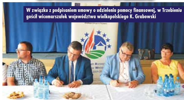
W związku z podpisaniem umowy o udzieleniu pomocy finansowej, w Trzebieiniu gościł wicemarszałek województwa wielkopolskiego K. Grabowski

13 czerwca br. gminę Łęka Opatowska odwiedził wicemarszałek województwa wielkopolskiego Krzysztof Grabowski. Wizyta związana była z podpisaniem umowy dotyczącej dofinansowania realizacji zadania pt. „Rozbudowa z przebudową budynku OSP w Trzebieiniu na kuchnię cateringową z remizą oraz zmiana sposobu użytkowania części budynku OSP w Trzebieiniu na zaplecze sanitarne”.