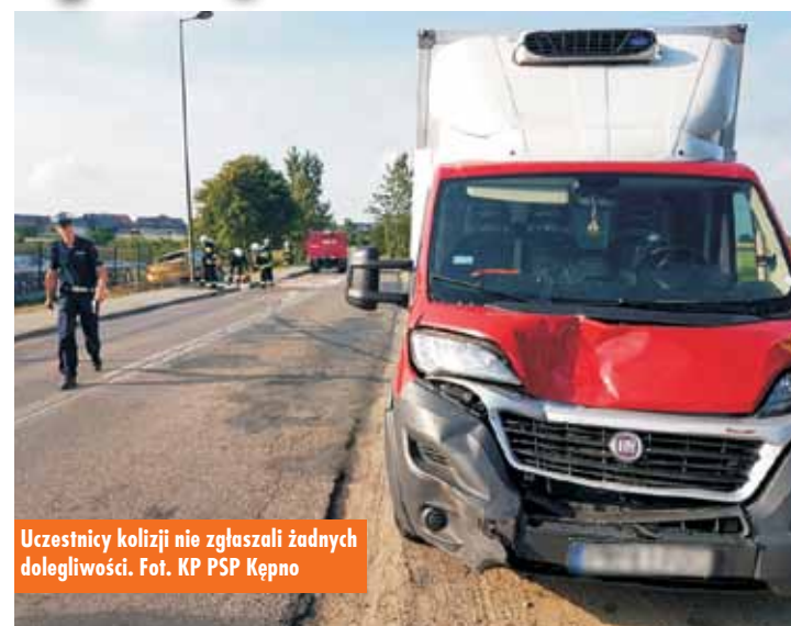
Uczestnicy kolizji nie zgłaszali żadnych dolegliwości.

Kolizja na drodze nr 482 („stara ósemka”) w Mianowicach