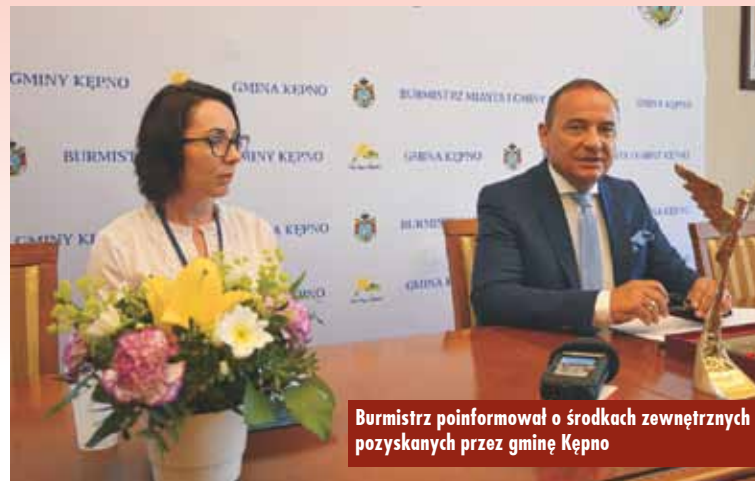
Burmistrz poinformował o środkach zewnętrznych pozyskanych przez gminę Kępno

laksu, położona przy ul. Szpitalnej, zostanie umiejscowiona przy istniejącym już placu zabaw. Zostanie wyposażona w urządzenia dostosowane do potrzeb osób niepełnosprawnych, w tym jeżdżących na wózkach in-