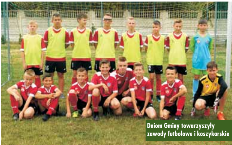
Dniom Gminy towarzyszyły zawody futbolowe i koszykarskie

Na boisku trawiastym w Trzciniccy pokazowe mecze piłki nożnej rozgrywały drużyny Żaków i Orlików