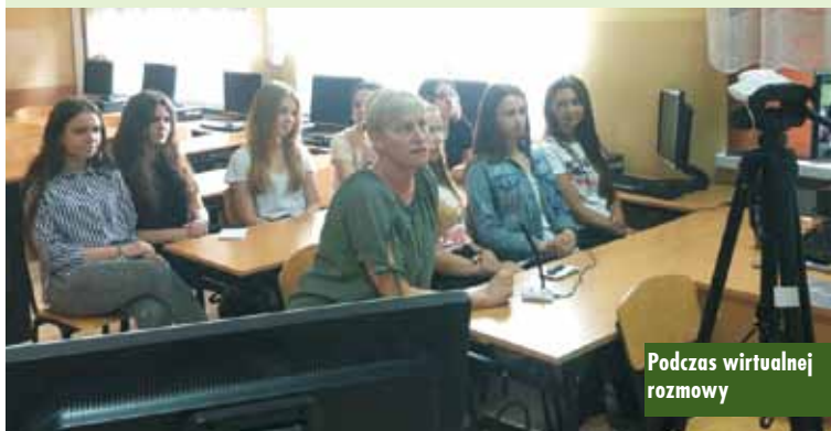
Podczas wirtualnej rozmowy

uczniowie z klasy III LOB, w drugiej - z II LOB. Podczas wideokonferencji każdy z uczestników przedstawia krótko w języku niemieckim miejsca swojego zamieszkania.