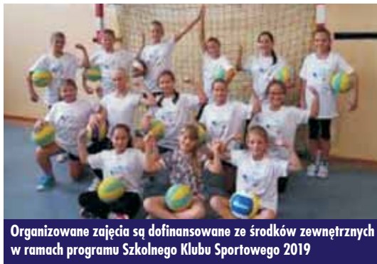
Organizowane zajęcia są dofinansowane ze środków zewnętrznych w ramach programu Szkolnego Klubu Sportowego 2019

Medale przewidziano również dla uczestników zajęć nauki pływania, a osoby zgłoszone do zajęć SKS 2019 otrzymają koszulki. Oprac. bem