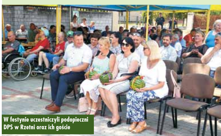
W festynie uczestniczyli podopieczni DPS w Rzetni oraz ich goście