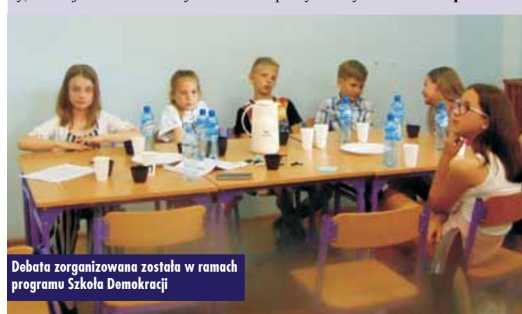
Debata zorganizowana została w ramach programu Szkoła Demokracji