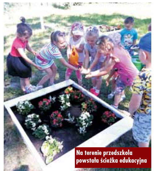
Na terenie przedszkola powstała ścieżka edukacyjna

Ludowy Zespół Sportowy „Pogoń” Trębaczów otrzyma z Ministerstwa Sportu i Turystyki dofinansowanie w wysokości 10.000,00 zł