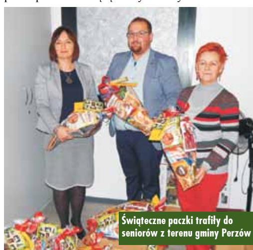
Świąteczne paczki trafiły do seniorów z terenu gminy Perzów

Perzów poprzedniej kadencji Renatę Włodarczyk .