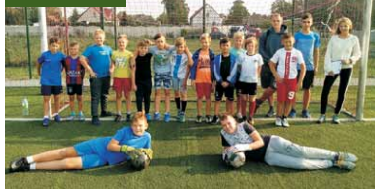
Sport przynosi zawodnikom mnóstwo radości

Wspólne kolędowanie na rychtalskim Rynku