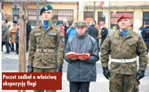
Poczet zadbał o właściwą ekspozycję flagi