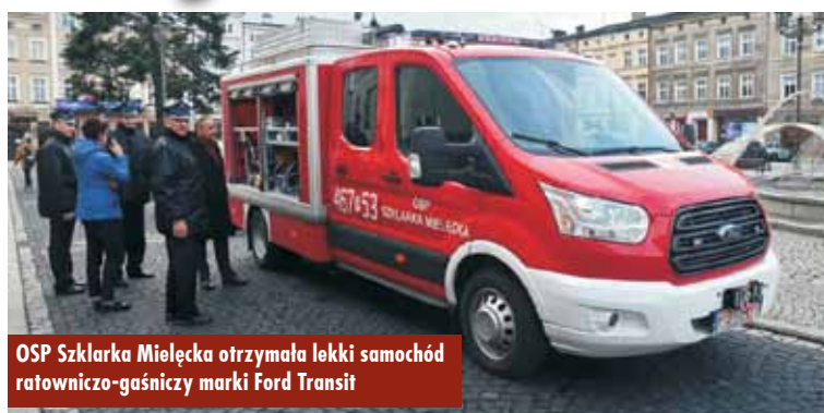
OSP Szklarka Mielęcka otrzymała lekki samochód ratowniczo-gaśniczy marki Ford Transit

10 grudnia 2018 r. Ochotnicza Straż Pożarna w Szklarce Mielęckiej odebrała lekki wóz ratowniczo-gaśniczy marki Ford Transit. Zakup został sfinansowany ze środków Ministerstwa Spraw Wewnętrznych i Administracji w wysokości 180.000 zł oraz