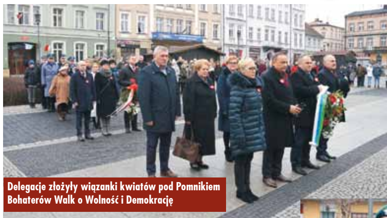
Delegacje złożyły wiązanki kwiatów pod Pomnikiem Bohaterów Walk o Wolność i Demokrację

27 grudnia wspominamy niezwykle ważny dla naszego regionu i wszystkich Wielkopolan epizod – wybuch powstania wielkopolskiego. W 2018 r. obchodziliśmy wyjątkową, bo 100. rocznicę tego wydarzenia.