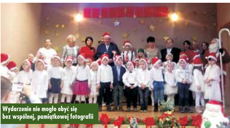
Wydarzenie nie mogło obyć się bez wspólnej, pamiątkowej fotografii

Wycieczka do Wrocławia uczniów ze Szkoły Podstawowej w Świbie