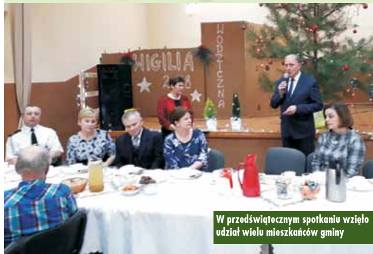
W przedświątecznym spotkaniu wzięło udział wielu mieszkańców gminy

Spotkanie w pięknie udekorowanej sali zgromadziło wielu mieszkańców Wodziejnej oraz okolicznych wsi.