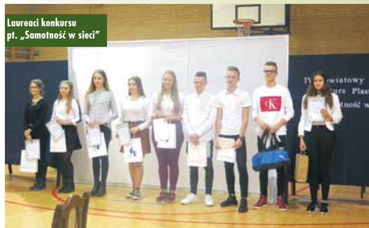
Laureaci konkursu pt. „Samotność w sieci”