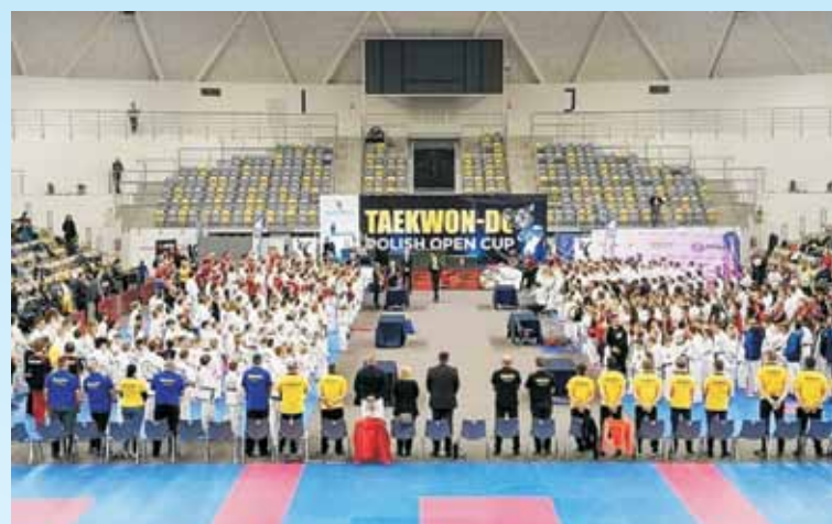
Mistrzowie boks, kickboxingu, a także znane osobistości świata taekwon-do. W klubie taekwon-do Niedźwiedź to był rok wielu spotkań i wielu sukcesów