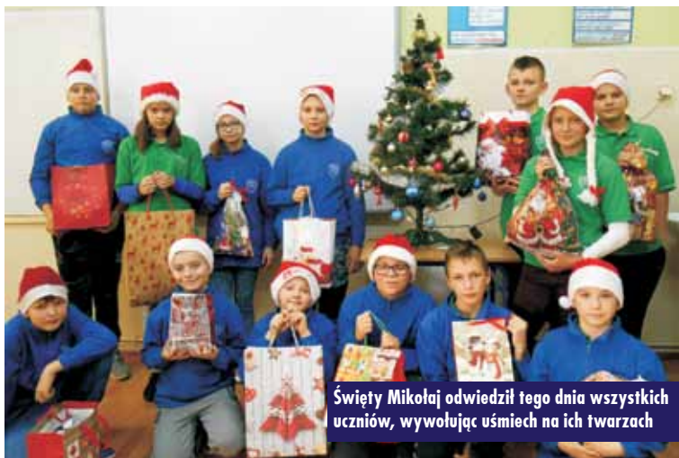
Święty Mikołaj odwiedził tego dnia wszystkich uczniów, wywołując uśmiech na ich twarzach

– było niezwykle szumno i gwaro. Dzieci przyszły do szkoły dużo wcześniej niż zwykle, niezmiennie podekscytowane, z czerwonymi rumieńcami na policzkach i uśmiechniętą buzią. A to za sprawą pewnego