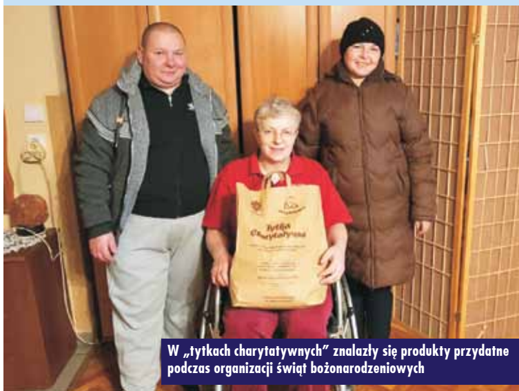
W „tytkach charytatywnych” znalazły się produkty przydatne podczas organizacji świąt bożonarodzeniowych