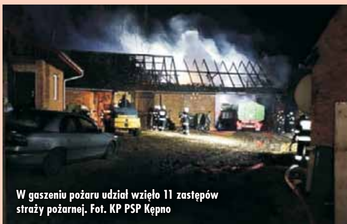
W gaszeniu pożaru udział wzięło 11 zastępów straży pożarnej.