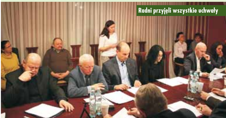
Radni przyjęli wszystkie uchwały

Spotkanie opłatkowe pracowników Szkoły Podstawowej im. Mikołaja Kopernika w Bralinie