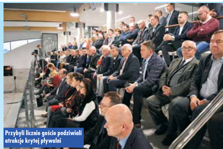
Przybyli licznie goście podziwiali atrakcje krytej pływalni

ny Kępno. - Mamy kolejny powód do dumy i satysfakcji, dzięki wspólnemu wysiłkowi oddajemy dzisiaj do użytku obiekt, który będzie służył mieszkańcom naszej gminy, powiatu i ościennych miejscowości. To powód do wielkiej satysfakcji, że obiekt został zrealizowany w tak krótkim czasie i za takie pieniądze, mimo że był realizowany w czasie najtrudniejszym. Jestem wzruszony tą chwilą, na którą wszyscy czekaliśmy tyle lat. Kolejne inwestycje są naszym