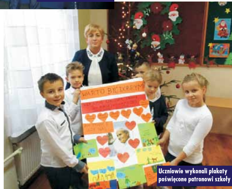
Uczniowie wykonali plakaty poświęcone patronowi szkoły

Uczniowie mieli okazję zaprezentować efekty swojej pracy na forum szkoły. Warto zaznaczyć, że wykazali się podczas tworzenia swych dzieł wielką wiedzą i pomysłowością.