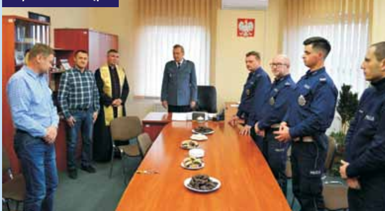
Spotkanie było okazją do życzeń.

Wypadek z udziałem samochodu osobowego na drodze krajowej nr 11 w Przybyszowie