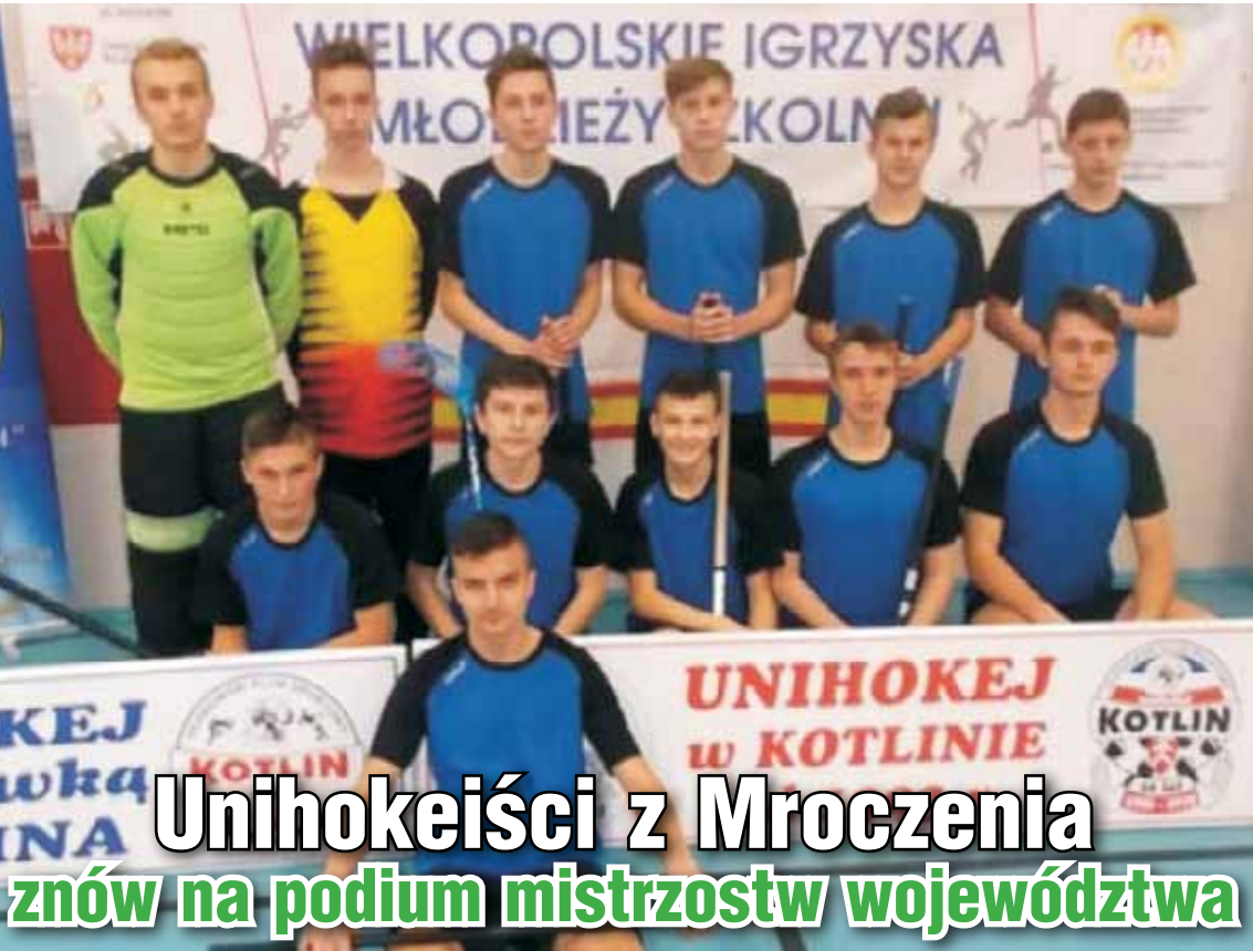
Unihokeiści z Mroczenia znów na podium mistrzostw województwa

W Nowym 2019 Roku nie będziemy mogli narzekać na brak sportowych emocji. Piłkarskie mistrzostwa świata U-20 w Polsce, mistrzostwa świata w narciarstwie klasycznym w austriackim Seefeld oraz mistrzostwa świata w piłce ręcznej i koszykówce zdominują sportowe imprezy w 2019 roku. Imprez sportowych, ale zdecydowanie mniejszej rangi, nie zabraknie również w powiecie kępińskim. Życzymy zatem wszystkim kibicom, aby nie byli minimalistami i od naszych sportowców oczekiwali jak najwięcej. Sportowcom zaś życzymy samych sukcesów, ale takich wielkich i znaczących. Licznych zwycięstw i samych radości.