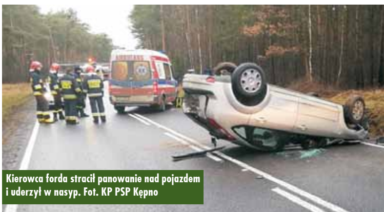
Kierowca forda stracił panowanie nad pojazdem i uderzył w nasyp.

i przekazano przybyłemu na miejsce Zespołowi Ratownictwa Medycznego – relacjonuje rzecznik prasowy Komendy Powiatowej Państwowej Straży Pożarnej w Kępnie kpt. Jaro-