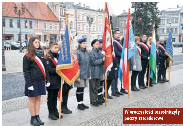
W uroczystości uczestniczyły poczty sztandarowe

podkreślił znaczenie Powstania Wielkopolskiego.