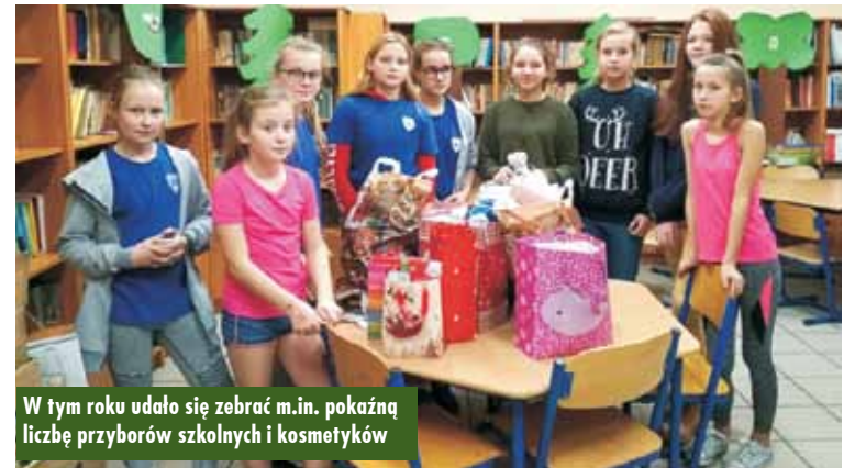
W tym roku udało się zebrać m.in. okazałą liczbę przyborów szkolnych i kosmetyków

W tym roku darczyńców, którzy chcieli wspomóc wychowanków Domu Dziecka było bardzo wielu. Udało się zebrać między innymi okazałą liczbę przyborów szkolnych i kosmetyków. Wolontariusze ze Szkolnego Klubu Wolontariatu posgregowali i zapakowali prezenty.