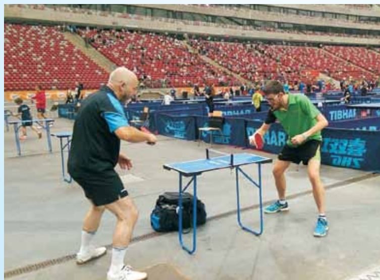
Rok 2018 to także pasmo sukcesów i tytułów dla tenisistów stołowych z powiatu kępińskiego. We wrześniu wzięli oni udział w niecodziennym wydarzeniu, a mianowicie Pingpongowym PGE Narodowym w Warszawie