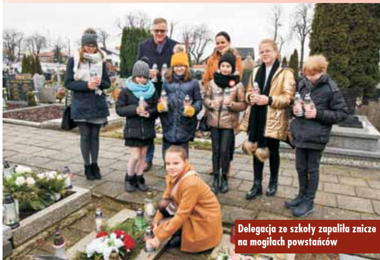
Delegacja ze szkoły zapaliła znicze na mogiłach powstańców

Spotkanie ze Świętym Mikołajem w Zespole Szkół w Słupi pod Kępem