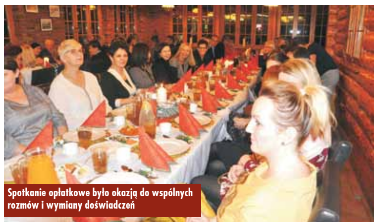
Spotkanie opłatkowe było okazją do wspólnych rozmów i wymiany doświadczeń

nych rozmów, wymiany doświadczeń i poglądów, a moment dzielenia się opłatkiem i składania sobie życzeń