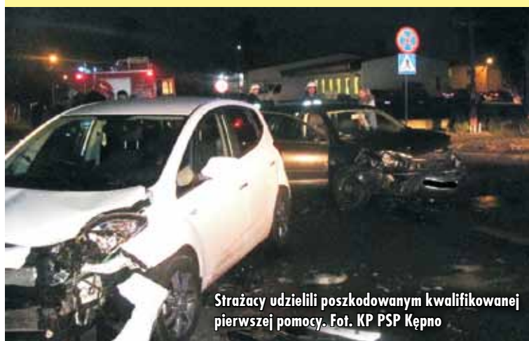
Strażacy udzielili poszkodowanym kwalifikowanej pierwszej pomocy.