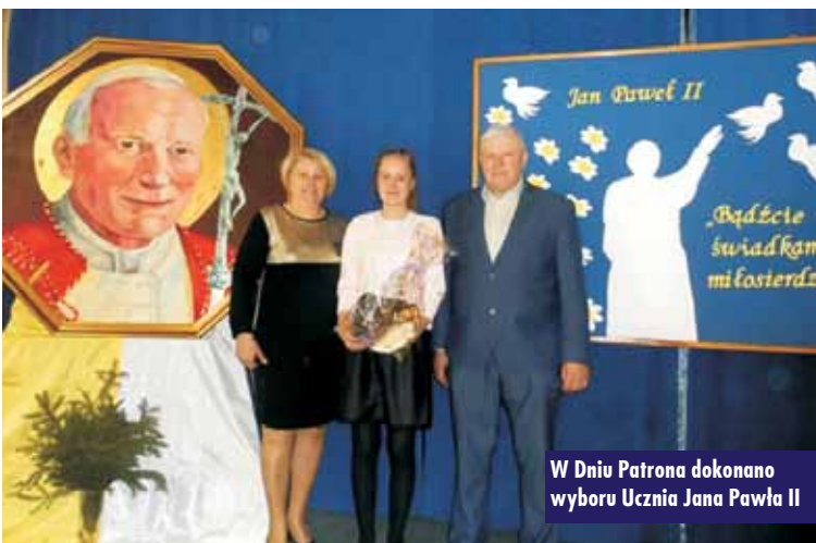
W Dniu Patrona dokonano wyboru Ucznia Jana Pawła II

wielkiego Polaka. Odśpiewano hymn szkoły, złożono kwiaty i zapalono znicze. Po tym oficjalnym rozpoczęciu świętowania uczniowie mieli okazję poczuć atmosferę tamtego pamiętnego dnia, oglądając prezentację zdjęć z uroczystości nadania szkole imienia Jana Pawła II.