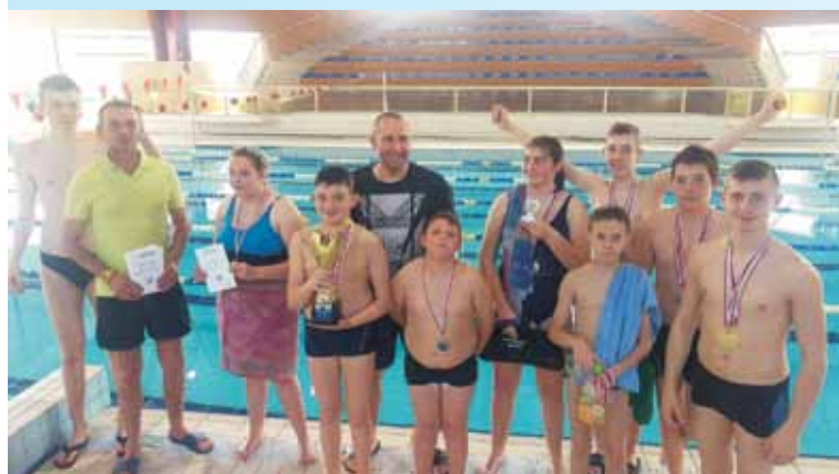
Reprezentanci Zespołu Szkół Specjalnych w Słupi pod Kępem po raz kolejny zdominowali rywalizację podczas Mistrzostw Polski w Pływaniu „Sprawni Razem”. Uczniowie rywalizowali na dystansach 50 i 100 metrów w dwóch kategoriach wiekowych: do 16 lat i powyżej. Pływacy z Słupi zdobyli aż 20 medali – 10 złotych, 6 srebrnych i 4 brązowe