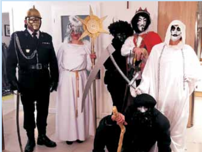
Batyjózki od lewej: Marszałek, Aniol, Diabeł, Herod, Śmierć i Żyd

Kolędnicy zawsze byli nieodłącznym elementem ludowego folkloru. Przed Bożym Narodzeniem w niedużych grupach wędrowali od domu do domu, dając krótkie przedstawienia i śpiewając ko-