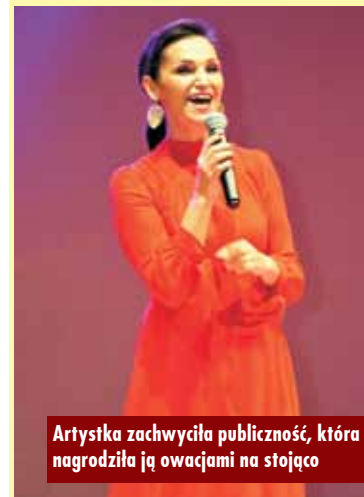
Artystka zachwyciła publiczność, która nagrodziła ją owacjami na stojąco