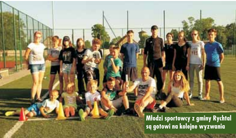
Młodzi sportowcy z gminy Rychtal są gotowi na kolejne wyzwania

gań piłkarskich, takie jak: turnieje seniorów, młodzieży oraz orlików, wieloboje piłkarskie, konkursy rzutów karnych, a w okresie letnim tzw. czwartki piłkarskie. Kolejną formą rekreacji ruchowej, skierowanej do młodzieży szkolnej z gminy Rychtal, były igrzyska sportowe, wieloboje sprawnościowe i zawody lekkoatletyczne. Ponadto w rychtalskiej hali sportowej przeprowadzone zostały powiatowe mistrzostwa szkół podstawowych i gimnazjalnych w piłce siatkowej i koszykowej. Dużą popularnością cieszyły się także trzy kolejne edycje Bicia Rekordów Biegowych na rychtalskim „Orliku”. Ostatnia impreza sportowa tego typu miała wyjątkowy charakter, bowiem 11 listopada 2018 r. mieszkańcy biegali dla Niepodległej, uzyskując przy tym trzy rekordy biegowe. Oferta rychtalskich animatorów skierowana była także do całych rodzin. W minionym roku przeprowadzono sześć imprez dla rodziców z dziećmi, np. „Mama, tata i ja”, „Rodzinnie, zdro-