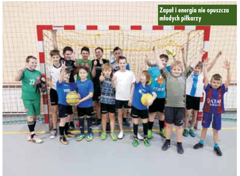
Zapał i energia nie opuszcza młodych piłkarzy

wo i na sportowo, czyli gry i zabawy dla całych rodzin” oraz dwudniowa „Majówka na rychtalskim Orliku”. Już na stałe w kalendarz imprez rekreacyjno-sportowych wpisały się: Turniej Siatkówki Plażowej w Krzyżownikach, „Bieg rychtala” na 10 km wraz z biegami towarzyszącymi, turniej tenisa stołowego czy dwójek siatkarskich, streetball, turnieje halowej piłki nożnej, sportowe soboty oraz małe olimpiady dla przedszkolaków. Pamiętajmy, że do obsługi wszystkich tych wydarzeń potrzebne są osoby wspierające imprezę, odpowiedzialne m.in. za bezpieczeństwo oraz sędziowie. Tym młodym ludziom należą się podziękowania.