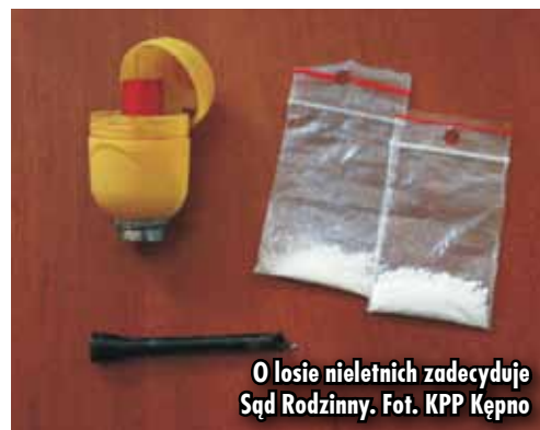
O losie nieletnich zadecyduje Sąd Rodzinny.

Awanturujący się na weselu w Mikorzynie 21-latek został zatrzymany przez policję