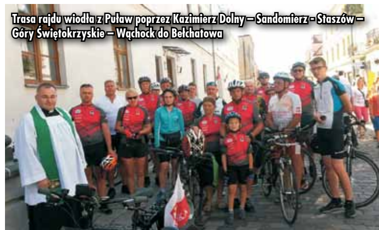
Trasa rajdu wiodła z Puław poprzez Kazimierz Dolny - Sandomierz - Staszów - Góry Świętokrzyskie - Wąchock do Bełchatowa

ulicami Sandomierza wodą, uczestnicy rajdu cali i szczęśliwi dotarli po 120 km do bazy noclegowej. Kolejny dzień rozpoczęli mszą św. w kościele pw. Świętego Ducha (Sandomierz posiada 9 kościołów przy 24 tysiącach mieszkańców). Sprawujący liturgię kapłan zauważył pielgrzymów ro-