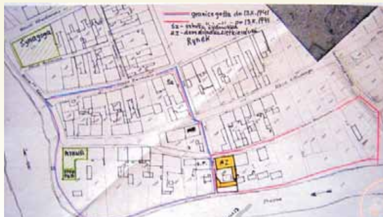
Plan getta w Wieruszowie