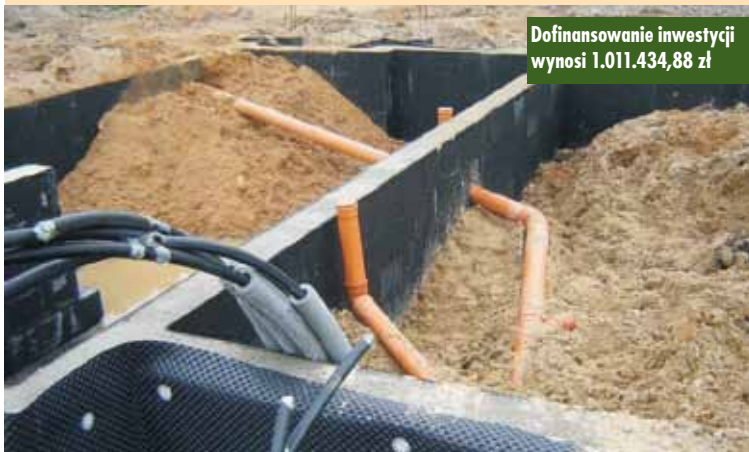
Dofinansowanie inwestycji wynosi 1.011.434,88 zł

W ciągu najbliższych dwóch miesięcy zostanie podpisana umowa na