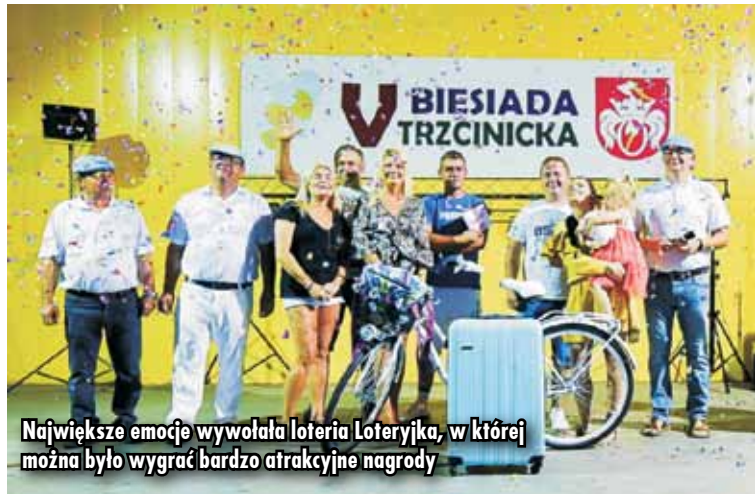
Największe emocje wywołała loteria Loteryjka, w której można było wygrać bardzo atrakcyjne nagrody