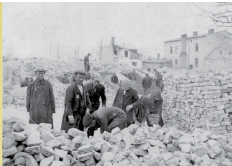
Grupa wieruszowskich Żydów porządkująca gruzy w mieście

Drugim obowiązkiem gminy jest rozdzielanie żywności otrzymywanej od Niemców. Ilość przydziałowego