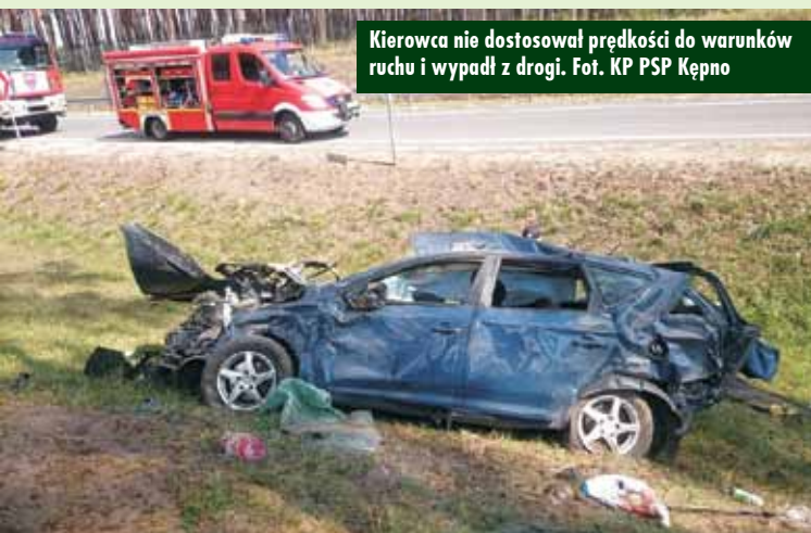
Kierowca nie dostosował prędkości do warunków ruchu i wypadł z drogi.

- Z uwagi na rażące naruszenie przepisów Ruchu Drogowego kierującemu zatrzymano prawo jazdy – mówi oficer prasowy KPP Kępno st. sierż. Filip Ślęk . Sprawca zdarzenia drogowego był trzeźwy. Oprac. KR