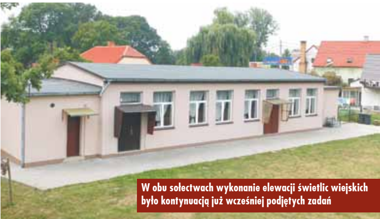
W obu sołectwach wykonanie elewacji świetlic wiejskich było kontynuacją już wcześniej podjętych zadań

Wykonanie elewacji wpłynęło na podniesienie estetyki tych miejsc i jednocześnie podniosło atrakcyjność sołectw. - Mam nadzieję, że mieszkańcy są zadowoleni. Zyskali