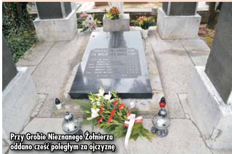
Przy Grobie Nieznanego Żołnierza oddano cześć poległym za ojczyznę