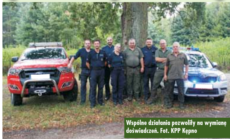
Wspólne działania pozwoliły na wymianę doświadczeń.

14 sierpnia br., już od wczesnych godzin porannych, w lasach Leśnictwa Czermin, Leśnictwa Bałdowice oraz Turze można było spotkać połączone patrole policjantów i strażników leśnych. Policjanci z Posterunku w Bralinie, w ramach prowadzonej współpracy, wraz z funkcjonariuszami Straży Leśnej Nadleśnictwa Syców kontrolowali leśne dukty i drogi dojazdowe w rejonie kompleksów leśnych w ramach działań „Bezpieczny Las” oraz „Bezpieczne Wakacje”. - Wspólne patrole miały na celu przede wszystkim zapobieganie kradzieżom drewna, wywożeniu śmieci do lasu i nielegalnej wycince drzew oraz kontrolę przestrzegania przepisów związanych z zakazem wjazdu