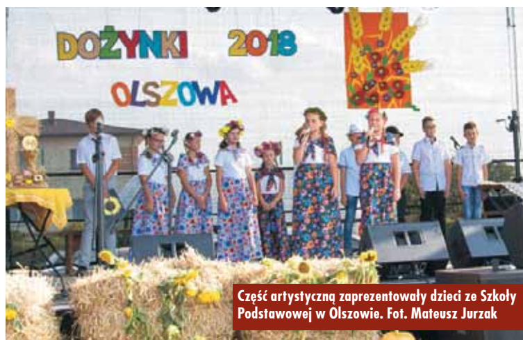
Część artystyczną zaprezentowały dzieci ze Szkoły Podstawowej w Olszowie.

Policjanci z Posterunku w Bralinie wraz z funkcjonariuszami Straży Leśnej Nadleśnictwa Syców w ramach działań „Bezpieczny Las” oraz „Bezpieczne Wakacje” patrolowali drogi w rejonie kompleksów leśnych