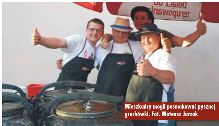
Mieszkańcy mogli posmakować pysznej grochówki.

Planowany termin zakończenia prac to 10 maja 2019 r. Oprac. KR