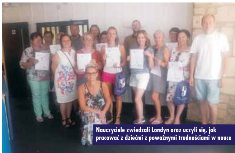
Nauczyciele zwiedzali Londyn oraz uczyli się, jak pracować z dziećmi z poważnymi trudnościami w nauce

ku z realizacją projektu od 30 lipca do 3 sierpnia br. 15-osobowa grupa nauczycieli z Zespołu Szkół im. Ks. Michała Przywary i Rodziny Salomonów w Nowej Wsi Książęcej brała