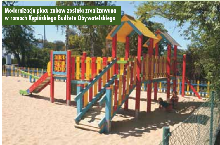
Modernizacja placu zabaw została zrealizowana w ramach Kępińskiego Budżetu Obywatelskiego

Obchody Święta Wojska Polskiego na cmentarzu parafialnym w Kępnie