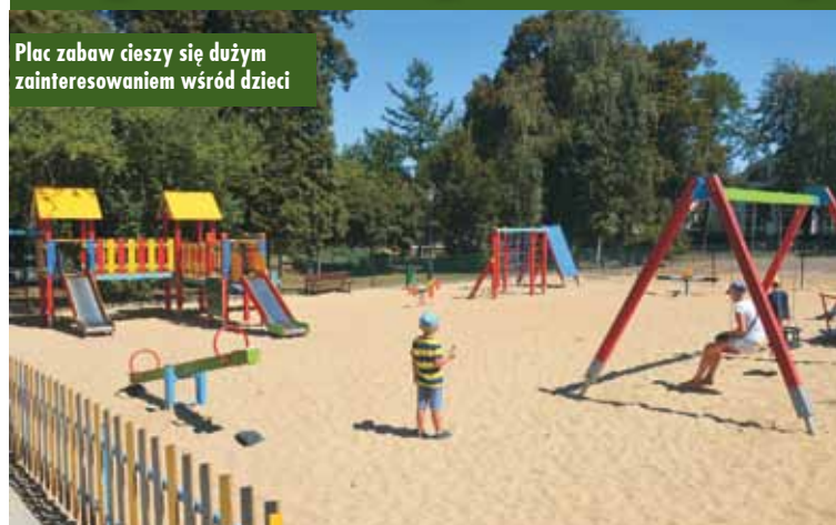
Plac zabaw cieszy się dużym zainteresowaniem wśród dzieci

Zestaw zabawowy, zestaw sprawnościowy, huśtawka „bocianie gniazdo”, karuzela „trzmieł” – to tylko kilka atrakcji znajdujących się na nowo powstałym placu zabaw, który znajduje się obok szpitala. Plac jest nowoczesny i bezpieczny. - Mamy nadzieję, że będzie on celem wspólnych wypadów rodziców z dziećmi – podkreśla burmistrz Piotr Psikus .