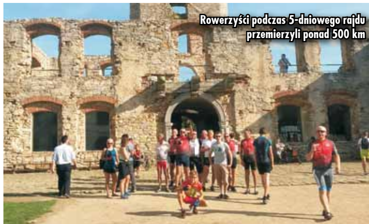
Rowerzyści podczas 5-dniowego rajdu przemierzali ponad 500 km

Trzeci dzień okazał się najbardziej wymagający i trudny. W planie było zwiedzenie najciekawszych miejsc Gór Świętokrzyskich: Łysa Góra z klasztorem św. Krzyża, gołoborza, puszcza jodłowa, by wreszcie po pokonaniu wielu wzniesień dotrzeć na nocleg do św. Katarzyny. Przedostatni dzień rajdu wiódł przez Wąchock, słynny nie tyle z dowcipów, co z przepięknego klasztoru cystersów, po którym całą grupę w ciekawy sposób oprowadził jeden z ojców. Oczywiście nie obyło się bez zwiedzenia Rynku i zdjęcia przy pomniku soltysa. W ostatni - piąty dzień rajdu do pokonania było 145 km do Bełchatowa. Mimo napiętego planu udało się z tarasu widokowego podziwiać ogrom odkrywkowej kopalni węgla brunatnego, która wywarła na oglądających ogromne wrażenie. Warto dodać, że gmina Kleszczów