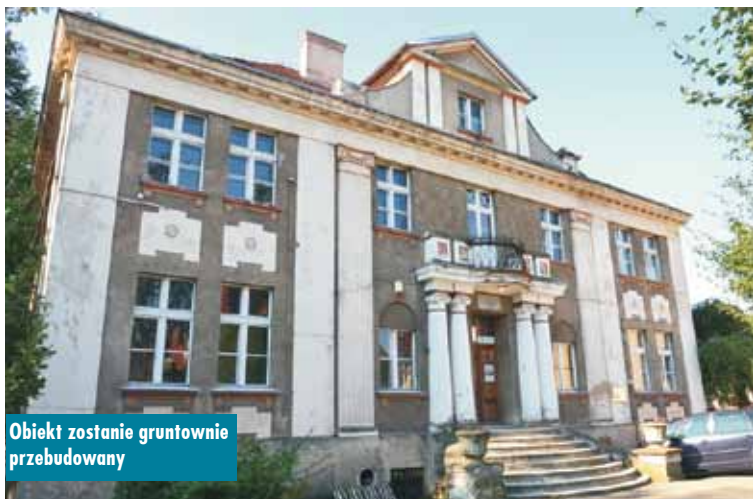
Obiekt zostanie gruntownie przebudowany

stwa, organizowanego przez Instytut Książki, Priorytet 2. „Infrastruktura Bibliotek 2016 – 2020”. Jest to zadanie pn. „OdNowa Biblioteki – modernizacja Samorządowej Biblioteki Publicznej w Kępnie”.