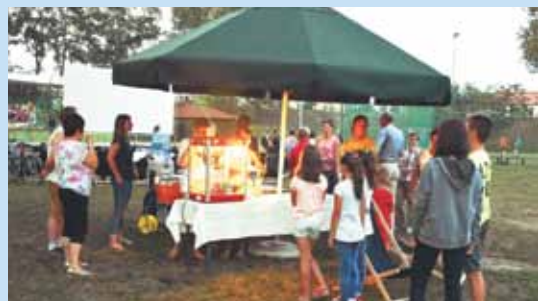
Jak przystało na prawdziwe kino, widzowie mogli zaopatrzyć się w jego obowiązkowe atrybuty, takie jak pyszny popcorn

Dobiegły końca prace remontowe związane z wykonaniem elewacji budynków świetlic wiejskich w Kozie Wielkiej oraz w Słupi pod Bralinem