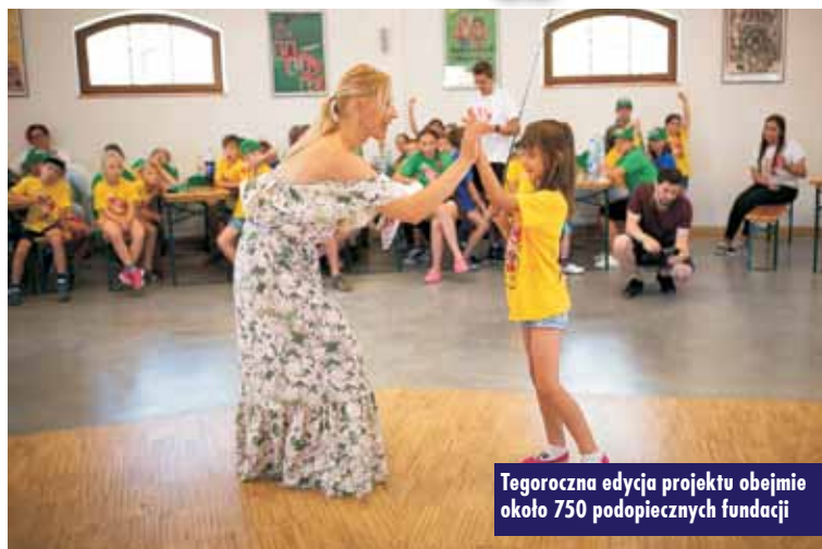
Tegoroczna edycja projektu obejmuje około 750 podopiecznych fundacji

Dzięki III edycji akcji charytatywnej „Wakacje z Muszkieterami” pięcioro dzieci z Kępna 12 sierpnia br. wyjechało na bezpłatne kolonie do Puszczy Kampinoskiej. Letni wypoczynek jest finansowany przez właścicieli sklepów Intermarché i Bricomarché, zaangażowanych w charytatywną działalność pomysłodawcy wyjazdów – Fundacji Muszkieterów. Tegoroczna edycja projektu obejmuje około 750 podopiecznych Fundacji Muszkieterów w wieku 8-14 lat w całej Polsce. Ambasadorką „Wakacji z Muszkieterami” jest medalistka olimpijska Sylwia Gruchała , a honorowy patronat objął rzecznik praw dziecka.