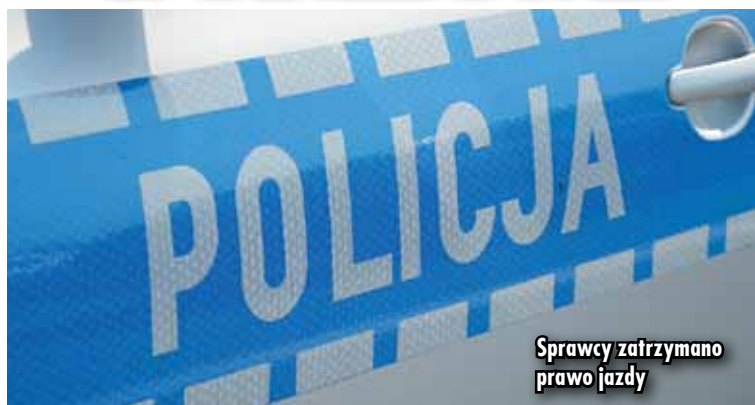
Sprawcy zatrzymano prawo jazdy

13 sierpnia br., około godziny 19.00, dyżurny Komendy Powiatowej Policji w Kępnie został poinformowany o zdarzeniu drogowym, do którego doszło na drodze krajowej nr 11 (450 km). Policjanci Wydziału Ruchu Drogowego KPP Kępno, którzy udali się na miejsce zdarzenia, ustalili, że kierujący samochodem marki Opel, mieszkaniec gminy Baranów, jadąc drogą nr 11 w kierunku miejscowości Słupia pod Kępnem, nie dostosował prędkości do warunków ruchu i podczas omijania holujących się po-