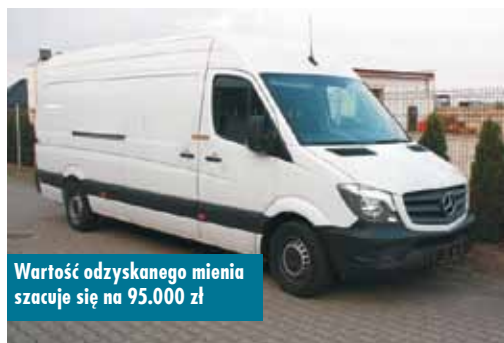
Wartość odzyskanego mienia szacuje się na 95.000 zł

Zdarzenie drogowe z udziałem jednego samochodu, do którego doszło na zjeździe z trasy S8 w kierunku Bralina