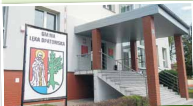
Pozyskane przez Gminę Łęka Opatowska dofinansowanie na przebudowę dróg dojazdowych do gruntów rolnych wynosi w sumie 165.600,00 zł

Biorąc pod uwagę wcześniej podpisaną umowę, dofinansowanie przekazane w formie dotacji celowej przez Samorząd Województwa Wielkopolskiego wynosić będzie w sumie 165.600,00 zł.