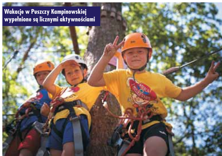
Wakacje w Puszczy Kampinoskiej wypełnione są licznymi aktywnościami

Przez trzy lata, dzięki właścicielom sklepów Intermarché i Bricomarché oraz Fundacji Muszkieterów, już blisko 3.000 potrzebujących dzieci wyjechało na wymarzone wakacje. Kolonie potrwać aż do początku września. W sumie zaplanowano