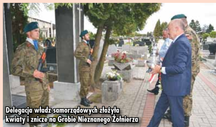
Delegacja władz samorządowych złożyła kwiaty i znicze na Grobie Nieznanego Żołnierza

było jednym z istotnych czynników integrujących armię oraz umacniało jego więzi ze społeczeństwem. Szczególnym tego przykładem były święta wojskowe, uroczyste obchodzone w armii II Rzeczypospolitej. Do tych