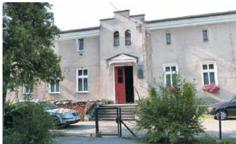
„Czerwona willa” współcześnie