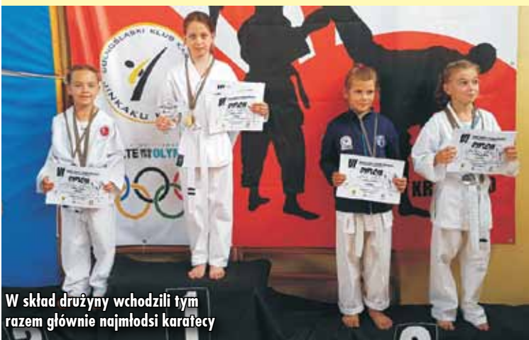
W skład drużyny wchodził tym razem głównie najmłodsi karatecy

zarówno pod względem wieku, jak i doświadczenia. - Było wiele powodów do zadowolenia i dumy ponieważ nasi wojownicy zdobyli łącznie 32 krążki - 10 złotych, 7 srebrnych i