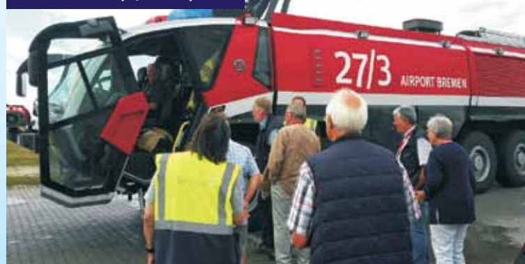
Członkowie delegacji odwiedzili lotnisko w Bremen oraz fabrykę lokomotyw

Zmodernizowana zostanie droga prowadząca do szkoły w Trębaczowie, przy której powstanie też parking