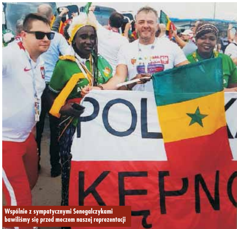
Wspólnie z sympatycznymi Senegalczymi bawiliśmy się przed meczem naszej reprezentacji

cy, po drodze mieliśmy jeszcze około trzygodzinny postój na, dobrze nam znanych z przeszłości, kontrolach granicznych, przejściu lotewsko-rosyjskim. Po przekroczeniu punktu granicznego musieliśmy zjechać do pobliskiej miejscowości, aby zarejestrować się w systemie poprzez spe-