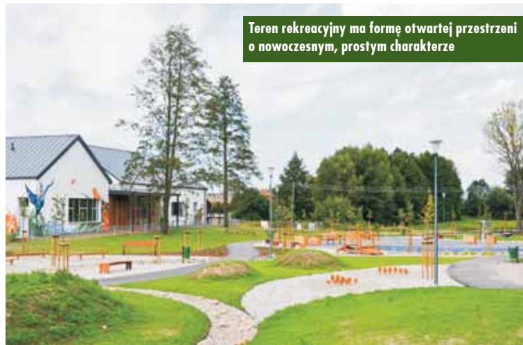
Teren rekreacyjny ma formę otwartej przestrzeni o nowoczesnym, prostym charakterze

stości dla większej liczby osób. Przewidziano również zainstalowanie nagłośnienia. Głównymi atrakcjami dla dzieci są bezobsługowy park linowy, a także trawiaste pagórki ze zjeżdżalnią i krzywe zwierciadła. Na skwerze stanęły huśtawki, drewniane równoważnie, ławki oraz latarnie. Posadzono też wierzby. Gdy trochę podrosną, zostaną zaplecione w szalasy. - Chciałam, żeby