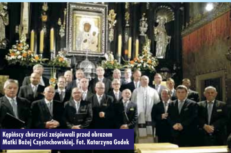
Kępińscy chórzyci zaśpiewali przed obrazem Matki Bożej Częstochowskiej.