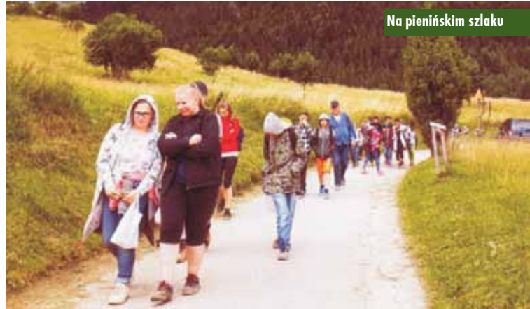
Na pieninim szlaku

Ważnym elementem programu zjazdu były warsztatowe zajęcia profilaktyczne, stawiające na kształtowanie w młodych uczestnikach motywacji do odmawiania udziału w zachowaniach ryzykownych, zagrażających ich osobowości. Młodzież chętnie i