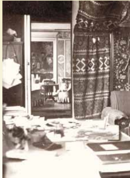
Wnętrze „Czerwonej willi”