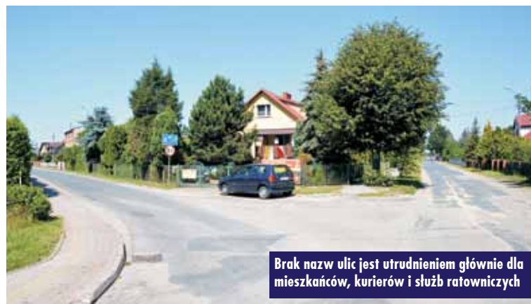
Brak nazw ulic jest utrudnieniem głównie dla mieszkańców, kurierów i służb ratowniczych

Pozostaje pytanie – czy mieszkańcy zgodnie zechcą nazewnictwa ulic? Czy ta sprawa znajdzie swój finał i numeracja w Mikorzynie zostanie uporządkowana, a ulice doczekają się swoich nazw? Czas pokaże.