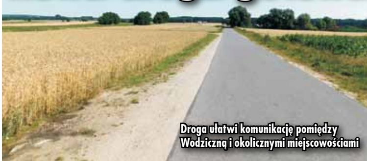
Droga ułatwi komunikację pomiędzy Wodziejną i okolicznymi miejscowościami

Budowa gminnej drogi łączącej Wodziejną z Kuźnicą Trzcínską została zakończona. Powstało łącznie 1420 metrów bieżących nowej drogi wraz z poboczami. Wartość całkowita wykonanych prac to 696.757,49 zł, z czego 157.000,00 zł pochodzi z dofi-