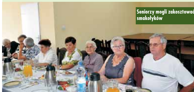
Seniorzy mogli zakosztować smakolików