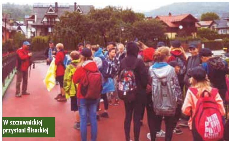
W szczawnickiej przystani flisackiej

Prezes Zarządu Katolickiego Stowarzyszenia Trzeźwości „Dom” w Kępnie