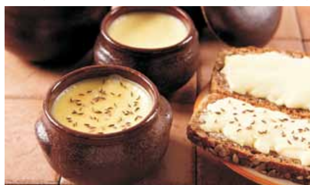
Wielkopolski ser smażony

Po pozytywnej weryfikacji Komisji Europejskiej 9 marca 2017 r. w Dzienniku Urzędowym Unii Europejskiej ukazała się tzw. I publikacja wniosku o rejestrację nazwy „kielbasa biała parzona wielkopolska” jako Chronione Oznaczenie Geograficzne podczas którego inne państwa członkowskie mogły oprotetować wniosek. Oficjalnie Kielbasa Biała Parzona została wpisana na listę nazw chronionych produktów 7 lipca 2017 r. Oznacza to, że powyższa nazwa będzie mogła być używana jedynie przez producentów na ściśle określonym obszarze geograficznym, obejmującym województwo wielkopolskie oraz część powiatów w województwie lubuskim i kujawsko-pomorskim. Każdy producent chcący posługiwać się tą chronioną nazwą będzie musiał poddać się kontroli zgodności produktu z zarejestrowaną specyfikacją i otrzymać stosowany certyfikat. W kielbasie białej parzonej wielkopolskiej dominuje smak zaparzonego mięsa wieprzowego z lekkim aromatem czosnku i pieprzu. Wyraźnie wyczuwalna jest również nuta tartego majeranku, podkreślająca jej smak oraz związek z regionem Wielkopolski. Wyjątkowość kielbasy białej parzonej wielkopolskiej polega również na tym, że jest produkowana ze świeżego, schłodzonego, niepeklowanego mięsa w 70% pochodzące-