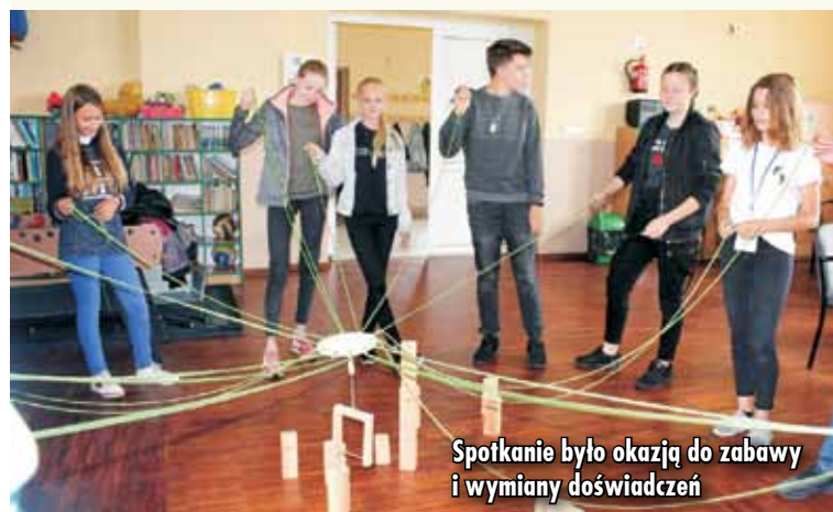
Spotkanie było okazją do zabawy i wymiany doświadczeń