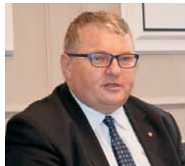
- Cieszę się, że coraz więcej spółek spełnia kryteria, by taką dotację otrzymać – zaznacza wicemarszałek K. Grabowski

Spółka Wodna w Bralinie – 20.503,00 zł, Gminna Spółka Wodna Doliny Rzeki Niesob w Kępnie – 17.676,00 zł, Spółka Drenarska Olszowa – 1.552,00 zł, Spółka Drenarska Kierzno – 1.430,00 zł, Spółka Drenarska Myjomice – 2.800,00 zł, Spółka Drenarska Ostrówiec – 1.842,00 zł, Spółka Drenarska w Szklarcu Mie-