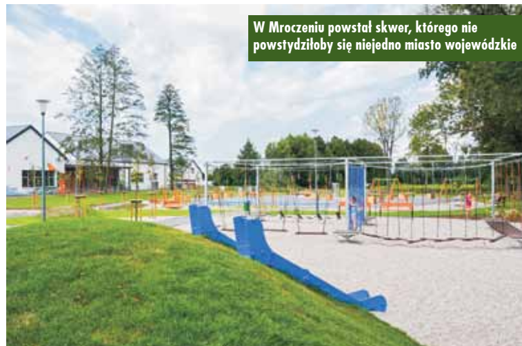
W Mroczeniu powstał skwer, którego nie powstydziłoby się niejedno miasto wojewódzkie

Operacja pn. „RECREO – nowe spojrzenie na rozwój infrastruktury rekreacyjnej na terenie gminy Baranów” współfinansowana jest ze środków Unii Europejskiej w ramach