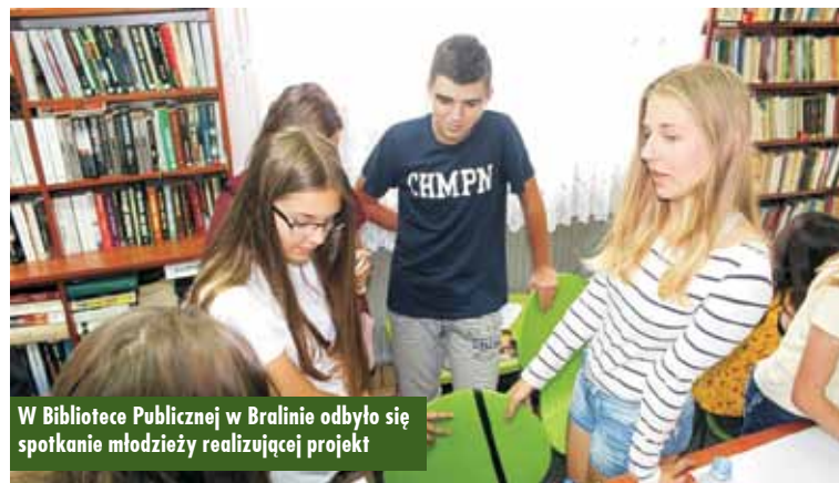
W Bibliotece Publicznej w Bralinie odbyło się spotkanie młodzieży realizującej projekt

Biblioteka Publiczna w Bralinie zakwalifikowała się do projektu pn. „Mała książka – wielki człowiek”