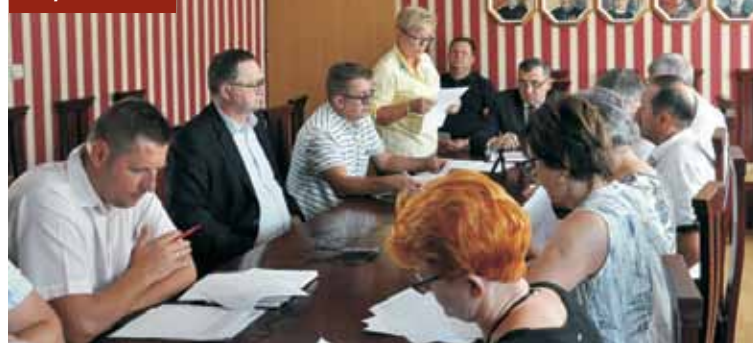
Podczas sesji Rady Gminy Bralin

Nadzwyczajna sesja została zwołana z uwagi na możliwość otrzymania przez Gminę Bralin, po blisko dwóch latach starań, dofinansowania ze środków Programu Operacyjnego