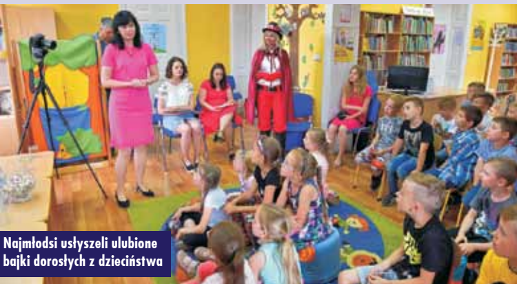
Najmłodszy usłyszeli ulubione bajki dorosłych z dzieciństwa

im się najbardziej. Dzięki temu miały one szansę spróbować krytycznego myślenia i wypracować zdolność wyrażania własnej opinii. Lektorzy bajek, które spotkały się z największą aprobatą słuchaczy, nagradzani byli słodkimi cukierkami wsypywanymi do słoiczek. Oczywiście cukierkami na koniec spotkania poczęstowani zostali wszyscy uczestnicy. Każdy z gości dostał też kolorową zakładkę do książki na pamiątkę wydarzenia.