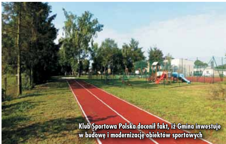
Klub Sportowa Polska docenił fakt, iż Gmina inwestuje w budowę i modernizację obiektów sportowych

Gmina Trzcínica przez wiele lat podejmowała wysiłek budowy i modernizacji obiektów sportowych, a od 2011 roku uczestniczy w programie „Budujemy Sportową Polskę”.