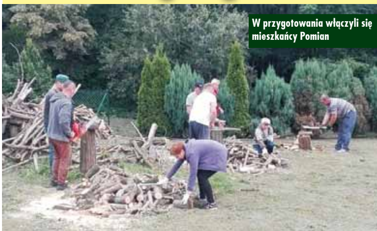
W przygotowania włączyli się mieszkańcy Pomian

– Ta uroczystość gromadzi zawsze wielu mieszkańców i gości, dlatego wraz z mieszkańcami Pomian, bo tam w tym roku odbędzie się Gminne Święto Plonów, rozpoczęliśmy już przygotowania – mówią przedstawiciele Urzędu Gminy w Trzcínicy.