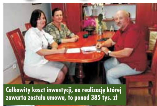
Całkowity koszt inwestycji, na realizację której zawarta została umowa, to ponad 385 tys. zł

Najmłodsi karatecy reprezentujący perzowski Klub „Kaminari” z powodzeniem wystartowali w VI Turnieju Karate o Puchar Gór Kocich