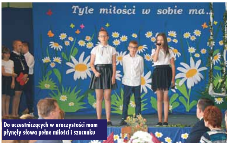
Do uczestniczących w uroczystości mam płynęły słowa pełne miłości i szacunku