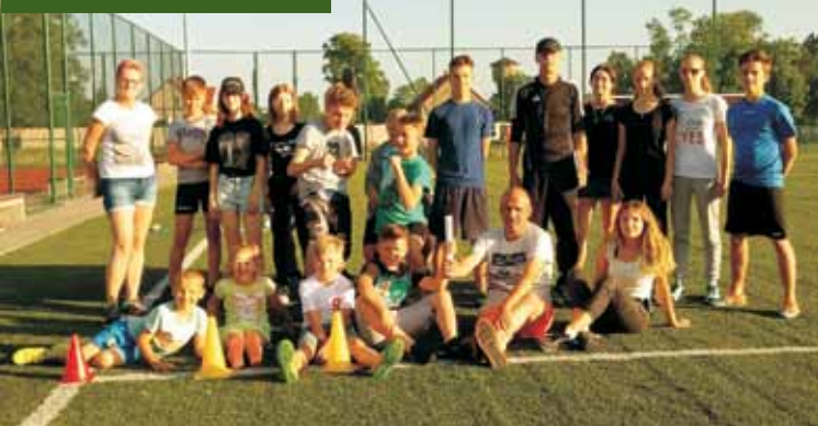
Imprezy sportowe w Rychtalu cieszą się zainteresowaniem mieszkańców