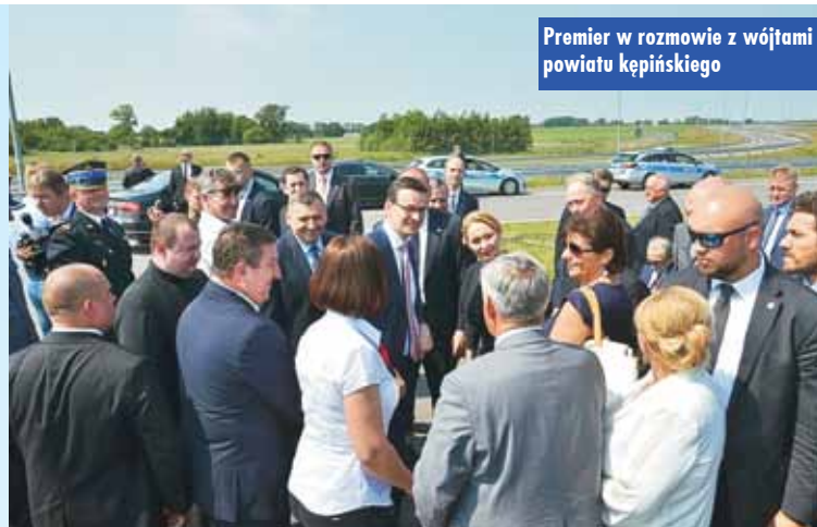
Premier w rozmowie z wójtami powiatu kępińskiego

prowadzącą w kierunku Wrocławia i Warszawy.