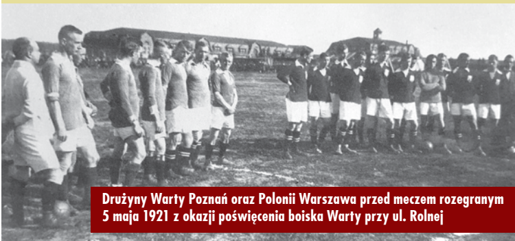
Drużyny Warty Poznań oraz Polonii Warszawa przed meczem rozegranym 5 maja 1921 z okazji poświęcenia boiska Warty przy ul. Rolnej