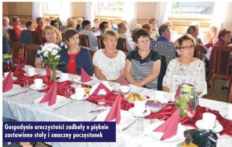
Gospodynie uroczystości zadbały o pięknie zastawione stoły i smaczny poczęstunek