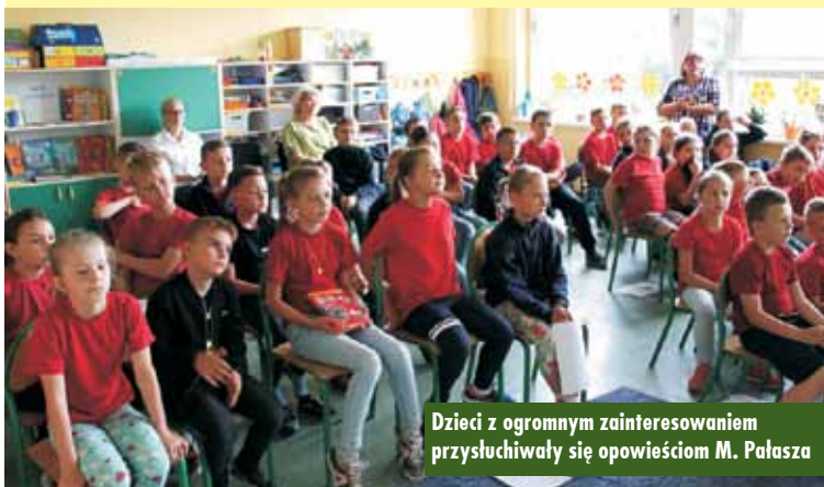
Dzieci z ogromnym zainteresowaniem przysłuchiwały się opowieściom M. Pałasza