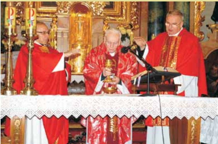
Uroczysta msza św. z okazji 60-lecia kapłaństwa w kościele w Baranowie

jąc młodszego brata - nie miał komu przekazać tego zadania. Tutaj też rozpoczął swoją edukację w szkole powszechnej, do której uczęszczał przez 2 lata, następnie przez kolejne 4 lata uczył się w szkole podstawowej w