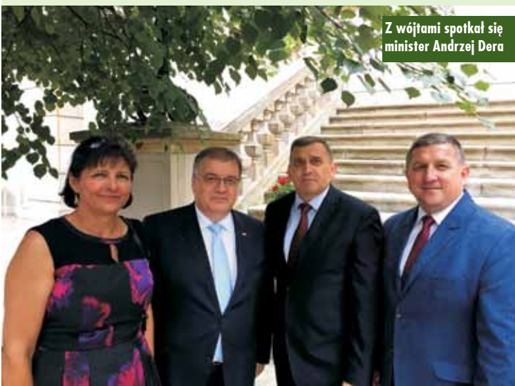
Z wójtami spotkał się minister Andrzej Duda