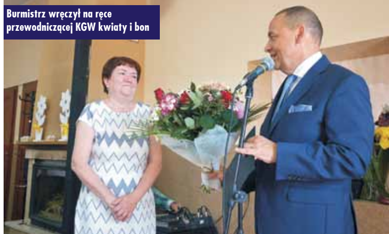
Burmistrz wręczył na ręce przewodniczącej KGW kwiaty i bon

LV nadzwyczajna sesja Rady Miejskiej w Kępnie