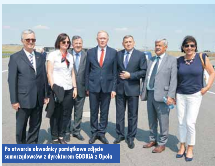
Po otwarciu obwodnicy pamiątkowe zdjęcie samorządowców z dyrektorem GDDKiA z Opola

na na drodze S11, co obiecywali poprzedni rządzący począwszy od SLD, a skończywszy na PO. Wiedziałam, że tak dużej inwestycji nie jest w stanie zrealizować budżet miasta czy powiatu, choć dziś ten sukces ma wielu ojców. Zdawałam sobie sprawę, że nie będzie łatwo, gdyż takich miejscowości, jak Kępno, które borykają się z problemami komunikacyjnymi, jest w kraju sporo. Jednak