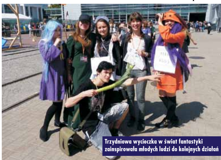
Trzydniowa wycieczka w świat fantastyki zainspirowała młodych ludzi do kolejnych działań

Młodzież pojechała na Pyrkon w przygotowanych specjalnie na tę okazję strojach cosplayowych. Młodzi ludzie uszyli je samodzielnie na