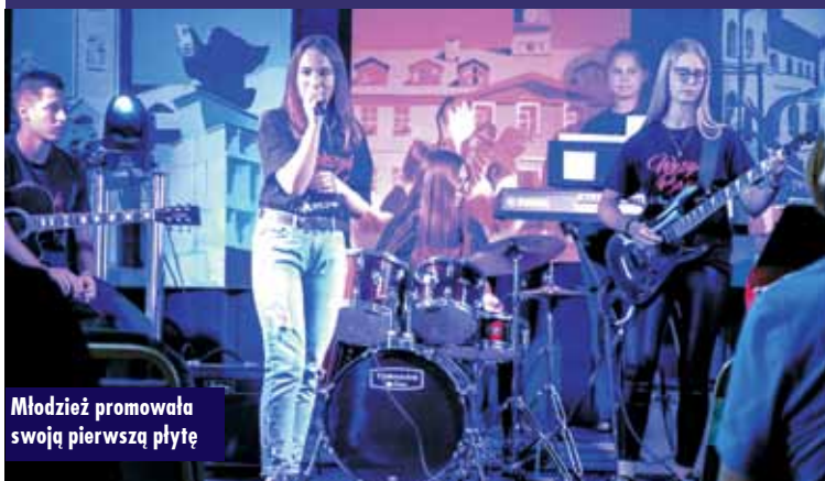
Młodzież promowała swoją pierwszą płytę

23 maja br. w Kępińskim Ośrodku Kultury odbył się koncert promujący pierwszą płytę zespołu „Wężyk Band”. Zagrane zostały polskie utwory takich zespołów, jak: Lady Pank, Perfect, Happysad, Ira i Dżem. Koncert trwał ponad godzinę. Na widowni nie zabrakło osób, które zawsze pojawiają się i wspierają grupę muzyczną ze szkoły w Mroczeniu. Był to wspaniały czas dla uczniów i publiczności zgromadzonej w sali.