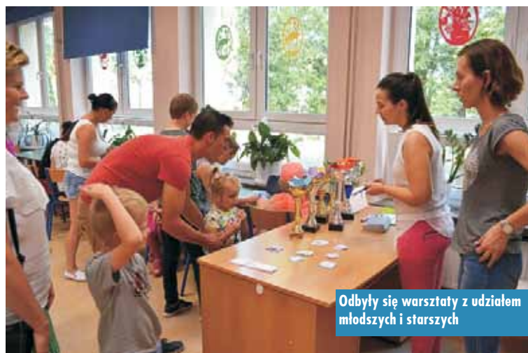
Odbyły się warsztaty z udziałem młodszych i starszych