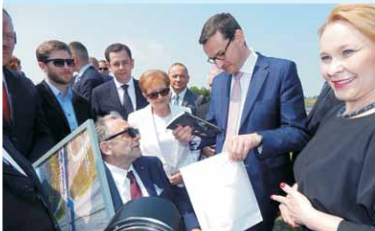
Starosta podarował książkę opisującą historię Żołnierzy Wyklętych, wydaną na podstawie artykułów publikowanych w „Tygodniku Kępińskim, która żywo zainteresowała premiera

różnych dróg dojazdowych, lokalnych, ekspresowych, a także obwodnic. Za często nasi poprzednicy patrzyli tylko na łączenie głównych arterii komunikacyjnych, na łączenie wielkich miast – mówił. - Nasza