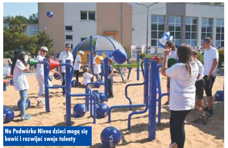
Na Podwórku Nivea dzieci mogą się bawić i rozwijać swoje talenty

Finały Rejonu Kaliskiego w Streetballu Dziewcząt i Chłopców