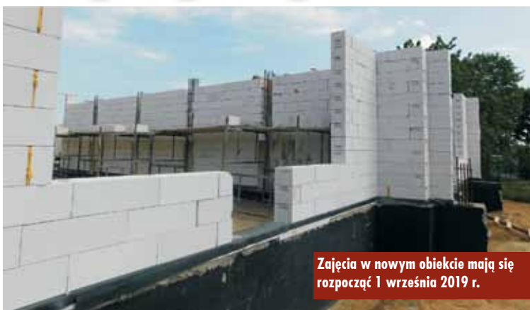
Zajęcia w nowym obiekcie mają się rozpocząć 1 września 2019 r.

Wykonawcą prac jest P.P.H.U. „Jokpol”. Zgodnie z umową inwestycja ma zostać zakończona do 28 czerwca 2019 r., tak by zajęcia przedszkolne rozpoczęły się w nowym obiekcie 1 września przyszłego roku.