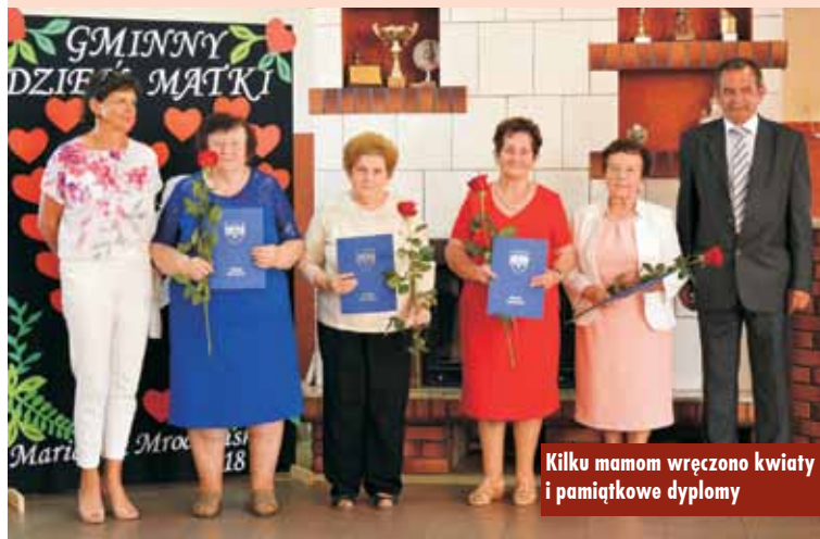
Kilku mamom wręczono kwiaty i pamiątkowe dyplomy