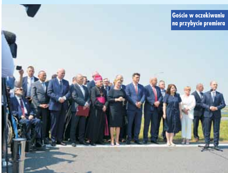
Goście w oczekiwaniu na przybycie premiera