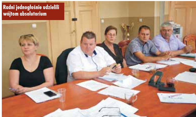
Radni jednogłośnie udzielili wójtowi absolutorium