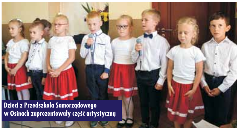
Dzieci z Przedszkola Samorządowego w Osinach zaprezentowały część artystyczną

nikiem naszych problemów, trosk, a w swoich radach zawsze kieruje się tylko dobrem własnego dziecka. Dzień matki jest raz w roku, ale o matce trzeba zawsze wyrażać się z wielkim szacunkiem – podkreślił. Włodarz gminy z okazji Dnia Matki złożył życzenia zdrowia, radości oraz dumy i satysfakcji z dzieci. W ramach podziękowań na ręce przewodniczącej KGW w Szklarcie Mielęckiej przekazał również prezent, który z pewnością pomoże w dalszym funk-