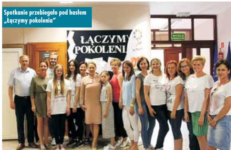
Spotkanie przebiegało pod hasłem „Łączymy pokolenia”