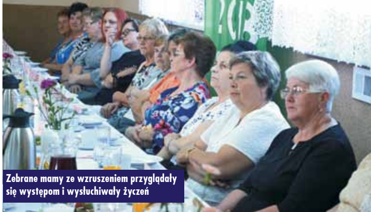
Zebrały mamy ze wzruszeniem przyglądały się występowi i wysłuchiwały życzeń

osiągnąć i mieć, ale matkę ma się zawsze tylko jedną i jedyną. Ona zawsze jest osobą nam najbliższą, bo to ona dała nam życie i nosiła nas pod sercem, od najmłodszych lat wychowywała i kształtowała, jest naszym najlepszym przyjacielem i powier-