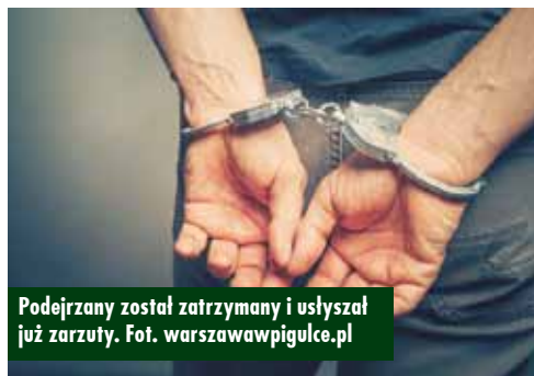
Podejrzany został zatrzymany i usłyszał już zarzuty.

Krzysztof Dymkowski , czyli słynny „Łowca pedofilów” z programu telewizji Polsat, przy pomocy prowokacji tropił w internecie mężczyzn umawiających się z dziećmi na seks i wspólnie z policją organizuje na nich zasadzki.