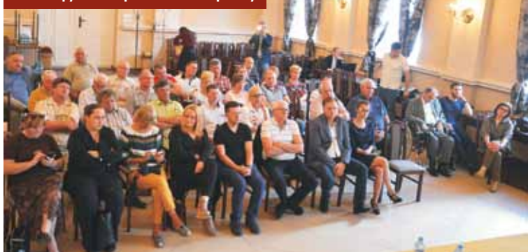
Licznie zgromadzeni mieszkańcy mogli kierować pytania do posłów i wicewojewody

lada moment, kolejne środki do tego szpitala trafią, aby przede wszystkim służyć mieszkańcom tego regionu - przyznała.