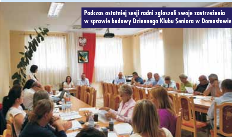
Podczas ostatniej sesji radni zgłaszali swoje zastrzeżenia w sprawie budowy Dziennego Klubu Seniora w Domasławie