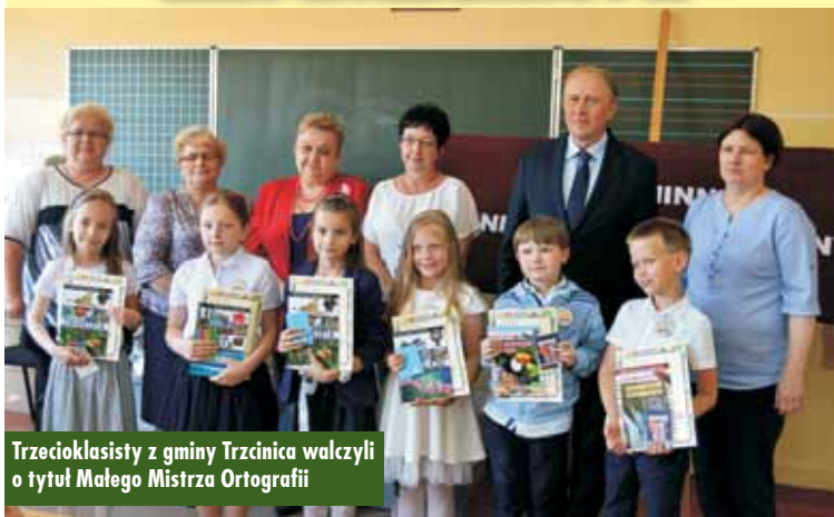
Trzecioklasisty z gminy Trzcinica walczący o tytuł Małego Mistrza Ortografii

W szranki stanęło 6 uczniów ze Szkoły Podstawowej w Laskach i 6 uczniów ze Szkoły Podstawowej w Trzcinicy. Podczas konkursu rozwiązywali zadania, w których występowały trudności ortograficzne.