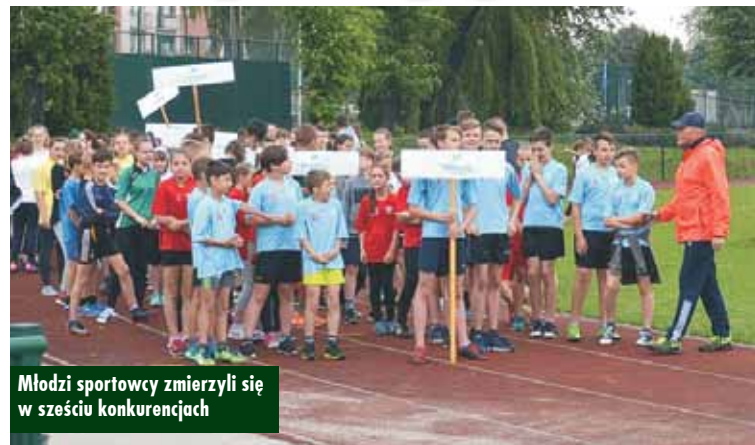
Młodzi sportowcy zmierzili się w sześciu konkurencjach