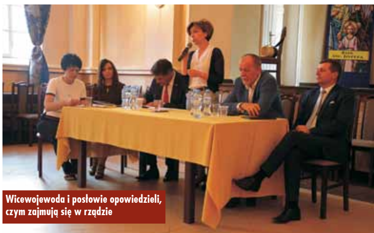
Wicewojewoda i posłowie opowiedzieli, czym zajmują się w rządzie

i bezpieczeństwa Polski oraz planach powołania Wojsk Obrony Terytorialnej. Z kolei J. Mosiński opowiedział zebranym m.in. o drodze do uzyskania dofinansowania w wysokości prawie 4.000.000 zł na utworzenie nowego bloku operacyjnego w szpitalu w Kępnie. Poseł wspomniał, że to dzięki staraniom jego i minister Beaty Kempy kępiński szpital otrzymał środki finansowe na blok operacyjny, podkreślając, że to nie minister Andżelika Możdżanowska wywalczy-