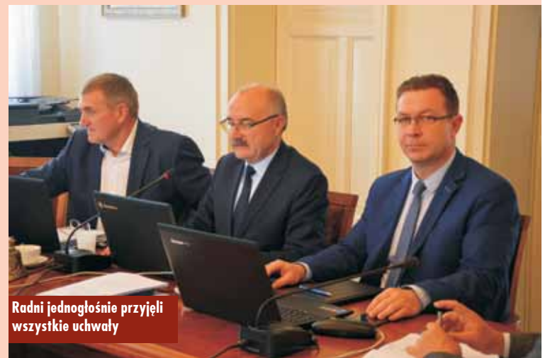
Radni jednogłośnie przyjęli wszystkie uchwały

Padło również pytanie o basen zewnętrzny, którego otwarcie na początku wakacji może być sporym problemem ze względu na jego fatal-