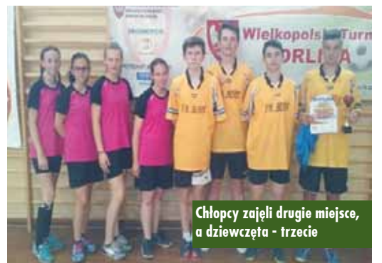
Chłopcy zajęli drugie miejsce, a dziewczęta - trzecie