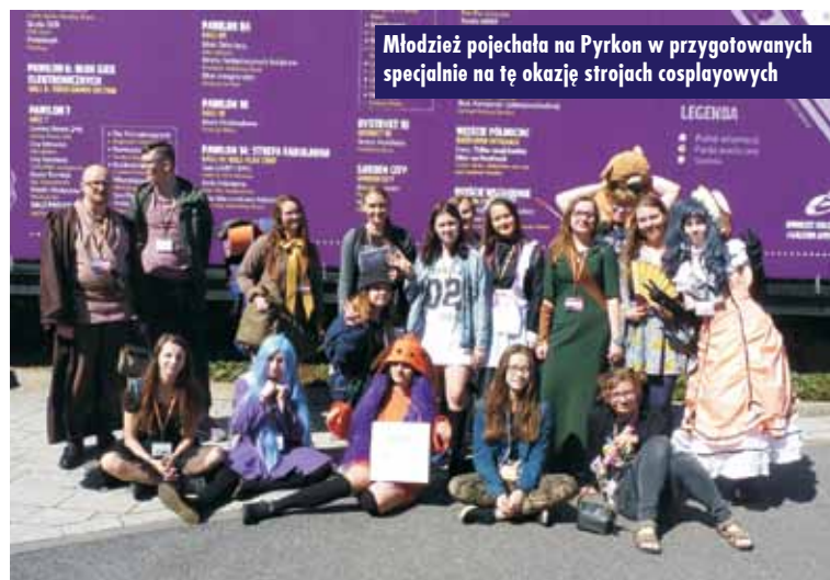
Młodzież pojechała na Pyrkon w przygotowanych specjalnie na tę okazję strojach cosplayowych

Od 18 do 20 maja 2018 r. grupa młodych ludzi z projektu „Magiczne szycie barwi twoje życie”, realizowanego przez Stowarzyszenie Kulturalne Euro-Art działające przy Powiatowej Bibliotece Publicznej w Kępnie, wzięła udział w Festiwalu Fantastyki Pyrkon w Poznaniu.