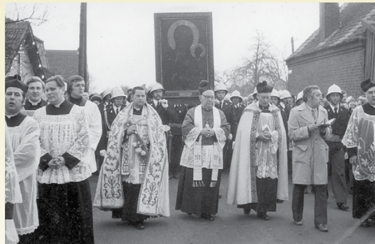
Drawsko uroczystości nawiedzenia obrazu Matki Boskiej Częstochowskiej w 1978 r.