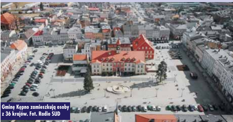
Gminę Kępno zamieszkują osoby z 36 krajów.

– Indii, 10 – Mołdawii, 8 – Nepalu, 6 – Holandii, 5 – Niemiec, 5 – Boliwii, 5 – Uzbekistanu, 4 – Włoch, 4 – Bangladeszu, 3 – Peru, 3 – Bhutanu, 2 – Kirgistanu, 2 – Sri Lanki, 2 – Pakistanu, 2 – Rosji, 2 – Wenezueli, 2 – Wietnamu, 1 – Austrii, 1 – Chin, 1 – Egiptu, 1 – Kazachstanu, 1 – Nigerii, 1 – Norwegii, 1 – RPA, 1 – Słowacji, 1 – Tunezji, 1 – Turk-