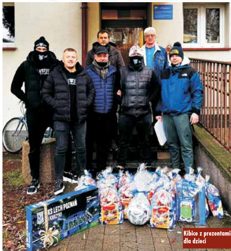
Kibice z prezentami dla dzieci

Jak co roku, w święta Bożego Narodzenia kibice z Fan Clubu Lecha Poznań odwiedzili Ostrzeszowski Dom Dziecka. Niebiesko-Biały Mikołaj obdarował dzieci tam mieszkające (28 osób) jak zawsze obfitymi podarunkami związanymi z chlubą Wielkopolski – Lechem Poznań. Oprócz słodczy znalazły się także okazjonalne, mikołajkowe szaliki „Kolejorza”. Wśród prezentów była też oryginalna piłka nożna z herbem Lecha, kalendarz na 2025 rok wykonany przez jednego z kibi-