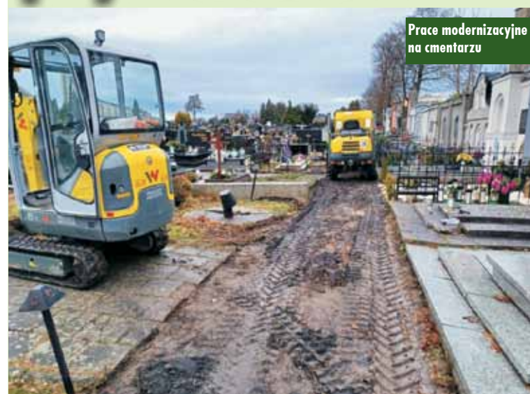
Prace modernizacyjne na cmentarzu

Rozpoczęły się prace na cmentarzu przy budowie nowego chodnika. Od ulicy Sienkiewicza i od ulicy Spółdzielczej zostanie położonych ponad 150 m 2 kostki. 8 stycznia br. pracownicy budowlani rozpoczęli też frezowanie 4 pni po usuniętych drzewach. - Niestety, przy okazji jest trochę nieporządku i bałaganu. Sukcesywnie będziemy go sprzątać