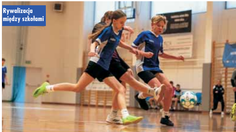
Rywalizacja między szkołami

Koncert w kościele pw. Miłosierdzia Bożego na Osiedlu Murator w Baranowie