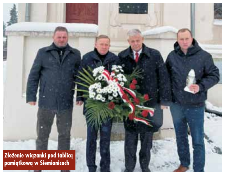
Złożenie wianki pod tablicą pamiątkową w Siemianicach