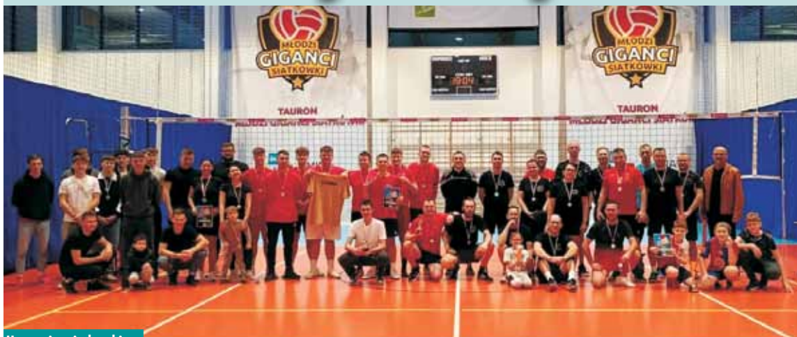
Uczestnicy siatkarskiego turnieju w Bralinie

W grudniu 2024 r. w hali sportowej w Bralinie odbyła się II edycja Siatkarskiego Turnieju Sołectw o Puchar Przewodniczącego Rady Gminy Bralin. Po blisko sześciu godzinach rywalizacji sołectkich drużyn i emocjonującym finale pomiędzy sołectwami Bralin i Tabor Wielki wyniki przedstawiały się następująco: pierwsze miejsce wywalczyło sołectwo Tabor Wielki, drugie zajęło sołectwo