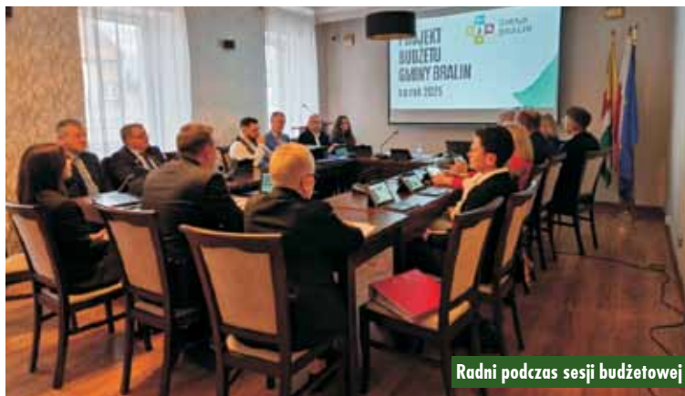
Radni podczas sesji budżetowej

Jasełka w Przedszkolu Samorządowym „Sosenka” w Rychtalu