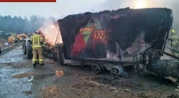
Spalita się maszyna rolnicza.

24 grudnia 2024 r., około godziny 7.00, do Stanowiska Kierowania Komendanta Powiatowego w Kępnie wpłynęło zgłoszenie o pożarze zabudowań gospodarczych w miejscowości Justynka. Na miejsce zdarzenia zadysponowano zastępy z Jednostki Ratowniczo-Gaśniczej w Kępnie, OSP Mroczeń, OSP Baranów, OSP Grębanin i OSP Nowa Wieś Książęca. Po dotarciu na miejsce zdarzenia