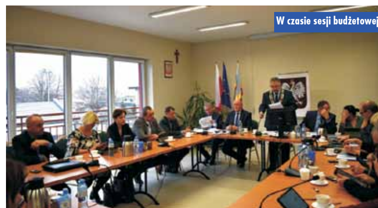
W czasie sesji budżetowej

publicznej w Laskach”, zaplanowane jest złożenie takiego wniosku na zadanie „Modernizacja pawilonu sportowego w Trzcinicy”. Doposażone i uzupełnione będą miejsca sportowe i rekreacyjne w Gminie Trzcinica, w tym plac zabaw w Piotrówie i Trzcinicy. Wyodrębniony został w budżecie Gminy Trzcinica fundusz sołecki w kwocie 273 399,09 zł. W ramach środków gminnych funduszu sołeckiego modernizowane będą Domy Ludowe w: Aniołce Pierwszej,