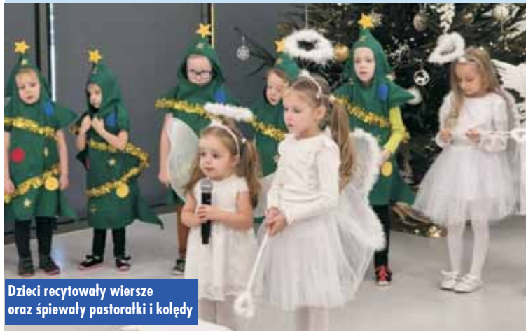
Dzieci recytowały wiersze oraz śpiewały pastoralki i kolędy