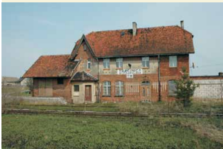
Trzcínica - budynek dworca

odcinek linii kolejowej – jakie obiekty uległy zagładzie, a jakim przywrócono dawną świetność.