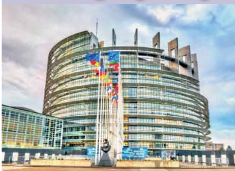
ANDŻELIKA MOŹDŻANOWSKA POSEŁ DO PARLAMENTU EUROPEJSKIEGO

Jest zielone światło od Parlamentu Europejskiego na uzgodnienia międzyinstytucjonalne w zakresie ustanowienia platformy na rzecz technologii strategicznych dla Europy („STEP”). - „Platforma Strategicznych Technologii dla Europy” ma pobudzić rozwój technologii cy-