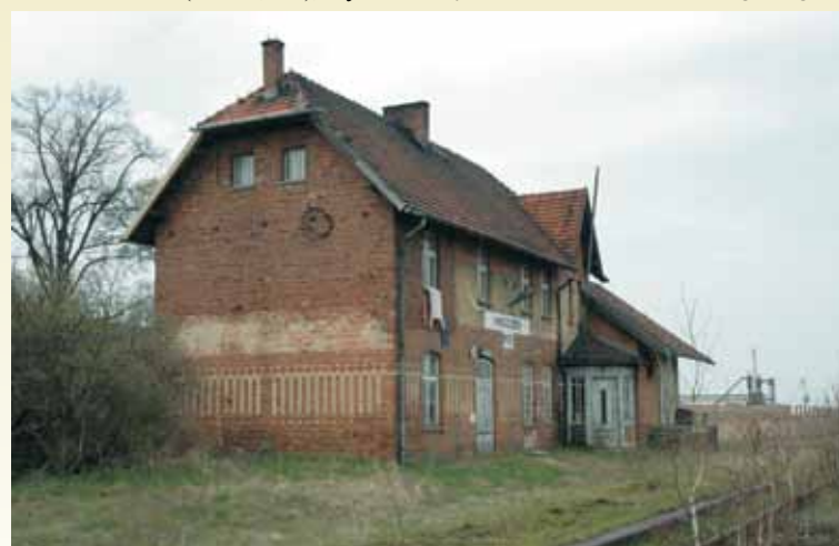
Mroczeń - budynek dworca

wzniesiona została z cegły. Elewacje dworców częściowo ceglane, częściowo otynkowane, są bogato zdobione geometrycznymi wzorami, tworzonymi w zestawieniu lica ceglanego i