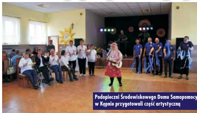
Podopieczni Środowiskowego Domu Samopomocy w Kępnie przygotowali część artystyczną

Wraz z podopiecznymi kępińskiego Środowiskowego Domu Samopomocy w Kępnie świętowali uczestnicy Domów z Ostrzeszowa, Odolanowa, Słupi pod Kępem, Chrościna i Opatowa.