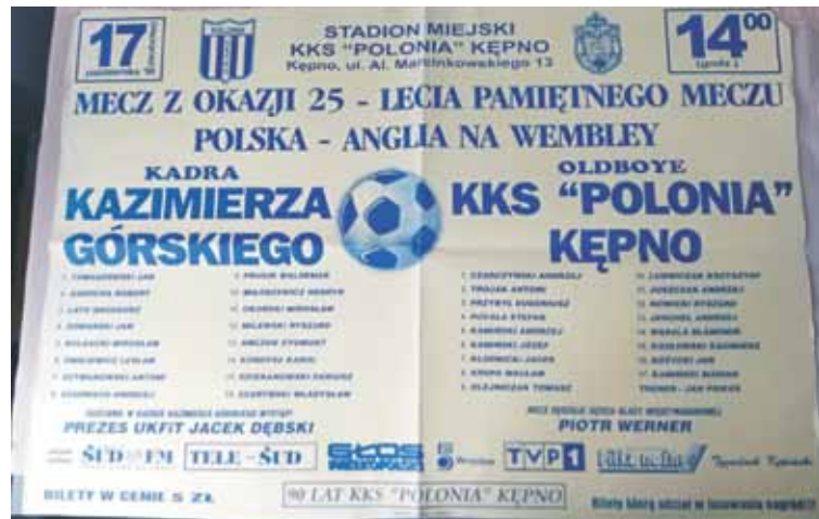
Plakat zapowiadający historyczny mecz

ne podkreślenia jest to, że właśnie w Kępnie pamiętano o wspaniałej rocznicy meczu na Wembley.