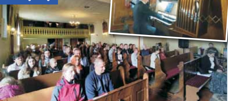
Wysłuchali pierwszego koncertu organowego

czalkowym, dzieło renomowanej firmy Kisselbach. Firma ta, jako rodzinny producent instrumentów muzycznych, od ponad 50 lat wyznacza standardy w branży, a organy produkowane przez nią z pewnością staną się dumą parafii i okolicznych mieszkańców.