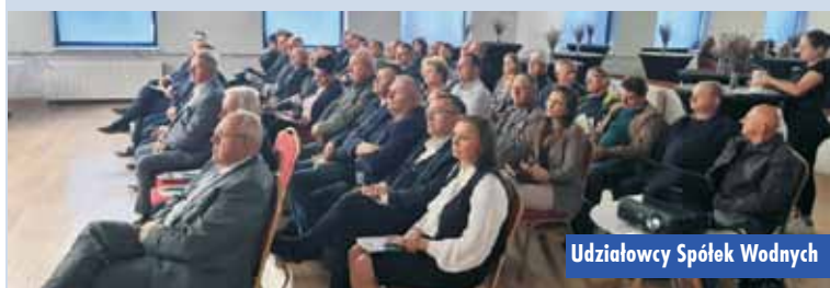
Udziałowcy Spółek Wodnych

go. Wydarzenie odbywające się w Kępnie było skierowane szczególnie do spółek działających na południu regionu, które realizują szereg prac związanych z utrzymaniem i zachowaniem w pełnej sprawności urządzeń wodnych oraz systemu melioracyjnego wielu obszarów. W forum uczestniczyło także wielu lokalnych włodarzy gmin i powiatów, którzy współpracują ze spółkami.