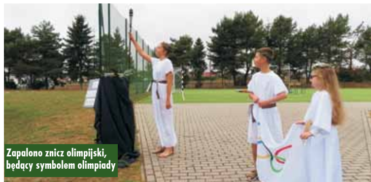
Zapalono znicz olimpijski, będący symbolem olimpiady

sportowcom za przybycie i rywalizację na wysokim poziomie, a opiekunom i nauczycielom wychowania