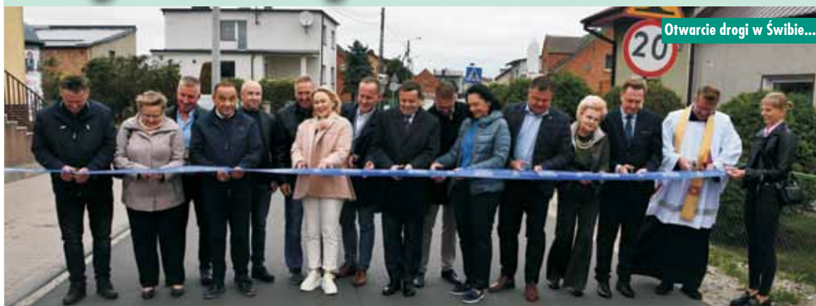
Otwarcie drogi w Świbie...