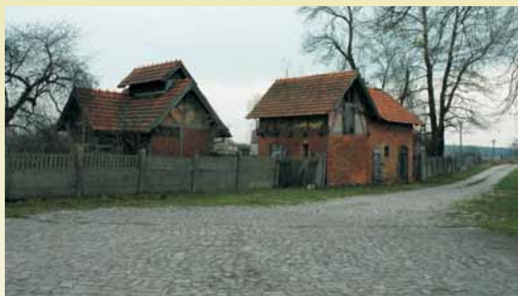
Mroczeń – szale i budynek gospodarczy

Jesteśmy niezmiernie ciekawi, jak obecnie wygląda wspomniany