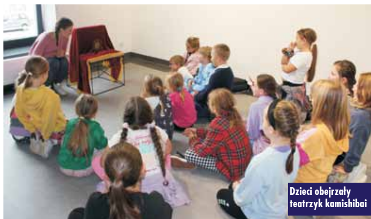
Dzieci obejrzały teatrzyk kamishibai

13 października 2023 r. w Zespole Szkół w Trzcinicy odbyły się uroczystości związane z Dniem Edukacji Narodowej