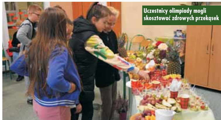
Uczestnicy olimpiady mogli skosztować zdrowych przekąsek

W trakcie olimpiady sportowej miała miejsce promocja zdrowego stylu życia, który jest podstawowym warunkiem funkcjonowania każdego sportowca. W tym celu uczniowie wraz z rodzicami utworzyli stoiska