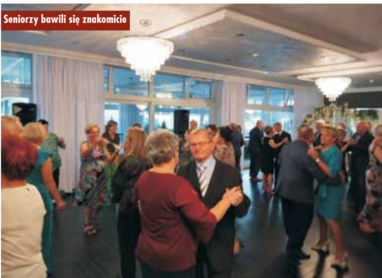
Seniorzy bawili się znakomicie

25-lecie Środowiskowego Domu Samopomocy w Kępnie