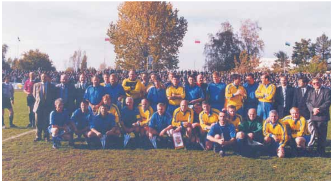
„Orły Górskiego” wraz z „Polonią” Kępno po meczu.

miesięcznika „Piłka Nożna”, „Głos Wielkopolski”, „Tygodnik Kępiński”, a mecz z kolei filmowała ekipa Telewizji Polskiej. Piłkarskie święto w Kępnie stało się faktem, rozpoczęło się od konferencji prasowej w klubowej świetlicy z naszymi „Orłami”,