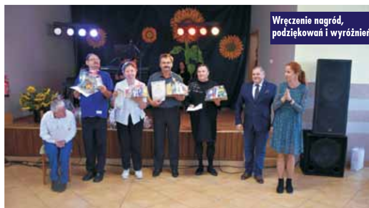
Wręczenie nagród, podziękowań i wyróżnień