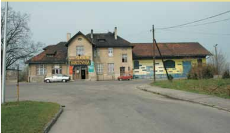
Kępno Zachodnie - budynek dworca

Artykuł Macieja Oscendy , który szczegółowo i wnikliwie opisał historię linii kolejowej Kępno-Rychtal-Namysłów, zamieszczony w „Tygodniku Kępińskim” (nr 40/1499 z dn. 05.10.2022 r. i nr 41/1500 z 12.10.2022 r.), przywołał wspomnienia sprzed około 20 lat, kiedy to prowadziliśmy badania historyczno-konserwatorskie na temat stanu zachowania i wartości zabytkowych oraz architektonicznych obiektów kolejowych na terenie województwa wielkopolskiego. Wśród podjętych obszarów badań znalazła się nieczynna już wówczas linia kolejowa nr 307. Badania były prowadzone na terenie województwa wielkopolskiego na odcinku Kępno-Rychtal.