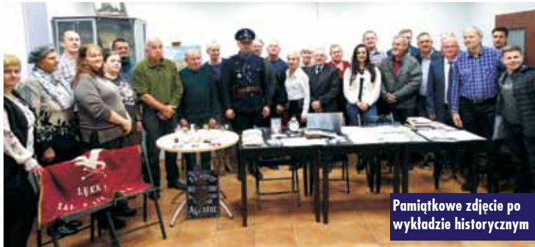
Pamiątkowe zdjęcie po wykładzie historycznym

8 października 2023 r. 25-osobowa grupa dzieci z terenu gminy Łęka Opatowska wybrała się na bezpłatną wycieczkę do Teatru Lalek we Wrocławiu na spektakl pt. „Pinokio”