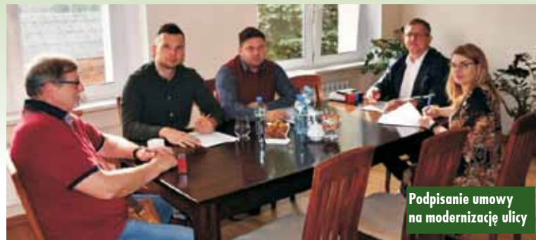
Podpisanie umowy na modernizację ulicy