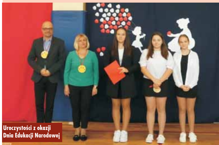
Uroczystości z okazji Dnia Edukacji Narodowej