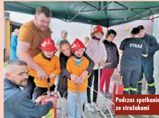
Podczas spotkania ze strażakami