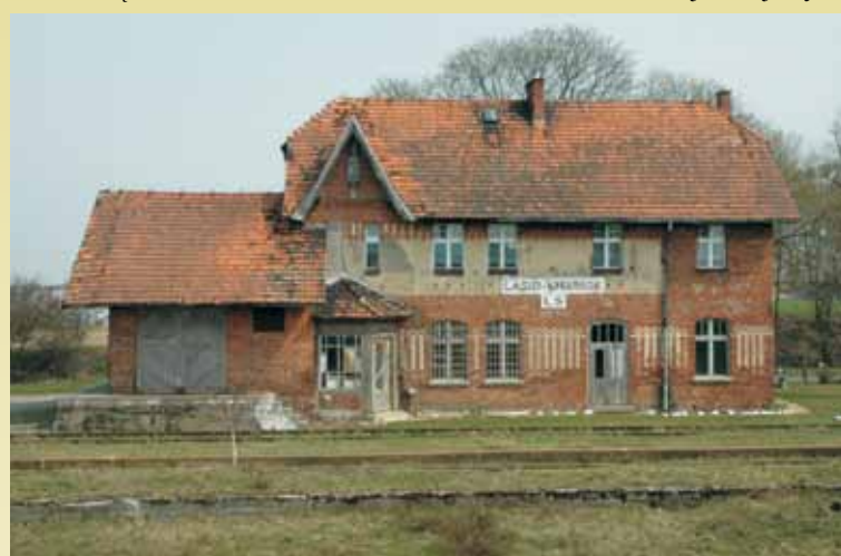
Łaski Smardze – budynek dworca

metrażu. Kilometraż linii kolejowej umieszczany jest na słupkach hektometrycznych wzdłuż linii kolejowej. Stacje kolejowe są oznaczane z dokładnością 1 m.