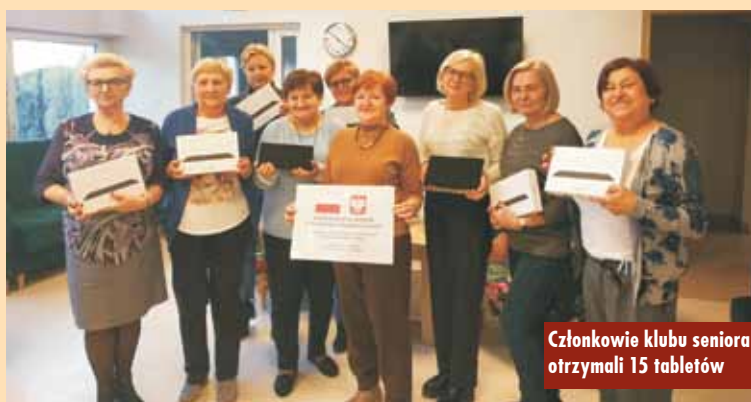
Członkowie klubu seniora otrzymali 15 tabletek