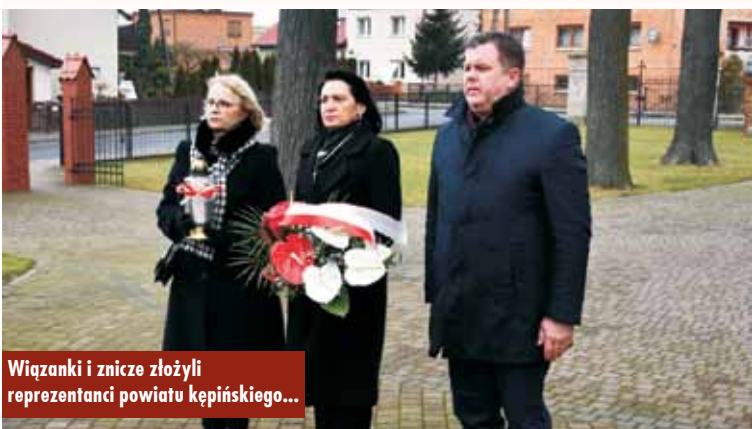
Władze powiatu kępińskiego składają kwiaty pod pomnikiem.

Delegacja władz samorządowych Kępna złożyła kwiaty również w waż-