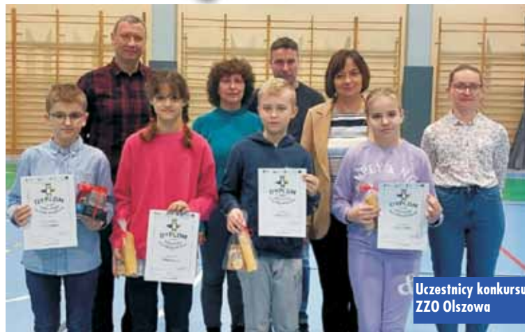
Uczestnicy konkursu ZZO Olszowa

Celem konkursu było zwiększenie świadomości ekologicznej wśród młodzieży gospodarowaniem odpadami i pokazanie jak segregować śmieci. W konkursie w kategorii II dla klas IV- VIII „Eko-rymy dla środowiska”, ważne było, aby przekazane prace były zgodne z tematem, wskazaną formą wiersza i charakteryzowały się ciekawym pomysłem.