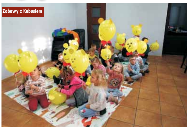
Zabawy z Kubusiem

- Opowiadania z Puchatkiem w prosty sposób uczą wielu życiowych mądrości, pokazują, że warto