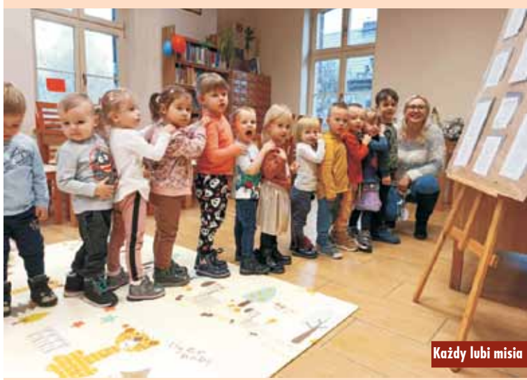
Każdy lubi misia

Na początku spotkania maluszki wysłuchały przygody Misia Tulisia pt.: „Kochamy Cię Misiu Tulisiu”.