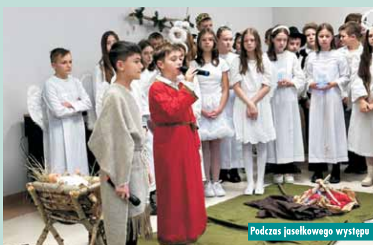
Podczas jasełkowego występu

Rocznica powrotu Ziemi Bralińskiej do macierzy