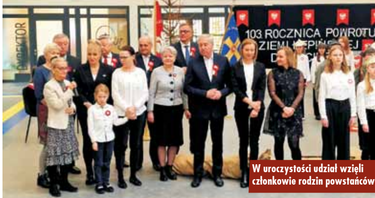
W uroczystości udział wzięli członkowie rodzin powstańców

Uczniowie kółka teatralnego „Głośnia ciska” i zespołu wokalo-instrumentalnego zaprezentowali część artystyczną. Wymownym momentem przedstawienia teatralnego był udział w finale sztuki zgromadzonych gości. Z entuzjazmem zamienili swoją radość i dumę z bycia Wielkopolaninem poprzez wypowiedzenie pięknego zdania: „Jestem potomkiem powstańca wielkopolskiego”. Nad całością przed-