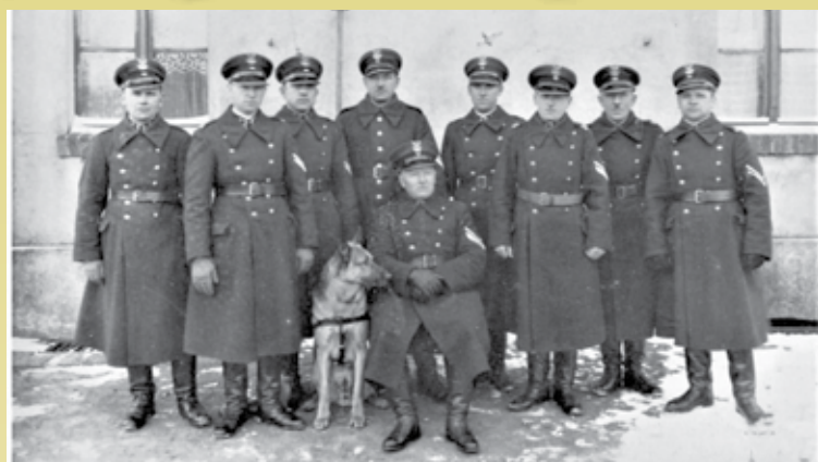
Obsada Placówki Straży Granicznej i linii w Siemianicach. Ok. 1935 rok