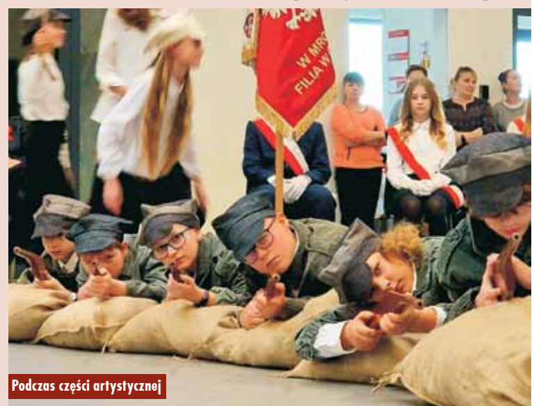
Podczas części artystycznej