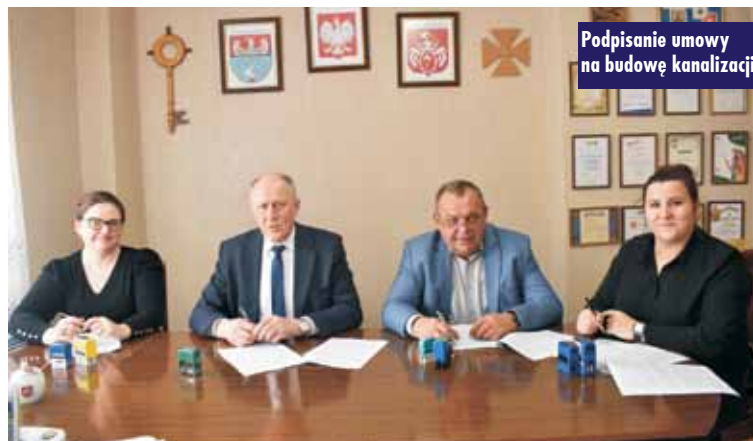
Podpisanie umowy na budowę kanalizacji