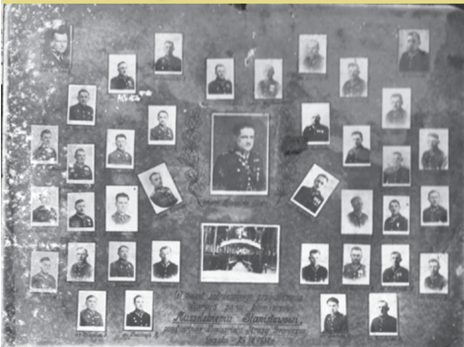
Pamiątkowa tablica Strażników Granicznych z Lasek, którzy we wrześniu 1937 roku zostali przeniesieni z Lasek do Łęki Opatowskiej.