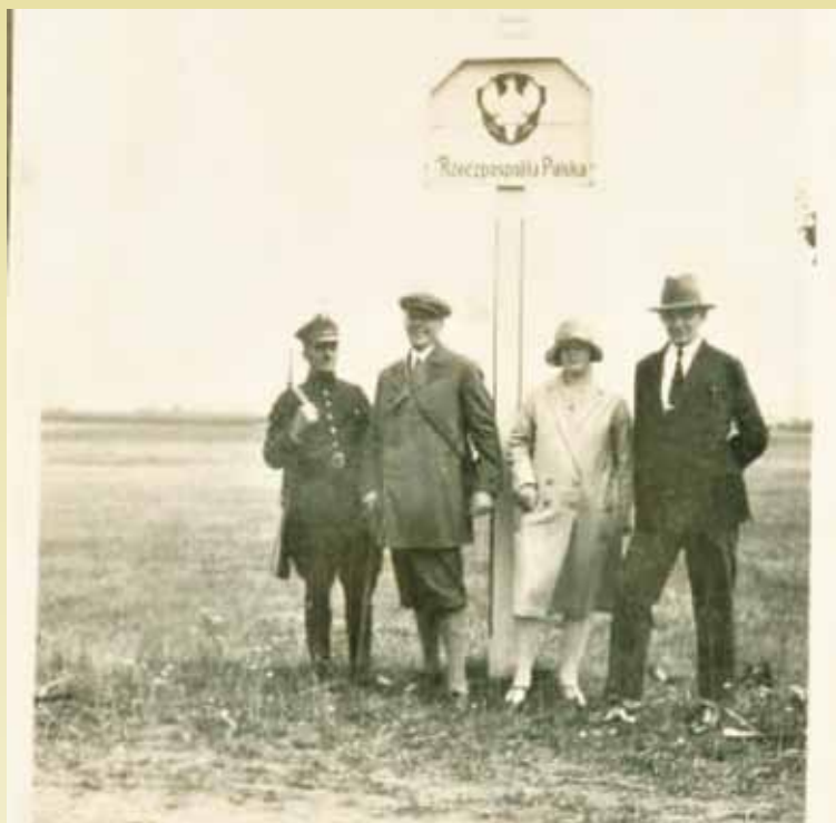
Pamiątkowe zdjęcie przy przejściu granicznym (obok słupa granicznego) Siemianice - Kostów (Kostów)