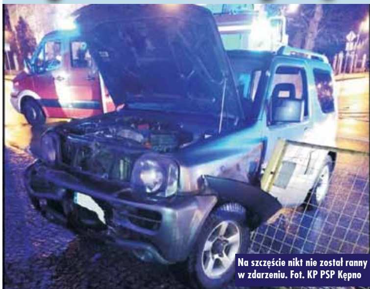
Na szczęście nikt nie został ranny w zdarzeniu.