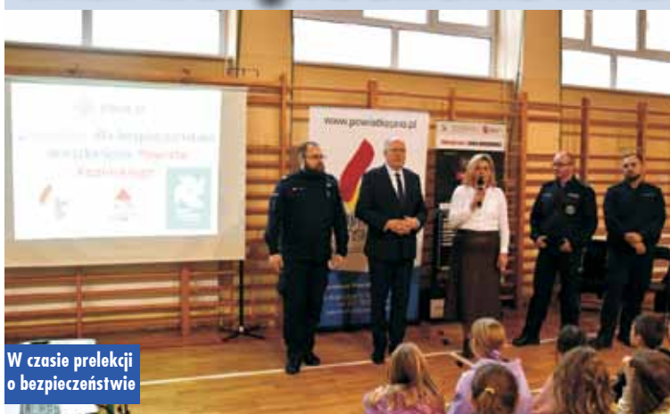
W czasie prelekcji o bezpieczeństwie

W Szkole Podstawowej w Laskach oraz w Szkole Podstawowej Trzcinicy odbyły się zajęcia w ramach projektu „Wspólnie dla bezpieczeństwa mieszkańców Powiatu Kępińskiego”. Funkcjonariusze KPP w Kępnie oraz KP PSP w Kępnie przeprowadzili warsztaty.