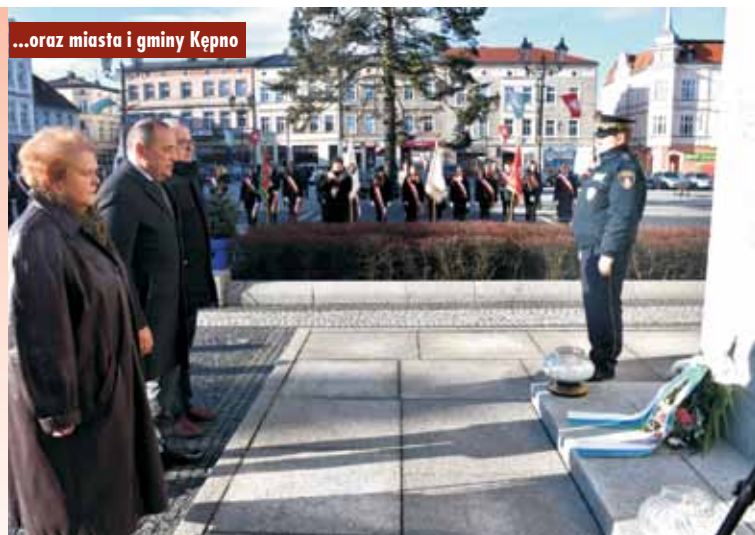
...oraz miasta i gminy Kępno

nych miejscach pamięci, związanych z 17 stycznia 1920 r.: pomnikiem upamiętniającym Bitwę pod Korzeniem 19 lutego 1919 r., pomnikiem przy