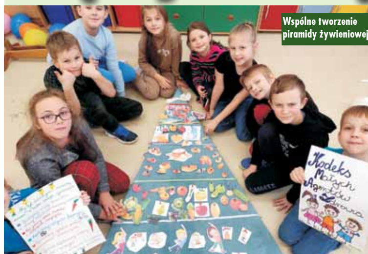
Wspólne tworzenie piramidy żywieniowej

Za uczniami Zespołu Szkół w Perzowie I etap ogólnopolskiego projektu „Zdrowo jem, więcej wiem”, w ramach którego odbyły się zajęcia edukacyjne oraz działania promujące korzyści jedzenia warzyw i owoców.