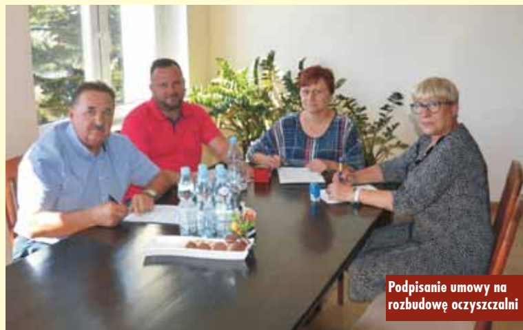
Podpisanie umowy na rozbudowę oczyszczalni

Termin realizacji to 28 miesięcy od dnia zawarcia umowy. Oprac. m