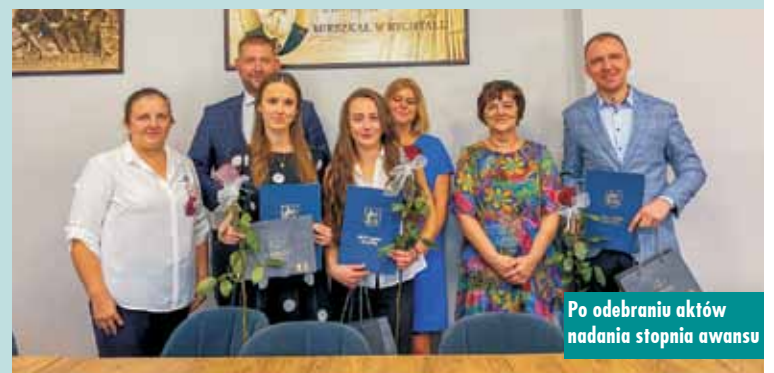
Po odebraniu aktów nadania stopnia awansu

Serdecznie gratulujemy i życzymy satysfakcji z pracy w zawodzie nauczyciela! Oprac. KR