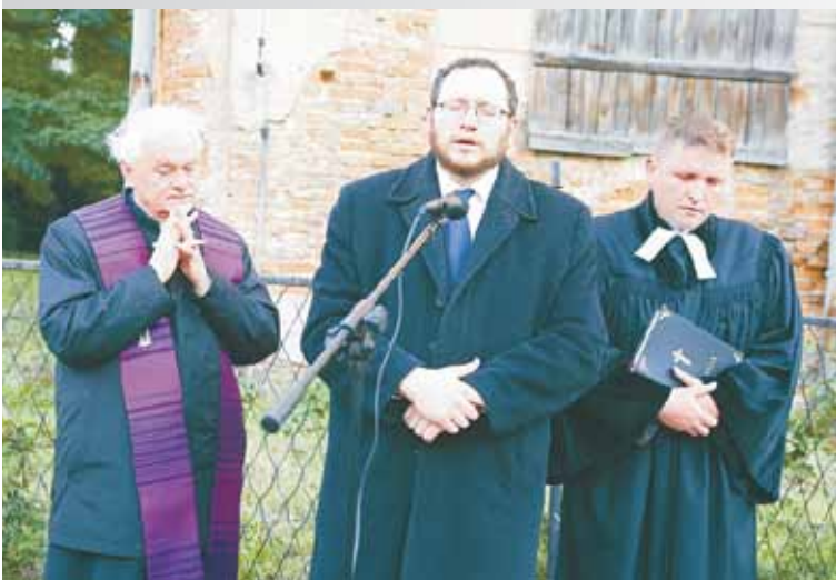
Pierwsza w historii miasta modlitwa trzech duchownych za zmarłych chrześcijan i Żydów