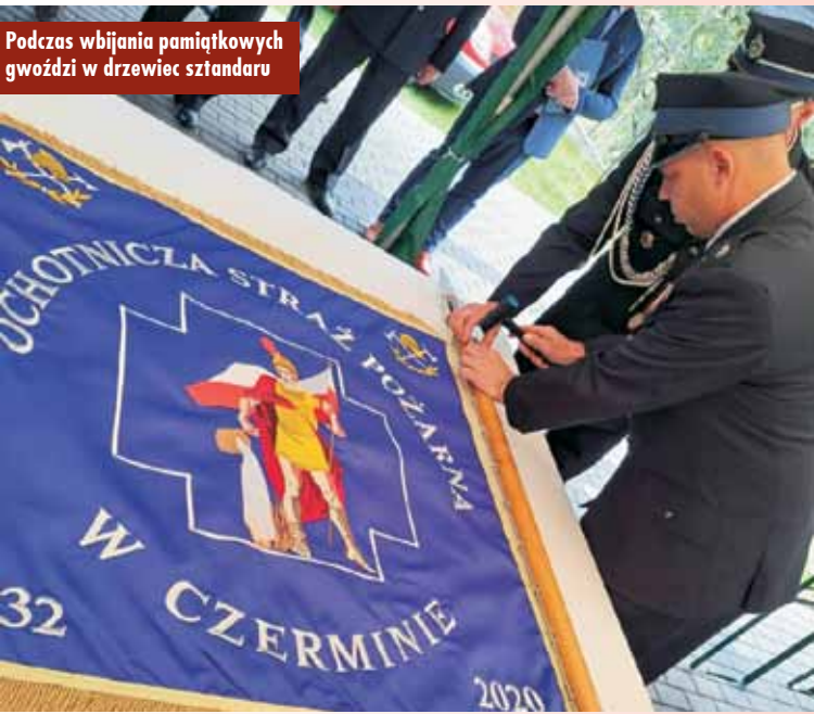
Podczas wbijania pamiątkowych gwoździ w drzewiec sztandaru