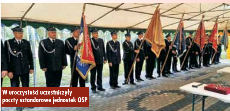
W uroczystości uczestniczyły poczty sztandarowe jednostek OSP