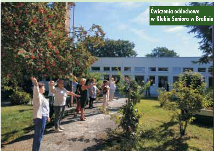
Ćwiczenia oddechowe w Klubie Seniora w Bralinie

kontrolowania oddechu, który ma być spokojny i miarowy, a także na zmniejszaniu jego głębokości oraz objętości oddechowej. W trakcie takich ćwiczeń wykonuje się również wstrzymywanie oddechu. Wszystko to ma służyć temu, żeby nie wyprowadzać z organizmu w zbyt dużych ilościach dwutlenku węgla. Dąży się też do osiągnięcia paury kontrolnej, czyli naturalnego wstrzymania po-