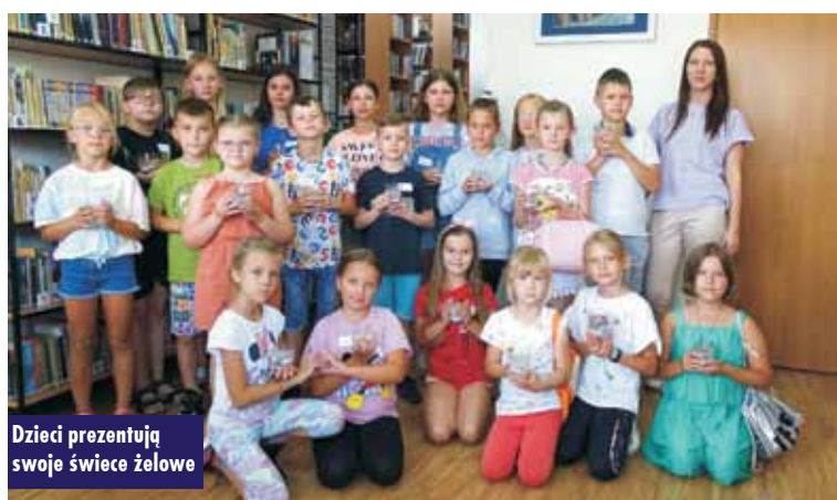
Dzieci prezentują swoje świece żelowe

nych słoiczkach. Do ich stworzenia wykorzystali dodatki w postaci