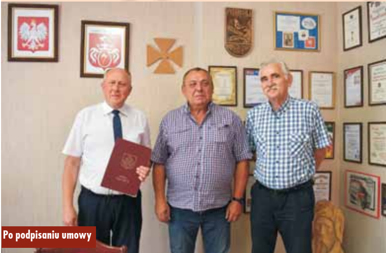
Po podpisaniu umowy

Wykonawcą będzie Konsorcjum: Przedsiębiorstwo Budownictwa Inżynierii „EKO - INŻYNIERIA” Sp. z o.o (Lider Konsorcjum) i Przedsiębiorstwo Produkcyjno Handlowo Usługowe „Inkadro” Sp. z o.o. Wartość całkowita zadania to 3 464 671,01 zł, z czego 3 291 437,45 zł, czyli 95%, pochodzi z Programu Rządowy Fundusz Polski Łód: Program Inwestycji Strategicznych. Gmina Trzcinica otrzymała promesę z Rządowego Funduszu Polski Łód: