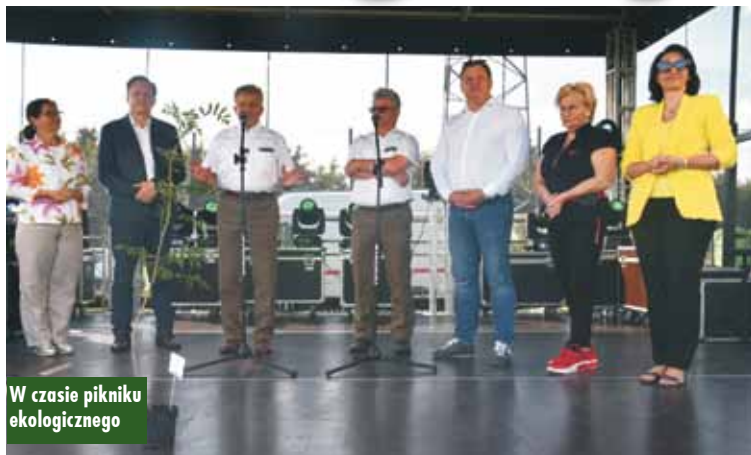
W czasie pikniku ekologicznego

Na profilu facebookowym znaleźć można filmik instruktażowy, obrazujący prawidłowy sposób sadzenia drzewek. Oprac. m