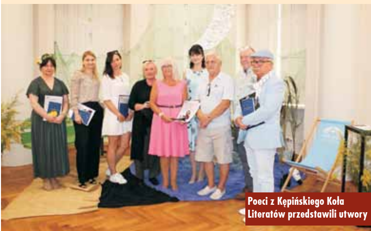
Poeci z Kępińskiego Koła Literatów przedstawili utwory