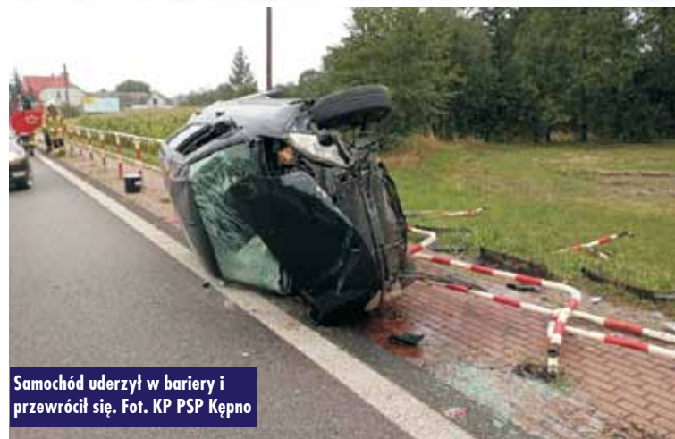
Samochód uderzył w bariery i przewrócił się.