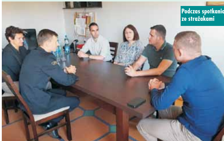
Podczas spotkania ze strażakami

Goście z Encs spotkali się ponadto z seniorami w Klubie Seniora i Centrum Wsparcia Opiekunów. Seniorzy zaprezentowali swoją artystyczną aktywność, zaprosili również gości do wspólnych rozgrywek tenisa stołowego. Wspólnie spędzony czas i gościnność seniorów sprawiły, że były to miłe spotkania.