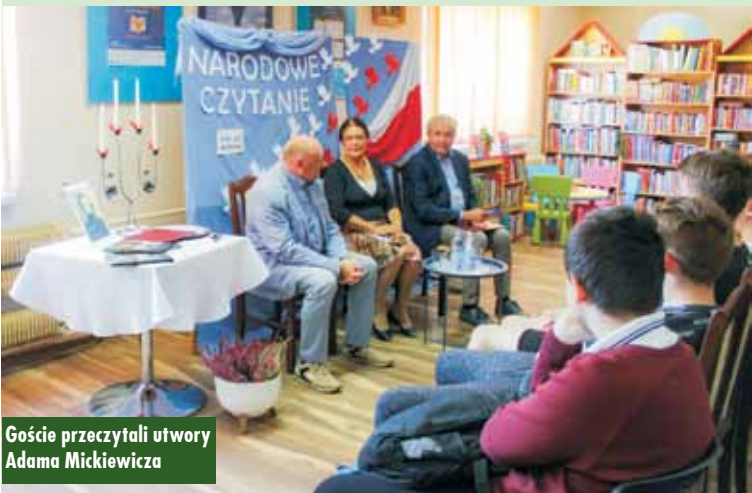
Goście przeczytali utwory Adama Mickiewicza