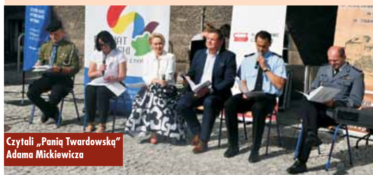
Czytali „Panią Twardowską” Adama Mickiewicza