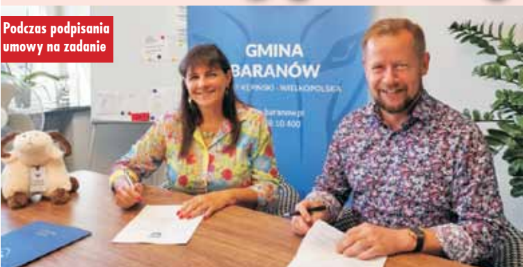
Podczas podpisania umowy na zadanie

O rozbudowie swojej siedziby druhowie z OSP Grębanin marzyli od dawna. Wielkimi krokami zbliża się jubileusz 95-lecia ich jednostki. - Istotą tej inwestycji będzie rozbudowa budynku, w wyniku czego powstanie sala zebrań oraz wydzielone zostanie zaplecze higieniczno-sanitarne – tłumaczy