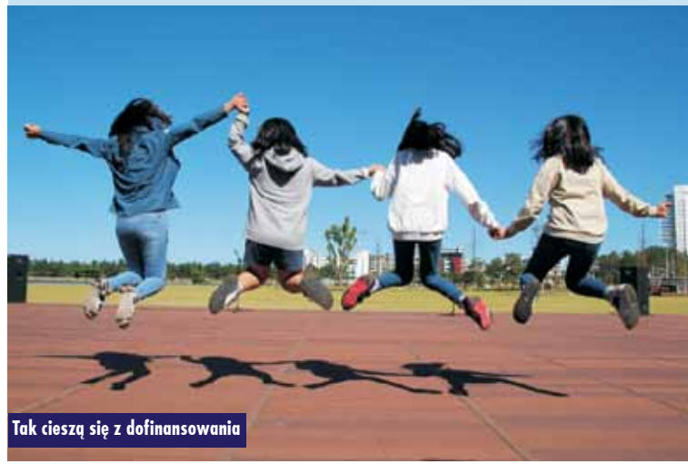
Tak cieszą się z dofinansowania

Podpisano umowę na remont drogi w Piaskach