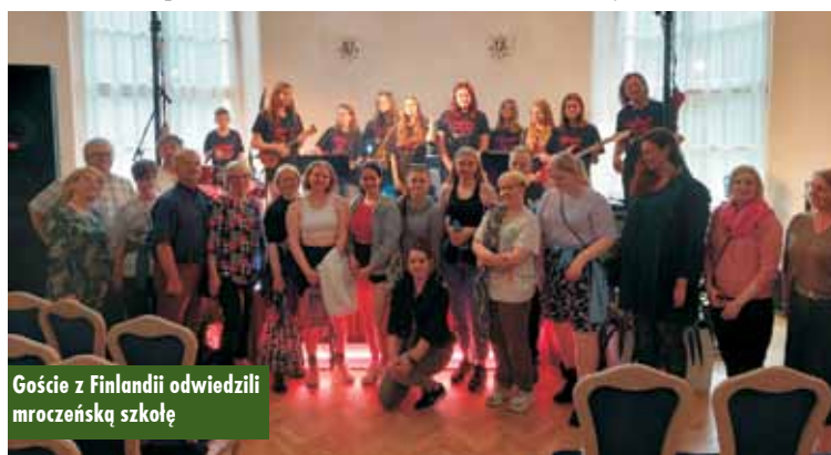
Goście z Finlandii odwiedzili mroczeńską szkołę

Na nieużytkowanej powierzchni rolniczej w Słupi pod Bralinem znajdowało się 8 beczek z nieznaną substancją