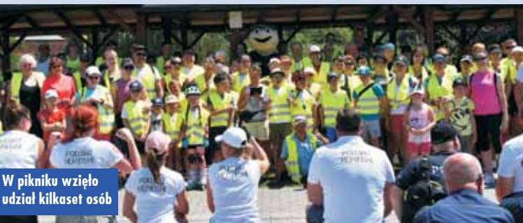
W pikniku wzięło udział kilkaset osób

Do jej organizacji obok strażaków i policjantów z Kępna włączyli się również funkcjonariusze z Poznania i Konina.