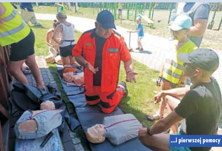
...i pierwszej pomocy

często poparta alkoholem lub innymi substancjami psychoaktywnymi może mieć zgubne skutki.