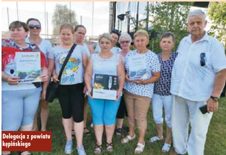
Delegacja z powiatu kępińskiego

Izby Rolniczej, sztandar Związku Hodowców Koni, Polskiego Związku Pszczelarskiego. Mieli także swój sztandar sołtysi. W programie było bardzo wiele atrakcji. Wśród nich biesiada z kawką na talerzu, oddanie do użytku kaczego bajorka, turniej zrywania kaczora i konkurs powożenia bryczką. Następnie wystąpiła gwiazda poznańskiej operetki Kata-