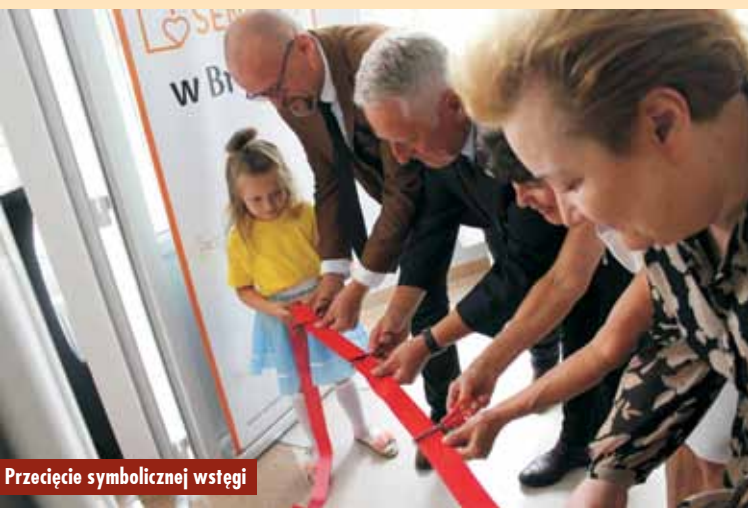
Przecięcie symbolicznej wstęgi

Zadanie współfinansowane jest w ramach Programu wieloletniego „Senior+” na lata 2021-2025. Oprac. KR