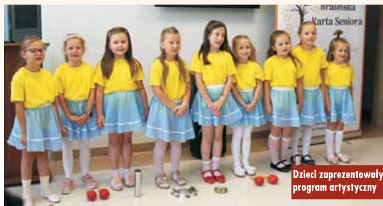
Dzieci zaprezentowały program artystyczny

dziękował wszystkim zaangażowanym w powstanie placówki. Odniósł się także do kierunków i rozwoju polityki senioralnej, karty seniora funkcjonującej na terenie gminy oraz współpracy z Kołem Polskiego Związku Emerytów, Rencistów i In-