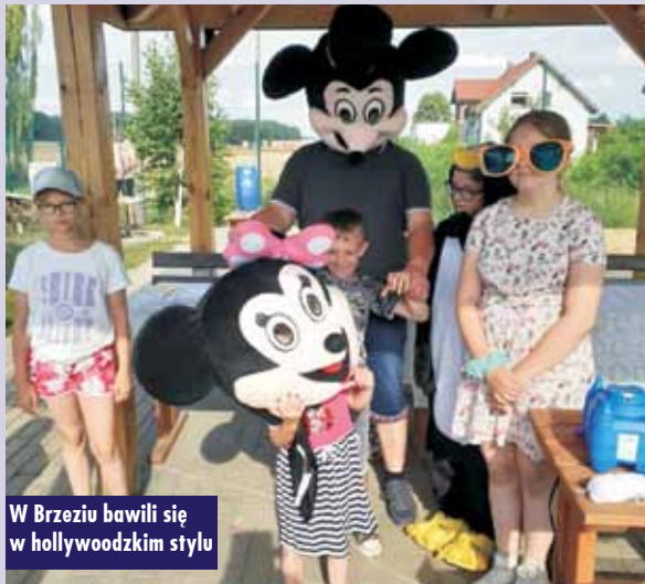
W Brzeziu bawili się w hollywoodzkim stylu