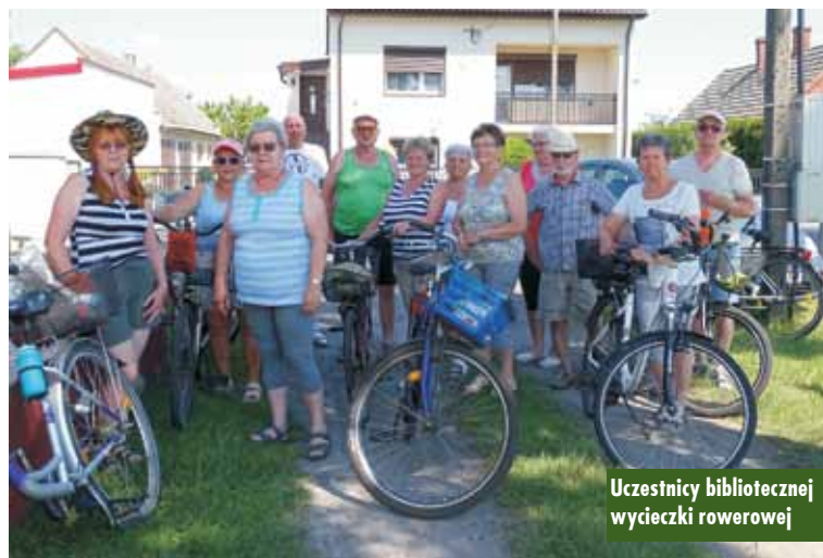
Uczestnicy bibliotecznej wycieczki rowerowej

Dotacja dla Biblioteki w Opatowie z Fundacji PZU