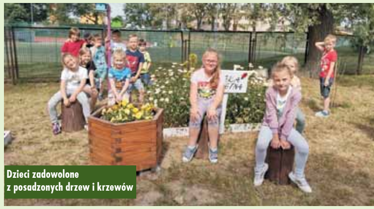
Dzieci zadowolone z posadzonych drzew i krzewów

WIEŚCI ZNAD POMIANKI lipiec 2022, nr 27 (1067)