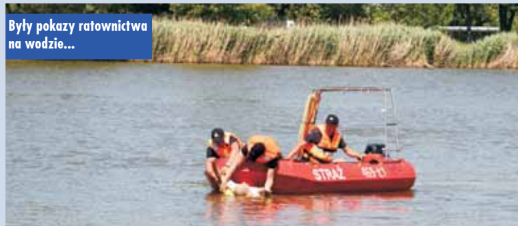
Były pokazy ratownictwa na wodzie...

Celem tego elementu było wskazanie, jak łatwo może dojść do sytuacji niebezpiecznych przy zbiornikach wodnych. Jak podkreślali strażacy brawura