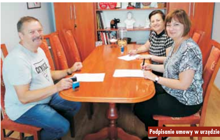
Podpisanie umowy w urzędzie

Inwestycja będzie polegała na przebudowie sieci wodociągowej metodą przewiertu sterowanego. Wodo-