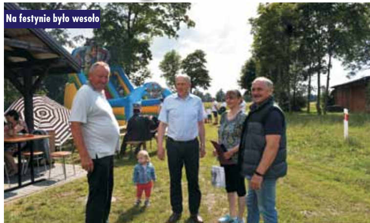
Na festynie było wesoło