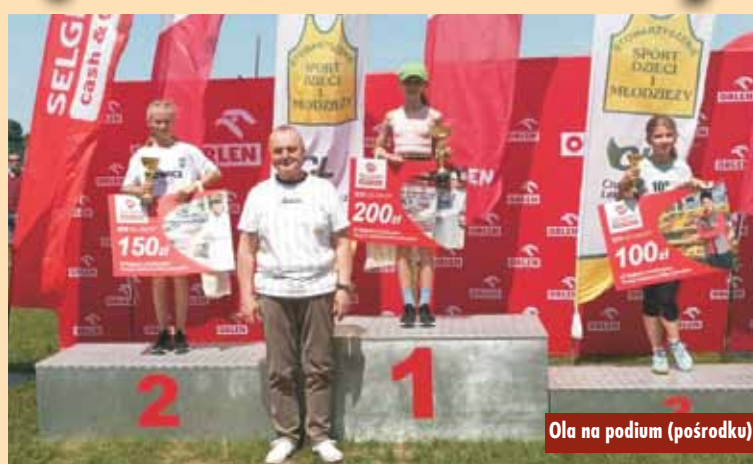
Ola na podium (pośrodku)

W powiecie kępińskim gościła grupa młodzieży z Finlandii z regionu Ostrobothnia