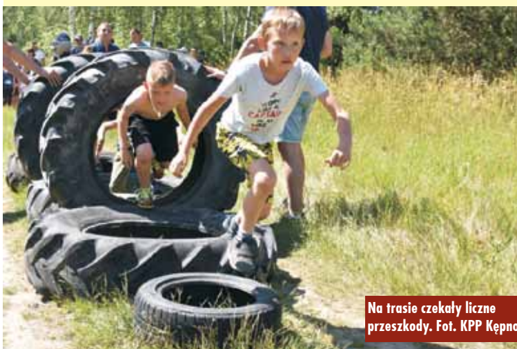
Na trasie czekały liczne przeszkody.