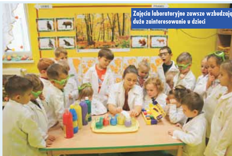
Zajęcia laboratoryjne zawsze wzbudzają duże zainteresowanie u dzieci

Czas spędzony w „moim” przedszkolu wspominam bardzo miło. Stało się ono dla mnie drugim domem, w którym zawsze panowała miła atmosfera. Siostry, nauczyciele i inni pracownicy w każdej sytuacji wykazywali się ciepłem, serdecznością, a co najważniejsze – empatią. Zawsze witano i żegnano nas z wielkim