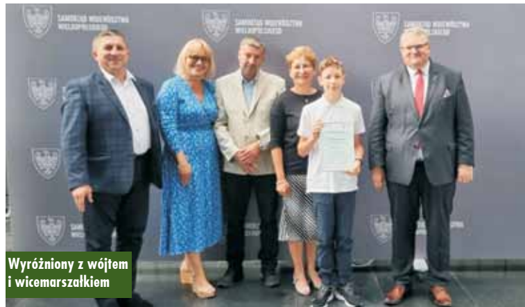
Wyróżniony z wójtem i wicemarszałkiem

nia odnawialnych źródeł energii, efektywności energetycznej, racjonalnego wykorzystania energii oraz