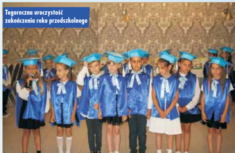
Tegoroczna uroczystość zakończenia roku przedszkolnego

Wielkie zaangażowanie zarówno ze strony sióstr jak i pracowników przyczyniło się do znacznego rozwoju tej placówki. Myślę, że to jednak