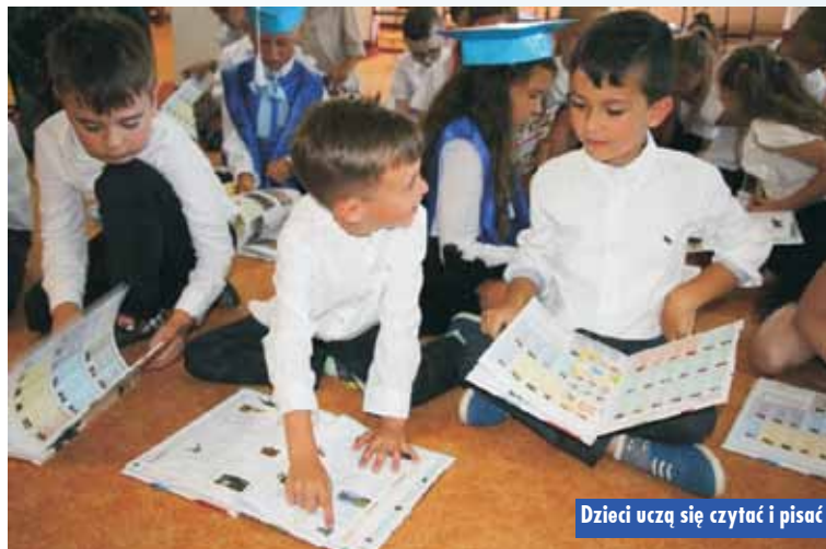
Dzieci uczą się czytać i pisać

przedszkolakami, a od lat niektórzy z nich, będąc już rodzicami, wracają do nas ze swoimi pociechami. Co cieszy jeszcze bardziej i daje dobre rekomendacje placówce to to, że nasi przedszkolacy wracają po latach, by rozpocząć, np. praktyki studenckie bądź zostać pracownikami i służyć następnym pokoleniom. Osobiście mam przyjemność pracować z naszymi przedszkolakami.