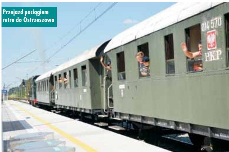
Przejazd pociągiem retro do Ostrzeszowa

W programie niedzielnego wydarzenia znalazł się koncert Kolejowej Orkiestry Dętej z Piotrkowa Trybunalskiego. W międzyczasie podziwiać można było wystawę przedmiotów związanych z koleją. - Ekspozycję na wystawę wypożyczyliśmy od rodzin kolejarzy oraz z Kolejowej Izby Tradycji im. Marka Plóciennika z Ostrowa Wielkopolskiego – mówi prezes. Ogromnym zainteresowaniem cieszył się przejazd pociągiem retro do Ostrzeszowa, prowadzony przez Klub Sympatyków Kolei z Wrocławia. - Z tej atrakcji skorzy-