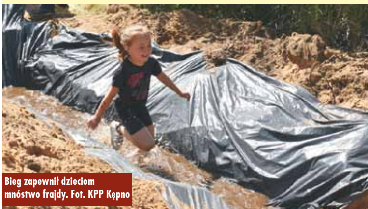
Bieg zapewnił dzieciom mnóstwo frajdy.