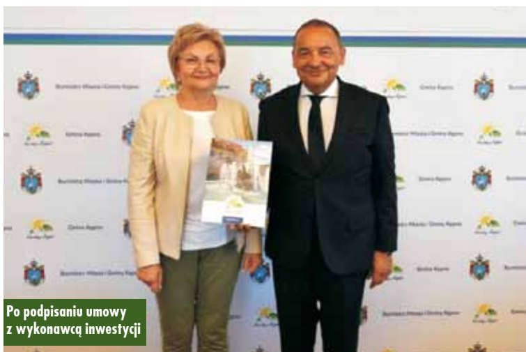
Po podpisaniu umowy z wykonawcą inwestycji

W miejscowości Jankowy odbyła się 3. edycja Ekstremalnego Biegu Terenowego z Przeszkodami dla dzieci z powiatu kępińskiego. Organizatorem biegu było Stowarzyszenie Kobiet Aktywnych Gminy Baranów oraz Komenda Powiatowa Policji w Kępnie