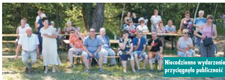
Niecodzienne wydarzenie przyciągnęło publiczność