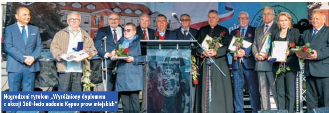
Nagrodzeni tytułem „Wyróżniony dyplomem z okazji 360-lecia nadania Kępnu praw miejskich”

pospolitej Polskiej w 2000 r., na 10-lecie odrodzenia polskiego samorządu terytorialnego. Data obchodów to, oczywiście, 27 maja. Idea odbudowy w naszym kraju autentycznego samorządu i utworzenia niezależnych władz terytorialnych była możliwa dopiero po 1989 r. W odrodzonej Polsce rozpoczął się wówczas proces reformowania ustroju państwa, decentralizacji władzy i stopniowego przekazywania jej w ręce obywateli. Sejm Rzeczypospolitej Polskiej, ustanawiając święto samorządu terytorialnego, wyraził uznanie i szacunek wszystkim osobom, które przyczyniły się do jego powstania i działalności.