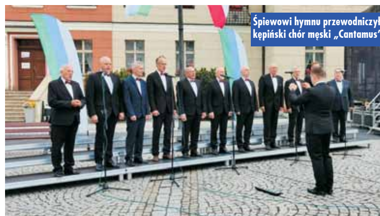
Śpiewowi hymnu przewodniczył kępiński chór męski „Cantamus”

rzy Trzmiel – przypomniał P. Psikus. - Samorząd terytorialny został wyposażony w majątek, tzw. mienie komunalne, ustalone zostały źródła dochodu samorządu i rozpoczął się stopniowy proces zmian naszej rzeczywistości. Gmina wzięła odpowiedzialność za instytucje oświaty i pomocy społecznej, organizację ładu