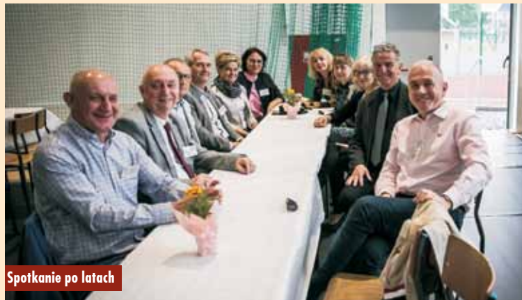
Spotkanie po latach

Po części oficjalnej niemal 500-set uczestników i gości przemieściło się na zasłużony obiad do dwóch kępińskich restauracji - „La Costa” i „Kamiński”. Następne punkty programu to zwiedzanie szkoły i spacer