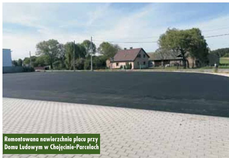
Remontowana nawierzchnia placu przy Domu Ludowym w Chojeńcinie-Parcelach

Zakres robót budowlanych obejmuje demontaż pozostałości po fundamencie opłotowania oraz demontaż krawężników, wykonanie nawierzchni parkingu, jezdni, zjazdów, odwodnienia nawierzchni oraz wyprofilowanie i umocnienie poboczy kamieniem łamanym. Termin oddania prac zaplanowany został na drugą połowę sierpnia br. Oprac. KR