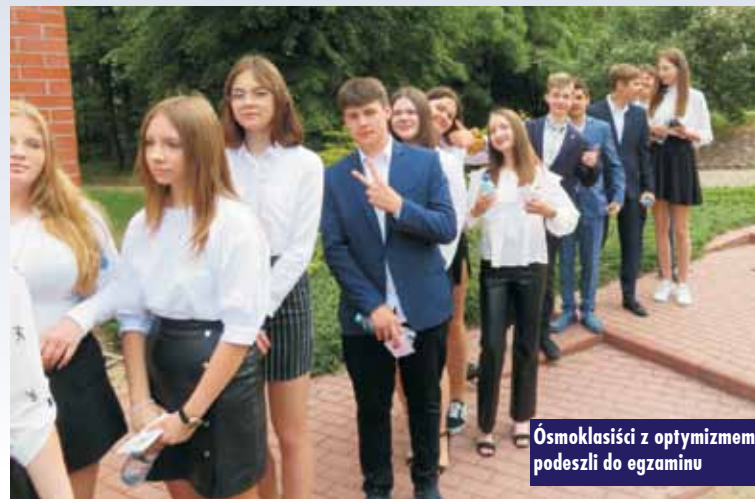
Ósmoklasiści z optymizmem podeszli do egzaminu

Stresu związanego z egzaminami nie mieli pozostali uczniowie klas 1-7. Co więcej, sprawił im sporo radości,