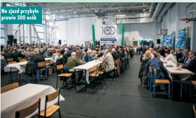
Na zjazd przybyło prawie 500 osób