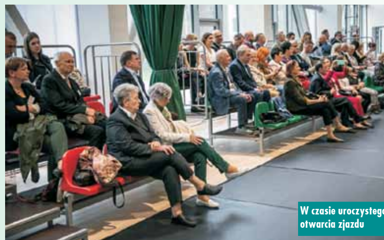
W czasie uroczystego otwarcia zjazdu

Wszyscy byli uczniowie, którzy skorzystali z zaproszenia na VII Zjazd Absolwentów, po latach mieli możliwość zaśpiewania hymnu szkoły i „Pieśni o sztandarze”. Podniosła część uroczystości było symboliczne wbijanie gwoździ do drzewca sztandaru przez fundatorów; osoby prywatne – absolwentów oraz przedsiębiorców – absolwentów oraz przekazanie nowego sztandaru obecnym uczniom liceum, którzy odtąd będą go bronić i godnie się nim opiekować.