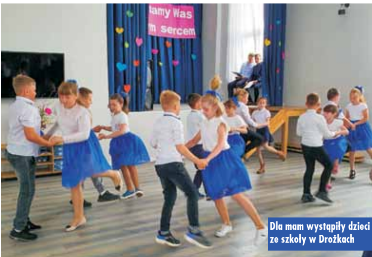
Dla mam wystąpiły dzieci ze szkoły w Drożkach

Spektakl teatralny „Magiczna księga” w Gminnej Bibliotece Publicznej w Rychtalu