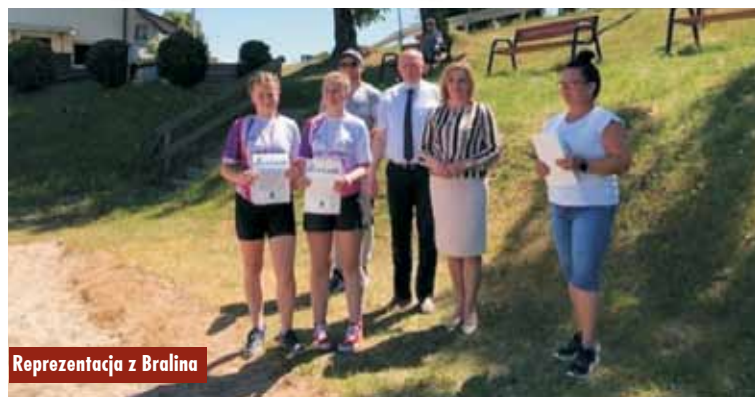
Reprezentacja z Braliny

„Remont nawierzchni placu przy Domu Ludowym w Chojeńcinie-Parcelach” w ramach zadania „Modernizacja Domu Ludowego w Chojeńcinie wraz z zagospodarowaniem terenu przyległego”