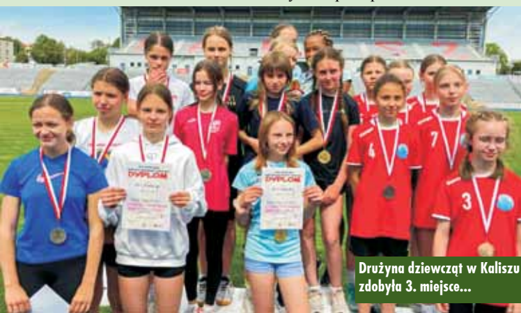
Drużyna dziewcząt w Kaliszu zdobyła 3. miejsce...