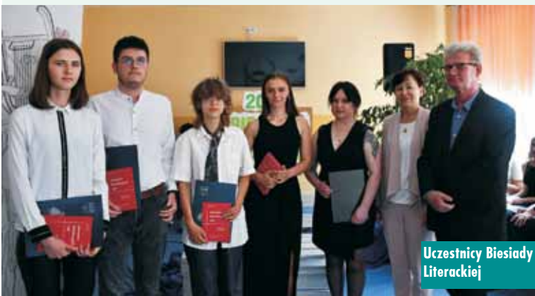
Uczestnicy Biesiady Literackiej