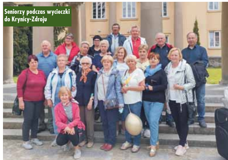
Seniorzy podczas wycieczki do Krynicy-Zdroju