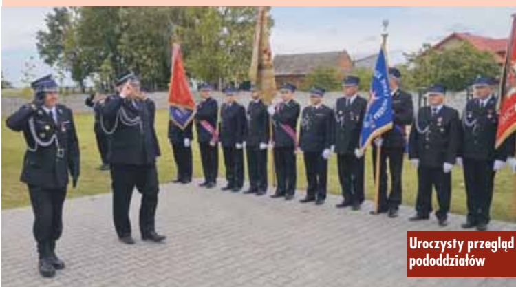
Uroczysty przegląd pododdziałów

mochodu oraz składali życzenia wszystkim strażakom z okazji ich święta, jednocześnie dziękując za służbę pełnioną na rzecz bezpieczeństwa mieszkańców. KR