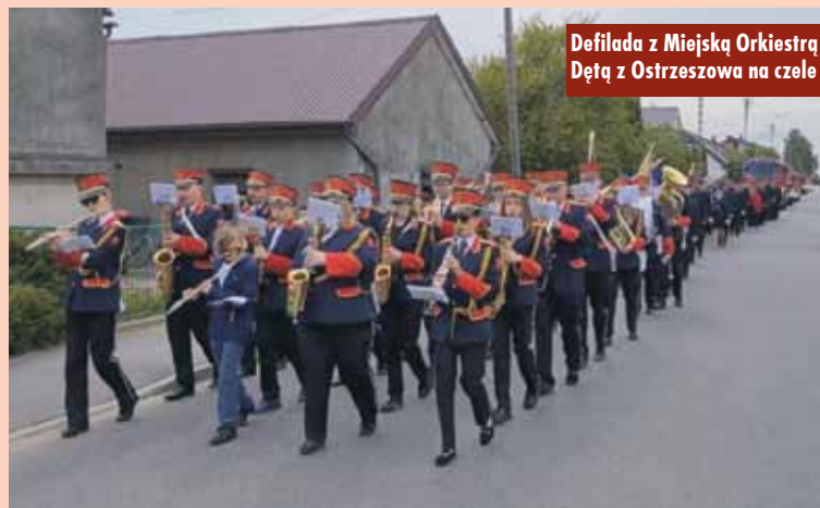
Defilada z Miejską Orkiestrą Dętą z Ostrzeszowa na czele

Następnie głos zabrali zaproszeni goście, którzy gratulowali OSP Myjomicze-Ostrówiec nowego sa-