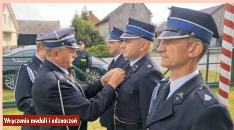
Wręczenie medali i odznaczeń

Gminy Kępno zarezerwowano środki na zakup nowego wozu dla OSP Olszowa. - Będzie to średni samochód ratowniczo-gaśniczy. Kosztować będzie 900 tysięcy złotych. W budżecie