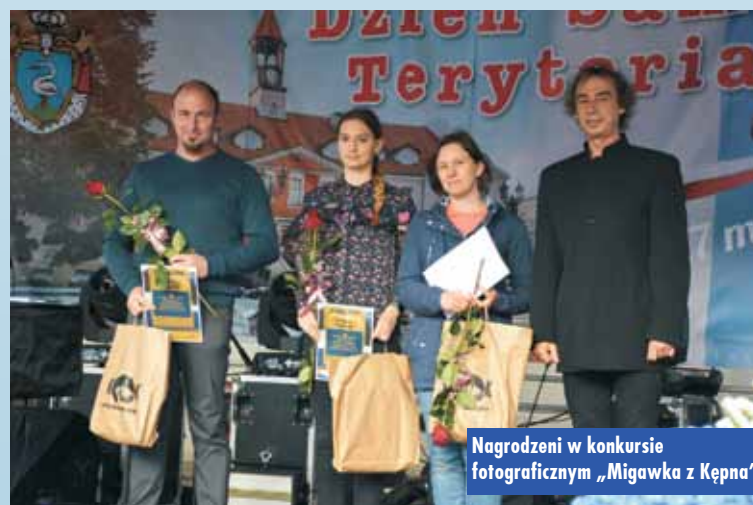
Nagrodzeni w konkursie fotograficznym „Migawka z Kępna”