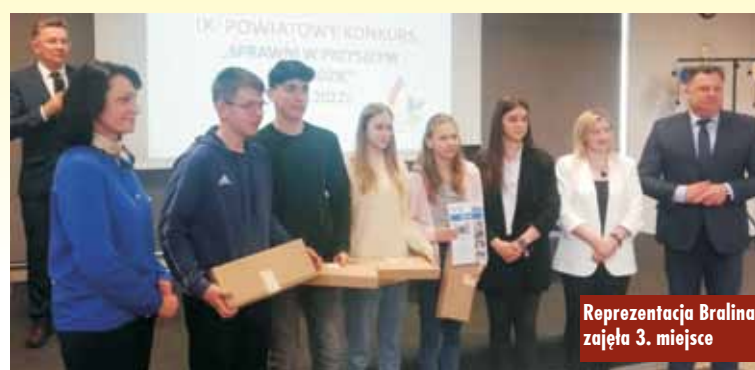
Reprezentacja Bralin zajęła 3. miejsce