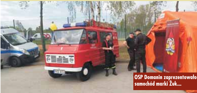
OSP Domanin zaprezentowało samochód marki Żuk...

całego kraju, m.in. Urząd Gminy Kobyla Góra, Biuro Rzecznika Praw Pacjenta, Wojsko Polskie, Dowództwo Operacyjne i Generalne Rodzajów Sił Zbrojnych, Wojska Obrony Ter-