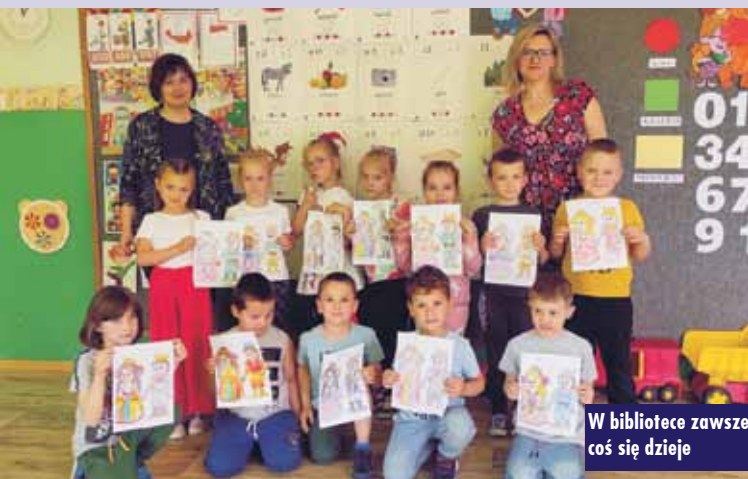
W bibliotece zawsze coś się dzieje