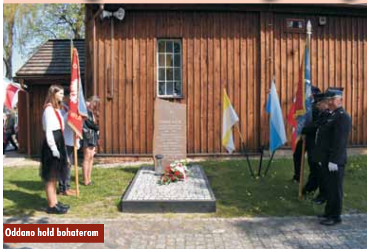
Oddano hołd bohaterom