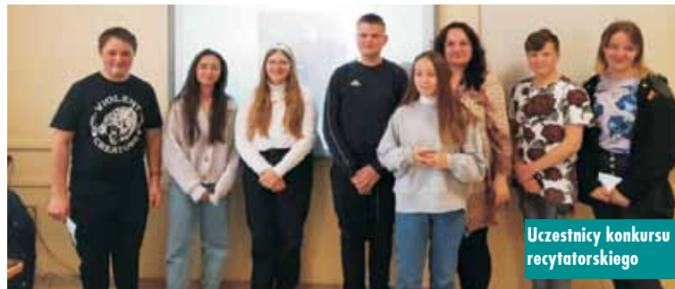
Uczestnicy konkursu recytatorskiego

oraz dyplomy, a pozostałym uczestnikom konkursu zostały wręczone dyplomy z podziękowaniem za udział w konkursie.