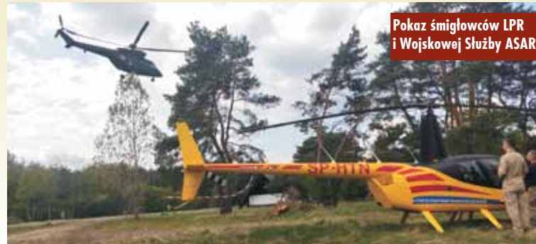
Pokaz śmigłowców LPR i Wojskowej Służby ASAR

Współorganizatorami pikniku byli Gmina Kobyla Góra oraz Stowarzyszenie Szukamy i Ratujemy. KR