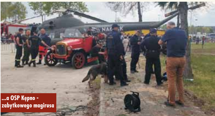
...a OSP Kępno - zabytkowego magirusa

rytorialnej, Żandarmeria Wojskowa, Akademia Sztuki Wojennej, Centrum Szkolenia Wojsk Specjalnych w Krakowie, Wojskowa Komenda Uzupełnień w Kaliszu, Akademia Wojsk Lądowych, Wojskowy Instytut Medycyny Lotniczej, Polska Agencja Żegluga Powietrznej, Centralna Sta-