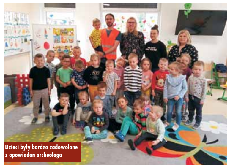
Dzieci były bardzo zadowolone z opowiadań archeologa

Po zakończeniu spotkania kierownik Filii Bibliotecznej podzięko-