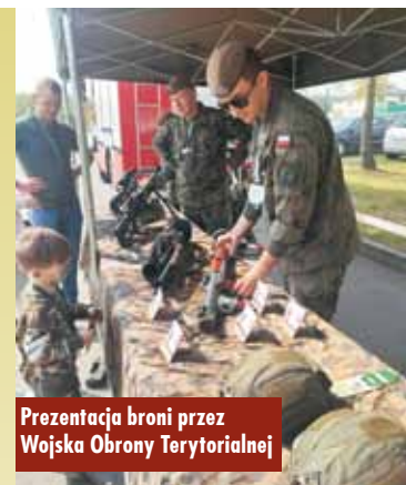
Prezentacja broni przez Wojska Obrony Terytorialnej

spodni Wiejskich oraz foodtrucki. Ministerstwo Rodziny i Polityki Społecznej oraz Biuro Rzecznika Praw Dziecka przygotowało specjalne miasteczko dla dzieci oraz gry i zabawy z nagrodami. Służby przeprowadziły także liczne warsztaty, prelekcje oraz pokazy: pożarnicze, antyterrorystyczne, ratownictwa medycznego, ratownictwa po wypadku komunikacyjnym, Służby