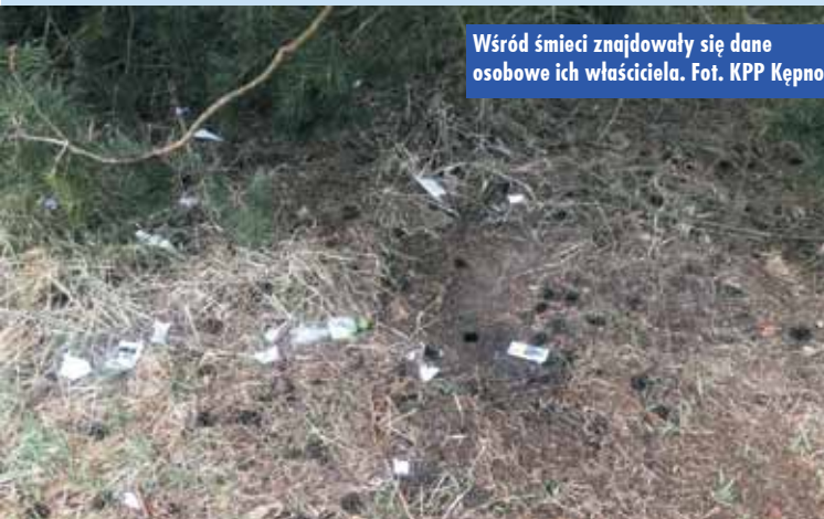
Wśród śmieci znajdowały się dane osobowe ich właściciela.