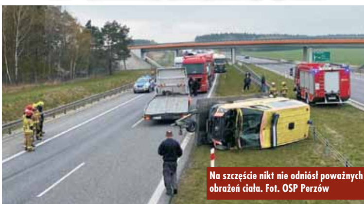
Na szczęście nikt nie odniósł poważnych obrażeń ciała.

21 kwietnia br. do Stanowiska Kierowania Komendanta Powiatowego Państwowej Straży Pożarnej w Kępnie wpłynęło zgłoszenie o dachowaniu dwóch pojazdów na 84. kilometrze trasy S8 w miejscowości Słupia pod Bralinem. Na miejsce zdarzenia zadysponowano zastępy z Jednostki Ratowniczo-Gaśniczej w Kępnie, JRG Syców, OSP Perzów i OSP Bralin.