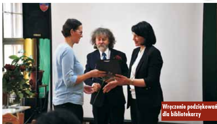
Wręczenie podziękowań dla bibliotekarzy

19 kwietnia br. funkcjonariusze Komendy Powiatowej Policji w Kępnie ujawnili śmieci pozostawione na terenie leśnym Osiedla Murator w Baranowie. Jak się okazało, właściciel śmieci zostawił w nich swoje dane osobowe