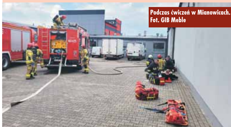
Podczas ćwiczeń w Mianowicach.

W ubiegłym tygodniu w Starostwie Powiatowym w Kępnie podpisanych zostało 12 umów na wsparcie realizacji zadań publicznych wraz z udzieleniem dotacji na dofinansowanie ich realizacji