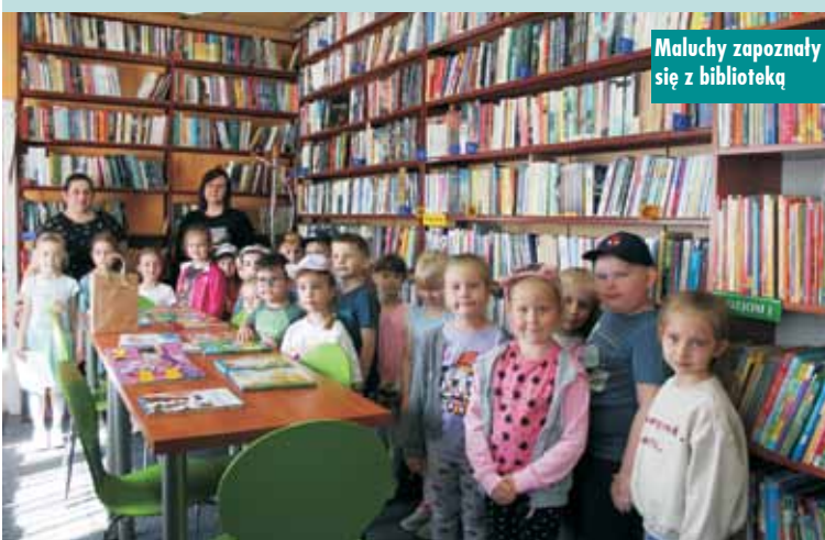
Maluchy zapoznali się z biblioteką