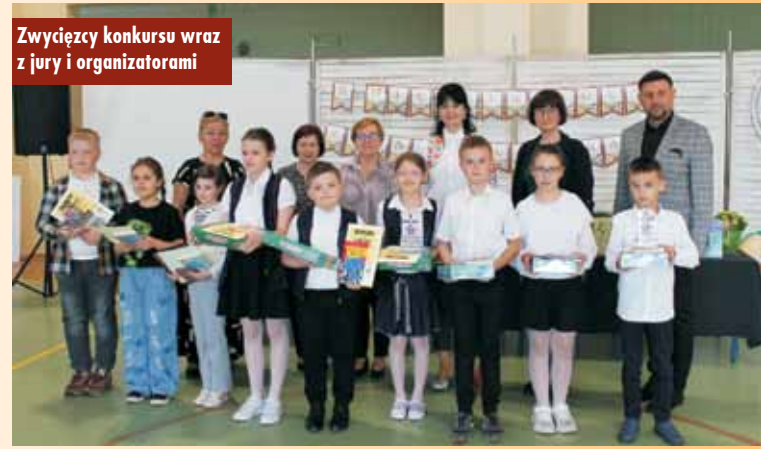
Zwycięzcy konkursu wraz z jury i organizatorami