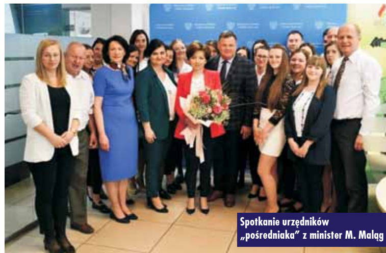
Spotkanie urzędników „pośredniaka” z ministrem M. Maląg

- Aktualnie w Urzędzie zarejestrowanych jest 12 obywateli Ukrainy z wykształceniem: wyższym, średnim ogólnym oraz zawodowym, w zawodach: choreograf, muzyk, technolog