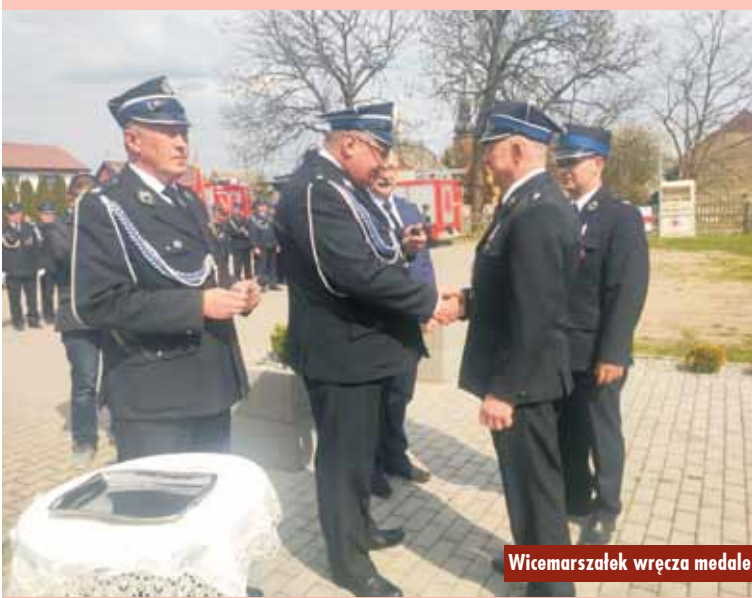
Wicemarszałek wręcza medale