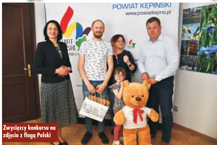
Zwycięzcy konkursu na zdjęcia z flagą Polski