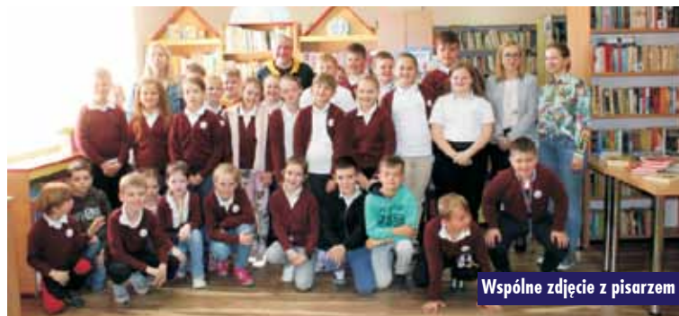
Wspólne zdjęcie z pisarzem