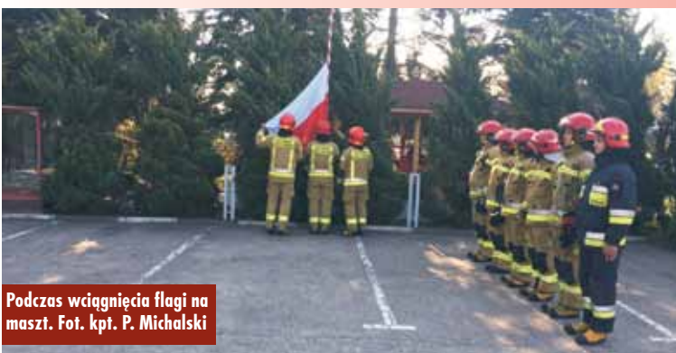
Podczas wciągnięcia flagi na maszt.

Obchody 77. rocznicy zakończenia II wojny światowej