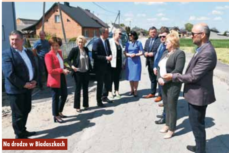
Na drodze w Bładaszkach