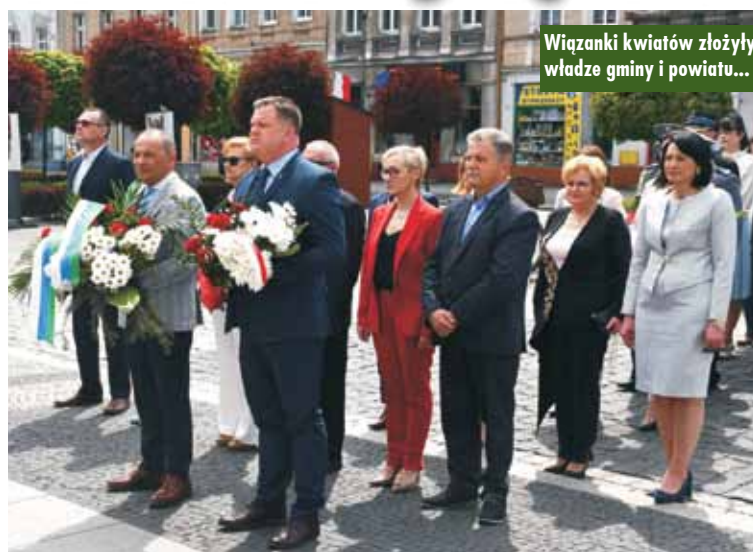
Wiązanki kwiatów złożyły władze gminy i powiatu...