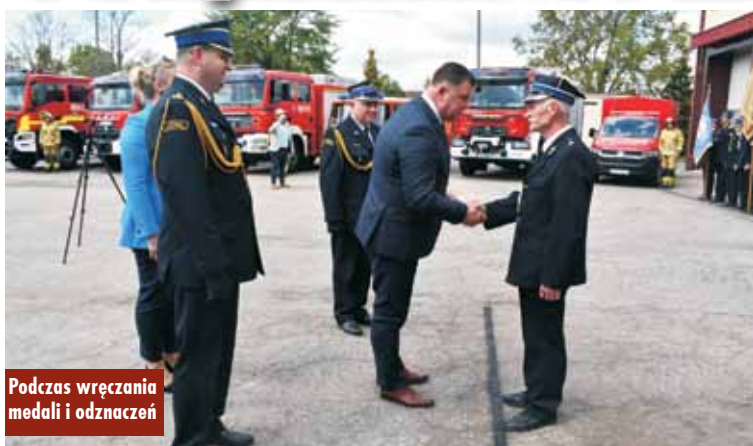
Podczas wręczenia medali i odznaczeń