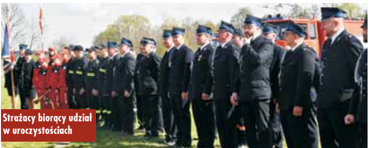
Strażacy biorący udział w uroczystościach

Część artystyczną przedstawili uczniowie ze Szkoły Podstawowej w Drożkach. Oprac. KR