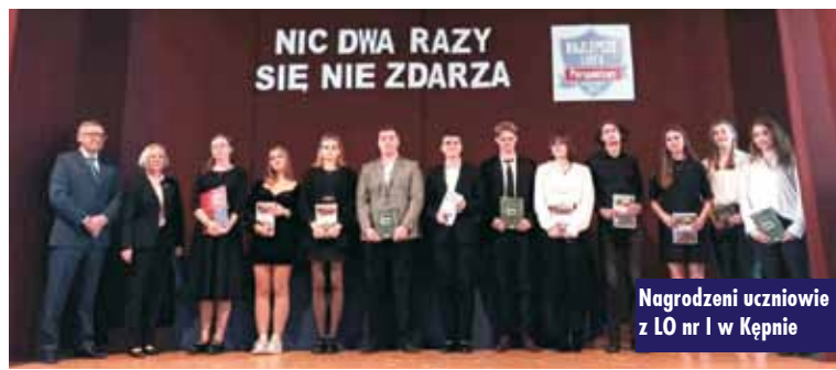
Nagrodzeni uczniowie z LO nr I w Kępnie