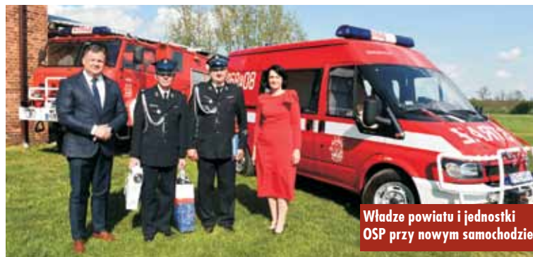
Władze powiatu i jednostki OSP przy nowym samochodzie

Następnie wręczono odznaczenia dla zasłużonych strażaków. Brązowy