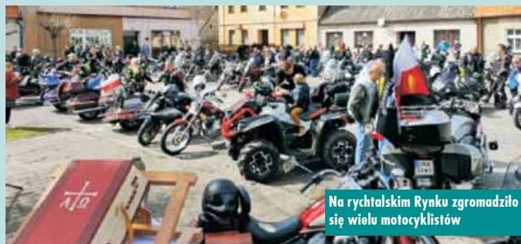
Na rychtańskim Rynku zgromadziło się wielu motocyklistów