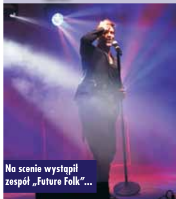
Na scenie wystąpił zespół „Future Folk”...

1 maja br. na terenach przy hali widowiskowo-sportowej w Kępnie odbyły się majówkowe wydarzenia, których organizatorami był Kępiński Ośrodek Kultury oraz Miasto i Gmina Kępno.