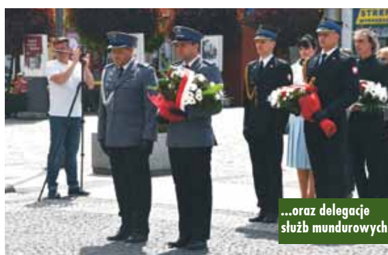
...oraz delegacje służb mundurowych