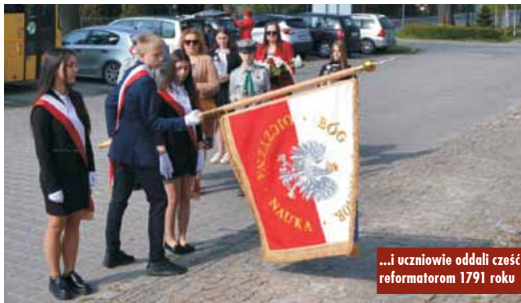
...i uczniowie oddali cześć reformatorom 1791 roku

Wojewoda wielkopolski wraz z parlamentarzystami wizytował drogę powiatową łączącą Trzebień i Bładaszki