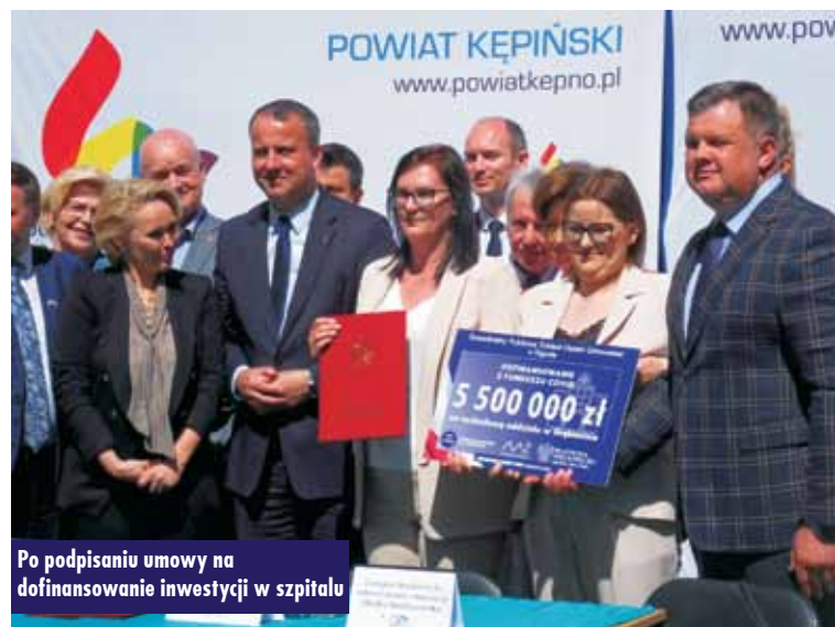
Po podpisaniu umowy na dofinansowanie inwestycji w szpitalu

Podkreślił on, jak znaczną rolę pełni szpital w ogólnokrajowym systemie rehabilitacji. - Jest tak duże zapotrzebowanie rehabilitacyjne, że dziś przyjmowane są zapisy na grudzień. Przypuszczam, że nawet gdyby na oddziale można było leczyć