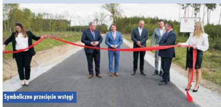
Symboliczne przecięcie wstęgi

Leśny Zakład Doświadczalny wyróżniony odznaką honorową „Za Zasługi dla Województwa Wielkopolskiego”