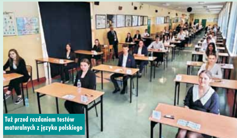
Tuż przed rozdaniem testów maturalnych z języka polskiego