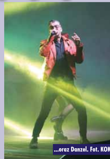
oraz Danzel.