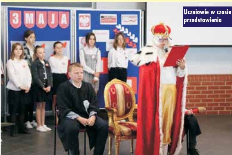
Uczniowie w czasie przedstawienia