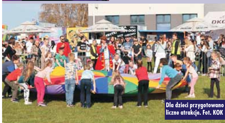
Dla dzieci przygotowano liczne atrakcje.

wokalistą jest Stanisław Karpielec-Bulecka . Zespół łączy tradycyjną muzykę góralską z elementami elektronicznej muzyki tanecznej. Drugą gwiazdą tegorocznej kępińskiej majówki był Danzel , znany w Polsce z takich hitów, jak „Pump It Up”. W międzyczasie na najmłodszych czekały animacje, dmuchańce i karuzele, a na smakoszy – food trucki.