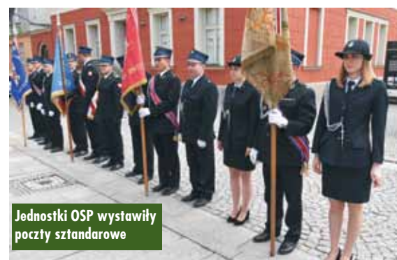
Jednostki OSP wystawiły poczty sztandarowe

Kępiński Ośrodek Kultury oraz Miasto i Gmina Kępno zorganizowali majówkowe wydarzenia w Kępnie