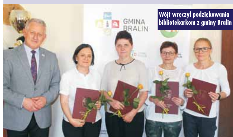
Wójt wręczył podziękowania bibliotekarkom z gminy Bralin

Spotkanie było okazją do podziękowań za działalność prowadzoną na rzecz rozwoju kultury i czytelnictwa w gminie. Wójt życzył satysfakcji z wykonywanej pracy, wspólnych czytelników oraz pomyślności w życiu osobistym. Oprac. KR