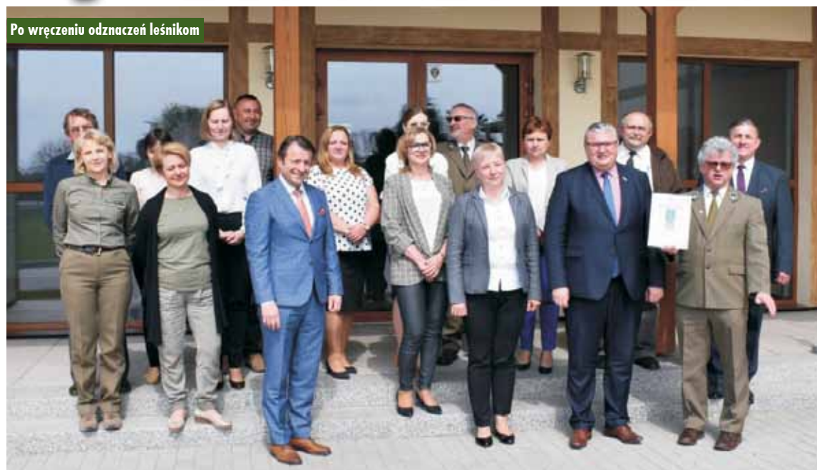
Po wręczeniu odznaczeń leśnikom

Leśny Zakład Doświadczalny w Siemianicach decyzją Zarządu Województwa Wielkopolskiego wyróżniony został odznaką honorową „Za zasługi dla województwa wielkopolskiego”.