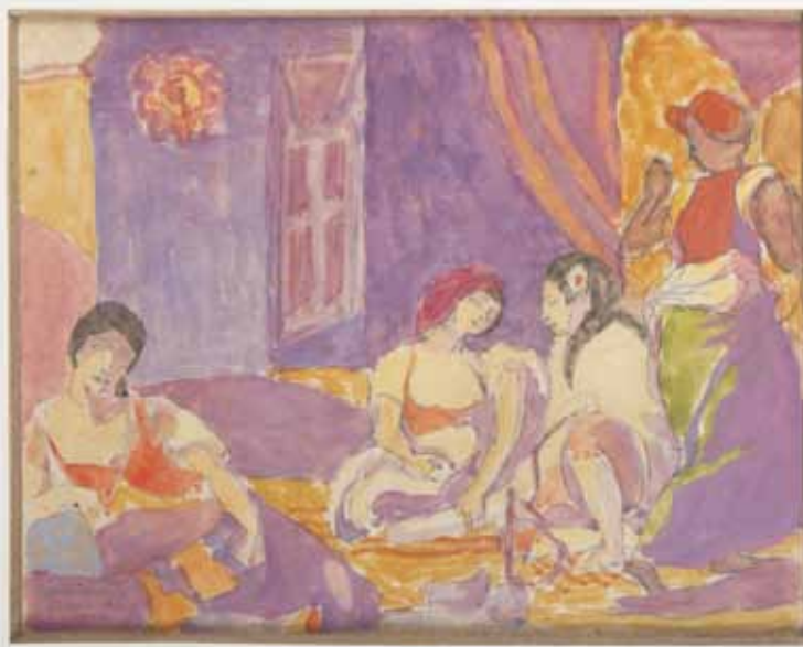
T. P. Potworowski, Kobiety Algierskie , 1932 r. Ze zbiorów Muzeum Ziemi Kępińskiej im. T. P. Potworowskiego w Kępnie

malarza. Niestety większość z nich nie zachowała się. Fragmentaryczność dorobku artysty z okresu przynależenia do Komitetu Paryskiego, spowodowana jest biegiem historii zdeterminowanej wybuchem II wojny światowej, stąd też cieszy fakt, iż Muzeum Ziemi Kępińskiej jako jedna z nielicznych placówek muzealnych w Polsce posiada dość obszerną kolekcję obiektów należących do pierwszej fazy twórczości artysty.