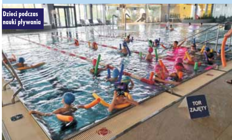
Dzieci podczas nauki pływania