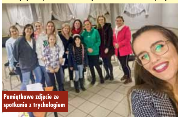
Pamiątkowe zdjęcie ze spotkania z trychologiem

Spotkanie odbywało się w ramach projektu „Kobieta być”, dofinansowanego ze środków budżetu Gminy Baranów. ig