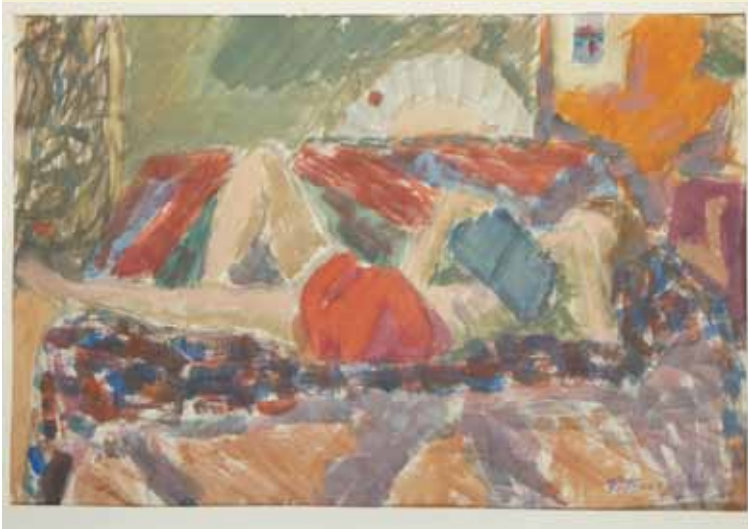
T. P. Potworowski, Czytająca , akwarela, lata 30. XX wieku. Ze zbiorów Muzeum Ziemi Kępińskiej im. T. P. Potworowskiego w Kępnie