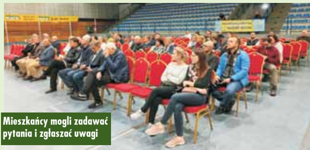
Mieszkańcy mogli zadawać pytania i zgłaszać uwagi

Do 9 maja można wyrazić swoje zdanie w ankiecie elektronicznej: https://forms.office.com/Pages/ResponsePage.aspx . KR