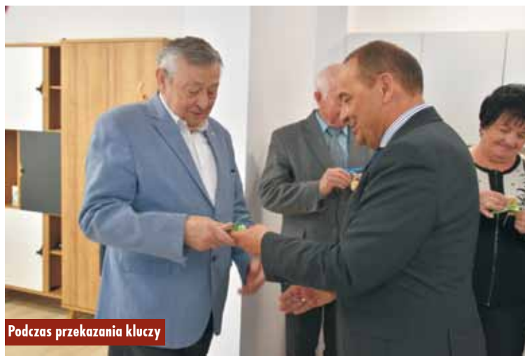
Podczas przekazania kluczy

W pierwsze poniedziałki miesiąca, w godzinach 11.00-13.00, w lokalu urzędować będzie Gminna Rada Seniorów, we wtorki, środy i czwartki, w godzinach 9.00-12.00 – Związek Emerytów Rencistów i Inwalidów, natomiast w piątki w godzinach popołudniowych – Towarzystwo Miłośników Ziemi Kępińskiej. Oprac. KR