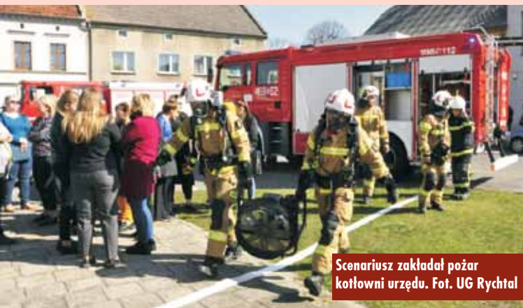
Scenariusz zakładał pożar kotłowni urzędu.