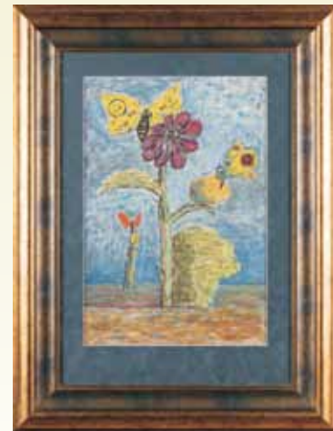
T. P. Potworowski, Kwiaty i Motyle , gwasz na papierze, 1932/1934 (?). Ze zbiorów Muzeum Ziemi Kępińskiej im. T. P. Potworowskiego w Kępnie