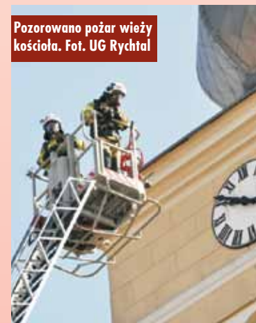
Pozorowano pożar wieży kościoła.

Głównym ich celem był trening realizacji procedur zachowania podczas wybuchu pożaru w miejscach użyteczności publicznej. Strażacy przeprowadzili ćwiczenia na obiektach: kościoła pw. Męczeństwa św. Jana Chrzciciela w Rychtalu oraz Urzędu Gminy Rychtal. Organizatorem był Zarząd Gminny Związku OSP RP w Rychtalu oraz Gmina Rychtal.