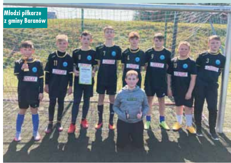
Młodzi piłkarze z gminy Baranów