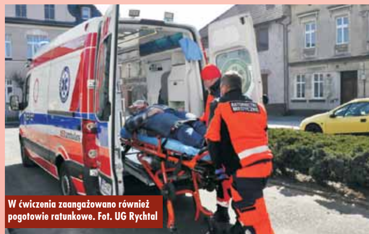
W ćwiczenia zaangażowano również pogotowie ratunkowe.

obejmowały elementy ewakuacji pracowników oraz interesantów z budynku urzędu, w tym osoby uwięzionej w płonącym obiekcie i udzielenie jej pomocy medycznej, zabezpieczenie