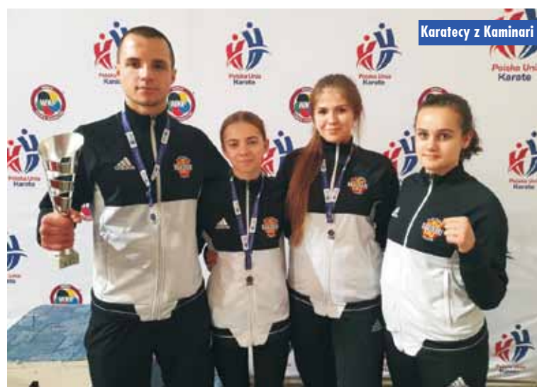
Karaty z Kaminiari