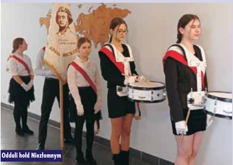
Oddali hołd Niezłomnym

25 lutego Szkoła Podstawowa w Perzowie gościła przedstawicieli Państwowej Straży Pożarnej z Kępna