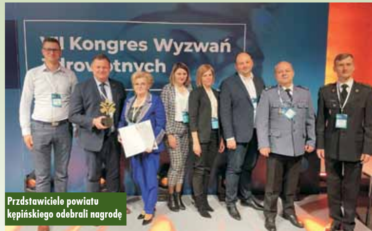
Przedstawiciele powiatu kępińskiego odebrali nagrodę

zakresu promocji zdrowia i edukacji zdrowotnej osób dorosłych, dzieci i młodzieży. Projekt, poprzez ukazanie negatywnych skutków zdarzeń spowodowanych pod wpływem alkoholu i substancji psychoaktywnych, miał na celu uświadomienie odbiorcom skali negatywnych zjawisk związa-