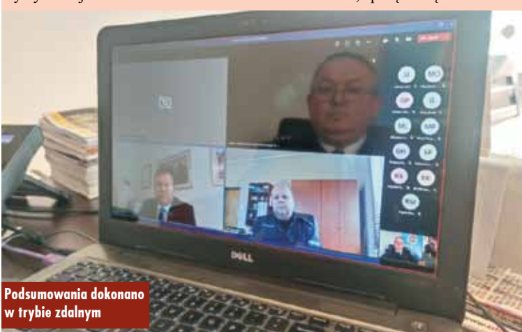
Podsumowania dokonano w trybie zdalnym

2021 rok to także działania prewencyjne. Po raz kolejny w ramach akcji „Czujka na straży Twojego bezpieczeństwa” przeprowadzono kampanię informacyjną na antenie Radia SUD, połączoną z konkur-