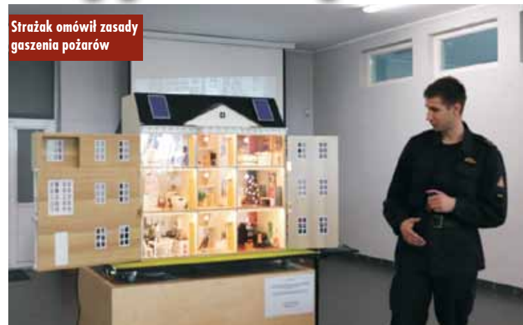
Strażak omówił zasady gaszenia pożarów

Podczas tych wyjątkowych zajęć strażacy przypomnieli również o podstawowych przedmiotach mogących uratować życie, np. czujnikach dymu lub gaśnicach.