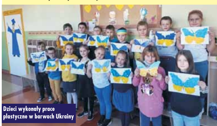
Dzieci wykonały prace plastyczne w barwach Ukrainy

ność i wsparcie dla naszych sąsiadów z Ukrainy. Dziękujemy za udział w akcji! Samorząd Uczniowski SP Bralin