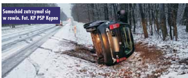
Samochód zatrzymał się w rowie.