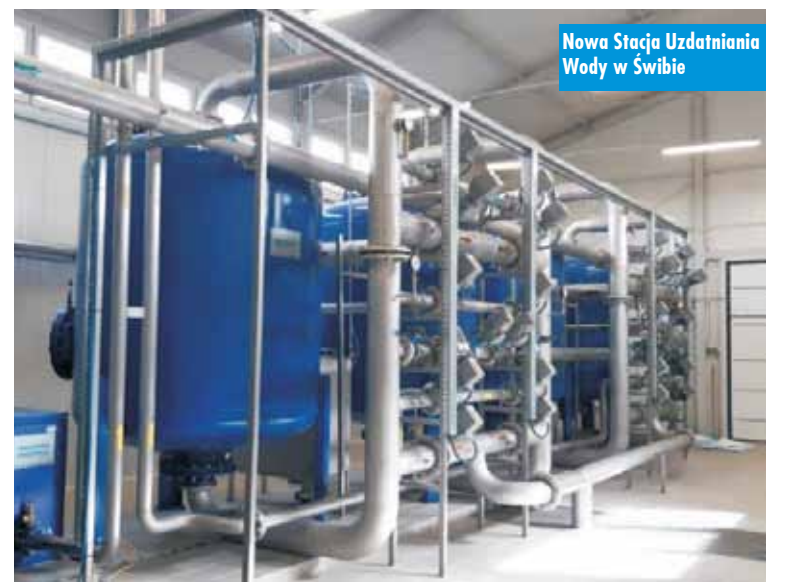
Nowa Stacja Uzdataniania Wody w Świbie