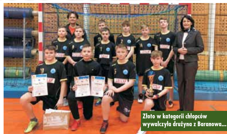
Złoto w kategorii chłopców wywalczyła drużyna z Baranowa...

Do turnieju chłopców zgłosiły się cztery drużyny. Pierwsze miejsce