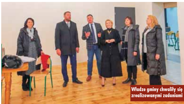
Władze gminy chwaliły się zrealizowanymi zadaniami

Spotkanie było również okazją do pochwalenia się zrealizowanymi z udziałem środków rządowych i unijnych inwestycjami, m.in. żłobkiem „Pastorówka” oraz Gminnym Ośrodkiem Kultury. Podczas spotkania w urzędzie gminy omówiono koncepcję projektu budowy nowej Szkoły Podstawowej w Rychtalu oraz możliwości jej finansowania. Oprac. KR