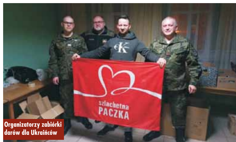
Organizatorzy zbiórki darów dla Ukraińców

trebach mieszkańców Ukrainy i w każdej chwili są gotowi wznowić akcję pomocową. Ze względu na zaist-