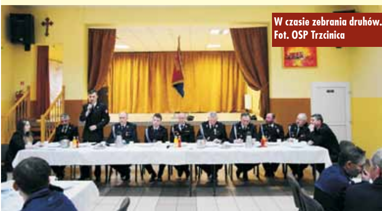
W czasie zebrania druhow.

Dofinansowanie z programu „Cyfrowa Gmina – granty PPGR”