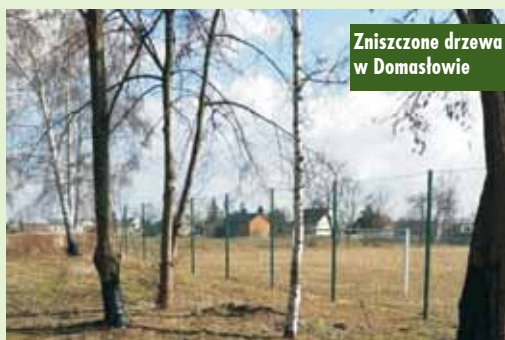
Zniszczone drzewa w Domasławie