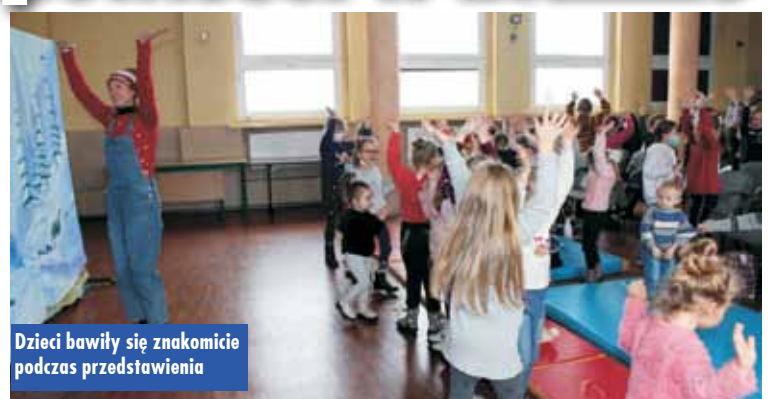
Dzieci bawiły się znakomicie podczas przedstawienia

Zima to idealna pora na zimowe opowieści. 24 stycznia br. artyści z Teatru „Błaszany Bębenek” z Trzebinia zawitali do Świetlicy Środowiskowo-Profilaktycznej „Tęcza” w Bralinie, gdzie zaprezentowali swoją adaptację baśni pt. „Królowa Śniegu”. Widzowie obejrzeni historię Kaja i Gerdy, którzy za sprawą czarów Królowej Śniegu zostali rozdzieleni. Przedstawienie było okazją do poznania wartości zwycięstwa dobra nad złem. Oprac. KR