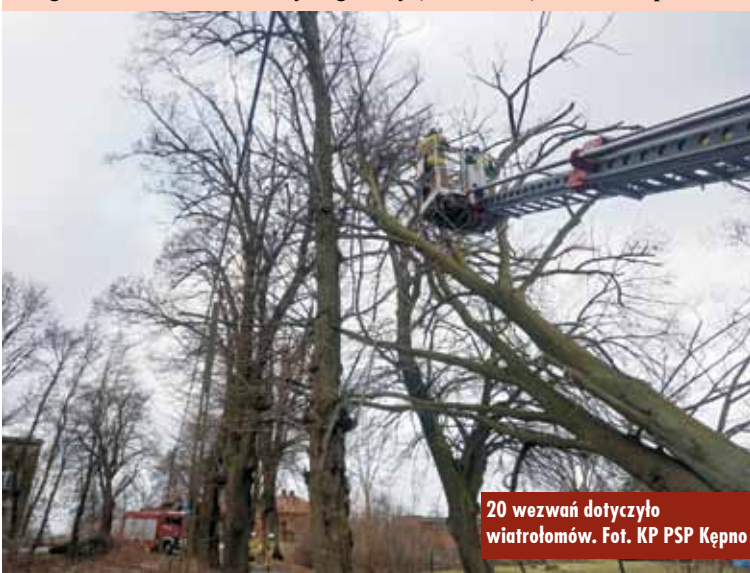
20 wezwań dotyczyło wiatrołomów.

Od 28 do 30 stycznia br. nad Polską przechodził niż, który przyniósł silny wiatr, w porywach przekraczający 100 km/h. Również w powiecie kępińskim wiało mocno, co spowodowało liczne uszkodzenia. Dyżurni Stanowiska Kierowania Komendanta Powiatowej Państwowej Straży Pożarnej w Kępnie otrzymali 31 zgłoszeń o zdarzeniach wymagających pomocy jednostek ochrony przeciwpożarowej, mających związek z silnym wiatrem. Działania podejmowane przez strażaków polegały na usuwaniu wiatrołomów (20 zdarzeń), zabezpieczaniu uszkodzonych dachów (7 zdarzeń), zabezpieczaniu uszkodzonych linii energetycznych oraz innych elementów infrastruktury (4 zdarzenia). Oprac. KR