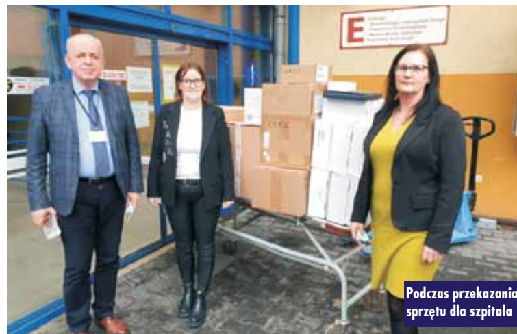
Podczas przekazania sprzętu dla szpitala

linowych, 500 sztuk kombinezonów ochronnych, 10.000 sztuk rękawic diagnostycznych oraz 1000 sztuk testów antygenowych. KR