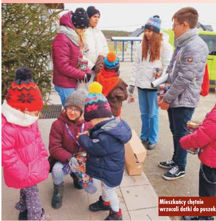
Mieszkańcy chętnie wrzucali datki do puszek

roczny cel zbiórki. W tym roku Wielka Orkiestra zbierała i ciągle zbiera pieniądze na okulistykę dziecięcą. W dniu finału sztab braliński grał z wielkim zaangażowaniem. Wolontariusze w liczbie 25 osób kwestowali na ulicach, placach, przed kościołami oraz we wszystkich dostępnych miejscach publicznych. W puszkach wolontariuszy mieszkańcy gminy Bralin, i nie tylko, umieścili ponad 20 tysięcy złotych.