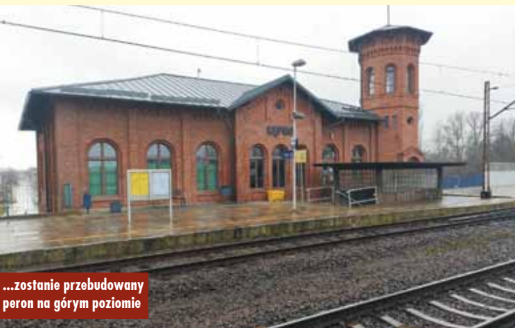
...zostanie przebudowany peron na górnym poziomie

Z objętych projektem 22 peronów w 15 miejscowościach dostęp do pociągów już zwiększa 11 nowych platform: w Wielkopolsce, na linii kolejowej Kluczbork – Poznań Główny, dostępność kolei zwiększy się na 6 stacjach i przystankach. Podróżni już zyskali lepsze warunki w Domaninie, Solcu Wielkopolskim, Łęce Opatowskiej i Pierzchni, a w 2023 r. podróżni skorzystają z peronu w Słupi. m