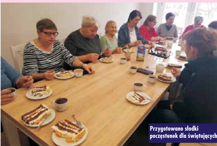
Przygotowano słodki poczęstunek dla świętujących

Gminny Ośrodek Kultury w Perzowie wraz z Biblioteką Publiczną po raz kolejny przygotowały dla dzieci i młodzieży spotkania podczas ferii zimowych