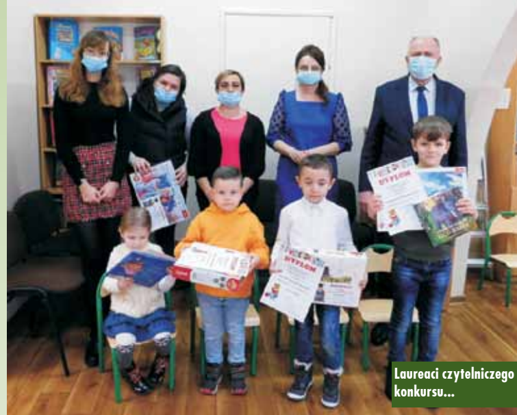
Laureaci czytelnickiego konkursu...

W tym samym dniu w Filii Bibliotecznej w Laskach również odbyło się rozstrzygnięcie konkursu