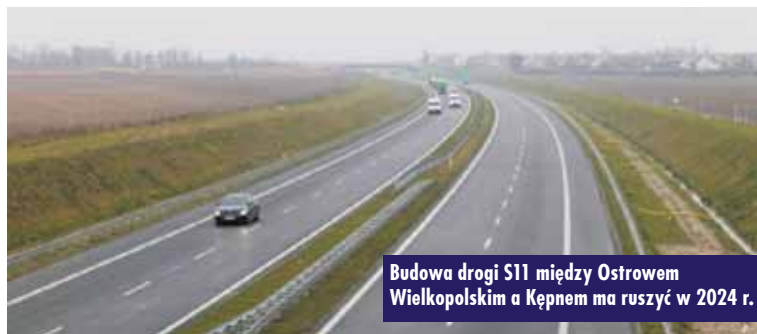
Budowa drogi S11 między Ostrowem Wielkopolskim a Kępem ma ruszyć w 2024 r.

W ramach trasy S11 w Wielkopolsce wybudowane zostaną obwodnice Obornik Wielkopolskich i Ujścia, a także przebudowana zostanie droga krajowej nr 25 (Ostrów Wielkopolski - Kalisz - Konin). W programie przewidziano budowę od-