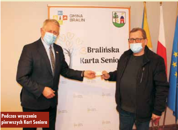
Podczas wręczenia pierwszych Kart Seniora

- Program jest otwarty. Zapraszamy podmioty gospodarcze do współpracy i przystąpienia do programu Bralińskiej Karty Seniora – zachęca wójt gminy. Lista Przedsiębiorców Przyjaznych Seniorom znajduje się na stronie www.bralin.pl w zakładce SENIOR + i będzie systematycznie uaktualniana. - Seniorów 60+ zapraszamy do składania wniosków na Bralińską Kartę Seniora. Wniosek można pobrać ze strony internetowej gminy albo w Urzędzie Gminy – dodaje wójt. Oprac. KR