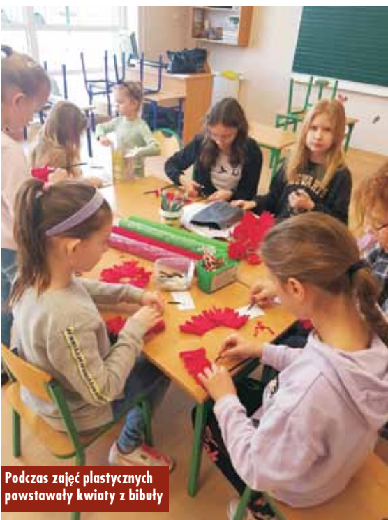
Podczas zajęć plastycznych powstawały kwiaty z bibuły

Gminnego Ośrodka Kultury na dzieci czekał dmuchany zamek. Pracownicy GOK i biblioteki udali się również