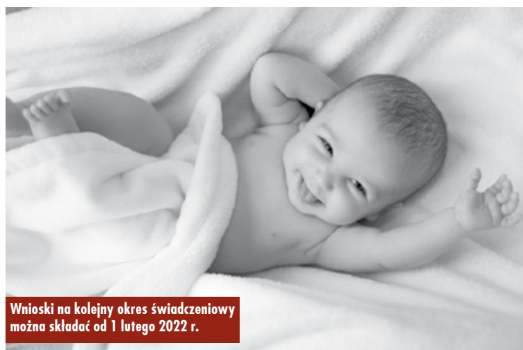
Wnioski na kolejny okres świadczeniowy można składać od 1 lutego 2022 r.

- Natomiast rodzic, który składa wniosek na nowonarodzone dziecko, w lutym 2022 r. może złożyć od razu dwa wnioski na dwa okresy świadczeniowe, ten trwający do 31 maja 2022 r. i na okres trwający od 1 czerwca 2022 r. do 31 maja 2023 r.