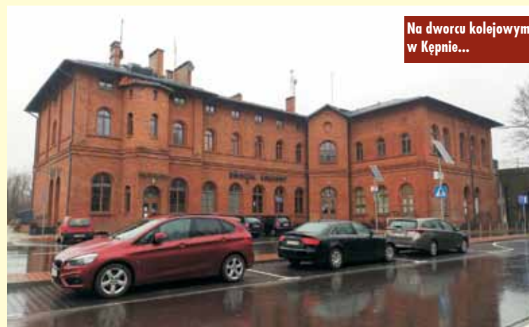
Na dworcu kolejowym w Kępnie...

Obok peronu będzie sieć trakcyjna. Wyregulowana zostanie sieć trakcyjna. Prace zaplanowano, by nie ograniczać ruchu kolejowego – w trakcie inwestycji na górnym poziomie stacji wykorzystywany będzie sąsiedni,