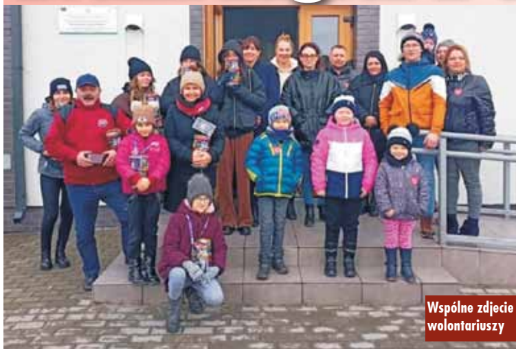
Wspólne zdjęcie wolontariuszy

W niedzielę, 30 stycznia br., w gminie Bralin zagrał 30. Finał Wielkiej Orkiestry Świątecznej Pomocy. Pomimo niesprzyjającej pogody po raz kolejny udało się pobić rekord sprzed roku. Wynik przeszedł oczekiwania bralińskiego sztabu. Kwota, którą udało się zebrać, to 37.186,30 zł.