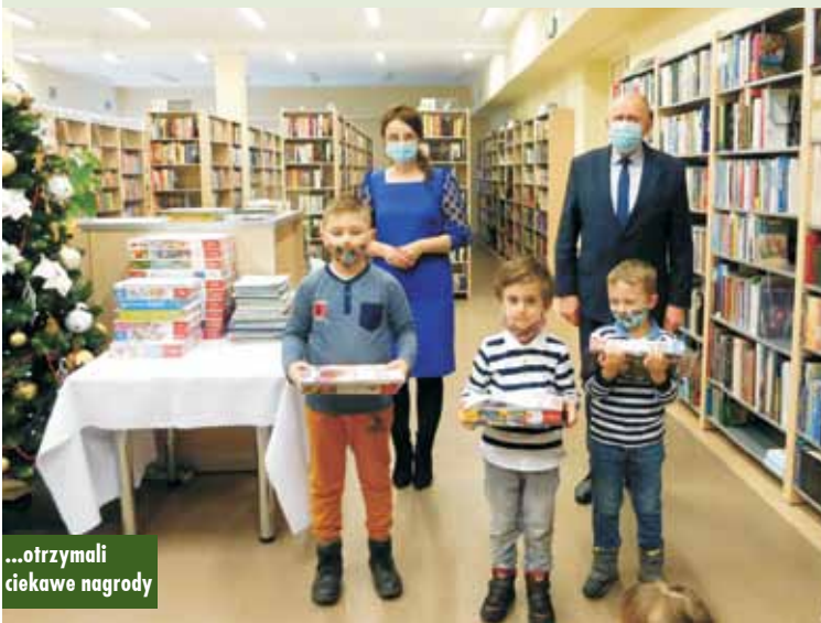
...otrzymali ciekawe nagrody