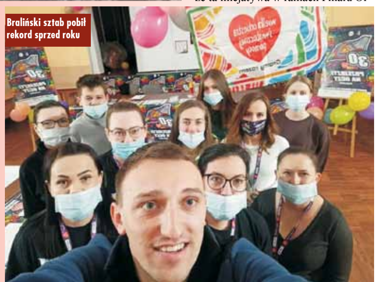
Braliński sztab pobił rekord sprzed roku

30. finał Wielkiej Orkiestry Świątecznej Pomocy w gminie Bralin rozłożony został na dwa dni. W sobotę, w godzinach 17.00 – 20.00, odbyły się licytacje przedmiotów, które udało się pozyskać na aukcje. Blisko 100 przedmiotów, które stały się częścią licytacji, cieszyło się niezwykle zainteresowaniem. Wszystkie wystawione przedmioty zostały zlicytowane, a pieniądze, które udało się pozyskać w ten sposób, zasilili tego-