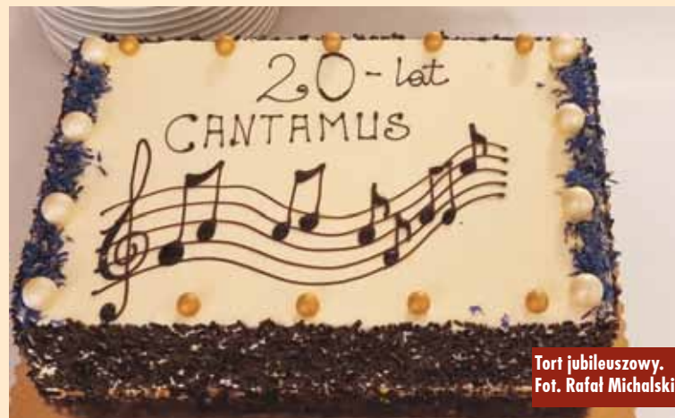
Tort jubileuszowy.

Lata, które minęły, naznaczone są pracą dyrygentów, chórzystów, przyjaciół chóru. 20-lecie istnienia to czas niezwykle ciekawy wyda-