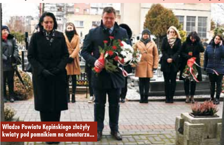
Władze Powiatu Kępińskiego złożyły kwiaty pod pomnikiem na cmentarzu...

Uroczystości rocznicowe poprzedziła msza święta w intencji ojczy-