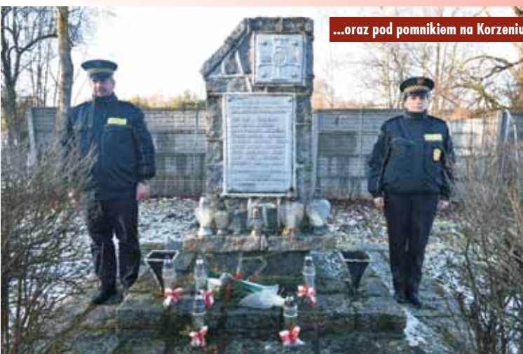
...oraz pod pomnikiem na Korzeniu