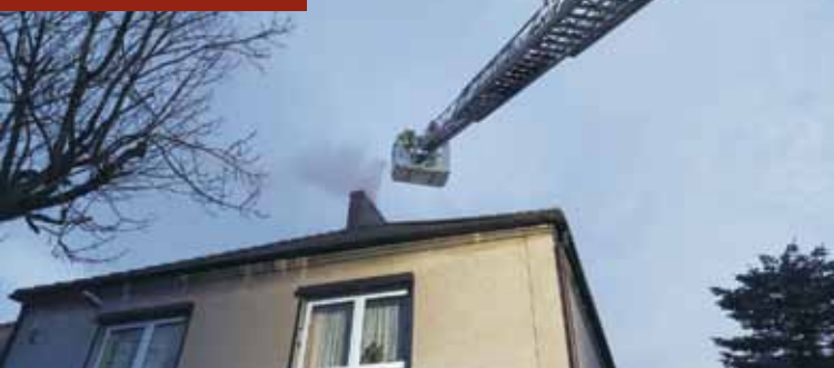
Strażacy gasili pożar przewodu kominowego. Fot. KP PSP Kępno

PIANINO STROJENIE, NAPRAWA Tel. 662 046 560