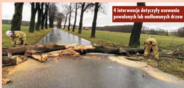
4 interwencje dotyczyły usuwania powalonych lub nadłamanych drzew

W miejscowości Kierzno, na 107. kilometrze trasy S8, w wyniku silne-