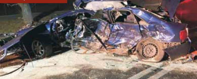
Zginął 21-latek z Wieruszowa.

Dyżury w urzędach skarbowych w zakresie Polskiego Ładu