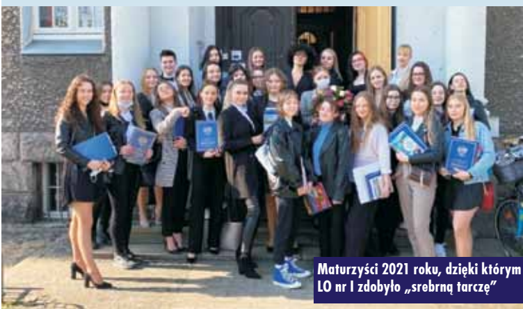
Maturzyści 2021 roku, dzięki którym LO nr I zdobyło „srebrną tarczę”

Głównymi adresatami rankingu są uczniowie i ich rodzice, którzy muszą podjąć bardzo ważną decyzję, dotyczącą wyboru dalszej ścieżki kształcenia. Ranking „Perspektyw” stanowi pomoc dla młodych ludzi w wyborze liceum lub technikum, które doprowadzi ich do studiów i ułatwi zdobycie wymarzonego zawodu. Informacje mogą czerpać z pięciu rankingów, w tym dwóch głównych: Rankingu Liceów Ogólnokształcących 2022 i Rankingu Techników 2022 oraz trzech rankingów dodatkowych: Rankingu Maturalnego Liceów Ogólnokształcących 2022, Rankingu Maturalnego Techników 2022 oraz Rankingu Szkół Olimpijskich 2022.