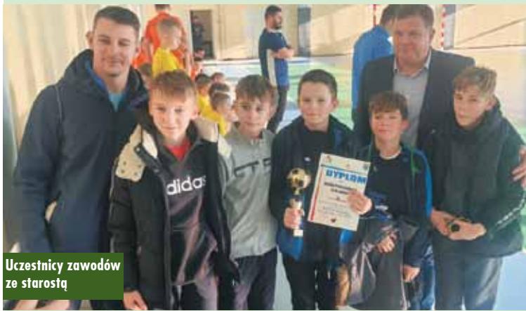
Uczestnicy zawodów ze starostą

W finale o pierwsze miejsce zmierzyły się drużyny SP Donaborów i SP Opatów, wygrał zespół z Donaborowa 1:0. W meczu o trzecie miejsce SP nr 1 Kępno pokonała SP nr 3 Kępno 2:1.