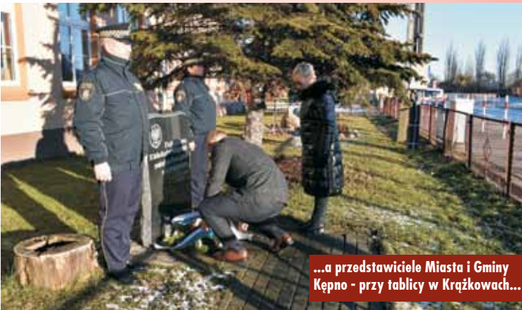
...a przedstawiciele Miasta i Gminy Kępno - przy tablicy w Krążkowach...

Natomiast władze Powiatu Kępińskiego uczciły tę ważną dla Kępna datę, składając wiązanek kwiatów pod pomnikiem upamiętniającym