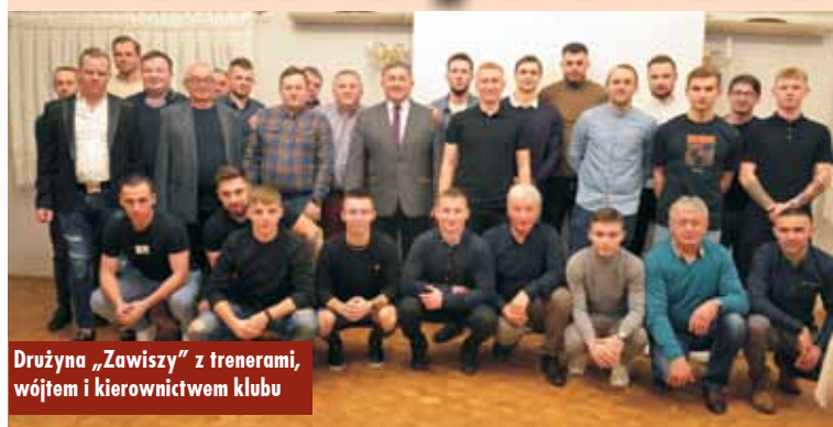
Drużyna „Zawiszy” z trenerami, wójtem i kierownictwem klubu

W spotkaniu wzięli udział, piłkarze, sponsorzy i działacze Klubu. Tematem wiodącym była oczywiście runda wiosenna, która powinna się zakończyć awansem do V ligi. Warto zwrócić uwagę na fakt dobrej współpracy klubu z samorządem. Efekty widać gołym okiem. Wszak odnowiony stadion „Zawiszy” nawet przyjezdni określają jako małe San Siro.