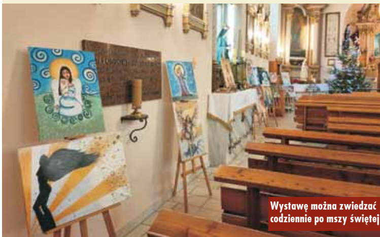
Wystawę można zwiedzać codziennie po mszy świętej