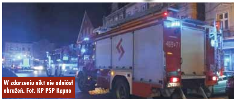
W zdarzeniu nikt nie odniósł obrażeń.

2 stycznia br., o godzinie 18.12, do Stanowiska Kierowania Komendanta Powiatowej Straży Pożarnej w Kępnie wpłynęło zgłoszenie o zadymieniu w budynku wielorodzinnym przy ul. Rynek w Kępnie. Do zdarzenia zadysponowano zastępy z Jednostki Ratowniczo-Gaśniczej w Kępnie i OSP Kępno.