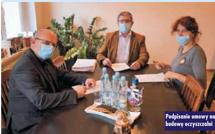
Podpisanie umowy na budowę oczyszczalni

ni ścieków w systemie „zaprojektuj i wybuduj”. Opracowanie programu wykona spółka „Sumax” z Krakowa. - W programie Funkcjonalno-Użytkowym, określimy zakres robót oraz stawiane im wymagania techniczne, ekonomiczne, architektoniczne, materiałowe i funkcjonalne. Głównym założeniem opracowania będzie zwiększenie przepustowości