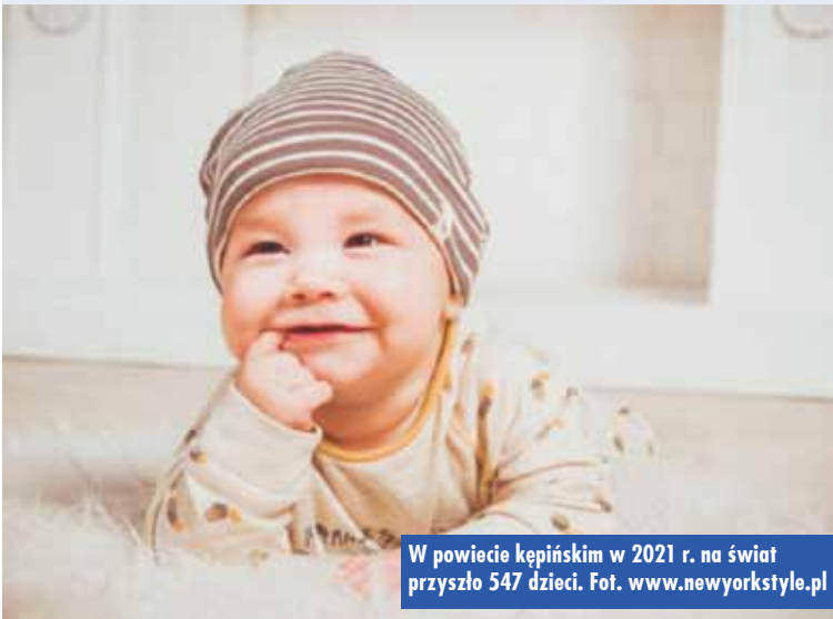
W powiecie kępińskim w 2021 r. na świat przyszło 547 dzieci.

Rekordzistą w ilości zawartych w 2021 r. małżeństw jest gmina Kęp-