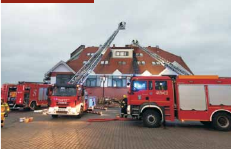
Strażacy ewakuowali z budynku trzy osoby.