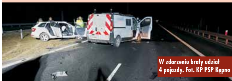
W zdarzeniu brały udział 4 pojazdy.

Uroczyste przekazanie kluczy do mieszkań przy ul. Solidarności 8a