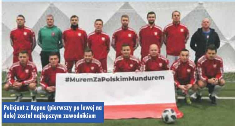
Policjant z Kępna (pierwszy po lewej na dole) został najlepszym zawodnikiem

Centrum Kultury i Sztuki w Kaliszu zorganizowało w 2021 r. mistrzowskie warsztaty tradycyjnych ozdób z papieru i z bibuły