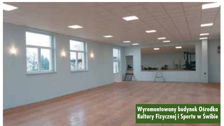
Wyremontowany budynek Ośrodka Kultury Fizycznej i Sportu w Świbie

Uroczystość wręczenia aktów nadania stopnia awansu zawodowego nauczycieli