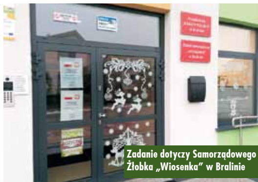
Zadanie dotyczy Samorządowego Żłobka „Wiosenka” w Bralinie