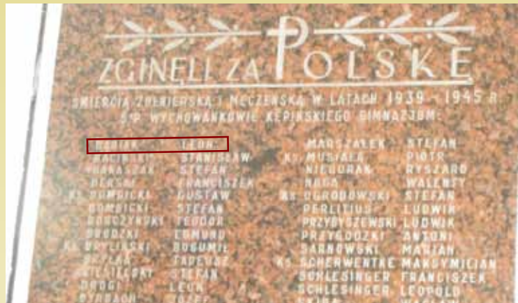
Pamiątkowa tablica w LO nr 1 w Kępnie, oddająca hołd pomordowanym absolwentom liceum w czasie II wojny światowej

władze poinformowały tylko lakonicznie, że Leon Babiak za przynależność do organizacji niepodległościowej został skazany na śmierć. W