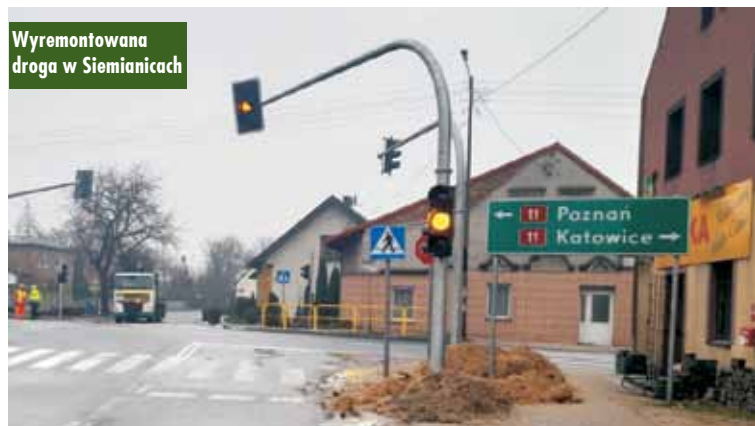
Wyremontowana droga w Siemianicach