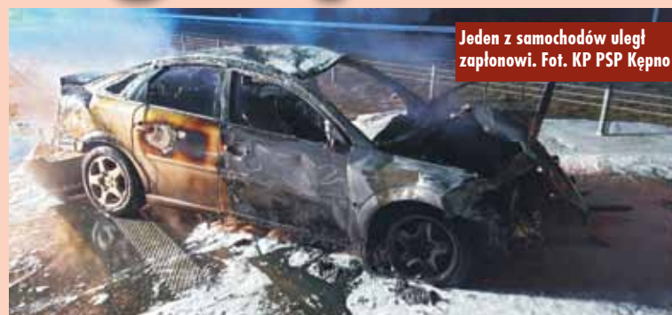
Jeden z samochodów uległ zapłonowi.

Po dotarciu na miejsce zdarzenia stwierdzono, że doszło do zdarzenia z udziałem czterech pojazdów, w wyniku którego jeden uległ zapłonowi. Pojazdami podróżowało łącznie osiem osób – wszystkie opuściły samochody przed przybyciem służb. Trzy osoby wymagały pomocy medycznej. Na potrzeby działań zablokowano ruch