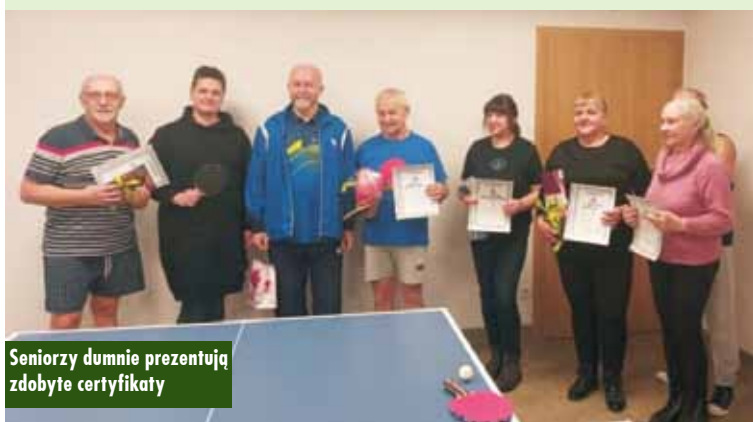
Seniorzy dumnie prezentują zdobyte certyfikaty

nie z seniorami na podsumowanie warsztatów zatańczyli taniec Jeruzalema. Odbłyły się również zajęcia gry w ping pong oraz Otwarty Turniej Tenisa Stołowego w Klubie. Zostały wytypowane kategorie: kobiety, mężczyźni oraz miks, czyli gra podwójna mieszana. Przeprowadzono również warsztat zdrowego odżywiania oraz w ramach relaksu - seans filmowy w kinie Sokolnia. Program powstał z myślą, by zachęcać uczestników do działań wpływających na poprawę funkcjonowania poznawczego oraz dbania o kondycję. Oprac. m