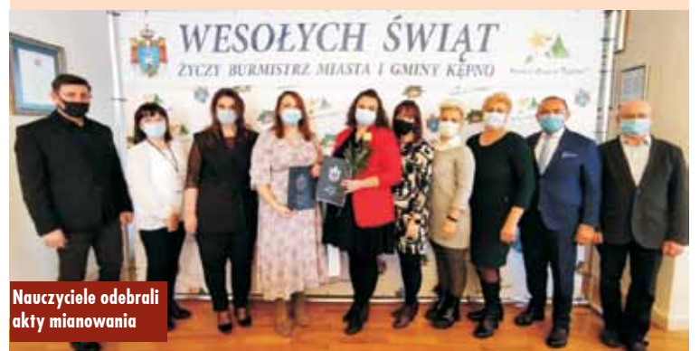
Nauczyciele odebrali akty mianowania