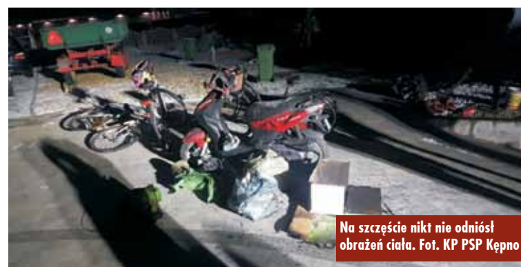
Na szczęście nikt nie odniósł obrażeń ciała.

stwierdzono, że doszło do pożaru w piwnicy jednorodzinnego budynku mieszkalnego. Mieszkańcy opuścili budynek przed przybyciem służb i nie wymagali pomocy medycznej. - Działania strażaków polegały na zabezpieczeniu i oświetleniu miejsca zdarzenia, następnie odłączono od budynku zasilanie w energię elektryczną, po czym podano jeden prąd wody w natarciu na pożar, co doprowadziło do jego ugaszenia. Strażacy oddymili budynek za pomocą wentylatora osiowego i przy pomocy miernika wielogazowego oraz kamery termowizyjnej upewnili się, że zagrożenia zostały usunięte – mówi oficer prasowy KP PSP Kępno, kpt. Paweł Michalski. Oprac. KR