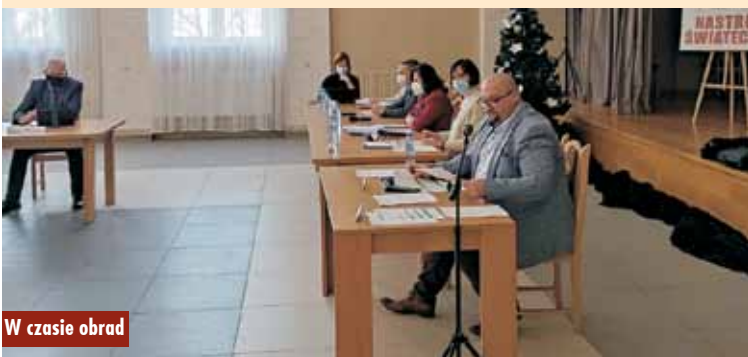
W czasie obrad

gnięcia długoterminową pożyczką, przychodami jednostek samorządu terytorialnego z niewykorzystanych środków pieniężnych na rachunku bieżącym budżetu oraz z nadwyżki. Najważniejsze inwestycje na 2022 r.