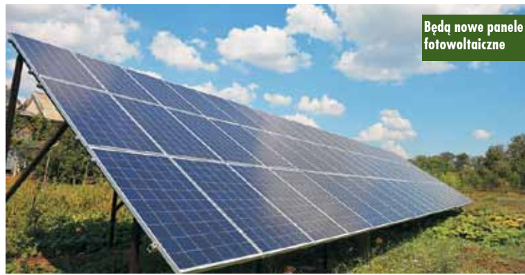
Będą nowe panele fotowoltaiczne

Powstanie Rodzinny Dom Pomocy Społecznej dla byłych wychowanków z pieczy zastępczej