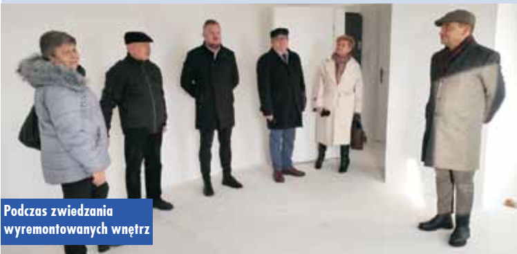
Podczas zwiedzania wyremontowanych wnętrz