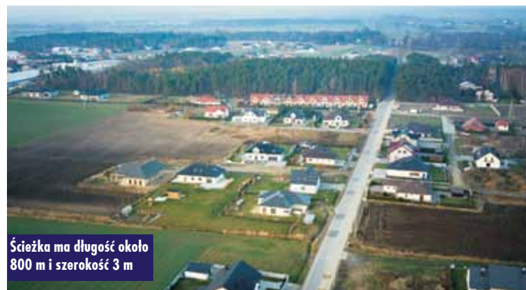
Ścieżka ma długość około 800 m i szerokość 3 m

Szkoły podstawowe z terenu gminy Bralin otrzymały wsparcie finansowe z programu „Laboratoria przyszłości”, którego celem jest budowanie kompetencji kreatywnych i technicznych wśród uczniów