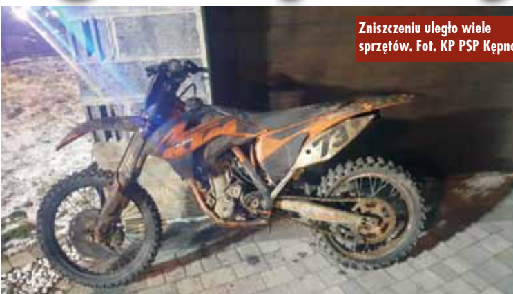
Zniszczeniu uległo wiele sprzętów.

9 stycznia br., około godziny 3.20, do Stanowiska Kierowania Komendanta Powiatowego Państwowej Straży Pożarnej w Kępnie wpłynęło zgłoszenie o pożarze w budynku jednorodzinnym w miejscowości Granice. Na miejsce zadysponowano zastępy z Jednostki Ratowniczo-Gaśniczej w Kępnie, OSP Trzcinią i OSP Laski. Po dotarciu na miejsce zdarzenia pierwszych zastępów