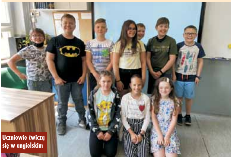
Uczniowie ćwiczą się w angielskim

Rozbudowa Oczyszczalni Ścieków w Opatowie