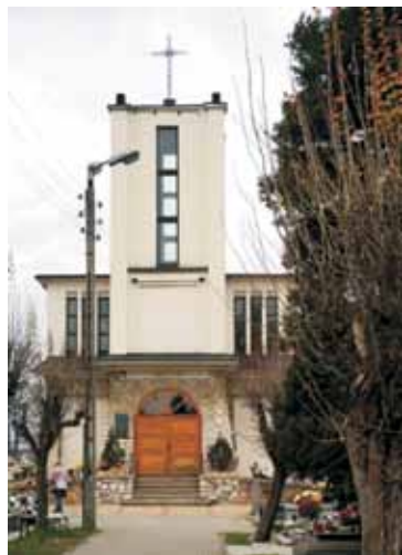
Kaplica cmentarna w Sosnowcu

W okresie międzywojennym mauzoleum przebudowano na kapliczkę, która w czasie okupacji została zniszczona wraz z tablicą upamiętniającą bohaterów. Po wojnie kapliczka została odbudowana, a dla upamiętnienia powstańców umieszczono napis: „Poległym bohaterom Śląska”.