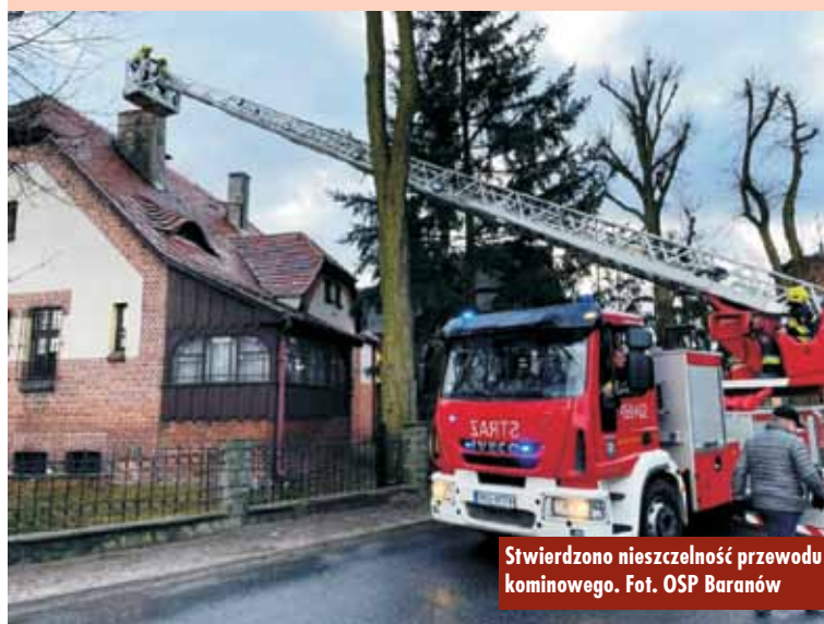
Stwierdzono nieszczelność przewodu kominowego.