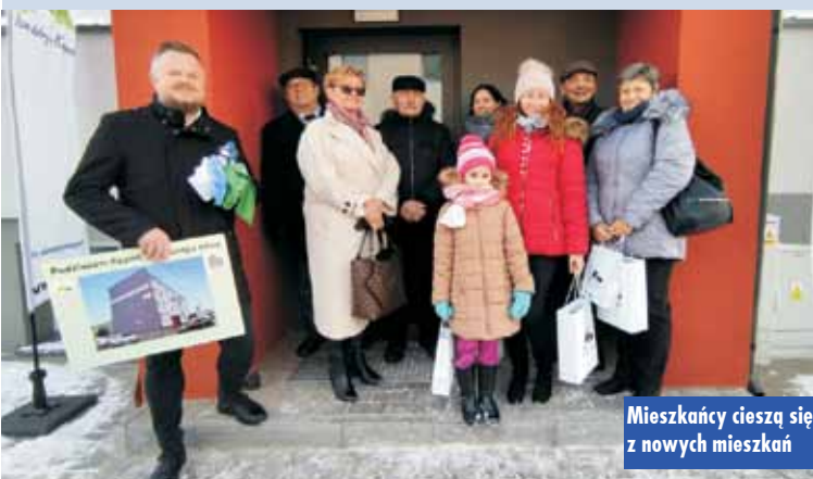
Mieszkańcy cieszą się z nowych mieszkań

Inwestycja zrealizowana została w ramach zadania pn. „Termomodernizacja dla budynku wielorodzinnego znajdującego się przy ul. Solidarności 8a w Kępnie” w ramach instrumentów finansowych wdrażanych w