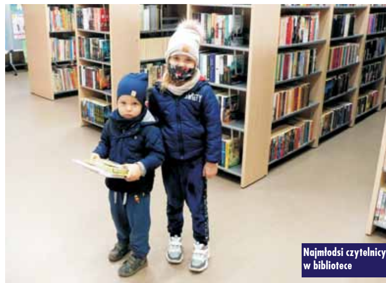
Najmłodszy czytelnik w bibliotece

W dziale dziecięcym największym powodzeniem cieszyły się