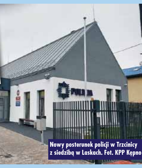
Nowy posterunek policji w Trzcinicy z siedzibą w Laskach.