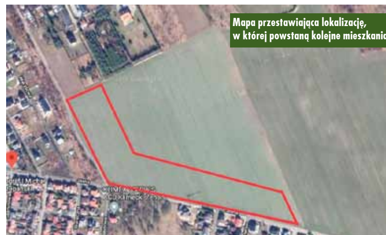
Mapa przedstawiająca lokalizację, w której powstaną kolejne mieszkania