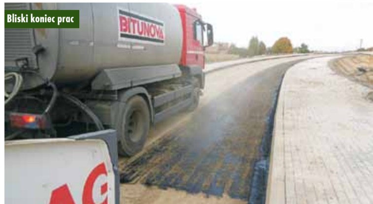
Bliski koniec prac

W ramach budowy obwodnicy zostaną zaprojektowane i wykonane: odcinek dwujezdniowej drogi ekspresowej o nawierzchni bitumicznej o długości ok. 3,2 km, odcinek jednojezdniowej drogi ekspresowej o nawierzchni bitumicznej o długości ok. 3,6 km, łącznik od drogi S11 w km 12+100 na węźle Baranów do istniejącej drogi DK-11 o długości 1,3 km, węzeł drogowy „Kępno – Wschód” na skrzyżowaniu z DW 482, oraz węzeł drogowy „Baranów”, obiekty inżynierskie w ciągu drogi ekspresowej (4 wiadukty i 2 mosty w ciągu S11 oraz 1 przejście dla zwierząt pod drogą S11) oraz w ciągu dróg krzyżujących się z drogą ekspresową (2 wiadukty nad drogą ekspresową S11), wyposażenie