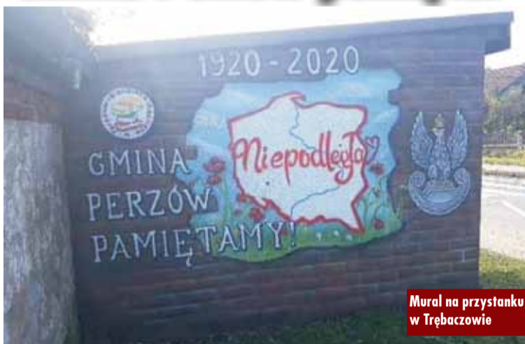
Mural na przystanku w Trębaczowie

Projekt otrzymał dofinansowanie w wysokości 11 tys. zł., wkład własny biblioteki to 3 tys. zł. Nawiązywał on do obchodów setnej rocznicy Bitwy Warszawskiej 1920. Przedsięwzięcie zakładało integrację lokalnej społeczności - mieszkańców gminy Perzów poprzez ich aktywny udział w wydarzeniach edukacyjno-kulturalnych. W ramach projektu zorganizowane zostały plenerowy pokaz filmu, a także lekcja historii dla uczniów ze Szkoły Podstawowej w Trębaczowie. Dopełnieniem przed-