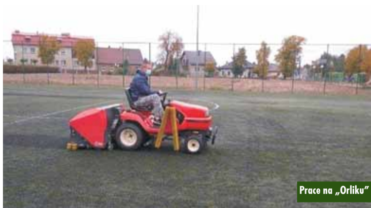
Prace na „Orliku”