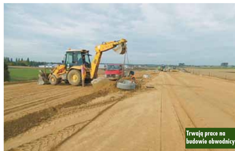
Trwają prace na budowie obwodnicy

drogi, tj. urządzenia ochrony środowiska, elementy i systemy odwodnienia terenu i korpusu drogowego, oświetlenie drogowe, oznakowanie drogi ekspresowej i dróg związanych, urządzenia BRD, m.in. bariery ochronne, osłony przeciwoślennicowe i ogrodzenie drogi ekspresowej, przebudowa kolidujących urządzeń i sieci istniejącej infrastruktury pod- i nadziemnej: urządzeń teletechnicznych i energetycznych, kanalizacji deszczowej, urządzeń melioracyjnych, urządzeń kolejowych i innych.