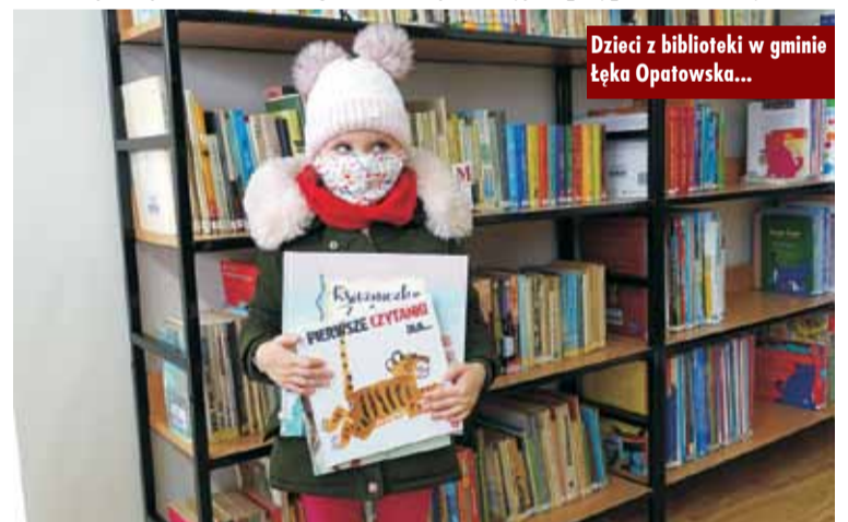
Dzieci z biblioteki w gminie Łęka Opatowska...

czytelniczy upominek. - W wyprawce znajdują coś dla siebie także rodzice – przygotowana dla nich broszura informacyjna przypomni o korzyściach