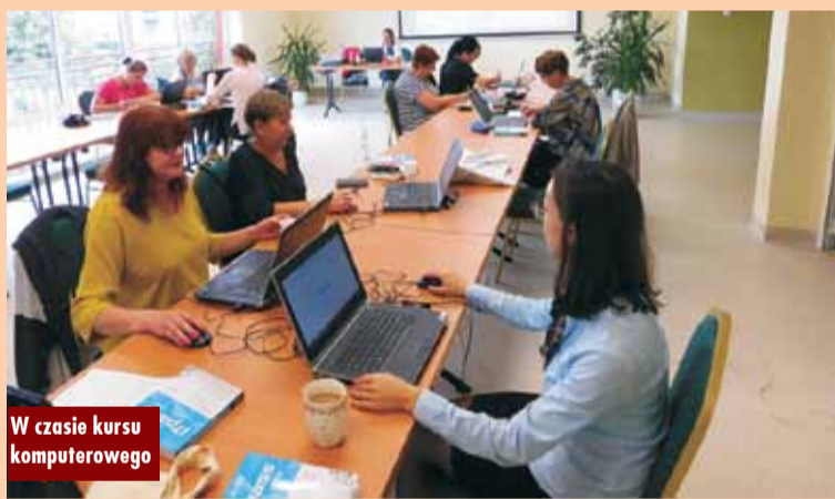
W czasie kursu komputerowego