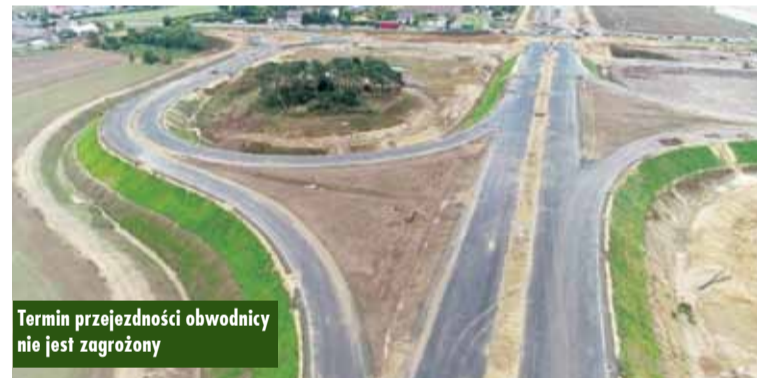
Termin przejeźdźności obwodnicy nie jest zagrożony

Jak informuje Agata Andruszewska z działu ds. komunikacji społecznej Generalnej Dyrekcji Dróg Krajowych i Autostrad w Opolu: - Stan zaawansowania prac na dzień 28.10.2020 r. wynosi ok. 80%. Do tej pory zrealizowane zostały prace związane z robotami drogowymi: wycinka drzew i krzewów (100%), zdjęcie warstwy ziemi urodzajnej - humusu (100%), wzmocnienie podłoża pod nasyp (100%), wykopy pod trasę S11 i węzły (99%), budowa korpusu nasypu trasy głównej S11 i dróg poprzecznych (99%), wykonanie górnej warstwy nasypu - GWN (99%), wykonanie warstwy wzmacniającej pod konstrukcję nawierzchni (95%), podbudowa zasadnicza z kruszywa WMS (75%) i warstwa wiążąca (75%).