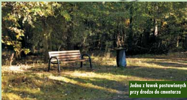
Jedna z ławek postawionych przy drodze do cmentarza

Droga do cmentarza w Bralinie to ruchliwy ciąg komunikacyjny na terenie tej miejscowości. Wiele mieszkańców gminy porusza się po tej drodze pieszo bądź rowerem. Dlatego też, odpowiadając na zgłaszaną przez użytkowników drogi potrzebę, Gmina Bralin zamontowała ławki ogrodowe na całej długości tego odcinka drogi. Pozwolą one na chwilę się zatrzymać i w pięknej scenerii wypocząć przed dalszą drogą. Przy każdej ławce znaleźć również można koszyk na śmieci. - Mamy nadzieję, że postawione ławki przy drodze leśnej uczeszą mieszkańców, ale jednocześnie pamiętajmy o odpowiednim z nich korzystaniu, tak, by służyły wszystkim jak najdłużej. Dziękujemy właścicielom działek leśnych, za