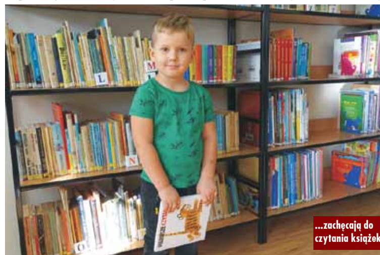
...zachęcają do czytania książek