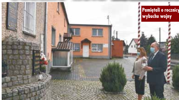
Pamiętali o rocznicy wybuchu wojny

1 września 1939 roku o godz. 4.47 niemiecki pancernik Schleswig-Holstein ostrzelał polską składnicę wojskową na Westerplatte. Wcześniej Niemcy zbombardowali Tczew i Wieluń.