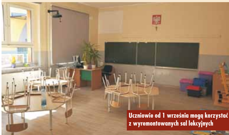
Uczniowie od 1 września mogą korzystać z wyremontowanych sal lekcyjnych

Szkoły na terenie gminy Bralin bardzo dobrze wykorzystały czas wakacji i pandemicznej przerwy. Uczniowie od 1 września mogą korzystać z pięknych, wyremontowanych przestrzeni. KW