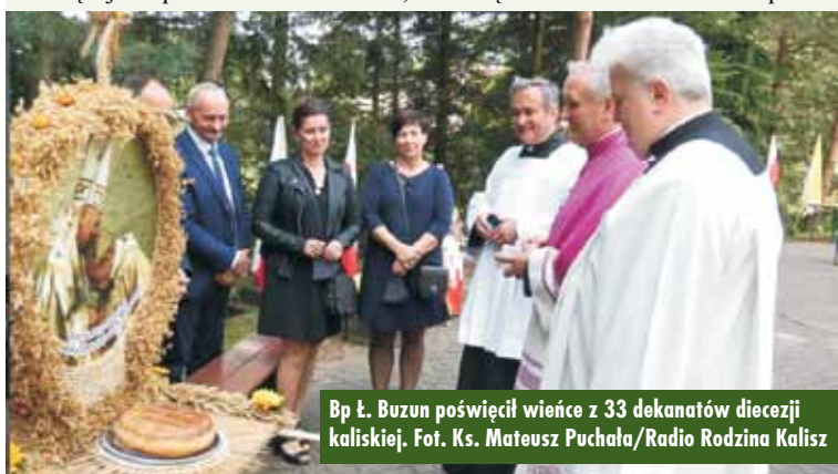
Bp Ł. Buzun poświęcił wieńce z 33 dekanatów diecezji kaliskiej.

Przybyli na miejsce zdarzenia Zespół Ratownictwa Medycznego, po przebadaniu poszkodowanego mężczyzny, podjął decyzję o przenieś transportowaniu go do szpitala w Kępnie. KR