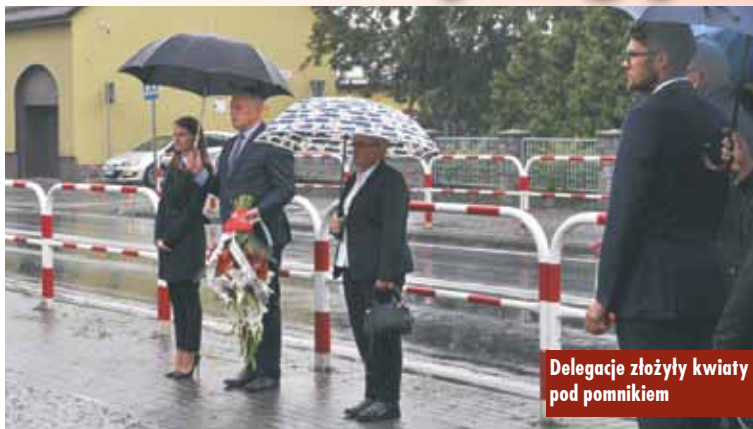
Delegacje złożyły kwiaty pod pomnikiem

We wtorek, 1 września br., punktualnie o godzinie 17.00, odbyła się uroczystość upamiętniająca wybuch II wojny światowej. Pod pomnikiem