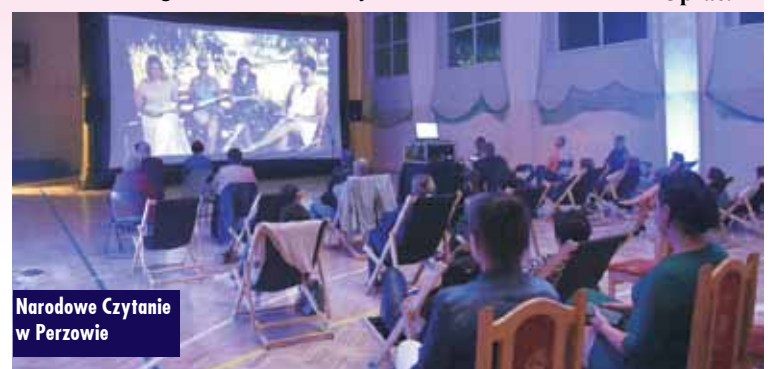
Narodowe Czytanie w Perzowie