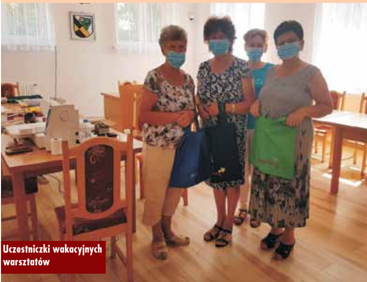
Uczestniczki wakacyjnych warsztatów