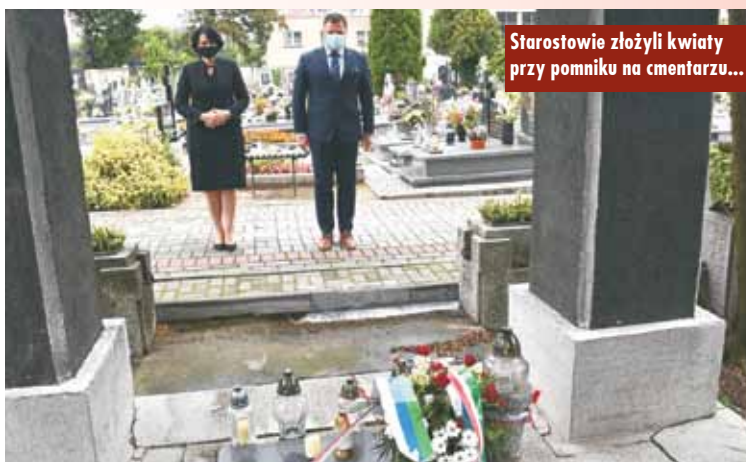
Starostowie złożyli kwiaty przy pomniku na cmentarzu...

Największa wojna światowa w historii objęła niemal każdy zakątek globu i pochłonęła miliony istnień ludzkich. Pamięć o tamtych tragicznych wydarzeniach i wojennych bohaterach, dzięki którym możemy żyć w wolnym kraju, powinna być pielęgnowana przez każdego z nas. KR