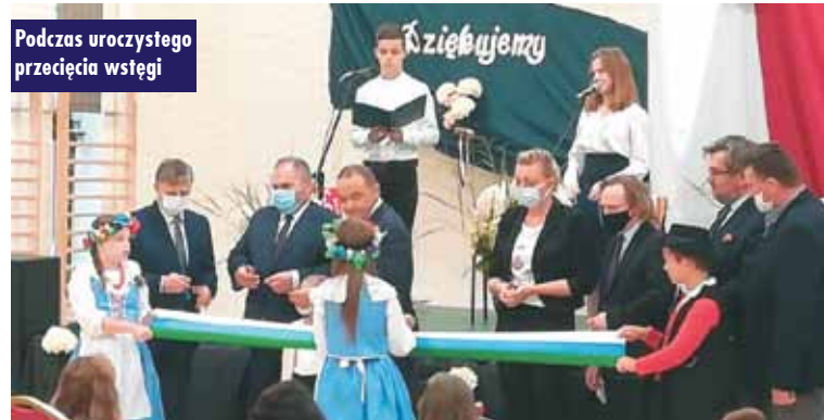
Podczas uroczystego przecięcia wstęgi

Szkoła Podstawowa w Krążkowach rozbudowana została o salę