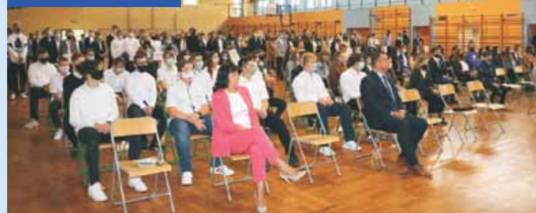
W czasie uroczystości rozpoczęcia roku szkolnego...

W dalszej części wystąpienia dyrektor nawiązała do sukcesów ubiegłorocznych. Przedstawiła najważniejsze zadania stojące przed społecznością szkolną w nowym roku szkolnym oraz złożyła zebrany życzenia na nadchodzący rok.