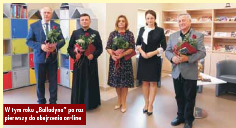
W tym roku „Balladyna” po raz pierwszy do obejrzenia on-line

W Gminnej Bibliotece Publicznej w Trzcínicy mieszkańcy gminy