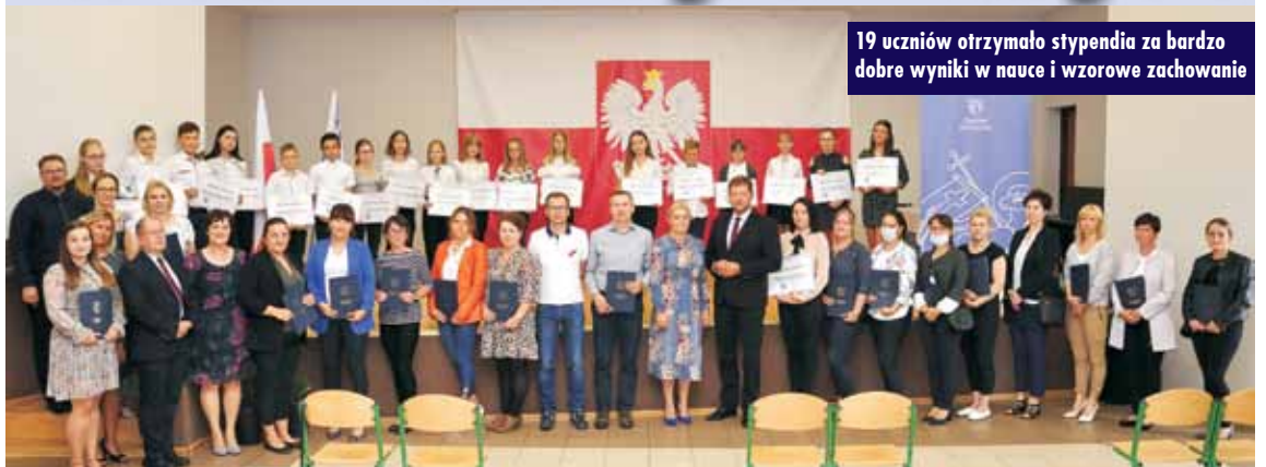
19 uczniów otrzymało stypendia za bardzo dobre wyniki w nauce i wzorowe zachowanie

W ostatnim dniu wakacji w Świątlicy Środowskiej w Rychtalu miało miejsce wręczenie pierwszych w historii gminy Rychtal Stypendiów Wójta Gminy za bardzo dobre wyniki w nauce i wzorowe zachowanie. Stypendium otrzymało 19 uczniów ze szkół podstawowych.