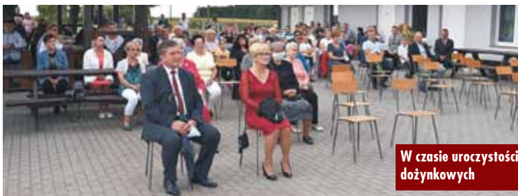
W czasie uroczystości dożynkowych

W okolicznościowym przemówieniu wójt gminy podkreślił znaczenie trudnej i niełatwej pracy na roli oraz złożył rolnikom podziękowania i wyrazy szacunku i uznania. Oprac. m