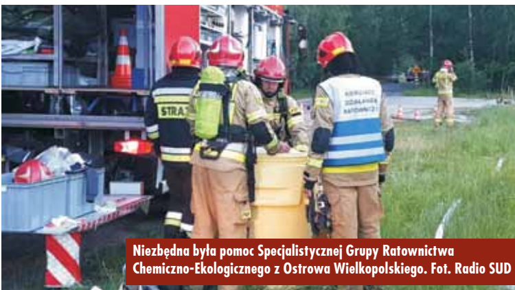
Niezbędna była pomoc Specjalistycznej Grupy Ratownictwa Chemiczno-Ekologicznego z Ostrowa Wielkopolskiego.

Umowa na przekazanie dotacji celowej dla kępińskiego szpitala