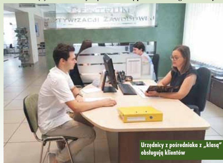
Urzednicy z posredniaka z „klasą” obsługują klientów

Pod tym względem Powiatowy Urząd Pracy w Kępnie uplasował się na I miejscu w Polsce z uwagi na trwałe wprowadzenie osób bezrobotnych na rynek