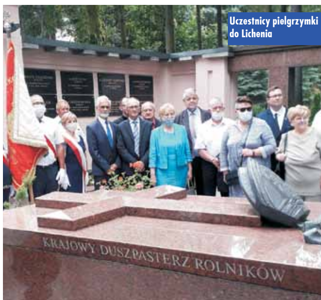
Uczestnicy pielgrzymki do Lichenia