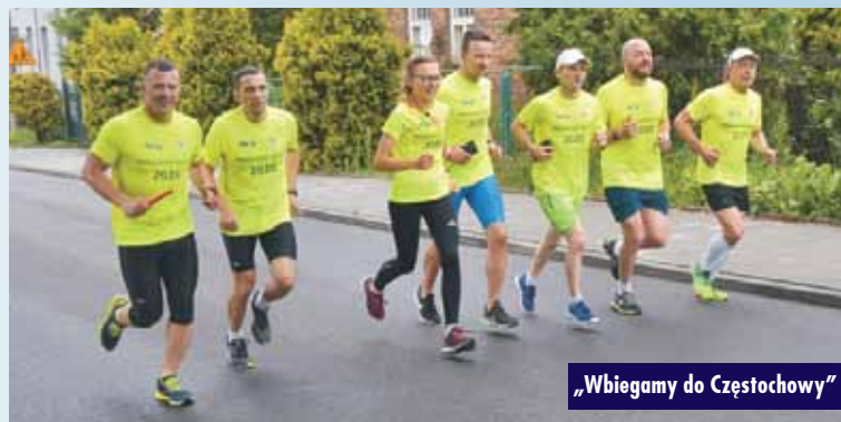
„Wbiegamy do Częstochowy”

wyników w bieganiu... Każdy zawodnik na każdym dystansie biega lepiej ode mnie i jestem najmłodszy z ekipy. Dlaczego mnie wybrano?? Podobno poprzez charakter, jaki mam, ale i dokonaną zmianę w swoim życiu... O północy krótkie zebranie, modlitwa i zrozumienie celu, po co i dla kogo