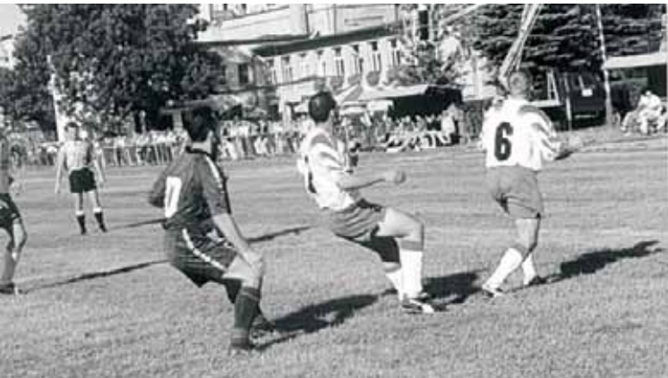
Historia meczów Piasta Błaszki z Polonią Kępno sięga początku lat 50-tych. 29 lipca 1998 roku na Stadionie Miejskim w Kępnie rozegrano spotkanie, którego stawka była inna niż wszystkie. Biało-niebiescy, odpadając z dalszej rywalizacji, zaprzepaścili szansę na grę z drugoligowym Naprzodem Rydułtowy