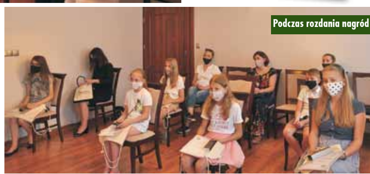
Podczas rozdania nagród

Podpisanie umowy na zadanie pn. „Remont chodnika i zjazdów na ul. Nowej w Bralinie”