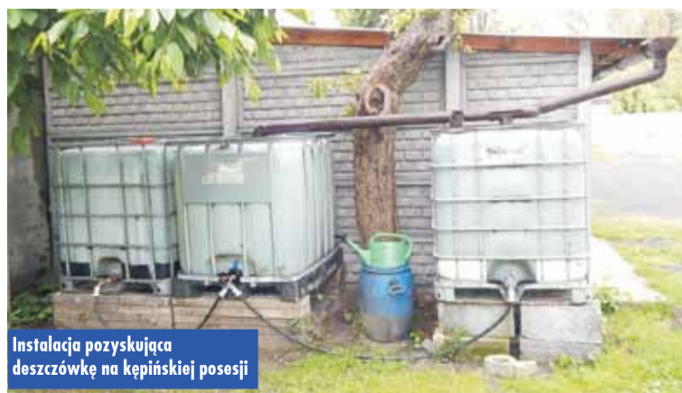
Instalacja pozyskująca deszczówkę na kępińskiej posesji

mi do podlewania ogródka. - Cieszy mnie, że ktoś wreszcie zauważył pogłębiające się u nas braki wodne i na założenie małych zbiorników jest