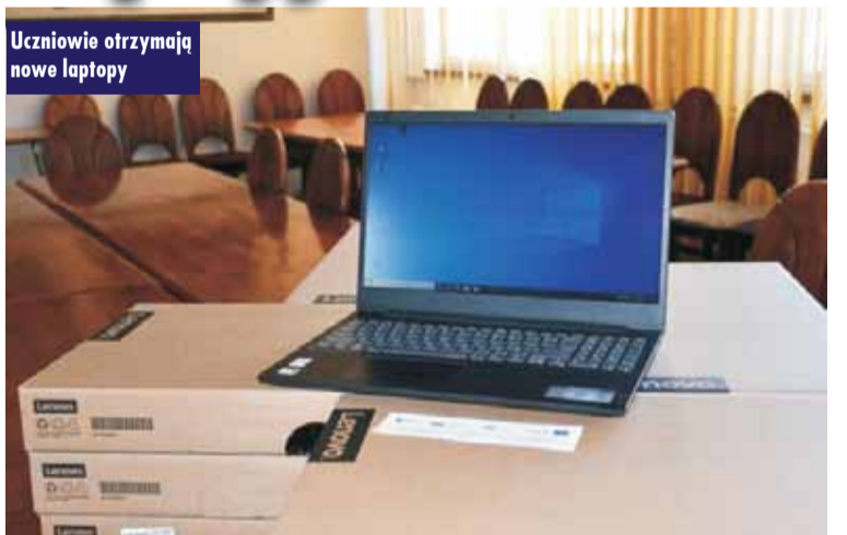
Uczniowie otrzymują nowe laptopy

Gmina Perzów znalazła się na liście wniosków o przyznanie dofinansowania w ramach Programu Operacyjnego Polska Cyfrowa na lata 2014-2020, ZDALNA SZKOŁA. Dofinansowanie obejmuje zakup laptopów dla uczniów, którzy nie posiadają sprzętu umożliwiającego realizację zdalnych lekcji. Na realizację tego zadania gmina otrzymała dofinansowanie w wysokości 44 800 zł co stanowi 100% wartości zakupu sprzętu. Zakupione laptopy, łącznie 16 szt. przekazane zostaną odpowiednio do Zespołu Szkół w Perzowie oraz do Zespołu Szkół w Trębaczowie. - Szkoły, na podstawie wcześniej przeprowadzonego rozeznania prześlą laptopy uczniom, którzy mają największe problemy z dostępem do sprzętu i organizacją całego procesu uczenia się z domu. Zgodnie