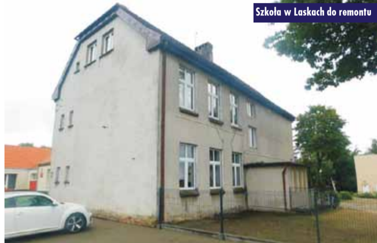
Szkola w Laskach do remontu

możliwość poszerzenia prac o wymianę elementów drewnianych strychu na tym budynku.