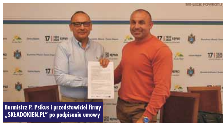
Burmistrz P. Psikus i przedstawiciel firmy „SKŁADOKIEN.PL” po podpisaniu umowy

Wartość kontraktu wynosi 1.371.850 zł brutto. Zadanie zostanie zrealizowane do 5 października br.