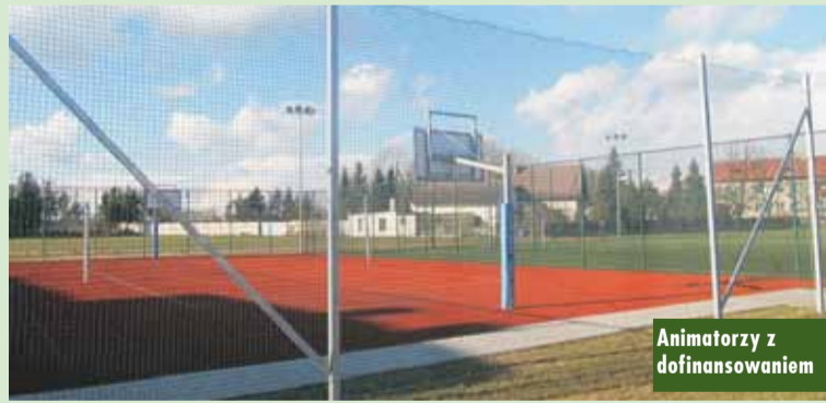
Animatorzy z dofinansowaniem

Nowe zakupy komputerów z programu „Zdalna szkoła+”