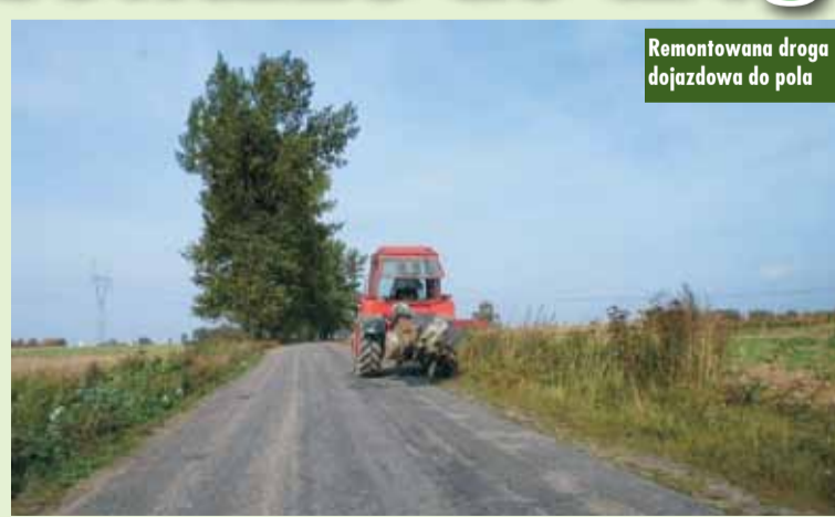
Remontowana droga dojazdowa do pola