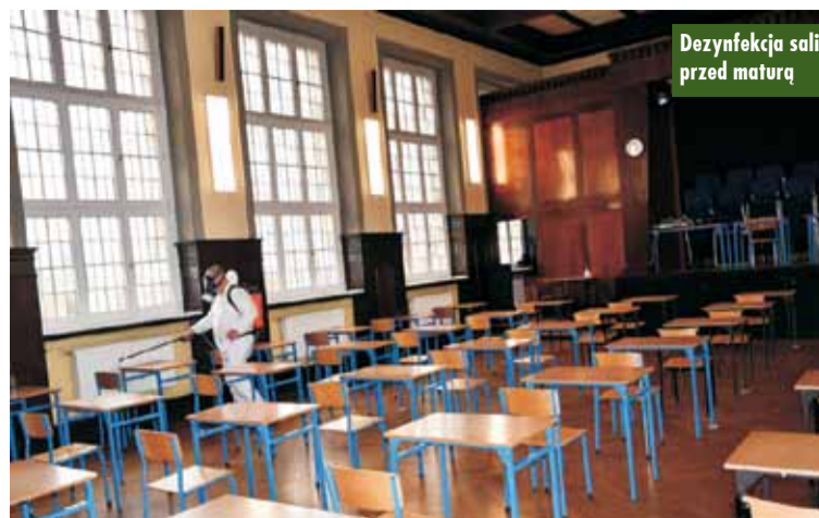
Dezynfekcja sali przed maturą