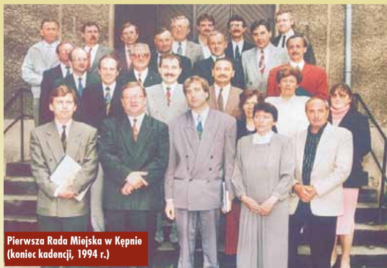
Pierwsza Rada Miejska w Kępnie (koniec kadencji, 1994 r.)

Reforma samorządowa z 1990 r. miała niepełny charakter. Kolejny etap reformy administracyjnej został wprowadzony 1 stycznia 1999 r. Polegał na stworzeniu dwóch dodatkowych szczebli samorządu – powiatów i samorządowych województw. Tych ostatnich miało być od tego momentu nie 49, ale 16. Powstały samorządy wojewódzkie i powiatowe. W 2002 r. po raz pierwszy wybory samorządowe obejmowały również