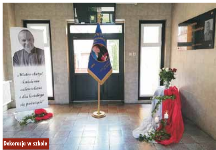
Dekoracja w szkole