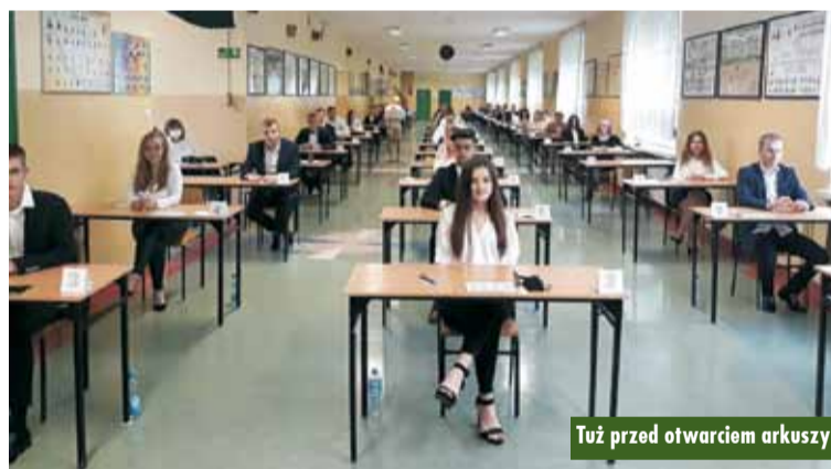
Tuż przed otwarciem arkuszy

W tym roku do egzaminu maturalnego w powiecie kępińskim przystąpi 312 tegorocznych absolwentów (tj. 93%); z czego 106 z Liceum Ogólnokształcącego nr I (100 %), 52 z Liceum Ogólnokształcącego nr II (100%), 105 z Technikum nr 1 (94 %) oraz 49 z Technikum nr 2 (75,4 %). - Ze względu na wyjątkową sytuację egzaminów przeprowadzone zostaną według szczegółowych wytycznych Głównego Inspektora Sanitarnego oraz Ministerstwa Edukacji Narodowej, z zachowaniem odpowiedniej odległości między zdającymi, wy-