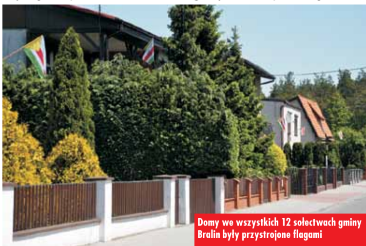
Domy we wszystkich 12 sołectwach gminy Bralin były przystrojone flagami

W liście od wójta Piotra Holosia mieszkańcy znaleźli wszystkie informacje, z okazji jakich świąt flaga gminy Bralin będzie eksponowana.