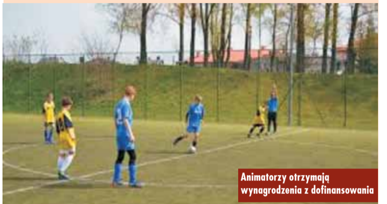
Animatorzy otrzymują wynagrodzenia z dofinansowania

lem jest upowszechnianie aktywności fizycznej i sportu wśród dzieci i młodzieży poprzez udział w sportowych zajęciach pozalekcyjnych, dofinan-