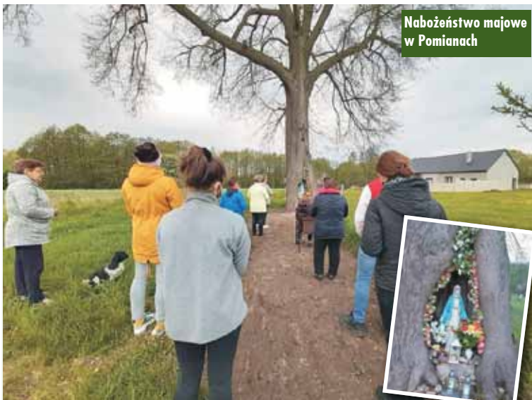
Nabożeństwo majowe w Pomianach

W Trzcinińskich majówki odprawiane są codziennie: w kościele, przy figurze Matki Bożej Licheńskiej, Wodnicznej, Teklin, Pomiany, Aniołka Pierwsza, Janówka. Ks. Wiesław