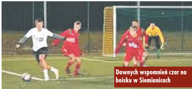
Dawnych wspomnień czar na boisku w Siemianicach

Zgodnie z informacją Prezesa Rady Ministrów związaną ze zniesieniem kolejnych obostrzeń w związku z wprowadzeniem stanu epidemii koronawirusa COVID-19, na podstawie Rozporządzenia Rady Ministrów