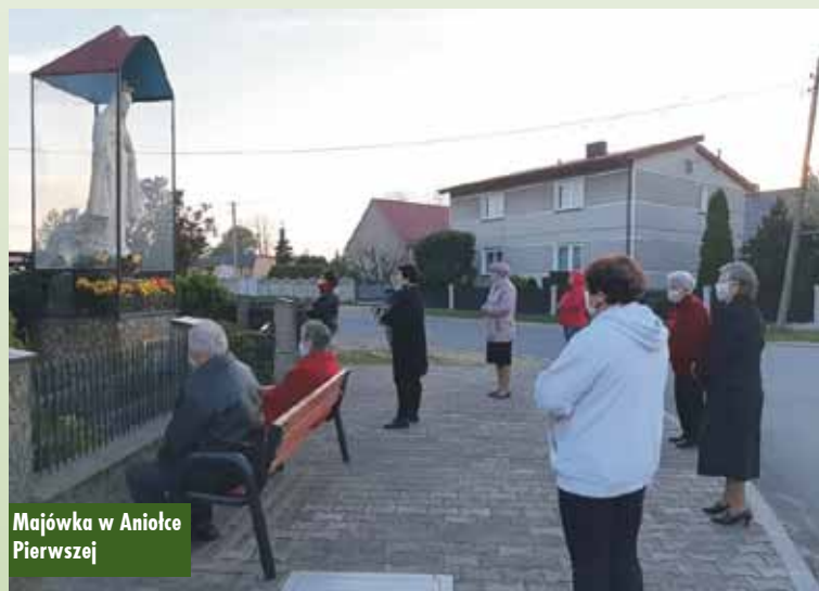
Majówka w Aniołce Pierwszej

sto modlący się dodawali do niej własne wezwania, w 1631 r. Święta Kongregacja Obrzędów zakazała dokonywania w tekście samowolnych zmian. Nowe wezwania posiadały aprobatę Kościoła i wynikały z rozwoju mariologii. W Polsce jest o jedno wezwanie więcej. W okresie międzywojennym, po zatwierdzeniu przez Stolicę Apostolską uroczystości Najświętszej Maryi Panny Królowej Polski, za zgodą papieża Piusa XI, do Litanii dołączono wezwanie „Królowo Polski”.