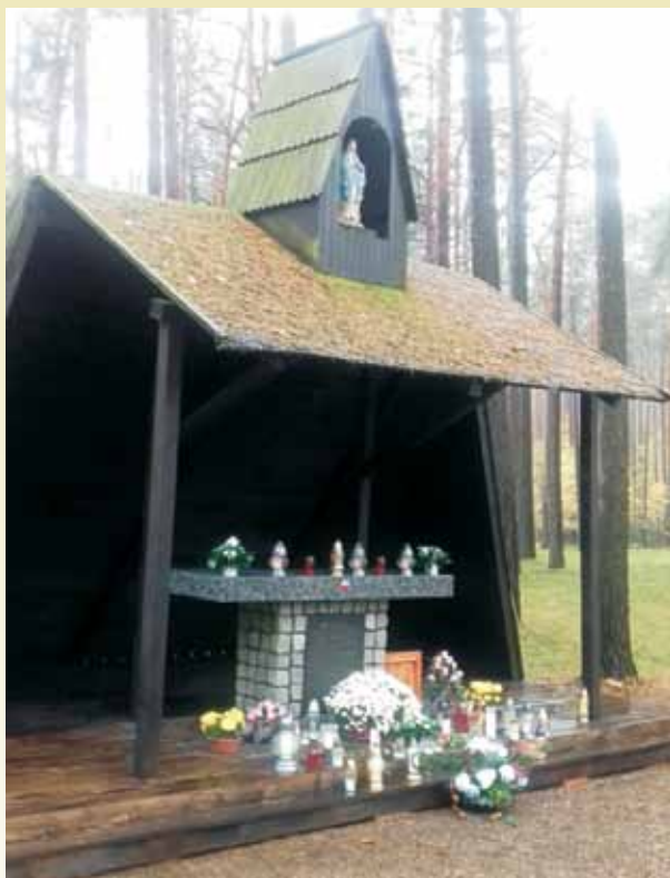
Kapliczka z polowym ołtarzem – świadectwo ludobójstwa w Lasach Rożnowickich, z urnami z różnych miejsc pamięci pomordowanych Polaków oraz tablicą pamięci ofiar zamordowanych księży.

Należy dodać, że np. w obozie niemieckim w Bydgoszczy zginęło kilka tysięcy Polaków, a w tym około 800 ofiar to dzieci, których też nie oszczędzano.