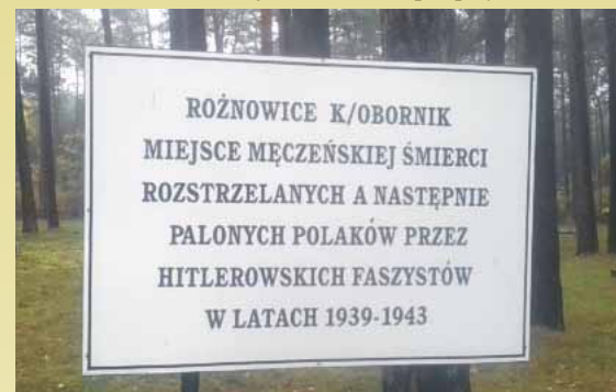
Informacja świadectwa ludobójstwa w miejscu zbrodni w Lasach Rożnowickich.

dłoni powstańcy polskiego! Proszę zobaczyć, że podpis ten w drodze do wolności oraz do rodziny niemieckiej, nie musiał podpisywać nawet