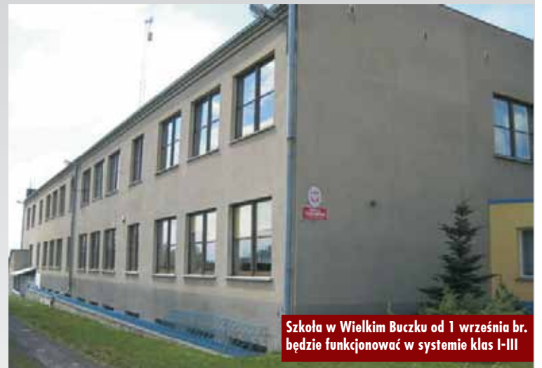
Szkoła w Wielkim Buczku od 1 września br. będzie funkcjonować w systemie klas I-III

Buczku zwrócili się z prośbą o pomoc w utworzeniu Szkoły Stowarzyszeniowej. - Nieprawdą jest informacja, że wójt i Rada nie zezwolili na