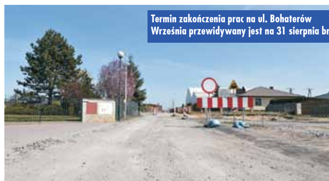
Termin zakończenia prac na ul. Bohaterów Września przewidywany jest na 31 sierpnia br.

Publikujemy dane z komunikatów Powiatowego Centrum Zarządzania Kryzysowego w Kępnie