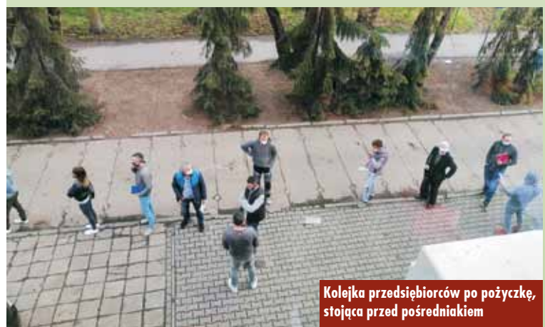
Kolejka przedsiębiorców po pożyczkę, stojąca przed pośredniakiem

Jednak pomimo pandemii pracodawcy dalej zatrudniają, ale ich oferty są skromniejsze niż przed kryzysem. - W marcu i kwietniu tego roku spadło zapotrzebowanie na pracowników i przedsiębiorcy zgłosili ofer-