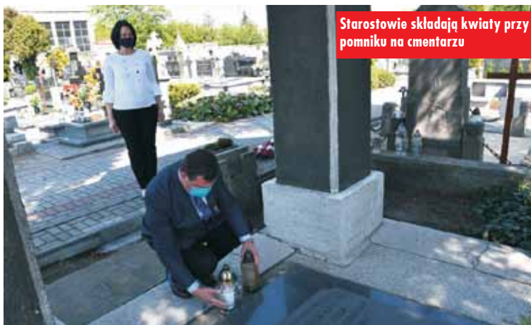
Starostowie składają kwiaty przy pomniku na cmentarzu