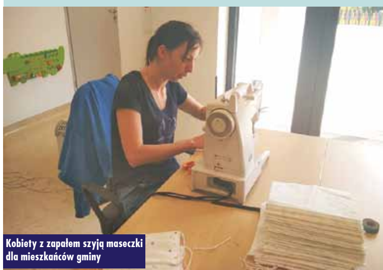
Kobiety z zapałem szyją maseczki dla mieszkańców gminy

się pracownicy Przedszkola i Żłobka w Łęce Opatowskiej, pracownicy Żłobka w Opatowie oraz pracownicy Zespołu Szkół w Siemianicach. Urząd Gminy zakupił niezbędne materiały do uszycia maseczek. Jedni kroją materiał, inni szyją, jeszcze