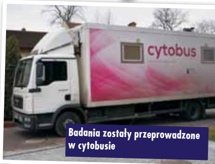
Badania zostały przeprowadzone w cytobusie