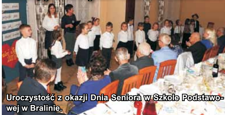
Uroczystość z okazji Dnia Seniora w Szkole Podstawowej w Bralinie.

Uczniowie i nauczyciele Szkoły Podstawowej im. Mikołaja Kopernika w Bralinie pamiętają o seniorach. Wyrazem tego było spotkanie w murach szkoły.