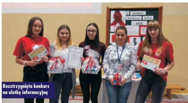
Rozstrzygnięto konkurs na ulotkę informacyjną

W trakcie spotkania omówione zostały też wyniki konkursu na najlepszą ulotkę. Zwycięska klasa III A oraz zespoły z pozostałych klas otrzymały słodkie upominki, a także materiały edukacyjne ufundowane przez Powiatową Stację Sanitarno-Epidemiologiczną w Kępnie. Był też czas na podsumowanie kampanii społecznej oraz zwrócenie uwagi na ważne hasło, jakie widniało na zwycięskiej ulotce: „Świadomi żyją dłużej.” Bo tak naprawdę wiedza na temat wirusa HIV i świadome unikanie sytuacji, w których można się nim zarazić, jest kluczem do zapobiegania nieuleczalnej chorobie, jaką jest AIDS. Każdy uczestnik spotkania przy wyjściu otrzymał od wolontariuszek ulotkę i miał za zadanie podzielić się z rodziną oraz przyjaciółmi tą cenną dla życia i zdrowia wiedzą. R. Klepacz