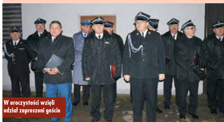
W uroczystości wzięli udział zaproszeni goście

Gmina Łęka Opatowska otrzymała dotację na wyposażenie gabinetu profilaktyki zdrowotnej w Zespole Szkół w Opatowie