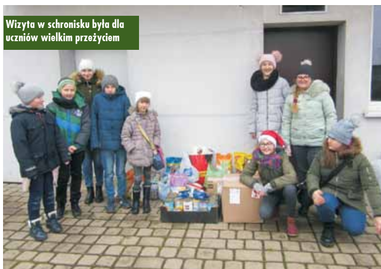
Wizyta w schronisku była dla uczniów wielkim przeżyciem