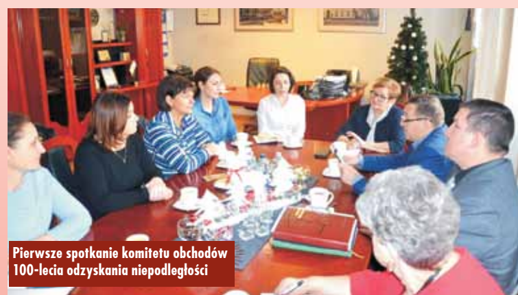
Pierwsze spotkanie komitetu obchodów 100-lecia odzyskania niepodległości