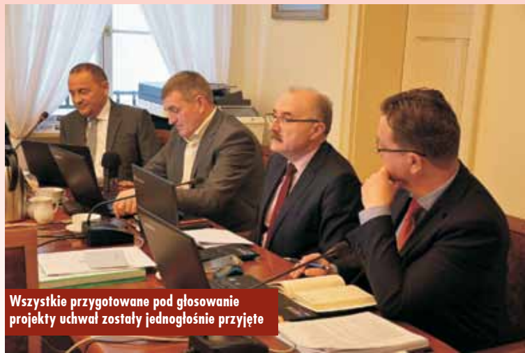
Wszystkie przygotowane pod głosowanie projekty uchwał zostały jednogłośnie przyjęte

- To szansa dla rozwoju tej działalności w gminie Kępno. Chcemy przeprowadzić szereg inwestycji i zmodernizować plac, jak również poprawić warunki pracy handlujących i osób korzystających z targowiska. Podstawowa zmiana to