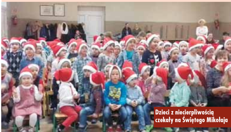
Dzieci z niecierpliwością czekały na Świętego Mikołaja

Uczniowie Szkoły Podstawowej w Świbie odwiedzili Międzygminne Schronisko w Wysocku Wielkim, aby przekazać karmę zgromadzoną podczas zbiórki