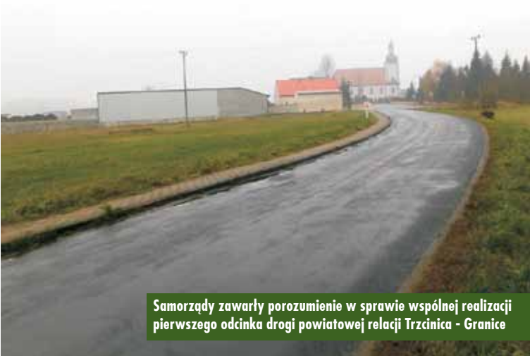
Samorządy zawarły porozumienie w sprawie wspólnej realizacji pierwszego odcinka drogi powiatowej relacji Trzcinica - Granice

pierwszego odcinka drogi powiatowej relacji Trzcinica - Granice. Powiat ze środków własnych i przyznanych przez wojewodę wielkopolskiego przebuduje drogę, natomiast Gmina Trzcinica przekaże środki, które wraz z dofinansowaniem wojewody sfinansują koszty budowy ścieżki pieszo-rowerowej na tym odcinku.