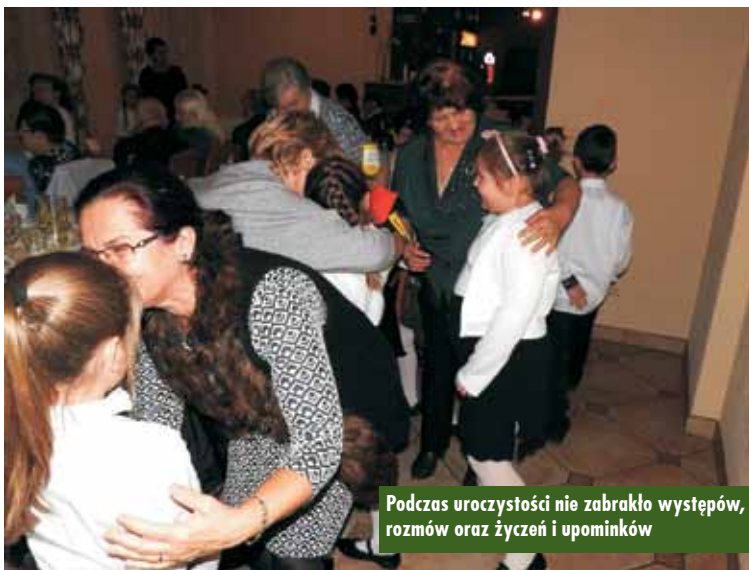
Podczas uroczystości nie zabrakło występów, rozmów oraz życzeń i upominków

„Umiem pływać” – to program nauki pływania skierowany do najmłodszych. Ma dotyczyć uczniów klas I-III szkół podstawowych.