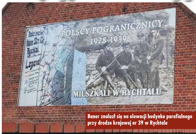
Baner znalazł się na elewacji budynku parafialnego przy drodze krajowej nr 39 w Rychtalu

W 2018 roku w Rychtalu obchodzony będzie „Rok Pograniczników” z okazji 90. rocznicy powstania Polskiej Straży Granicznej.