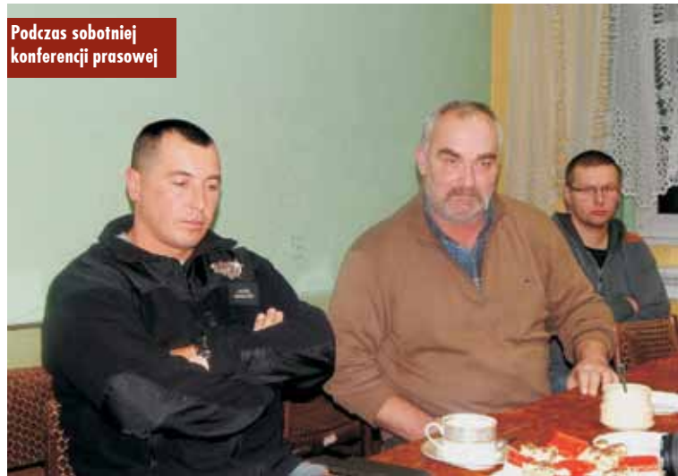
Podczas sobotniej konferencji prasowej

- Dlaczego nam chce się zabrać dzierżawy, straszy się naszych dzierżawców sądami, eksmisją się straszy, skoro porozumienie zawarte w 91 roku wyraźnie stwierdza, co do kogo należy - pytał. - (...) Teraz zrobiliśmy bramę nową dla nowego pojazdu, nie prosząc się miasta. Mieliliśmy pieniądze odłożone z dzierżawy i zrobiliśmy bramę wjazdową za 3,5 tysiąca złotych. Elewacja plus materiał - 16