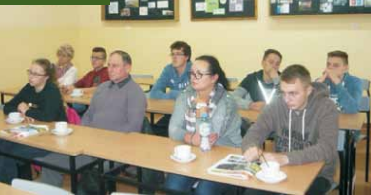
W szkoleniu uczestniczyli uczniowie i rolnicy

Państwowej Inspekcji Pracy w Ostrowie Wielkopolskim.