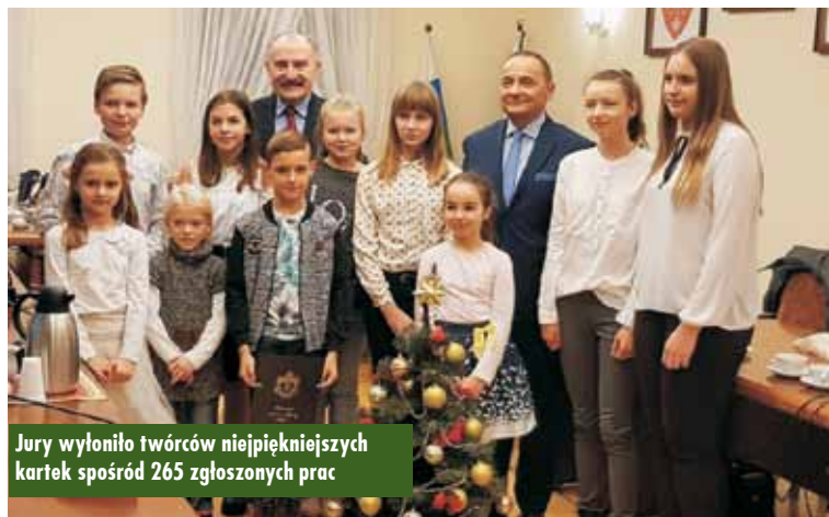
Jury wyłoniło twórców najpiękniejszych kartek spośród 265 zgłoszonych prac

wych z terenu miasta i gminy Kępno. Każdy z uczestników miał za zadanie zaprojektować własną kartkę świąteczną. Liczyły się prace samodzielne – nie grupowe, a każdy mógł zgłosić tylko jedną pracę. Konkurs odbył