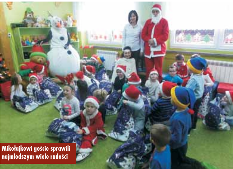
Mikołajkowi goście sprawili najmłodszym wiele radości

Tradycja obdarowywania dzieci drobnymi prezentami w dniu imienin Mikołaja na dobre zdomowila się w gminie Perzów. To szczególnie dzień, na który wszystkie dzieci długo czekają, ponieważ przynosi wiele radości i uśmiechów. W tym roku przedszkole, żłobek oraz szkołę w Perzowie, jak również przedszkole w Trębaczowie odwiedzili wspólnie mili goście - Mikołaj w towarzystwie