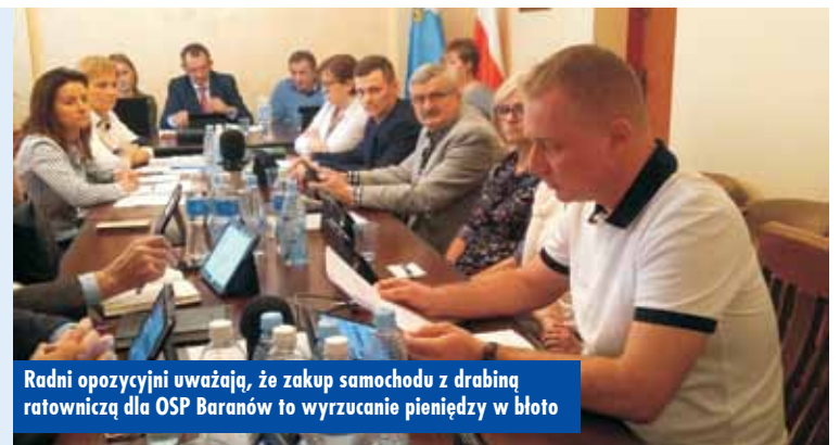
Radni opozycyjni uważają, że zakup samochodu z drabiną ratowniczą dla OSP Baranów to wyrzucanie pieniędzy w błoto