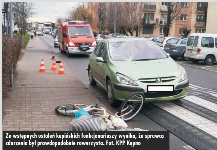
Ze wstępnych ustaleń kępińskich funkcjonariuszy wynika, że sprawcą zdarzenia był prawdopodobnie rowerzysta.

proceedzi KPP Kępno. Ze wstępnych ustaleń kępińskich funkcjonariuszy wynika, że sprawcą zdarzenia był prawdopodobnie rowerzysta.