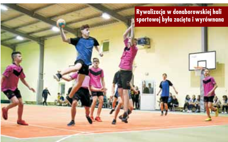
Rywalizacja w donaborowskiej hali sportowej była zacięta i wyrównana