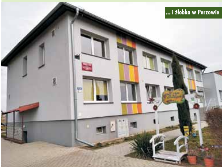
... i żłobka w Perzowie

Z kolei 28 lutego 2020 r. rozstrzygnięty został konkurs ofert w ramach resortowego programu rozwoju instytucji opieki nad dziećmi do lat 3 Maluch 2020. Na funkcjonowanie miejsc opieki nad dziećmi w Żłobku Gminnym w Perzowie Minister Rodziny, Pracy i Polityki Społecznej przyznała Gminie Perzów dofinansowanie w wysokości 38 880 zł. UG