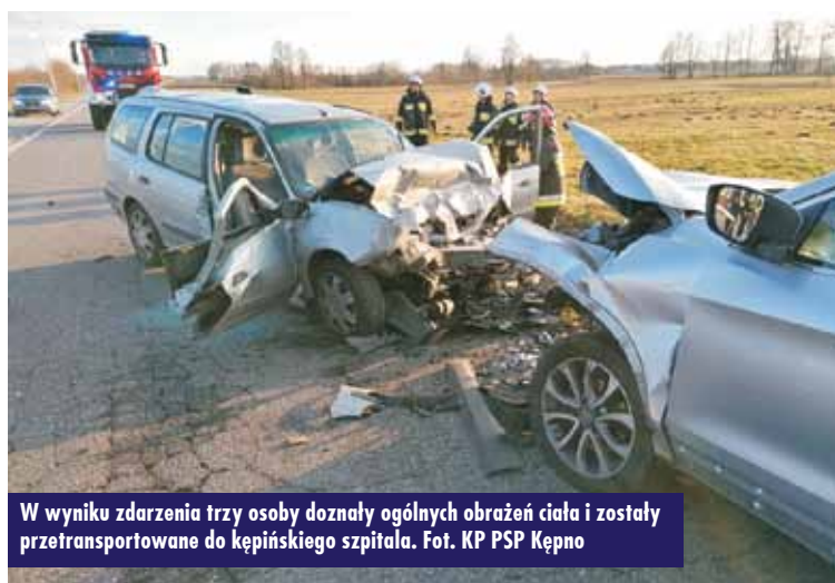
W wyniku zdarzenia trzy osoby doznały ogólnych obrażeń ciała i zostały przetransportowane do kępińskiego szpitala.

Postępowanie w tej sprawie prowadzi Komenda Powiatowa Policji w Kępnie. Wiadomo, że sprawca zdarzenia nie posiadał uprawnień do kierowania pojazdami mechanicznymi. Kierujący byli trzeźwi. KR