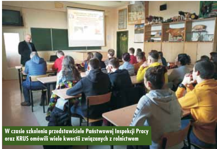
W czasie szkolenia przedstawiciele Państwowej Inspekcji Pracy oraz KRUS omówili wiele kwestii związanych z rolnictwem

go Inspektoratu Pracy w Poznaniu. W seminarium uczestniczyli uczniowie klasy I TD, II TB i III TB – grupa technik agrobiznesu oraz rolnicy, którzy w przyszłości będą przyjmować uczniów na praktyki zawodowe w swoich gospodarstwach.