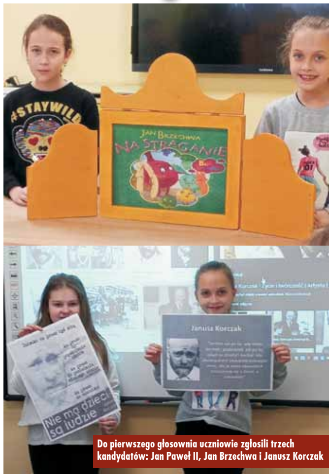
Do pierwszego głosowania uczniowie zgłosili trzech kandydatów: Jan Paweł II, Jan Brzechwa i Janusz Korczak

Od 15 listopada 2019 r. do 15 lutego br. trwało poszukiwanie kandydatów przez całą społeczność szkolną. Uczniowie oraz ich wychowawcy przystąpili do działania. Dzieci wiedziały, że musi być to osoba wyjątkowa. Po długich poszukiwaniach takich autorytetów do głosowania zostało zgłoszonych trzech kandydatów wraz z uzasadnieniem. Są to: Kornel Makuszyński , Jan Paweł II i Henryk Sienkiewicz . Informacje o nich były zaprezentowane na gazetce szkolnej oraz podczas godzin wychowawczych i innych zajęć edukacyjnych.