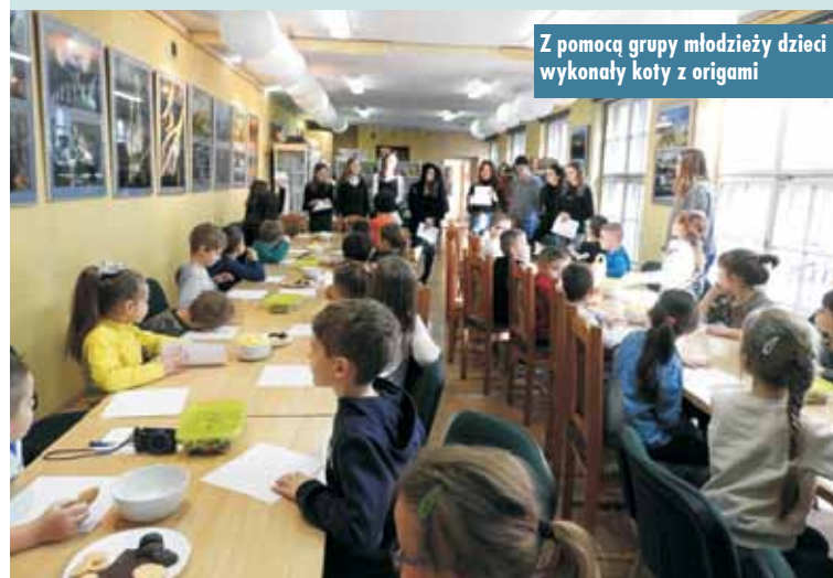
Z pomocą grupy młodzieży dzieci wykonały koty z origami

Grupa młodzieży, która jako wolontariusze pomagała przy imprezie, pokazała dzieciom, jak zrobić koty z origami. Zadanie to bardzo spodobało się dzieciom. Koty zostały pokolorowane i każdy uczestnik zabawy zabrał swoje dzieło do domu.