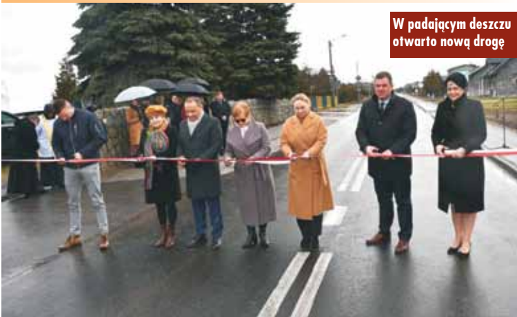
W padającym deszczu otwarto nową drogę

Realizacja inwestycji możliwa była dzięki dofinansowaniu pozyskanemu przez Powiat Kępiński ze środków Funduszu Dróg Samorządowych. W efekcie przebudowano blisko 3,5-kilometrowy odcinek drogi powiatowej łączącej miejscowości Myjomice Ostrówiec i Kierzno. Otwierając drogę, starosta dziękował wszystkim instytucjom i osobom, którzy przyczynili się do realizacji tejże inwestycji. - Szczególnie chcę tu podziękować eurodeputowanej