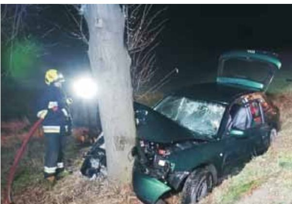
24-latek nie dostosował prędkości do warunków, stracił panowanie nad pojazdem, zjechał do przydrożnego rowu i uderzył w drzewo.

Do zdarzenia zadysponowano także zastępy z Jednostki Ratowniczo-Gaśniczej w Kępnie i OSP Łęka Opatowska. - Samochodem podróżo-