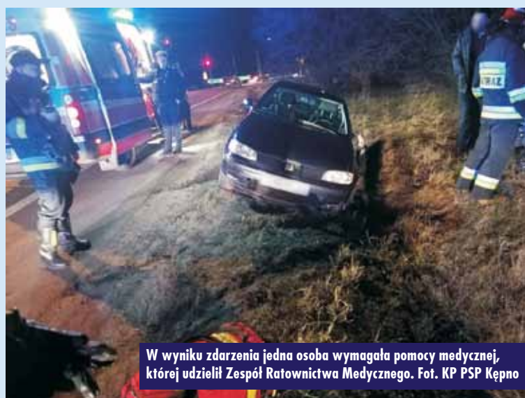
W wyniku zdarzenia jedna osoba wymagała pomocy medycznej, której udzielił Zespół Ratownictwa Medycznego.