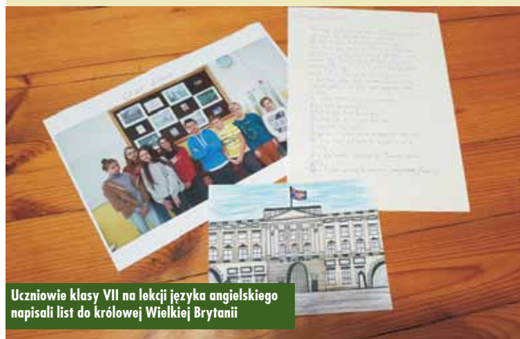
Uczniowie klasy VII na lekcji języka angielskiego napisali list do królowej Wielkiej Brytanii

Rejestrujący samochód w piątek, 28 lutego br. ze zdziwieniem brali numer, nie widząc nikogo przed sobą, można powiedzieć – szczęśliwcy