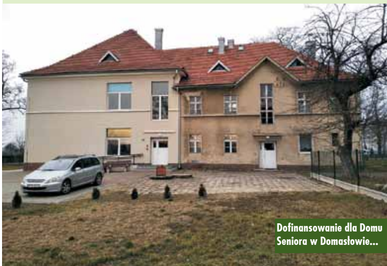
Dofinansowanie dla Domu Seniora w Domasławie...

3 marca 2020 r. minister rodziny, pracy i polityki społecznej Marlena Małag ogłosiła wyniki naboru ofert w ramach Programu Wieloletniego „Senior+” na lata 2015-2020 Edycja 2020.