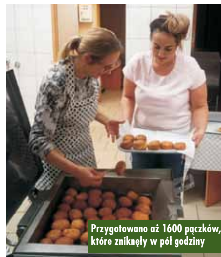
Przygotowano aż 1600 pączków, które zniknęły w pół godziny

przygotowanie domowych pączków. O godzinie 20.00 grupa nauczycieli i rodziców zebrała się w szkolnej kuchni, gdzie przez całą noc z 19 na 20 lutego, dzielnie, z poświęceniem i ser-