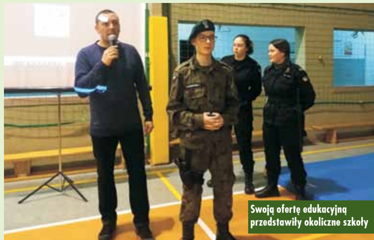
Swoją ofertę edukacyjną przedstawiły okoliczne szkoły

i opolskiego. Swoją ofertę edukacyjną przedstawiły szkoły: Liceum Ogólnokształcące im. mjr Henryka Sucharskiego nr 1 w Kępnie, Zespół Szkół Ponadpodstawowych nr 1 w Kępnie, Zespół Szkół Ponadpodstawowych nr 2 w Kępnie, Zespół Szkół Ponadpodstawowych Centrum