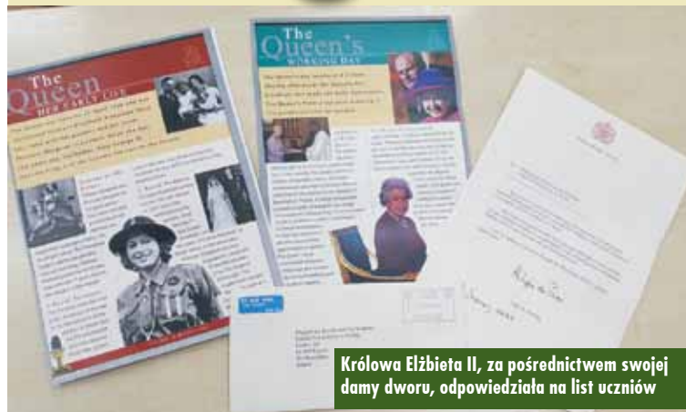
Królowa Elżbieta II, za pośrednictwem swojej damy dworu, odpowiedziała na list uczniów

Szkołę Podstawową w Świbie spotkał duży zaszczyt. Cztery miesiące temu uczniowie klasy VII na lekcji języka angielskiego napisali list zaadresowany do królowej Wielkiej Brytanii – Elżbiety II .