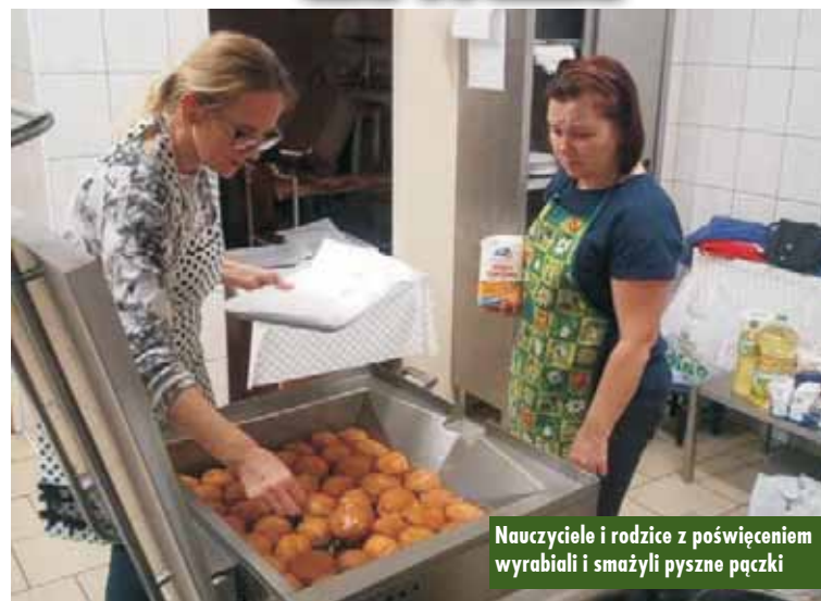
Nauczyciele i rodzice z poświęceniem wyrabiali i smażyli pyszne pączki

19 lutego br., z okazji Tłustego Czwartku, grono pedagogiczne ze Szkoły Podstawowej im. Ojca Konrada Stolarka w Rychtalu wraz z rodzicami podjęło się niecodziennego zadania, jakim było charytatywne