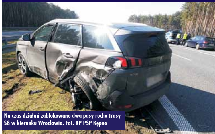
Na czas działań zablokowano dwa pasy ruchu trasy S8 w kierunku Wrocławia.

W czwartek, 5 marca br., około godziny 10.45, dyżurny do Stanowiska Kierowania Komendanta Powiatowego Państwowej Straży Pożarnej w Kępnie otrzymał zgłoszenie o zdarzeniu na 90 km trasy S8 w kierunku Wrocławia. Doszło tam do potrącenia pracownika patrolu S8 oraz kolizji 4 samochodów osobowych, w tym policyjnego radiowozu. Do zdarzenia zadysponowano zastępy z Jednostki Ratowniczo-Gaśniczej w Kępnie i OSP Bralin, funkcjonariuszy Komendy Powiatowej Policji w Kępnie oraz