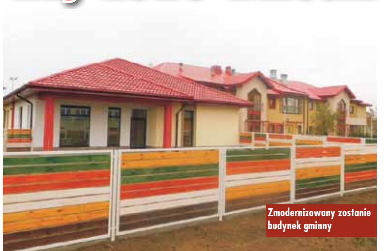
Zmodernizowany zostanie budynek gminny

Oprócz dużych wniosków inwestycyjnych Gmina Trzcinica stara się pozyskać środki na mniejsze zadania. W lutym 2020 roku zostały przygotowane i złożone nowe wnioski o dofinansowanie z Urzędu Marszałkowskiego w Poznaniu na prace konserwatorskie, restauratorskie lub roboty budowlane przy zabytku pn. „Wymiana stolarki okiennej budynku pałacowego położonego w miejscowości Pomiany gmina Trzcinica”.