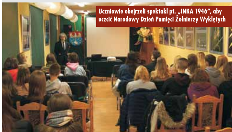
Uczniowie obejrżeli spektakl pt. „INKA 1946”, aby uczcić Narodowy Dzień Pamięci Żołnierzy Wyklętych

sanitariuszce i łączniczce w V Brygadzie Wileńskiej Armii Krajowej mjr Zygmunta Szendzielorza „Łupaszki”. Jednym z zarzutów, jakie jej postawiono, było mordowanie rannych jeńców z Urzędu Bezpieczeństwa – ludzi, którym w rzeczywistości ratowała życie.