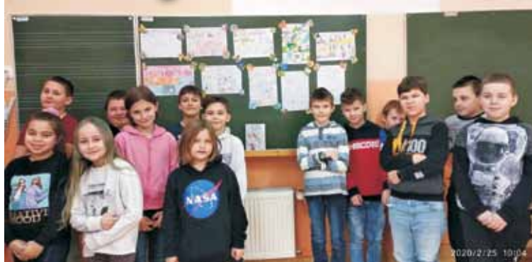
Uczniowie bralińskiej szkoły w swoich autorskich komiksach przedstawili dalsze losy bohaterów lektury pt. „Kajko i Kokosz”

25 lutego br. w klasie IVa Szkoły Podstawowej im. Mikołaja Kopernika w Bralinie odbyła się lekcja języka polskiego, której celem była prezentacja autorskich komiksów. Uczniowie przedstawili dalsze losy bohaterów lektury pt. „Kajko i Kokosz”.