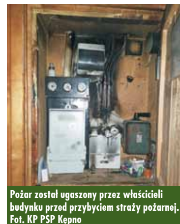
Pożar został ugaszony przez właścicieli budynku przed przybyciem straży pożarnej.

W Mianowicach doszło do zdarzenia z udziałem samochodu osobowego