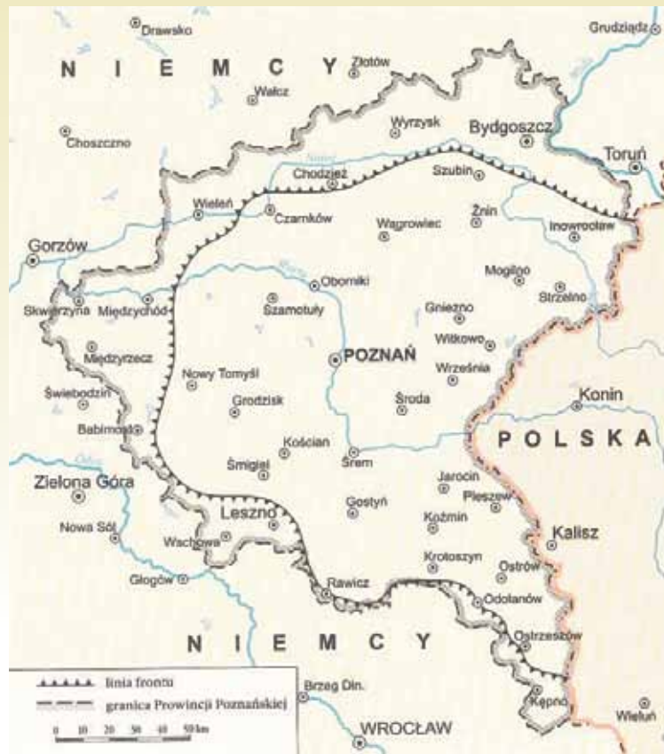
Linia frontu powstańczego z 10 stycznia 1919 roku