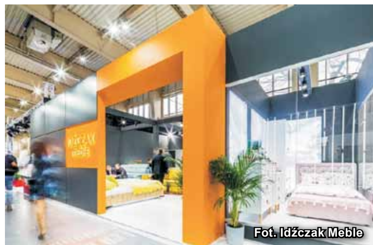
Fot. Idźczak Meble