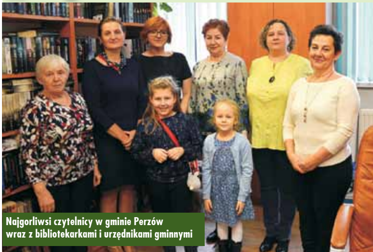
Najgorliwsi czytelnicy w gminie Perzów wraz z bibliotekarkami i urzędnikami gminnymi

7 lutego odbyło się uroczyste wręczenie nagród czytelnikom, którzy w 2019 roku systematycznie przychodzili do biblioteki i wypożyczyli dużą ilość książek. Plebiscyt jest organizowany przez Bibliotekę Publiczną w Perzowie od kilku lat. Jego głównym zadaniem jest promocja czytelnictwa, utrwalanie nawyku czytania już od najmłodszych