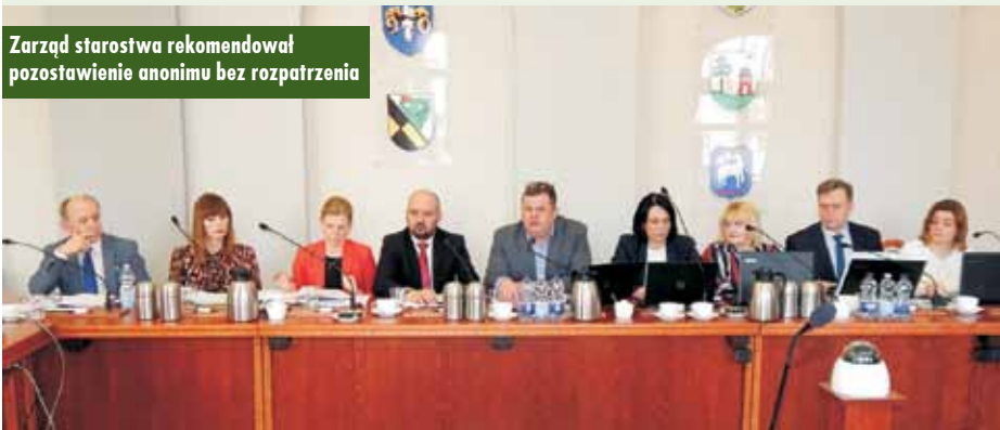
Zarząd starostwa rekomendował pozostawienie anonimu bez rozpatrzenia