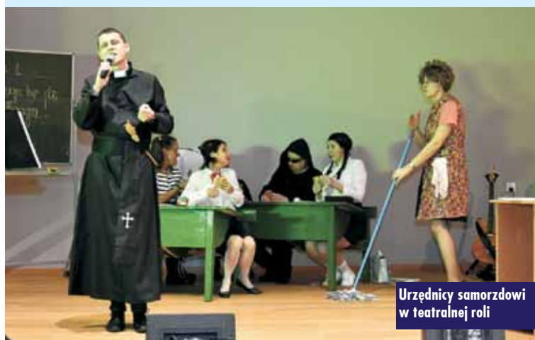
Urzednicy samorzadowi w teatralnej roli

Gminny Ośrodek Kultury w Perzowie składa serdeczne podziękowania wszystkim, którzy w jakikolwiek sposób wsparli organizację wydarzenia w Perzowie. Oprac. m