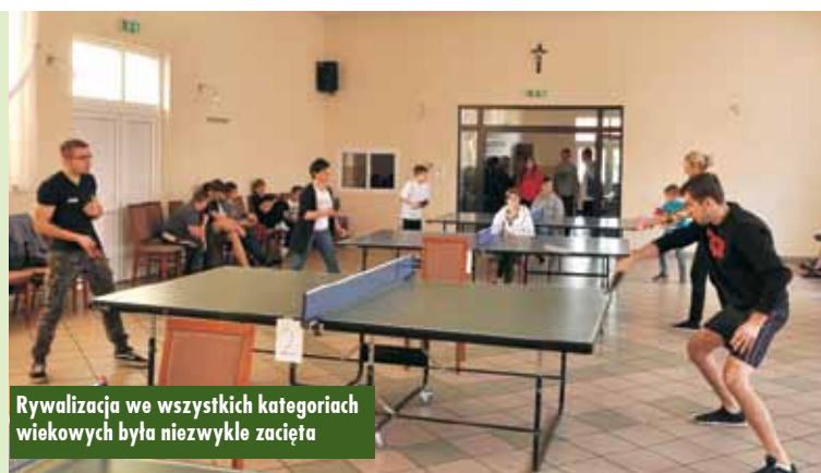
Rywalizacja we wszystkich kategoriach wiekowych była niezwykle zacięta

Maki oraz mieszkańców sołectwa. Na wszystkich zawodników biorących udział w zawodach czekał napój i ciepły posiłek oraz ciasto przygotowane przez organizatorów, a dodatkowo najmłodszy uczestnicy sportowej