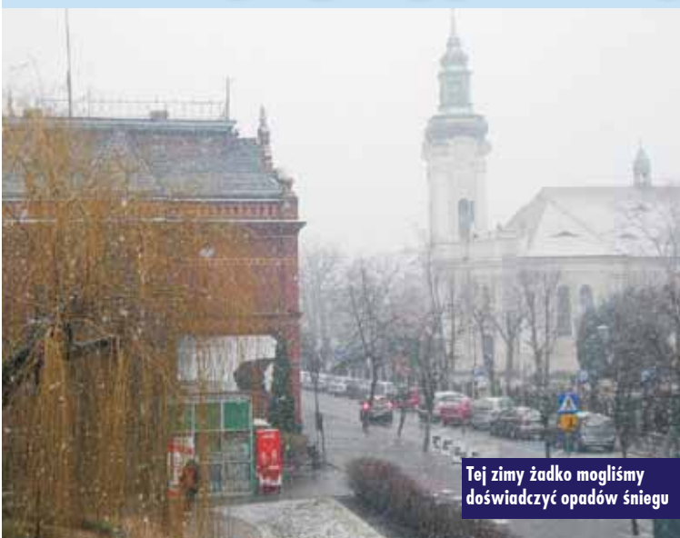
Tej zimy żadko mogliśmy doświadczyć opadów śniegu

W piątkowy poranek (godz. 8.00) 28 lutego br. przez niespełna półgodziny odnotowaliśmy w Kępnie wyjątkowe zjawisko atmosferyczne. A mianowicie przy temperaturze +1 stopień zaczął padać intensywnie śnieg. To zjawisko niespotykane w naszym regionie tej zimy. Ostat-