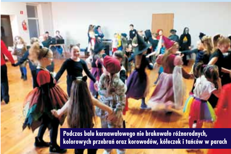
Podczas balu karnawałowego nie brakowało różnorodnych, kolorowych przebrań oraz korowodów, kółeczek i tańców w parach

środowiskowa zamieniła się w prawdziwą salę balową. Zaroiło się tam od spidermanów, piratów, rycerzy, kowbojów rodem z Dzikiego Zachodu, policjantów, strażaków, żołnierzy, były wróżki, księżniczki, różne stwo-