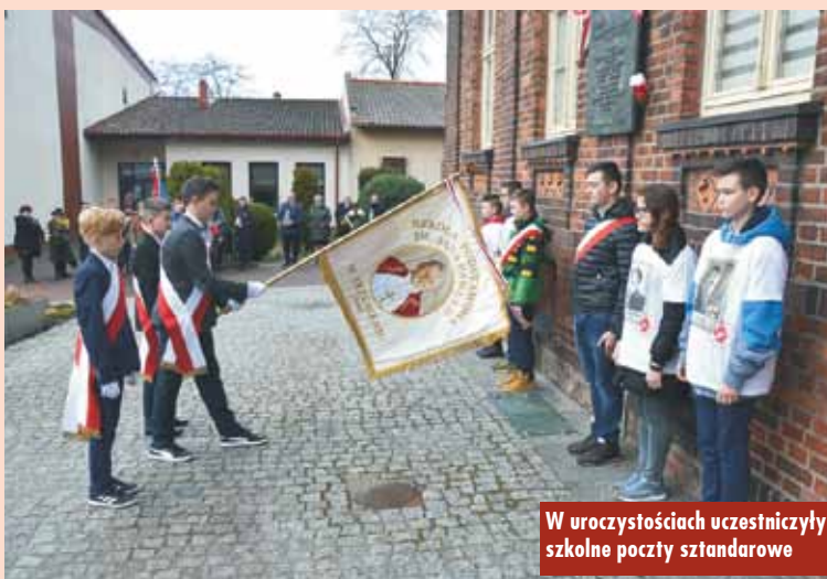
W uroczystościach uczestniczyli szkolne poczty sztandarowe

W sali widowiskowej urzędu gminy odbył się apel ku czci pamięci Żołnierzy Niezłomnych przygotowany przez uczniów z Zespołu Szkół w Łęce Opatowskiej. Uroczys-