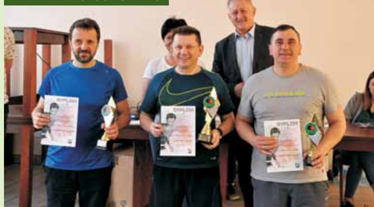
Turniej tenisa przyniósł wszystkim jego uczestnikom wiele pozytywnych emocji