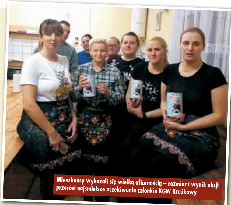
Mieszkańcy wykazali się wielką ofiarnością – rozmiar i wynik akcji przerósł najśmielsze oczekiwania członkiń KGW Krążkowy