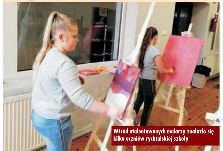
Wśród utalentowanych malarzy znalazło się kilku uczniów rychtańskiej szkoły