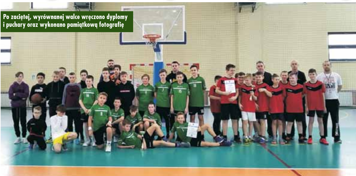
Po zaciętej, wyrównanej walce wręczono dyplomy i puchary oraz wykonano pamiątkową fotografię

25 i 26 lutego br. w Szkole Podstawowej im. Ojca Konrada Stolarka w Rychtalu, a dokładniej w miejscowej hali sportowej, odbyły się Mistrzostwa Szkół w Piłce Koszykowej, zorganizowane w ramach powiatowych, szkolnych imprez sportowych – XXI Igrzyska Dzieci.