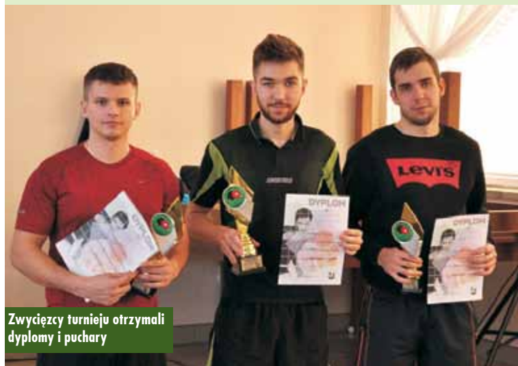
Zwycięzcy turnieju otrzymali dyplomy i puchary