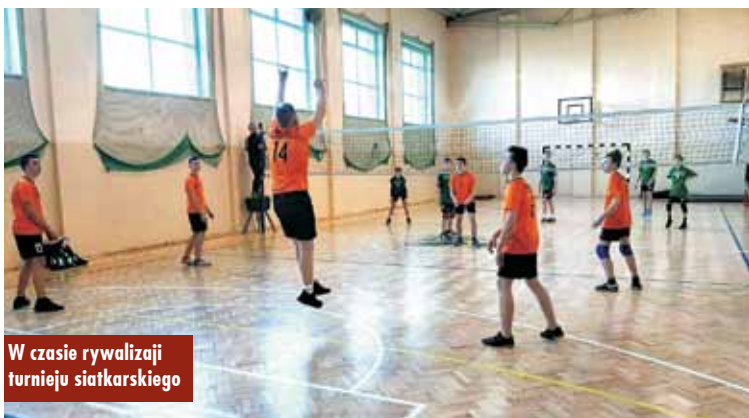
W czasie rywalizacji turnieju siatkarskiego

Zawody przebiegły w sympatycznej atmosferze. Pamiątkowe puchary oraz dyplomy wręczyli dyrektorzy SP w Perzowie. Oprac. m