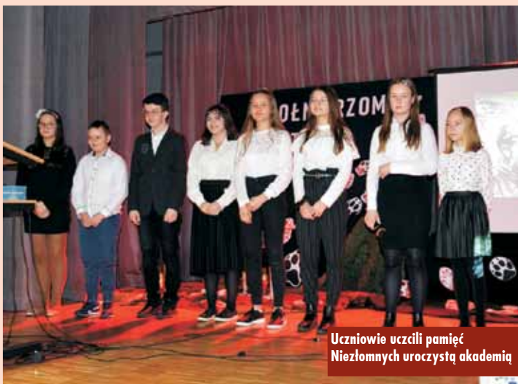
Uczniowie uczcili pamięć Niezłomnych uroczystą akademią

Gmina Łęka Opatowska także włączyła się w obchody Narodowego Dnia Pamięci Żołnierzy Wyklętych. W poniedziałek, 2 marca mszą świętą w kościele pw. św. Maksymiliana Kolbe rozpoczęły się gminne obchody. Po nabożeństwie delegacje w asyście pocztów sztandarowych złożyły wiązanki kwiatów i zapaliły znicze pod tablicą upamiętniającą Żołnierzy Wyklętych, znajdującą się przy rząd-