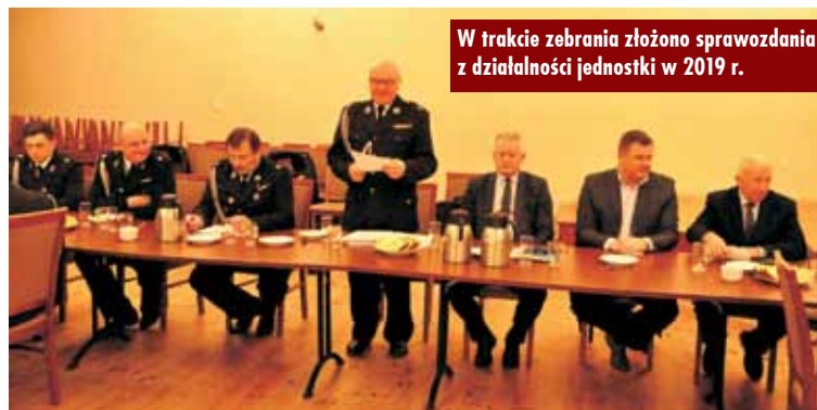
W trakcie zebrania złożono sprawozdania z działalności jednostki w 2019 r.

Również na pozostałych zebraniach sprawozdawczych w jednostkach OSP na terenie gminy Bralin, które odbywały się od stycznia do początku marca br., strażacy rozma-