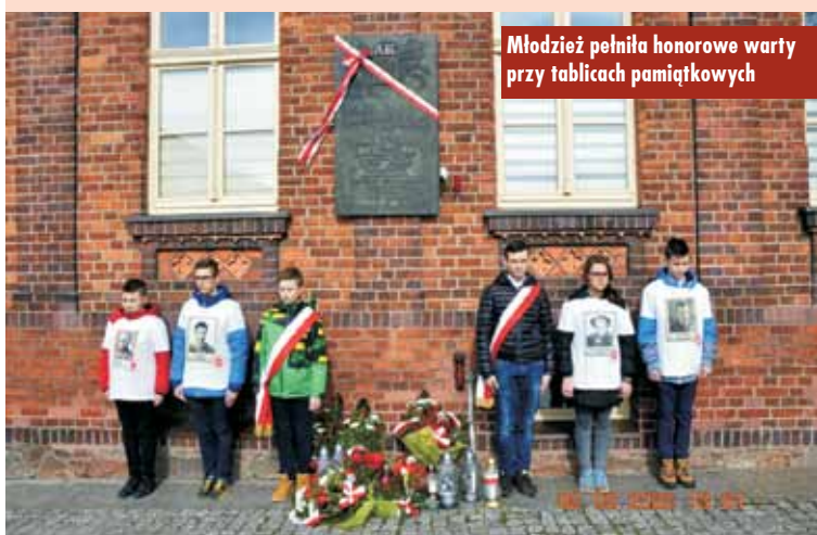
Młodzież pełniła honorowe warty przy tablicach pamiątkowych