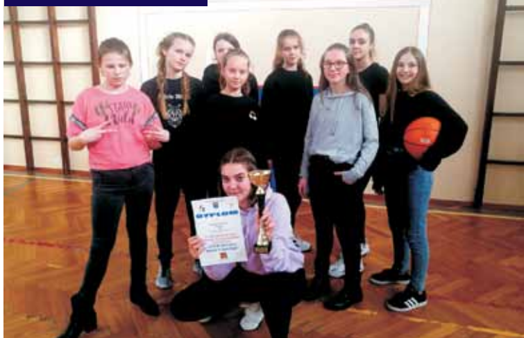
Zawodniczki z bralińskiej szkoły zostały wicemistrzyniami powiatu