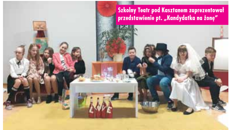
Szkolny Teatr pod Kasztanem zaprezentował przedstawienie pt. „Kandydatka na żonę”

W walentynkowe święto, z inicjatywy Samorządu Uczniowskiego i jego opiekunów, tradycyjnie zorganizowano też pocztę walentynkową. Wszyscy, którzy chcieli przekazać życzenia swoim sympatiom, wrzucali kartki walentynkowe (w większości własnoręcznie wykonane) do specjal-