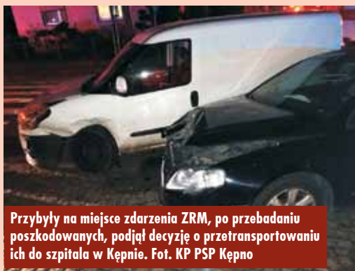
Przybyły na miejsce zdarzenia ZRM, po przebadaniu poszkodowanych, podjął decyzję o przetransportowaniu ich do szpitala w Kępnie.

Pożar budynku gospodarczego w Słupi pod Kępnem