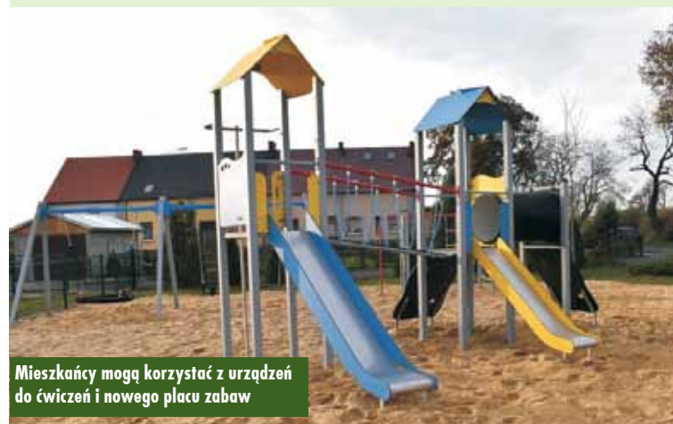
Mieszkańcy mogą korzystać z urządzeń do ćwiczeń i nowego placu zabaw

W skład siłowni zewnętrznej wchodzi takie urządzenia jak: biegacz, orbitrek, wioślarz, prasa nożna/wyciąg górny, motyl integracyjny, wahadło/odwodziciel. Plac zabaw wyposażony jest w: zestaw sprawnościowy, huśtawkę, zestaw zabawowy, karuzelę oraz bujak. Natomiast strefa relaksu została wyposażona w betonowy stół do gry w piłkarzyki oraz stół z siedziskami i oparciami do gry w „chińczyka” oraz szachy i warcaby. Na terenie obiektu zamontowano również ławki z oparciem, kosze na śmieci, tablicę informacyjną i stojak