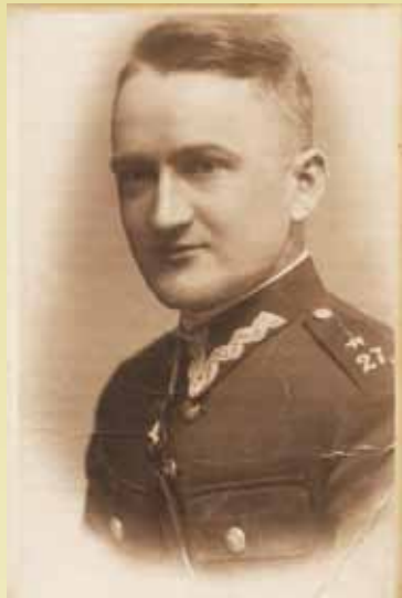
Portret Zenona Polaka z 1939 r.

„Nie było wyjścia z sytuacji. Rząd nasz ogłosił mobilizację częściową. Gorączka wojny ogarnęła