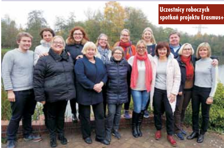
Uczestnicy roboczych spotkań projektu Erasmus+

Kilka dni pełnych wytężonej pracy, ale i wielu wrażeń kulturalnych minęło szybko, teraz trwa już wprowadzanie w życie konferencyjnych ustaleń, młodzież uczestnicząca w projekcie wykonuje kolejne działania, współpracując z rówieśnikami z partnerskich szkół i przygotowując się do wiosennej konferencji. Marek Froń