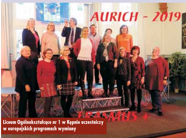
Liceum Ogólnokształcące nr I w Kępnie uczestniczy w europejskich programach wymiany

Mieliśmy też okazję zwiedzić Organium Weener, gdzie zgromadzone