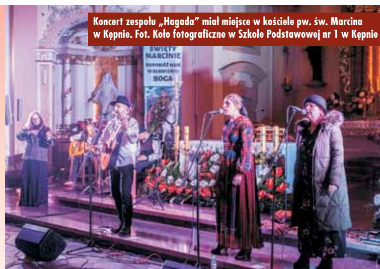
Koncert zespołu „Hagada” miał miejsce w kościele pw. św. Marcina w Kępnie.

Pierwsza część X Spotkania na Styku Kultury, Religii i Czasów odbyła się w sobotni wieczór, 23 listopada, w kościele pw. św. Marcina w Kępnie. W świątyni miało miejsce spotkanie ekumeniczne i msza święta z udziałem duchownych trzech wyznań: rzymskokatolickiego, ewangelickiego i grekokatolickiego. Tak jak przed 10 laty wystąpił zespół „Hagada” z Krotoszyna, dla którego inspiracją jest tradycyjna, religijna muzyka żydowska.