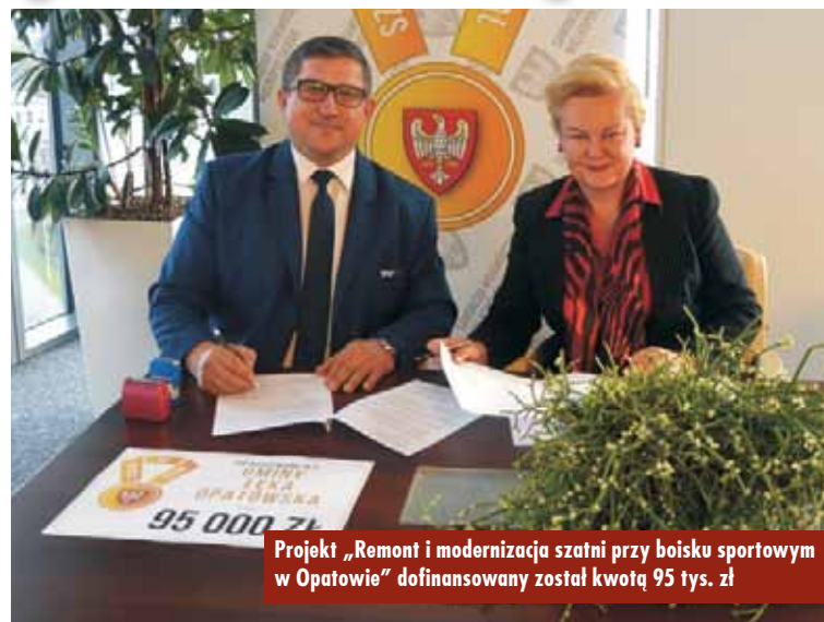
Projekt „Remont i modernizacja szatni przy boisku sportowym w Opatowie” dofinansowany został kwotą 95 tys. zł