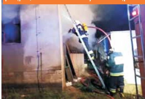
Z pożarem walczyły jednostki: JRG Kępno, OSP Baranów, OSP Słupia pod Kępnem, OSP Mroczeń i OSP Jankowy.