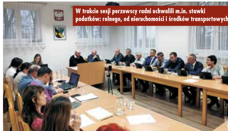
W trakcie sesji perzowscy radni uchwalili m.in. stawki podatków: rolnego, od nieruchomości i środków transportowych

Następnie podjęto uchwałę, w skutek której możliwa będzie zapłata podatków i opłat stanowiących