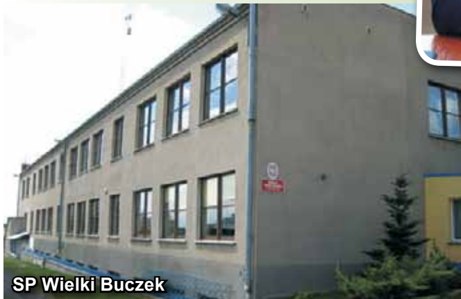
SP Wielki Buczek