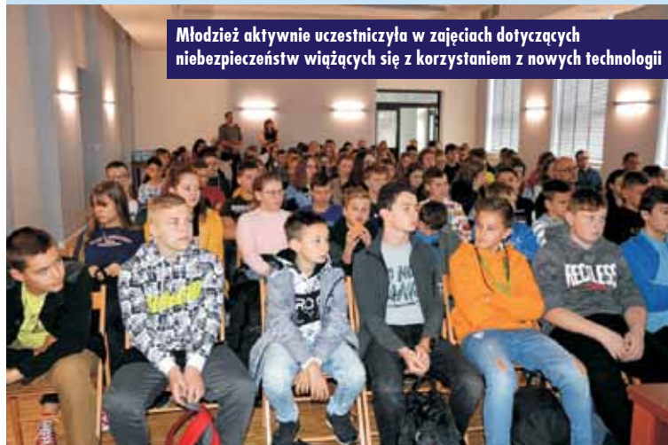
Młodzież aktywnie uczestniczyła w zajęciach dotyczących niebezpieczeństw wiążących się z korzystaniem z nowych technologii