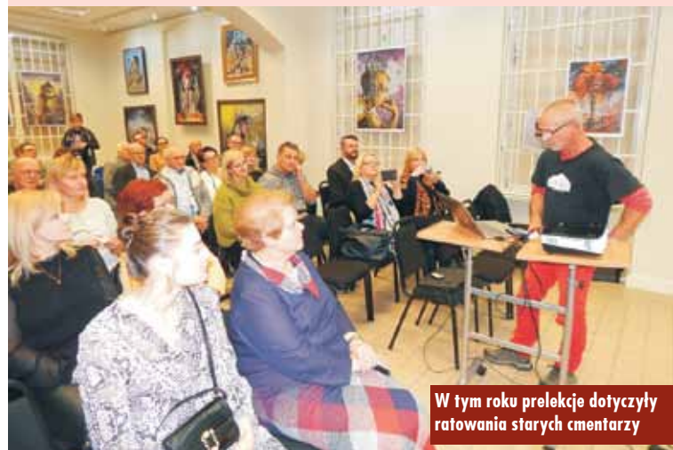
W tym roku prelekcje dotyczyły ratowania starych cmentarzy

O czym najbardziej lubią rozmawiać bibliotekarki? Oczywiście, że o książkach! Taki był też temat listopadowego spotkania bibliotekarzy, które odbyło się 13 listopada 2019 roku w Powiatowej Bibliotece Publicznej w Kępnie