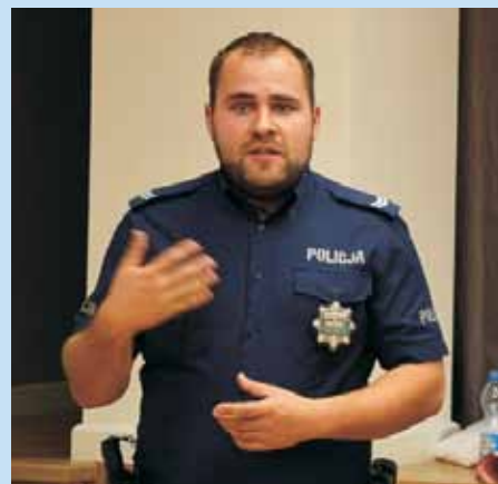
W spotkaniu dla rodziców uczestniczyli także przedstawiciele Komendy Powiatowej Policji w Kępnie

Powinnością osób dorosłych, dbających o właściwy rozwój i relacje ze swoimi pociechami, jest poznanie i przeciwdziałanie zagrożeniom. Co raz więcej nastolatków nie wyobraża sobie dnia bez telefonu komórkowego.