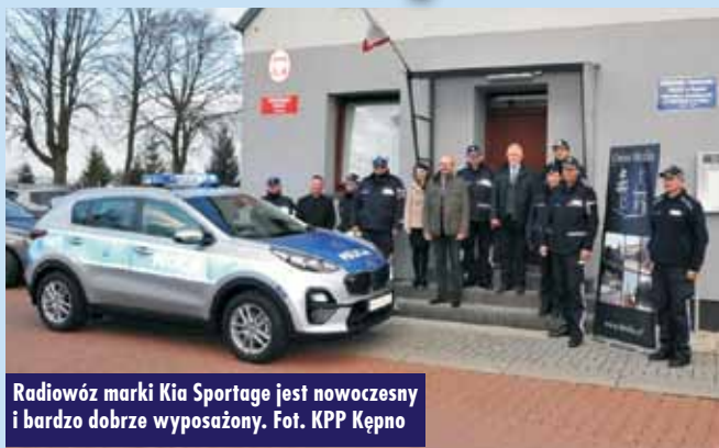
Radiowóz marki Kia Sportage jest nowoczesny i bardzo dobrze wyposażony.