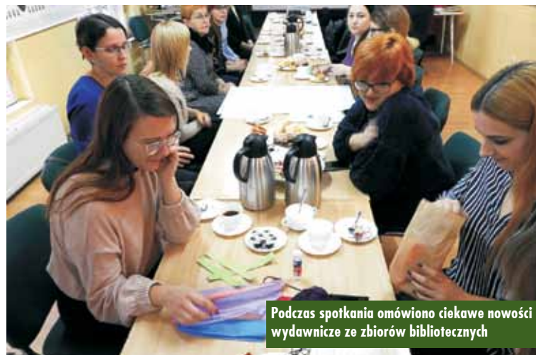
Podczas spotkania omówiono ciekawe nowości wydawnicze ze zbiorów bibliotecznych

ską, instruktorki z Działu Instrukcyjno-Metodycznego Wojewódzkiej Biblioteki Publicznej i Centrum Animacji Kultury w Poznaniu.