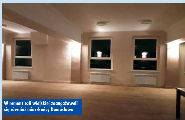
W remont sali wiejskiej zaangażowali się również mieszkańcy Domasłowa