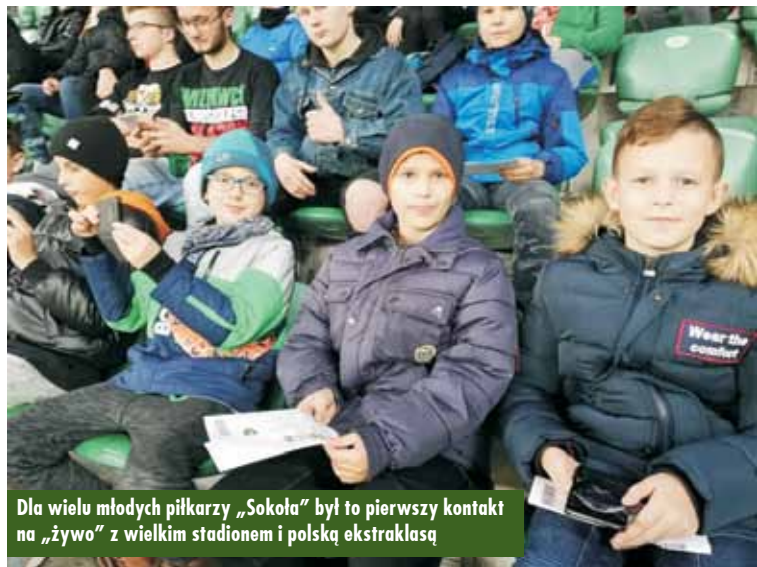
Dla wielu młodych piłkarzy „Sokoła” był to pierwszy kontakt na „żywo” z wielkim stadionem i polską ekstraklasą

lider rozgrywek po 6. kolejnych zwycięstwach. Z kolei Śląsk grał u siebie, w swojej „twierdzy”. Spotkanie zapowiadało się więc niezwykle ciekawie.