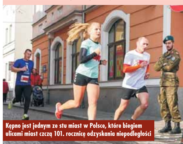
Kępno jest jednym ze stu miast w Polsce, które biegiem ulicami miast czczą 101. rocznicę odzyskania niepodległości