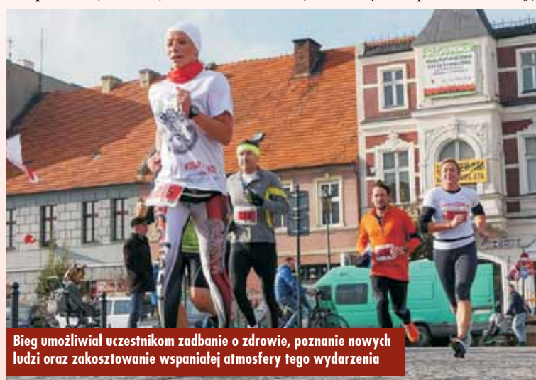
Bieg umożliwiał uczestnikom zadbanie o zdrowie, poznanie nowych ludzi oraz zakosztowanie wspaniałej atmosfery tego wydarzenia

Wszyscy zawodnicy otrzymali oryginalny zestaw upominków – unikatowy, okolicznościowy medal, koszulkę oraz plecak startowy,