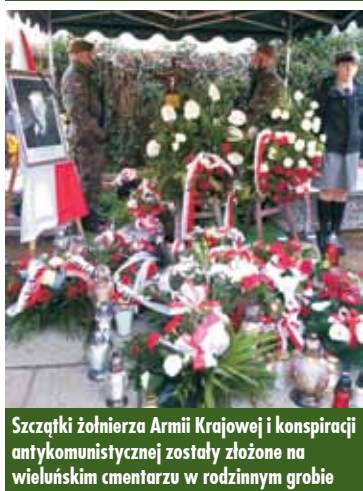
Szczątki żołnierza Armii Krajowej i konspiracji antykomunistycznej zostały złożone na wielunijskim cmentarzu w rodzinnym grobie