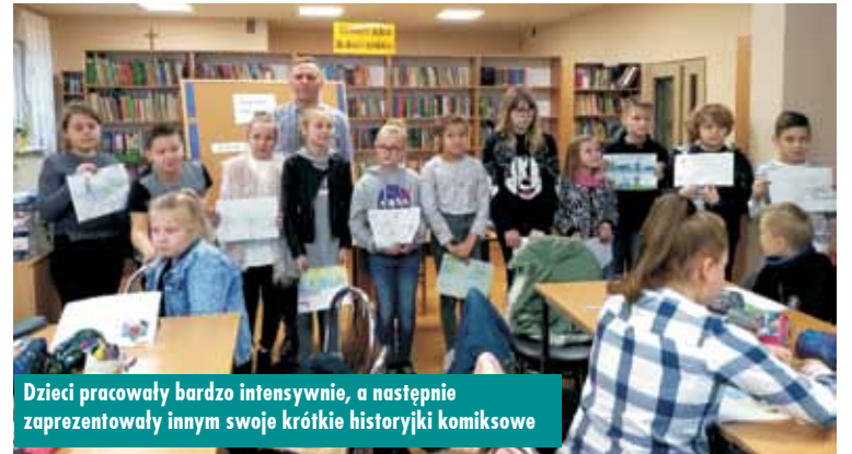
Dzieci pracowały bardzo intensywnie, a następnie zaprezentowały innym swoje krótkie historyjki komiksowe

Podczas spotkania zaproszony gość zaproponował narysowanie historyjki komiksowej rozgrywającej się w Rychtalu. Przy pomocy ołówka, kredek i długopisu młodzież próbowała w krótkim czasie stworzyć ciekawą