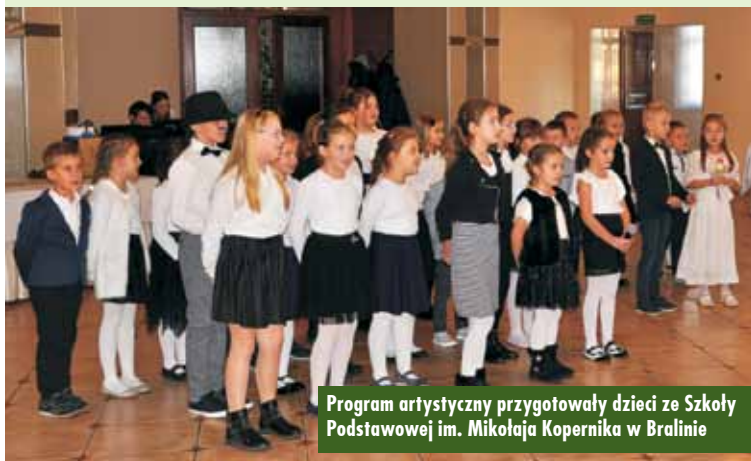
Program artystyczny przygotowały dzieci ze Szkoły Podstawowej im. Mikołaja Kopernika w Bralinie