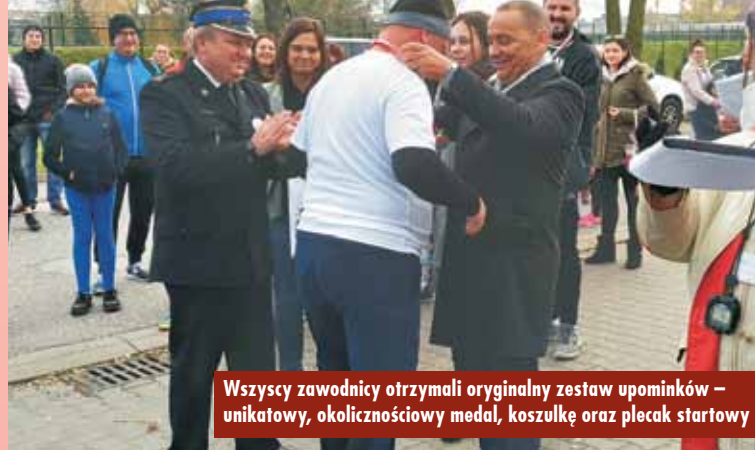
Wszyscy zawodnicy otrzymali oryginalny zestaw upominków – unikatowy, okolicznościowy medal, koszulkę oraz plecak startowy