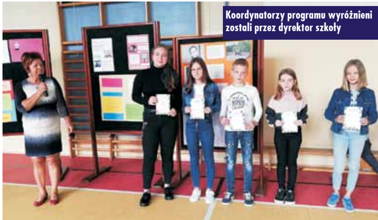
Koordinatorzy programu wyróżnieni zostali przez dyrektora szkoły

Certyfikat poświadcza, że szkoła spełnia wszystkie kryteria niezbędne do rozwoju społecznej aktywności, samorządności uczniowskiej i praktycznej edukacji obywatelskiej poprzez realizację następujących działań: wybory i kwestie formalne, komunikacja i media, działania uczniów i uczennic, podejmowanie decyzji oraz uczenie się i nauczanie.