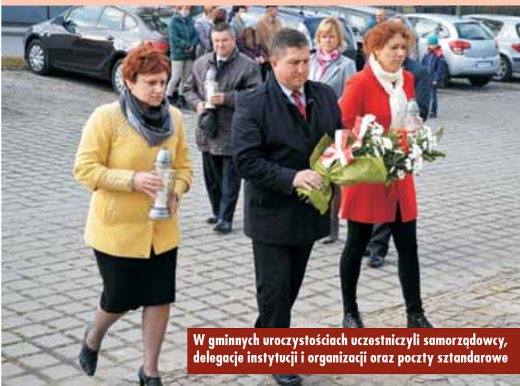
W gminnych uroczystościach uczestniczyli samorządowcy, delegacje instytucji i organizacji oraz poczty sztandarowe

7 listopada br. zorganizowany został wieczór patriotyczny.