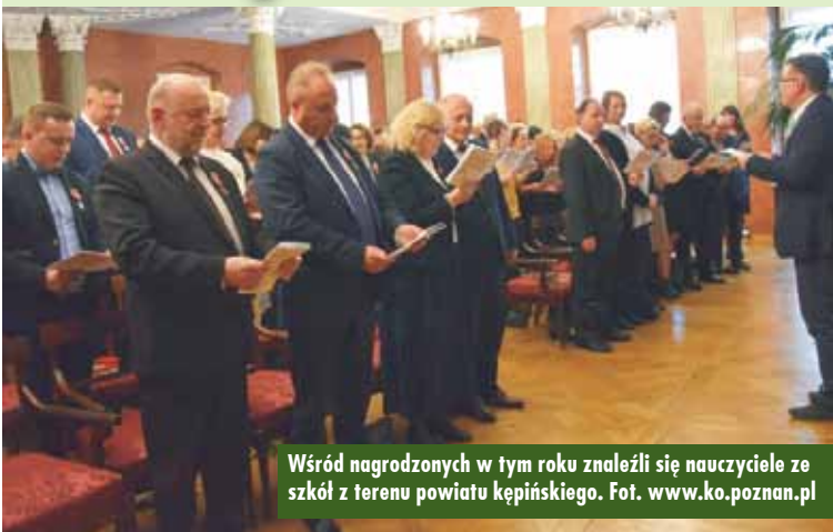
Wśród nagrodzonych w tym roku znaleźli się nauczyciele ze szkół z terenu powiatu kępińskiego.

12 listopada br. w Sali Czerwonej Pałacu Działyńskich w Poznaniu (Stary Rynek) odbyła się uroczystość wręczenia odznaczeń państwowych