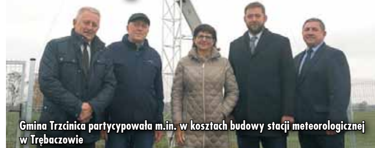
Gmina Trzcinica partycypowała m.in. w kosztach budowy stacji meteorologicznej w Trębaczowie

Gmina Trzcinica wspólnie z innymi samorządami partycypuje w finansowaniu różnorodnych zadań na terenie powiatu kępińskiego