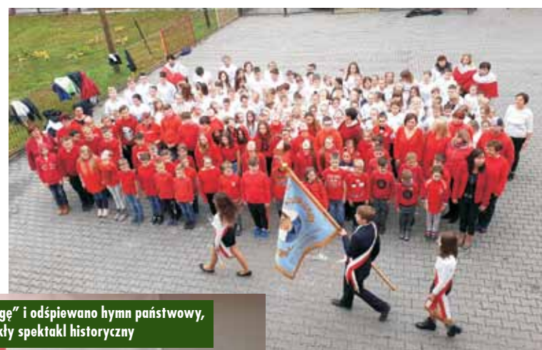
Przed budynkiem szkoły stworzono „żywą flagę” i odśpiewano hymn państwowy, a następnie uczniowie zaprezentowali niezwykle spektakl historyczny

cało Ministerstwo Edukacji Narodowej, odśpiewano hymn państwowy. Akcja ta miała na celu upamiętnienie