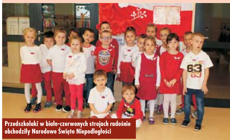
Przedszkolaki w biało-czerwonych strojach radośnie obchodziły Narodowe Święto Niepodległości