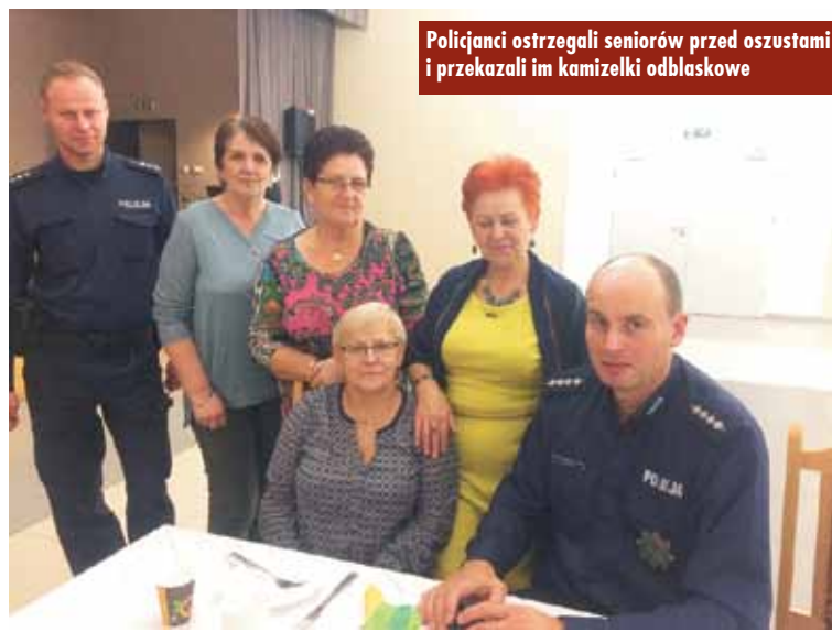
Policjanci ostrzegali seniorów przed oszustami i przekazali im kamizelki odblaskowe

czeństwo seniorów przekazali wiele cennych informacji. Opowiedzieli jak radzić sobie z oszustwami, wyłudzać pieniądze metodą na tzw. wnuczka. Ostrzegali seniorów przed prawdziwą plagą tego typu oszustw