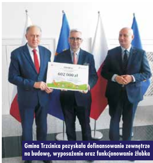
Gmina Trzcinica pozyskała dofinansowanie zewnętrzne na budowę, wyposażenie oraz funkcjonowanie żłobka

W październiku zakończyła się realizacja zadania „Zagospodarowanie przestrzeni publicznej w miejscowości Pomiany”, którego realizacja dofinansowana została w ramach konkursu „Pięknieje wielkopolska wieś”