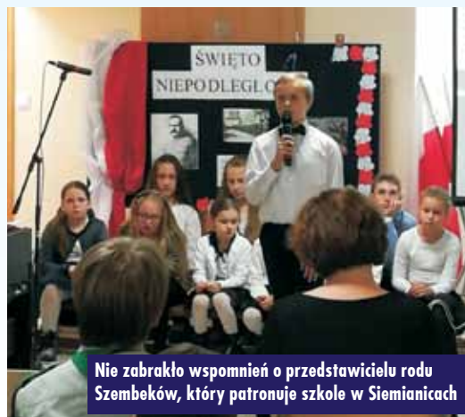
Nie zabrakło wspomnień o przedstawicielu rodu Szembeków, który patronuje szkole w Siemianicach