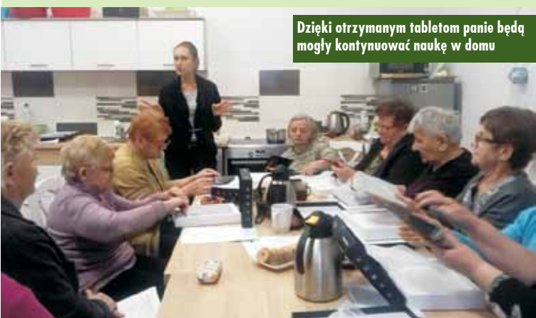
Dzięki otrzymanym tabletom panie będą mogły kontynuować naukę w domu

Dla większości osób starszych szkolenie jest jedyną okazją kontaktu z komputerem. Panie z Dziennego Domu Seniora nie kryły zadowolenia: - Pierwszy raz pracowałam na kom-