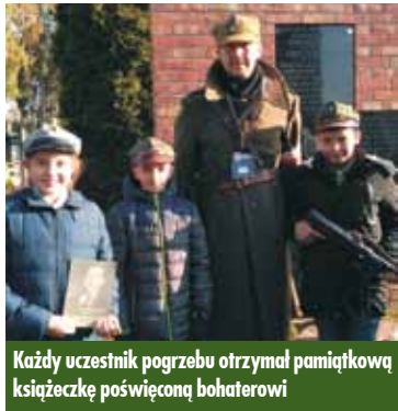
Każdy uczestnik pogrzebu otrzymał pamiątkową książeczkę poświęconą bohaterowi