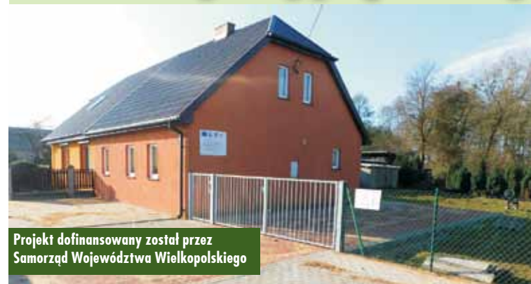
Projekt dofinansowany został przez Samorząd Województwa Wielkopolskiego

W październiku zakończyła się realizacja zadania „Zagospodarowanie przestrzeni publicznej w miejscowości Pomiany”, którego realizacja dofinansowana została w ramach konkursu „Pięknieje wielkopolska wieś”