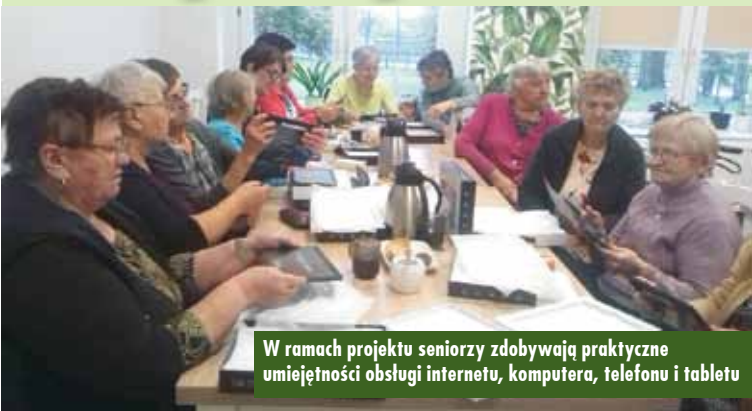
W ramach projektu seniorzy zdobywają praktyczne umiejętności obsługi internetu, komputera, telefonu i tablety

13 pań z Dziennego Domu Seniora w Domasławie bierze udział w bezpłatnych zajęciach komputerowych dla seniorów 65+. Zgodnie z założeniami projektowymi za uczestnictwo w projekcie z 60% frekwencją seniorki otrzymały darmowe tablety, na których będą kontynuować naukę w domu.