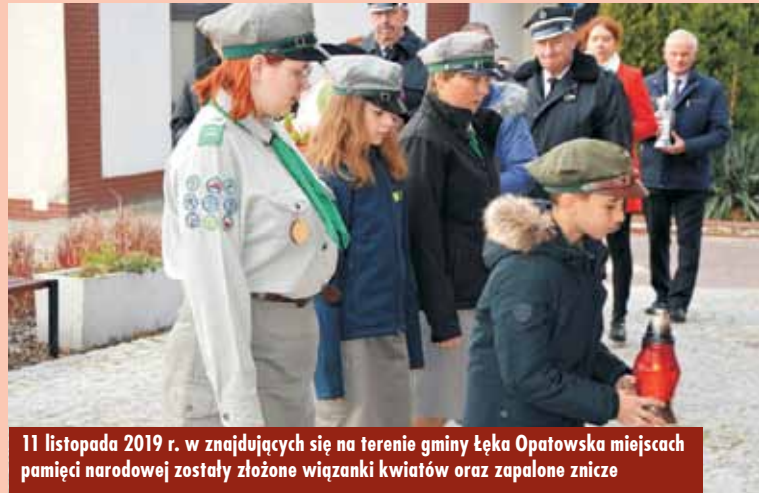
11 listopada 2019 r. w znajdujących się na terenie gminy Łęka Opatowska miejscach pamięci narodowej zostały złożone wiązanki kwiatów oraz zapalone znicze

Kwiaty i znicze uroczystie złożono pod pomnikiem poświęconym