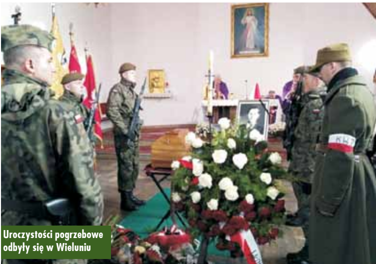
Uroczystości pogrzebowe odbyły się w Wieluniu