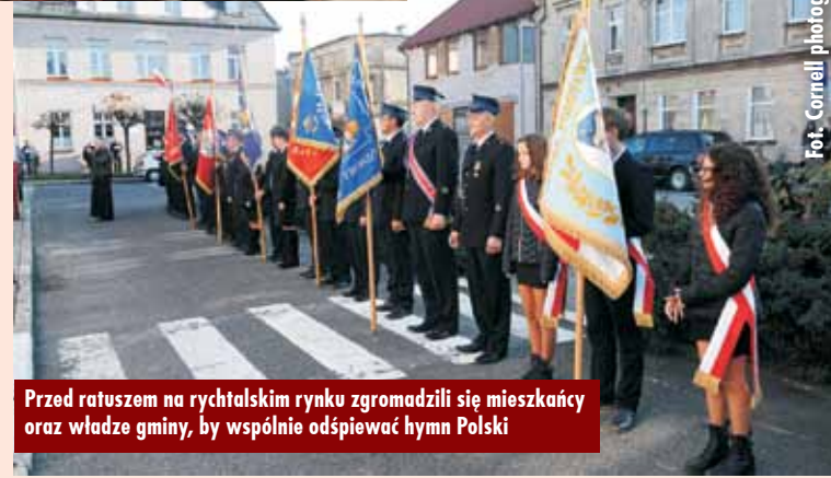
Przed ratuszem na rychtańskim rynku zgromadzili się mieszkańcy oraz władze gminy, by wspólnie odśpiewać hymn Polski

browskiego”. Niniejsza uroczystość była idealną okazją do wzniesienia po raz pierwszy nowej flagi gminy Rychtal, której wzór radni uchwalili podczas sesji Rady Gminy Rychtal 25 października br. Przybyli pod budynek urzędu gminy mieszkańcy wspólnie z radnymi, sołtysami, dyrektorami i kierownikami jednostek organizacyjnych gminy oraz przedstawicielami jednostek ochotniczych straży pożarnych z terenu gminy Rychtal śpiewali pieśni patriotyczne, celem uczczenia tak ważnego dla polskiego narodu święta. Zgromadze-