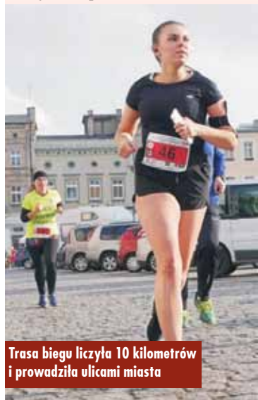
Trasa biegu liczyła 10 kilometrów i prowadziła ulicami miasta

11 listopada br., w ramach obchodów jubileuszowych Narodowego Święta Niepodległości, odbył się Narodowy Bieg 100-lecia Odzyskania Przez Polskę Niepodległości od Bałtyku do Tatr – VI Bieg Uliczny św. Marcina o Puchar Burmistrza Miasta i Gminy Kępno oraz Bieg Służb Mundurowych. Organizatorem wydarzenia była tradycyjnie Spółka „Projekt Kępno”.