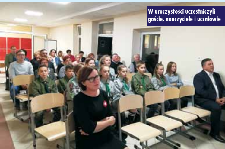
W uroczystości uczestniczyli goście, nauczyciele i uczniowie

Jak powiedział na zakończenie wójt, piękno śpiewu dzieci, które tu usłyszał, przywołało w jego sercu wspomnienie śpiewu dzieci pod