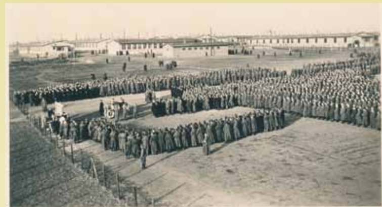
Misa polowa

Spółeczność woldenberska, składająca się z oficerów kadry zawodowej oraz rezerwistów, w zdecydowanej większości pochodzenia mieszczańskiego i inteligenckiego, okazała się zbiorowością niebywale pomysłową i twórczą. Pomimo zróżnicowania kulturowego, wyznaniowego i światopoglądowego, które niejednokrotnie przyczyniało się do wewnętrznych sporów i napięć, jednoczyła się na rzecz wspólnej walki z okupantem.