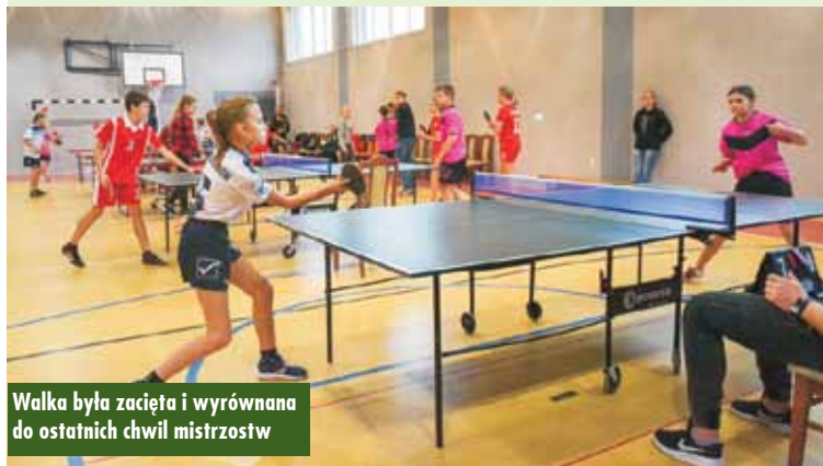
Walka była zacięta i wyrównana do ostatnich chwil mistrzostw