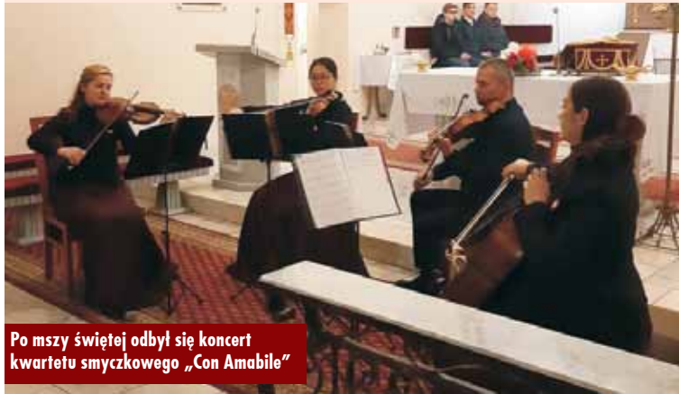
Po mszy świętej odbył się koncert kwartetu smyczkowego „Con Amabile”

browskiego”. Niniejsza uroczystość była idealną okazją do wzniesienia po raz pierwszy nowej flagi gminy Rychtal, której wzór radni uchwalili podczas sesji Rady Gminy Rychtal 25 października br. Przybyli pod budynek urzędu gminy mieszkańcy wspólnie z radnymi, sołtysami, dyrektorami i kierownikami jednostek organizacyjnych gminy oraz przedstawicielami jednostek ochotniczych straży pożarnych z terenu gminy Rychtal śpiewali pieśni patriotyczne, celem uczczenia tak ważnego dla polskiego narodu święta. Zgromadze-