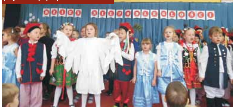
Przedszkolaki wystąpiły w patriotycznym programie artystycznym