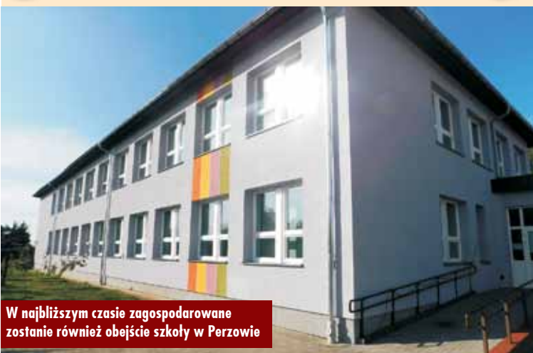
W najbliższym czasie zagospodarowane zostanie również obejście szkoły w Perzowie

Zakończyły się prace związane z termomodernizacją Zespołu Szkół w Perzowie. Zakres robót obejmował wymianę stolarki okiennej i drzwiowej, ocieplenie ścian zewnętrznych, docieplenie stropodachu oraz ocieplenie i naprawa dachu nad wejściem głównym. Wykonane zostały także nowe podjazdy i wejścia do budynku.