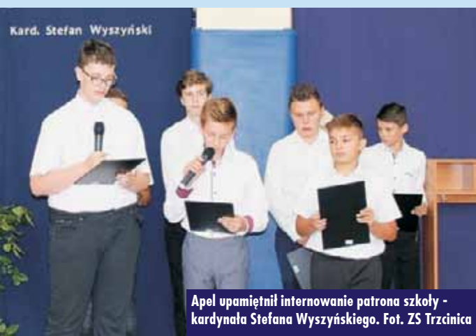
Apel upamiętnił internowanie patrona szkoły - kardynała Stefana Wyszyńskiego.

Kardynał Stefan Wyszyński jest patronem trzcinickiej szkoły od listopada 2005 r.