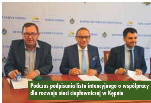
Podczas podpisania listu intencyjnego o współpracy dla rozwoju sieci ciepłowniczej w Kępnie

cieplej wody użytkowej aktualnych odbiorców, potencjał wynikający z przyłączania nowych odbiorców ciepła, realizację programów ograniczenia niskiej emisji oraz erozję rynku wynikającą z termomodernizacji i zmiany sposobu użytkowania. Analizowane będą również możliwości rozwoju istniejącego układu sieci