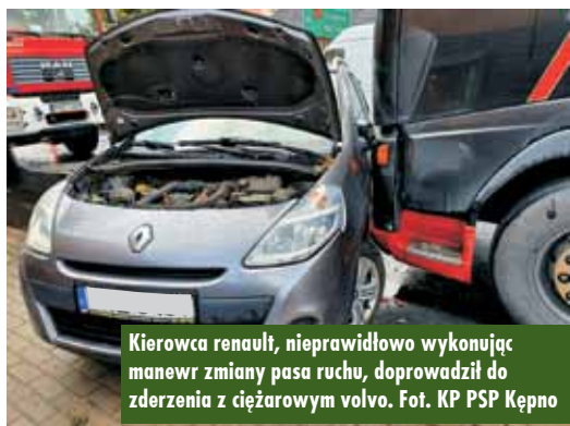
Kierowca renault, nieprawidłowo wykonując manewr zmiany pasa ruchu, doprowadził do zderzenia z ciężarowym volvo.

żadne dolegliwości. Działania strażaków polegały na zabezpieczeniu miejsca zdarzenia oraz odłączeniu zasilania w uszkodzonych pojazdach