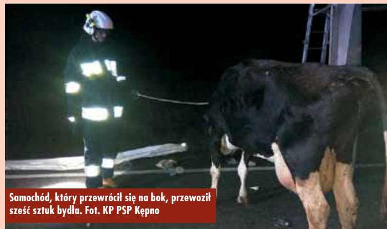
Samochód, który przewrócił się na bok, przewoził sześć sztuk bydła.

W trakcie działań firma zajmująca się utrzymaniem przejazdu kolejowego naprawiała uszkodzone rogatki.