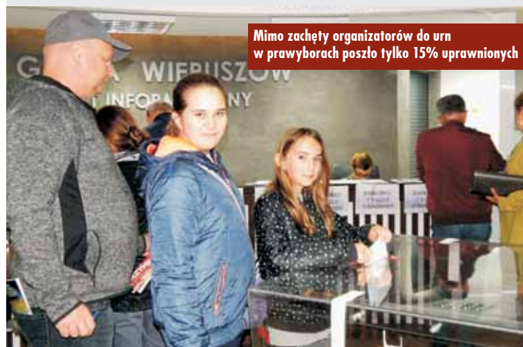
Mimo zachęty organizatorów do urn w prawyborach poszło tylko 15% uprawnionych