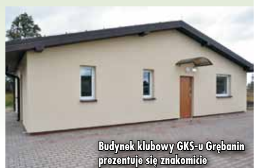
Budynek klubowy GKS-u Grębanin prezentuje się znakomicie