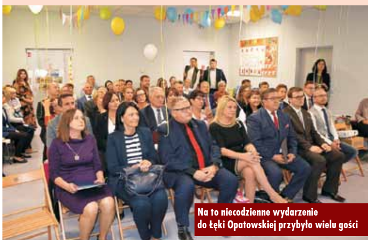
Na to niecodzienne wydarzenie do Łęki Opatowskiej przybyło wielu gości

16 miejsc dla dzieci w żłobku w Łęce Opatowskiej została uzyskana w ramach resortowego programu rozwoju instytucji opieki nad dziećmi w wieku do lat 3 „MALUCH+” edycja 2019. Kolejne 322.708,45 zł na realizację projektu pn „Inwestycja w przedszkolaków - utworzenie nowego oddziału przedszkolnego oraz realizacja zajęć wyrównujących szanse edukacyjne w gminie Łęka Opatowska” Gmina uzyskała w ramach Wielkopolskiego Regionalnego Programu Operacyjnego na lata 2014-2020, współfinansowanego ze środków Europejskiego Funduszu Społecznego. Środki w wysokości 306.467,75 zł na realizację projektu pn. „Nowy żłobek w gminie Łęka Opatowska szansą dla rodziców” pozyskano również w ramach Wielkopolskiego Regionalnego Programu Operacyjnego na lata 2014-2020. Projekt ten obejmuje dofinansowanie wyposażenia oraz bieżącej działalności żłobka przez 12 miesięcy.