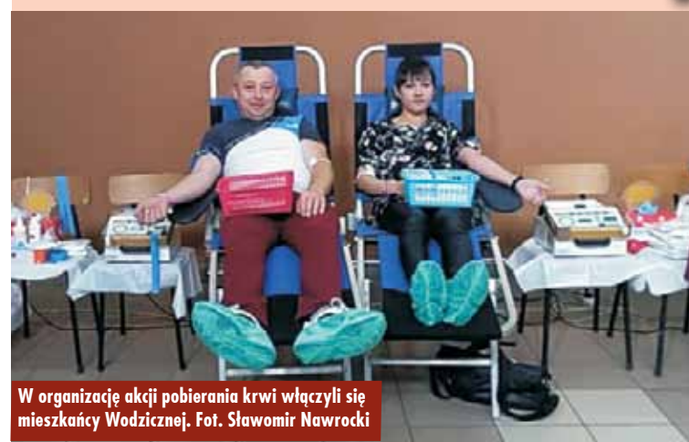
W organizację akcji pobierania krwi włączyli się mieszkańcy Wodźnicznej.

Akcja pobierania krwi zorganizowana została przez Regionalne Centrum Krwiodawstwa i Krwiolecznictwa w Kaliszu – Terenowy Oddział w Ostrzeszowie. Tego dnia krew oddało 48 osób.