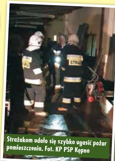
Strażakom udało się szybko ugasić pożar pomieszczenia.

Pożar samochodu osobowego na Osiedlu 600-lecia w Rychtalu