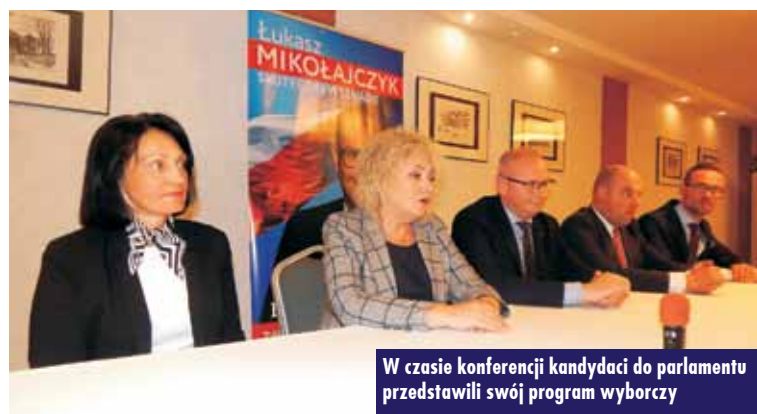
W czasie konferencji kandydaci do parlamentu przedstawili swój program wyborczy

Z głębokim żalem i smutkiem przyjeliśmy wiadomość o nagłej śmierci