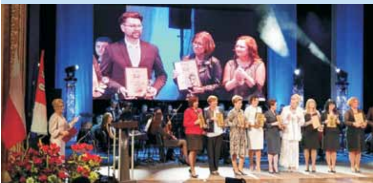
Nagrody finansowe oraz dyplomy i pamiątkowe statuetki najlepszym wielkopolskim szkołom i nauczycielom wręczono podczas gali zorganizowanej w Teatrze Wielkim im. Stanisława Moniuszki w Poznaniu