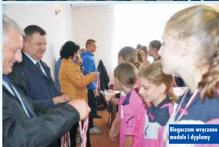
Biegaczom wręczono medale i dyplomy