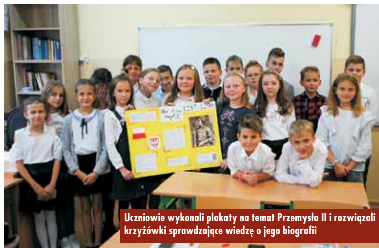
Uczniowie wykonali plakaty na temat Przemysła II i rozwiązyli krzyżówki sprawdzające wiedzę o jego biografii

Tego dnia odbyły się także wybory do Samorządu Uczniowskiego