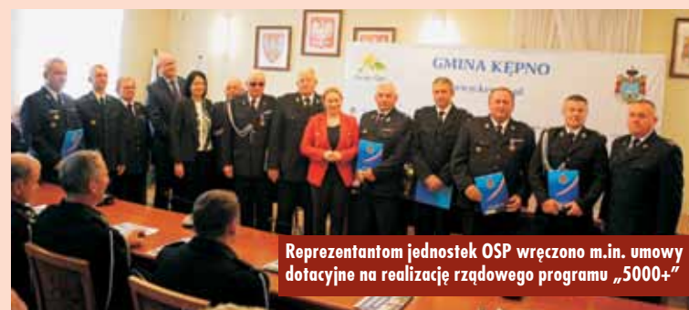
Reprezentantom jednostek OSP wręczono m.in. umowy dotacyjne na realizację rządowego programu „5000+”

W imieniu strażaków Gminy Kępno za przyznane środki podziękował komendant miejsko-gminny Związku Ochotniczych Straży Pożarnych Rze-