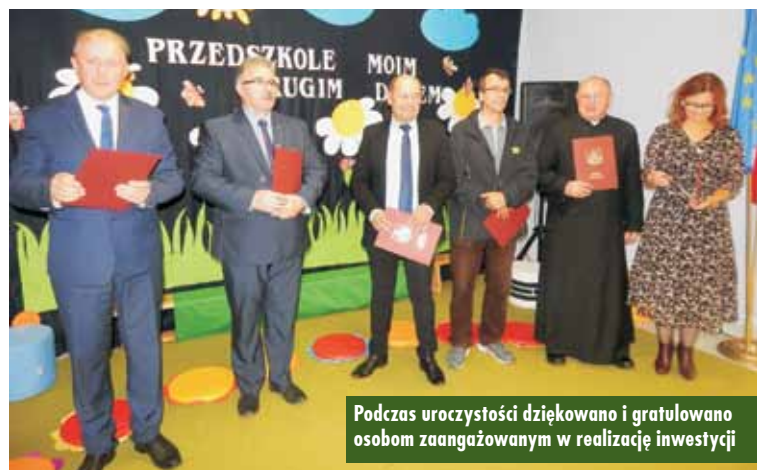
Podczas uroczystości dziękowano i gratulowano osobom zaangażowanym w realizację inwestycji

Podczas uroczystości podkreślano, jak ważną i oczekiwaną inwestycją była przebudowa z rozbudową obiektu przedszkola, na którą dzięki wytyżonym staraniom udało się pozyskać dofinansowanie zewnętrzne. Na powierzchni 467,78 metrów kwadratowych znalazły się 2 sale dydaktyczne, każda z własną łazienką i własnym pomieszczeniem na pomoce dydaktyczne oraz zabawki. W obiekcie znajduje się kuchnia wraz z magazynami oraz pomieszczeniami pomocniczymi. Kolejne pomieszczenie to jadalnia wraz z holem i system drzwí rozsuwanych, umożliwiając stworzenie dużej powierzchni na spotkania integracyjne. W części przebudowanej umieszczono pokoje