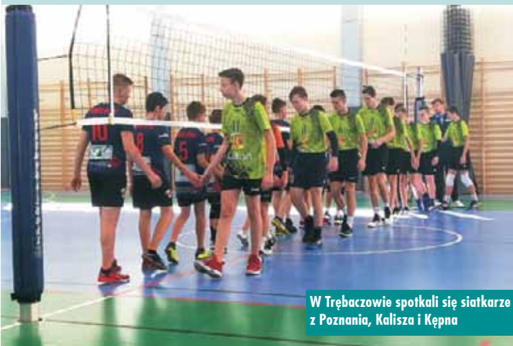
W Trębaczowie spotkali się siatkarze z Poznania, Kalisza i Kępna