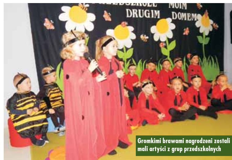
Gromkimi brawami nagrodzeni zostali mali artyści z grup przedszkolnych

29 września 2019 roku w sali Domu Ludowego w Wodźnicznej odbyła się akcja pobierania krwi