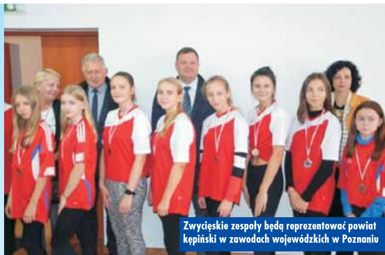
Zwycięskie zespoły będą reprezentować powiat kępiński w zawodach wojewódzkich w Poznaniu